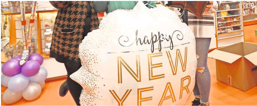
Gehen Sie mit guten Vorsätzen in das Jahr 2024?

Peine. Alle Jahre wieder: Am Silvestertag setzen sich viele Menschen ambitionierte Ziele. Mehr Sport treiben, Geld sparen, gesünder essen – die Liste ist oft lang und gleicht sich jedes Jahr aufs Neue. Der Januar entwickelt sich dann für viele zu einer echten Herausforderung, wenn die gefassten Vorsätze umgesetzt werden sollen. In den ersten Wochen des Jahres kämpfen viele von uns hartnäckig gegen überflüssige Pfunde, wollen das Rauchen aufgeben oder weniger Fast Food verzehren. Schließlich könnte mit dem neuen Jahr auch direkt ein neuer Lebensabschnitt beginnen, in dem wir uns vielleicht gesünder ernähren, mit dem Fahrrad zur Arbeit fahren, weniger Alkohol trinken oder auf das Fluchen verzichten. Doch bei den meisten Menschen