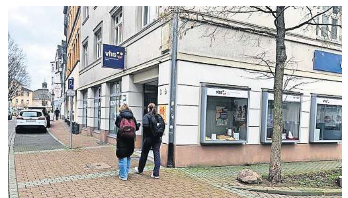
KVHS: In Hohenhameln gibt es neue Angebote.