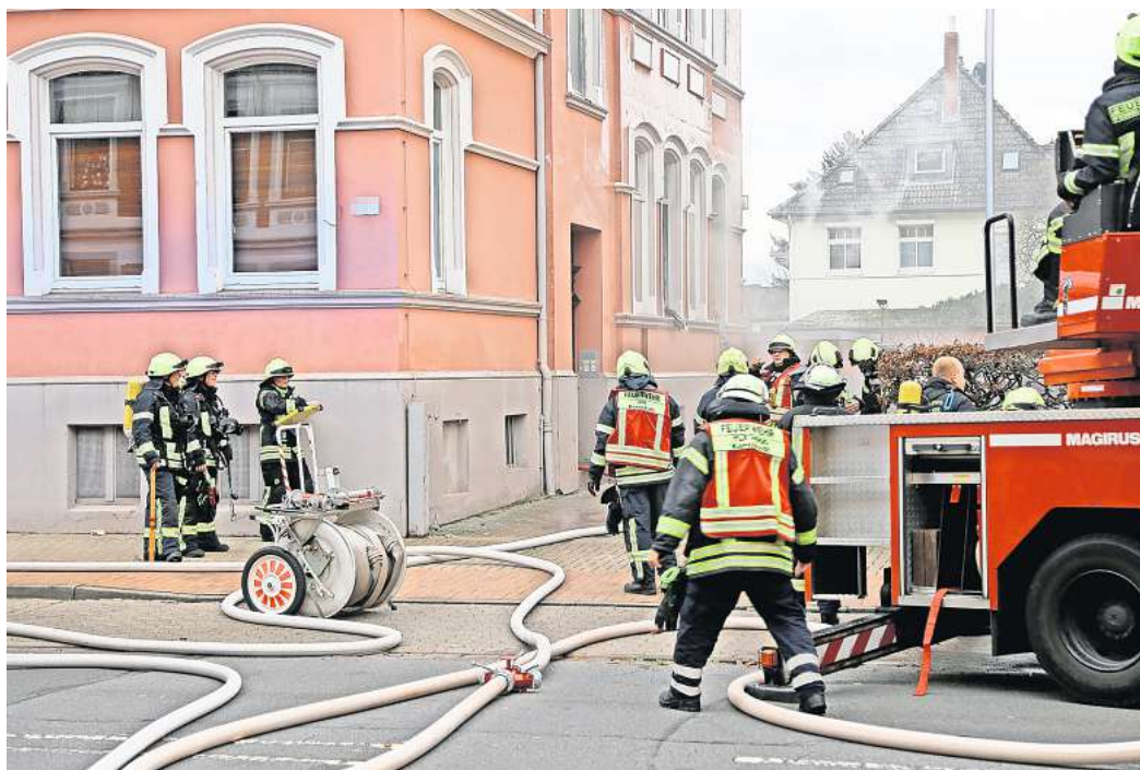
Im Erdgeschoss des Wohnhauses an der Kantstraße brannte eine Wohnung.

Zwischenzeitlich konnte eine Person aus der Brandwohnung selbstständig ins Freie gelangen. Eine zweite Person wurde von der Feuerwehr aus einer Wohnung im dritten Obergeschoss über das Treppenhaus nach draußen gebracht. Beide Verletzten wurden vorsorglich ins Klinikum Peine gebracht. Gegen 13.50 Uhr meldete Stadtbrandmeister Czynnik, dass das Feuer gelöscht sei. Zur Brandursache konnte er keine Angaben machen. Insgesamt waren 44 Feuerwehrleute im Einsatz, darunter 22 Atemschutzgeräteträger. Drei Rettungswagen waren vor Ort, einer ist immer zum Selbstschutz der Feuerwehr dabei. Während des Einsatzes sperrte die Polizei die Kantstraße in beiden Richtungen.