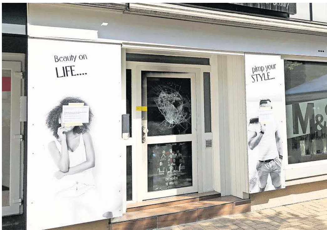
Die Eingangstür war versiegelt, das Glas der Tür zersplittert: Im Friseur-Geschäft an der Schützenstraße in Peine hatte es im April 2022 gebrannt.

Weitere Fortsetzungstermine sollen am 22. Januar ab 13 Uhr sowie am 29. Januar und 12. Februar ab 9 Uhr im Landgericht Hildesheim stattfinden.