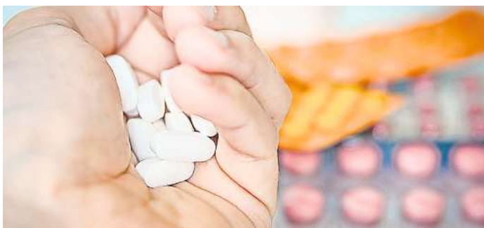
Das E-Rezept für Medikamente ist seit dem 1. Januar für Arztpraxen verpflichtend.