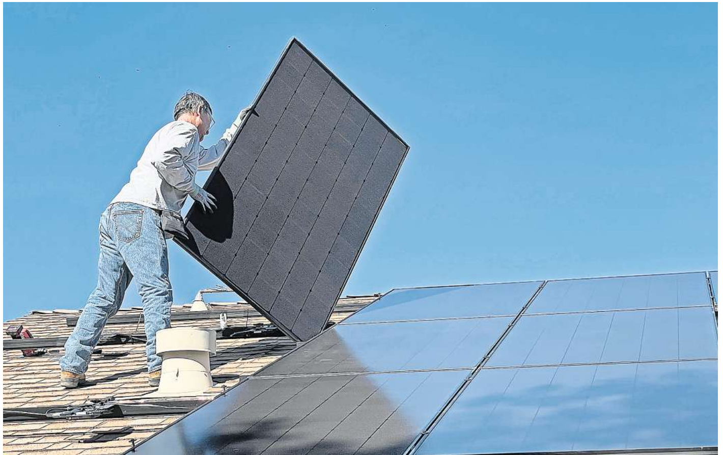
Robert Habeck will deutsche Solarhersteller mit einer Art „Resilienzbonus“ gegenüber der China-Konkurrenz stärken.

Das „Solarpaket I“, mit dem die Bundesregierung den Ausbau der Kapazitäten für Sonnenstrom beschleunigen will, hätte ursprünglich bereits zum