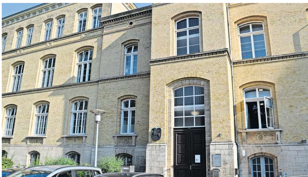
Weil er ausgewiesen werden sollte und keine Arbeitserlaubnis erhielt, hat ein 50-jähriger Mann aus Peine gegen den Landkreis Peine geklagt. Das Verwaltungsgericht Braunschweig (Bild) hat nun ein Urteil gefällt.

Bisher habe der Mann nicht glaubhaft dargelegt, dass er beim türkischen Generalkonsulat tatsächlich einen Antrag auf Wiedereinbürgerung gestellt habe. Eine Wiedereinbürgerung in die Türkei sei zumutbar. Nach Auffassung der Kammer bestehen keine hinreichenden Anhaltspunkte dafür, dass dem Kläger aufgrund seiner mittlerweile 20 Jahre zurückliegenden exilpolitischen Tätigkeiten bei einer Rückkehr in die Türkei zur Absolvierung des Wehrdienstes politische Verfolgung und Inhaftierung drohen. Auch einen Anspruch auf eine Beschäftigungserlaubnis habe der Mann nicht. Das Urteil ist noch nicht rechtskräftig.