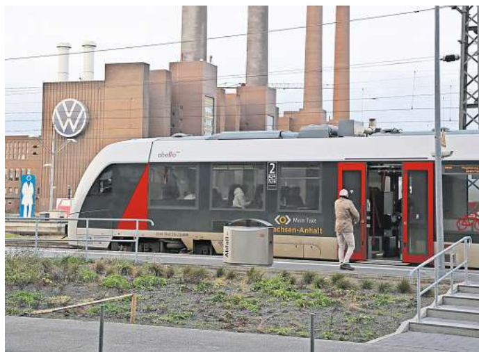
Ärger mit Verspätungen: Pendler führen inzwischen Buch über Probleme beim Abellio. Auch andere Zugverbindungen in der Region sind auffällig.