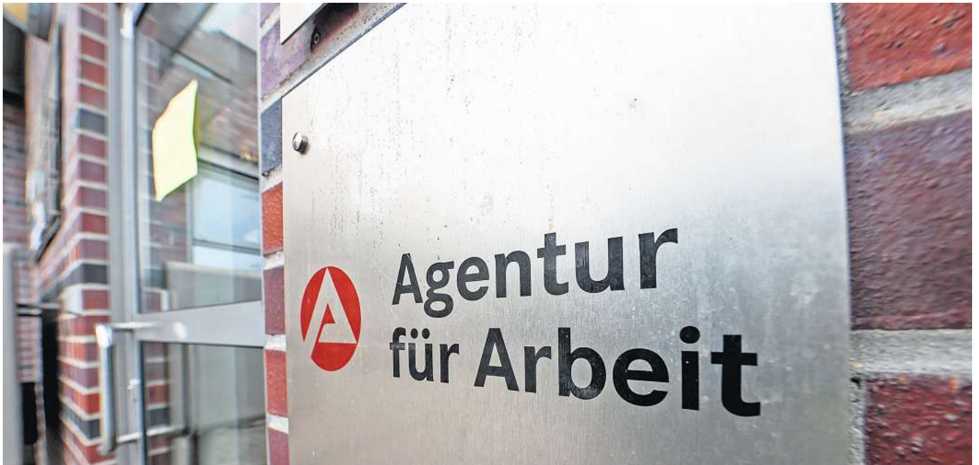
Arbeitsmarktbericht: Die Arbeitslosenzahlen waren in Gifhorn, Wolfsburg und Peine zum Jahresende konstant.