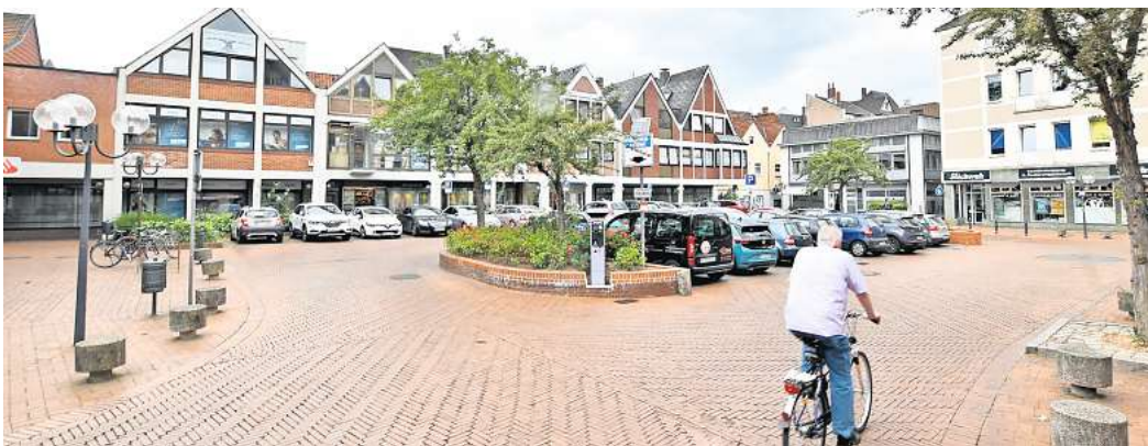
Für die Umgestaltung am Echternplatz werden auch Straßenausbaubeiträge erhoben.

Seit Neujahr 2023 werden Straßenausbaubeiträge in keiner Gemeinde im Landkreis Peine mehr bezogen. Eine jeweilige Gegenfinanzierung musste vorgenommen werden. Als Folge wurde die Grundsteuer in den Gemeinden erhöht. „Dadurch wird die finanzielle Belastung auf mehrere Schultern verteilt und bleibt nicht nur bei den Anwohnern hängen“, sagt Karnick. Die Abschaffung in den Gemeinden verlief dabei sehr unterschiedlich. Eine Bürgerinitiative in Ilsede formierte sich und sorgte so für eine größere Aufmerksamkeit. Am Ende stimmte auch der Rat in Ilsede für die Abschaffung. „Vielleicht fehlt im Stadtgebiet diese Bürgerinitiative, um Druck zu machen“, so Karnick.