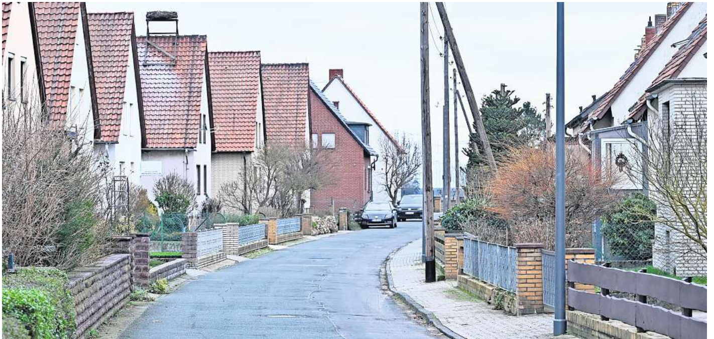
In der Wendenstraße in Schmedenstedt stehen noch mehrere alte Straßenlaternen. Diese sollen bald ausgetauscht werden. Die Anwohner müssten dann anteilig mitbezahlen.

Die Kosten und auch die Beteiligung der Anwohner ist dabei unterschiedlich. Der Grund: