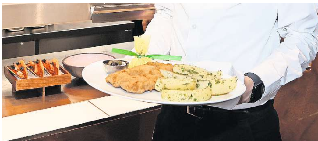
Mehrwertsteuersatz wieder bei 19 Prozent: Das Schnitzel wird in vielen Restaurants teurer.

Ist nun die Existenz der Betriebe bedroht, so wie es der Branchenverband befürchtet? Knauern die Restaurantbesucher beim Trinkgeld? Wir würden