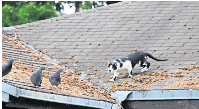
Freilaufende Katzen haben einer Studie zufolge ein sehr breites Beutespektrum.