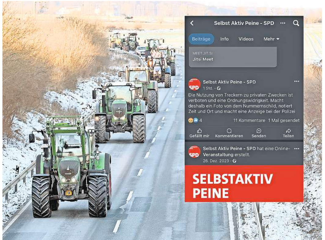
Bauernprotest: Dieser Facebook-Post der SPD sorgte für Ärger.