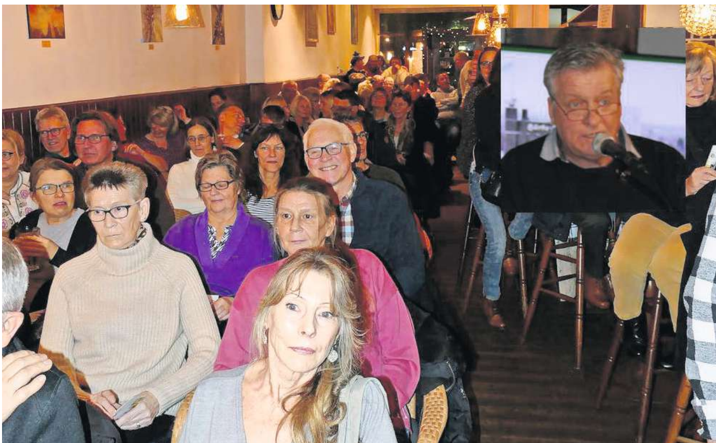
Das Thema „Härke“ zieht immer noch: Voll besetzte Zuhörer-Reihen im Mephisto in Peine.

Festzuhalten bleibt: Härke Bier war und ist weit über die Stadtgrenzen hinaus bekannt und beliebt. Die mehr als 100-jährige