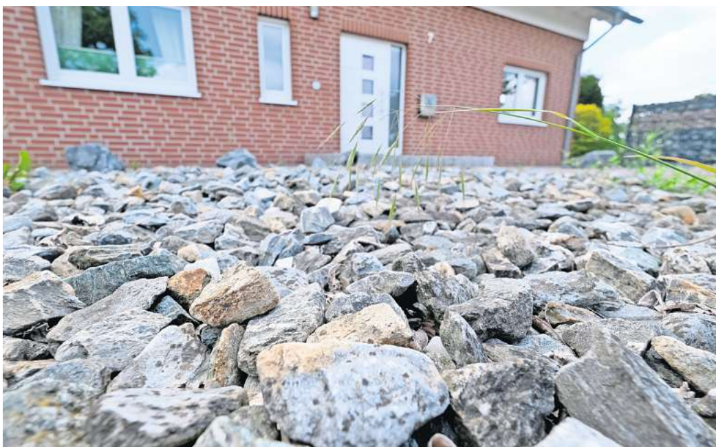
Schottergärten gibt es im Landkreis Peine viele. Nun möchte die Bio-AG Hausbesitzer bei der Umgestaltung unterstützen.

Ausgewählt wird nach der Reihenfolge der Bewerbungen. Die Voraussetzung: „Es muss ein passendes Konzept vorgelegt werden und wir schauen uns die Flächen an“, so Kuklik. Eine bloße Umwandlung in eine Rasenfläche sei nicht ausreichend. Der