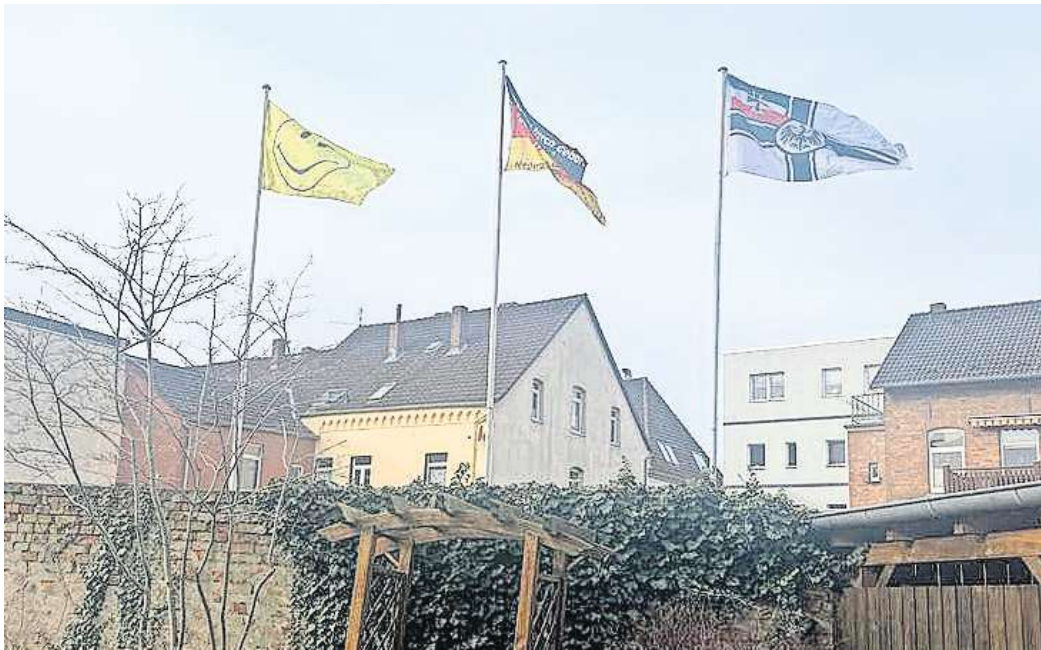
Gehisste Reichskriegsflagge in Peine.