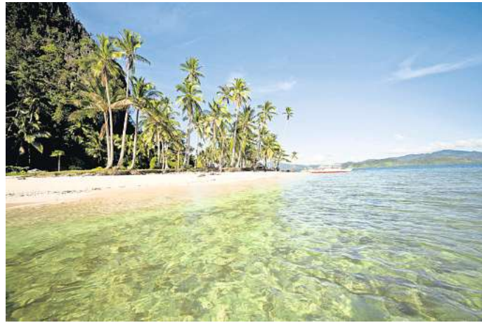
Weißer Traumstrände und kristallklares Wasser findest du auch auf den Philippinen.

Die Gili-Inseln liegen direkt vor Lombok und bestehen aus drei Inseln: Gili Meno, Gili Air und Gili Trawangan. Letztere gilt