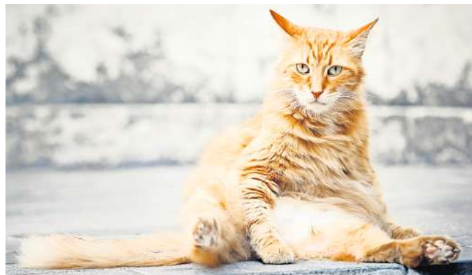
Übergewicht führt bei Katzen zu oft unterschätzten Problemen mit dem Bewegungsapparat.

Doch irgendwann bemerken wir, dass aus unserem ehemals schlanken und geschmeidigen