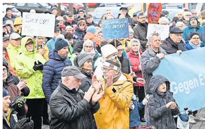
Protest gegen rechts: 450 Menschen kamen zur Kundgebung vor dem Edemisser Rathaus.