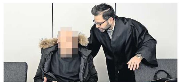
Der Angeklagte mit seinem Verteidiger beim Prozessauftakt vor dem Landgericht Hildesheim.