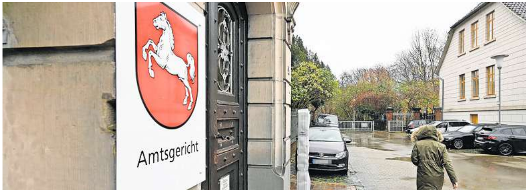
Ein Asylbewerber aus Nigeria musste sich vor dem Peiner Amtsgericht verantworten, weil er falsche Angaben gemacht hatte.

38-jähriger Asylbewerber wurde vom Amtsgericht Peine zu einer saftigen Geldstrafe verurteilt