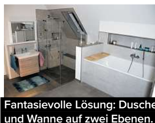
Fantasievolle Lösung: Dusche und Wanne auf zwei Ebenen.