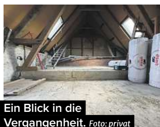
Ein Blick in die Vergangenheit.

Neugierig geworden? Informationen und Inspiration gibt es beim Aktionstag im Steigerweg 3 in Lengede!