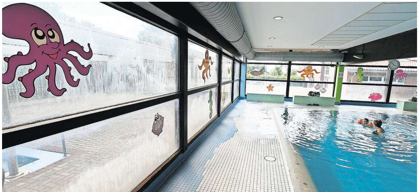
Das Hallenbad in Mehrum soll erhalten bleiben.

Über das „Für und Wider“ habe die Hohenhamelner Poli-tik anlässlich der vielen Gesprä-che und auch bei den letzten Ratswahlen immer wieder be-tont, dass sich die einzelnen Par-teien für den Erhalt und eine Sa-nierung des Hallenbades einset-zen werden. Daher bitte man