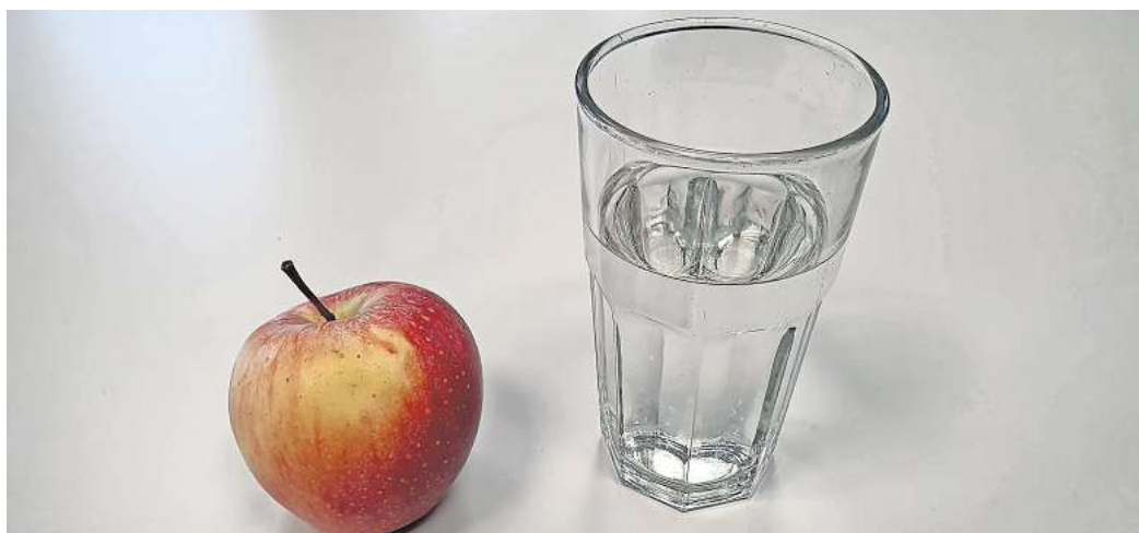
Wochenumfrage: Fasten Sie in diesem Jahr?

Wir würden gerne von Ihnen wissen, ob Sie in diesem Jahr fasten. Nehmen Sie teil an unserer