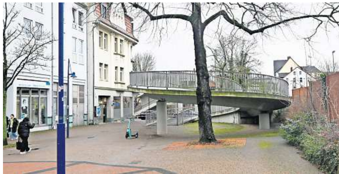
Bahnhofstraße in Peine: Hier kam es zu der Auseinandersetzung.

Um sich der Überprüfung seiner Personalien zu entziehen, bedrängte, bedrohte und schubste er die sich ihm im Weg stehenden Polizisten. Dabei zerriss der 24-Jährige einem Beamten das