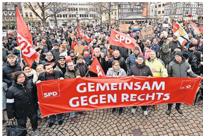
Demo in der Peiner Innenstadt: Hier gingen zahlreiche Menschen gegen Rechtsextremismus auf die Straße.

Der Peiner Grünen-Kreisverband stelle „erfreut fest, dass in