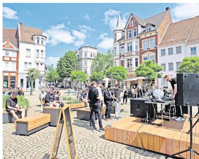
Mit neuen Sitzmöbeln und einer „Open Stage“ (rechts im Bild) wurde der historische Marktplatz aufgewertet.

die Lichtskulpturen bei der Weihnachtsstadt. Bereits umgesetzt sind ebenso die Digitalisierungsprojekte Burg, Dino-Safari und Stadtrallye (in hybrider Form). Finanziert wurde ebenso die Erweiterung der Weihnachtsbeleuchtung an den Laternen in der Fußgängerzone und in den angrenzenden Seitenstraßen sowie die LED-Kugeln in den Bäumen an der Bahnhofstraße. Zahlreiche weitere Projekte sind noch in der Planungs- oder in der Umsetzungsphase, etwa eine digitale Leerstandsbörse, Beratungsangebote für Immobilieneigentümer oder ein Relaunch der Webseite.