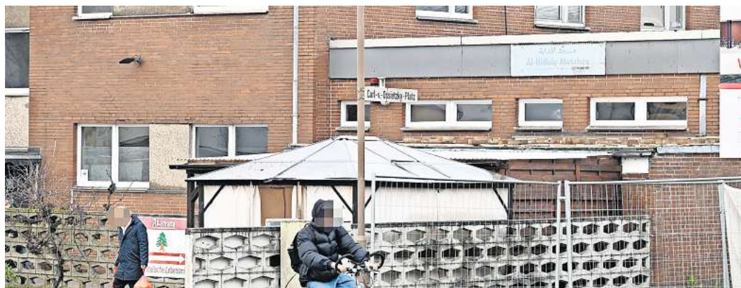
Der Tatort: An der Al-Hidaia-Moschee am Carl-von-Ossietzky-Platz wurde am 3. Februar auf den Sohn eines Peiner Imams geschossen.

Die Polizei hat daraufhin Ermittlungen wegen eines versuchten Tötungsdeliktes eingeleitet