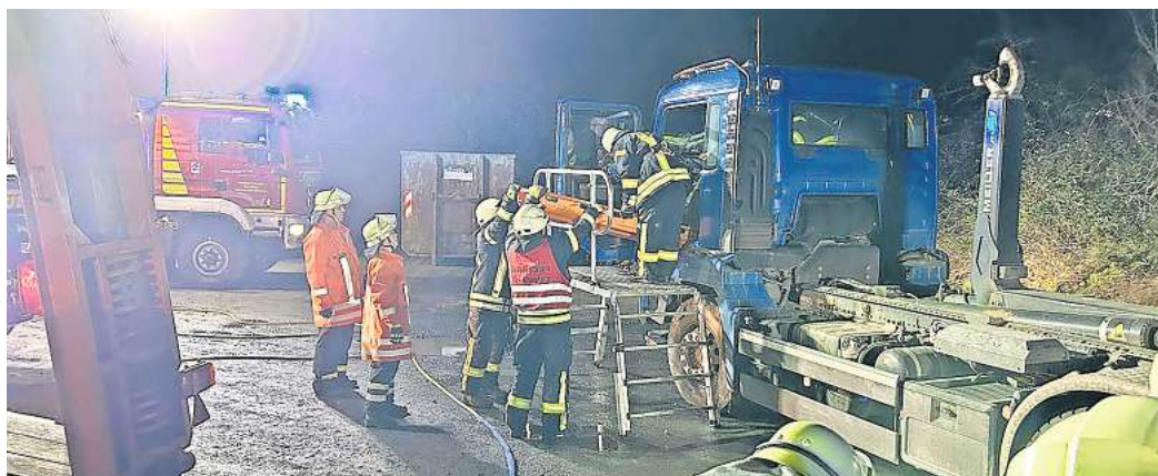
Der Lkw-Fahrer musste bei der Übung aus seinem Fahrzeug gerettet werden.

Da es sich bei dieser Lage um eine unangekündigte Alarmübung für die beiden Wehren handelte, wurde laut Selle kein Rettungsdienst alarmiert. „Die medizinische Versorgung wäre