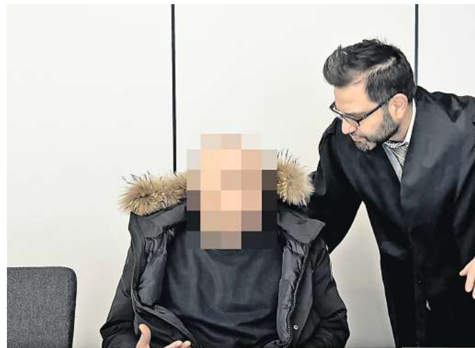
Der Angeklagte (links) mit seinem Verteidiger beim Prozessauftritt vor dem Landgericht Hildesheim.

Bei fünf Fällen ging es um Diebstähle aus Supermärkten und einem Drogeriemarkt in Peine. Meistens handelte es sich um Alkohol und andere Waren, die der Angeklagte schnell zu Geld machen konnte, um seine Drogensucht zu finanzieren. Diese Taten räumte der Angeklagte auch ein. Wegen Diebstahls mit Waffen in zwei Fällen sowie wegen Diebstahls in drei Fällen verurteilte das Gericht den Peiner zu einer Gesamtfreiheitsstrafe von einem Jahr und acht Monaten. Der Angeklagte hat allerdings Revision gegen diese Entscheidung eingelegt.