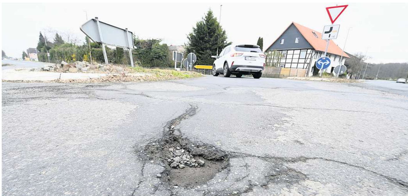
Deutliche Spuren hat der Winter auf der B1 hinterlassen: In Bettmar weisen die Straßen zahlreiche Schlaglöcher auf.

Die Kosten werden auf rund 2,4 Millionen Euro beziffert. Der Bund trägt davon rund 1,7 Millionen Euro, die Gemeinde Vechelde etwa 700.000 Euro für Gehwege und Parkplätze. Außerdem wird die Regenwas-