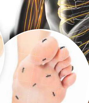
Kribbelnden Füße infolge von Nervenschmerzen?

gen und haben keine bekannten Neben- oder Wechselwirkungen. Deshalb ist das Arzneimittel auch