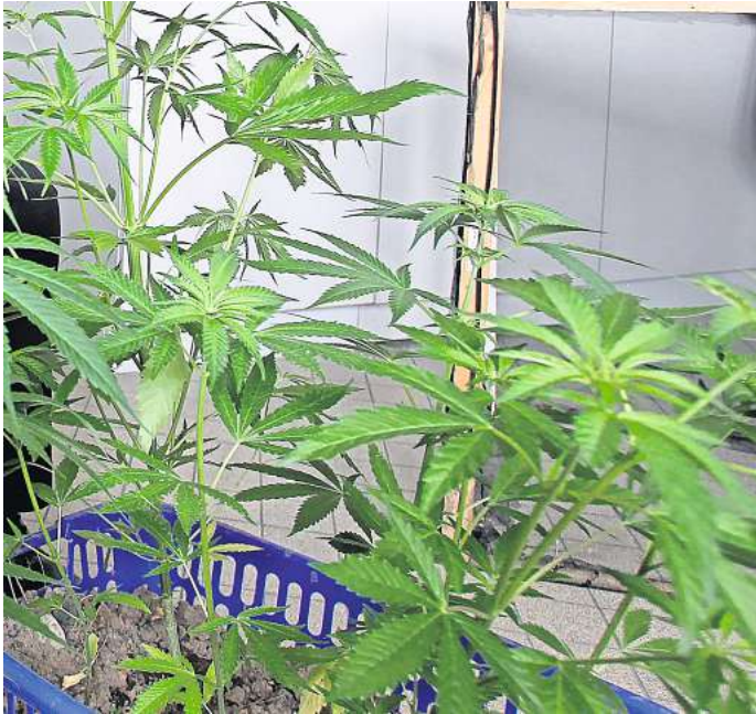
Cannabis: Seit dem 1. April sind bis zu drei solcher Pflanzen in der eigenen Wohnung erlaubt.

Online-Umfrage: Sichern Sie sich die Chance auf einen 50-Euro-Gutschein von Media-Markt