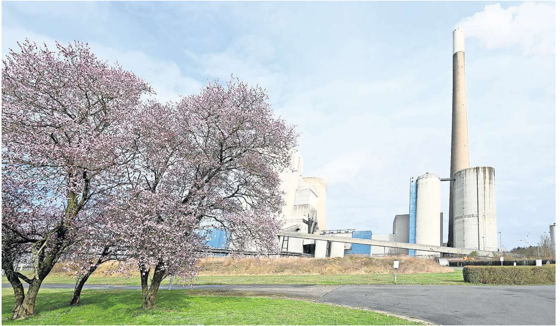
Das Kraftwerk in Mehrum ist stillgelegt. Für den Rückbau ab Oktober könnte es Probleme geben.