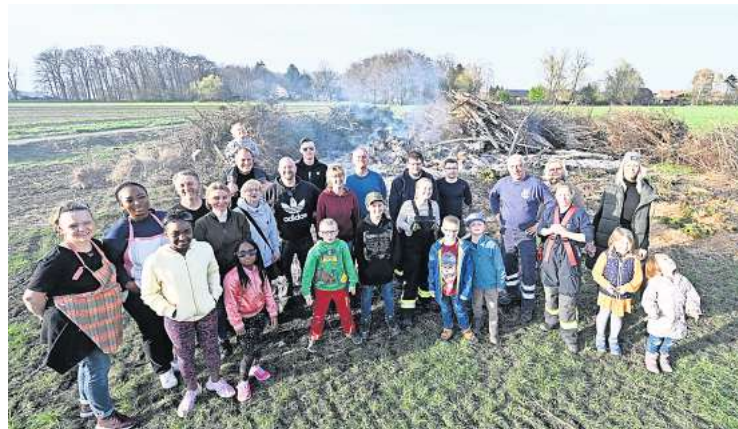
Noch vor dem vorzeitig abgebrannten Osterfeuer entwickelte die Mödesser Dorfgemeinschaft einen Plan für die „Neuaufgabe“.

Um 22.06 Uhr wurden die Freiwilligen Feuerwehren Edemissen und Mödesse alarmiert und zum Einsatz am Osterfeuerplatz in Mödesse gerufen. Als sie dort eintrafen, habe das angehäufte Strauchwerk bereits in nahezu voller Ausdehnung gebrannt und habe nicht mehr vor dem vollständigen Abbrennen bewahrt werden können. Die Feuerwehren entschieden sich in Abstimmung mit der Polizei daher dafür, dass Feuer kontrolliert herunterbrennen zu lassen.