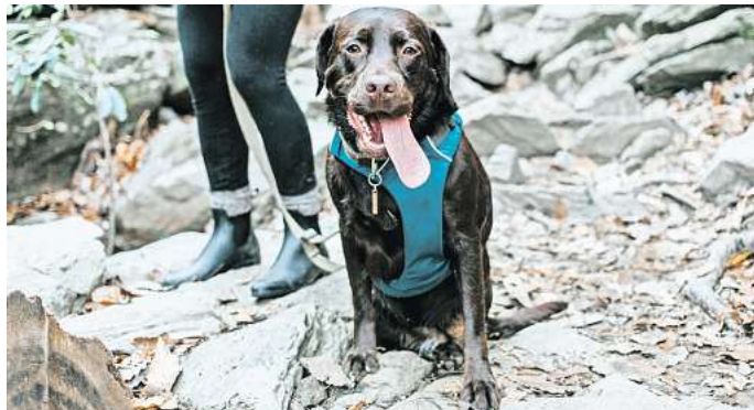
Abwechslungsreiche Tage zu Hause.