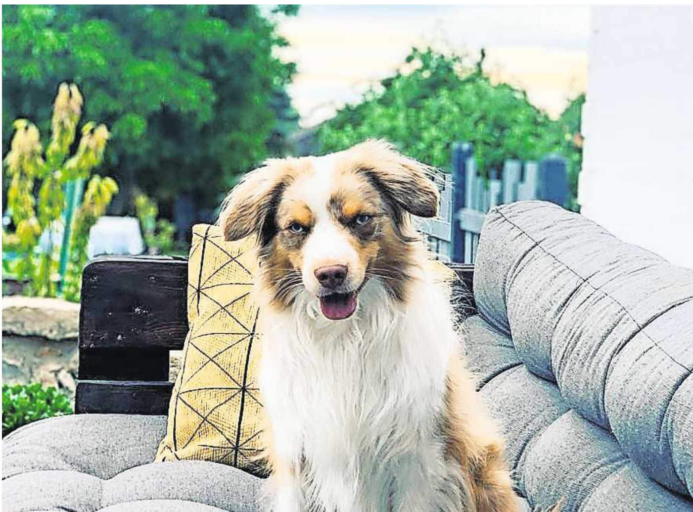
Australien Shepherd Ben wurde von einem Auto erfasst und so schwer verletzt, dass er eingeschläfert werden musste.