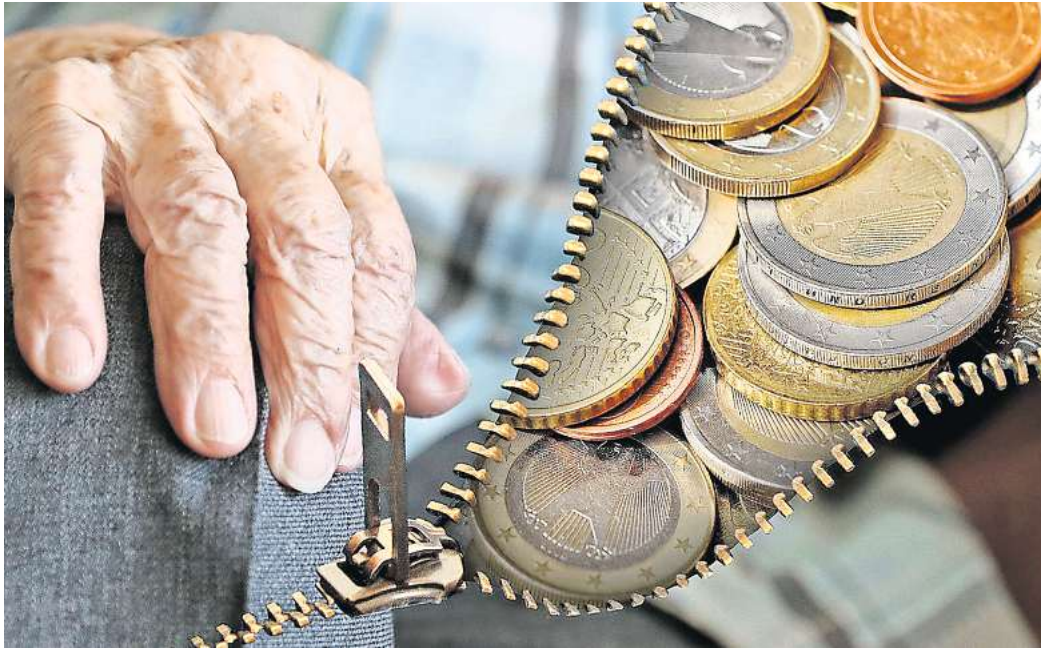
Mehr Geld bleibt übrig: Zwei gesetzliche Neuregelungen bringen steuerliche Entlastungen.

Der steigt ab 2023 nun langsamer als einmal geplant, womit sich die Vollbesteuerung von Renten um 18 Jahre nach hinten verschiebt. Ursprünglich sollte der steuerpflichtige Rentenanteil jährlich um einen Prozentpunkt wachsen. Damit wäre nach alter Regelung bei Renteneintritt ab 2040 die gesamte Rente steuerpflichtig geworden. Nun steigt der steuerpflichtige Anteil nur um einen halben Prozentpunkt pro Jahr. Das Ganze gilt rückwirkend schon für 2023. Wer voriges Jahr Rentner geworden ist und dieses Jahr eine Steuererklärung für Rentner einreichen muss, braucht damit nur noch 82,5 statt 83,0 Prozent seiner Rente auf eine eventuelle Steuerpflicht anrechnen. Bei Neurentnern dieses Jahres sind es 83,0 statt 84,0 Prozent. Erst mit einem