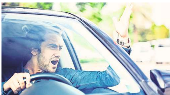
Wüste Beschimpfungen oder beleidigende Gesten können teuer werden: Das Zeigen des Mittelfingers kann zum Beispiel 4000 Euro kosten.

Auch wenn nicht konkret festgelegt ist, wie hoch die Strafen für bestimmte Schimpfwörter sind, existieren einige Gerichtsurteile, die als Orientierung dienen kön-