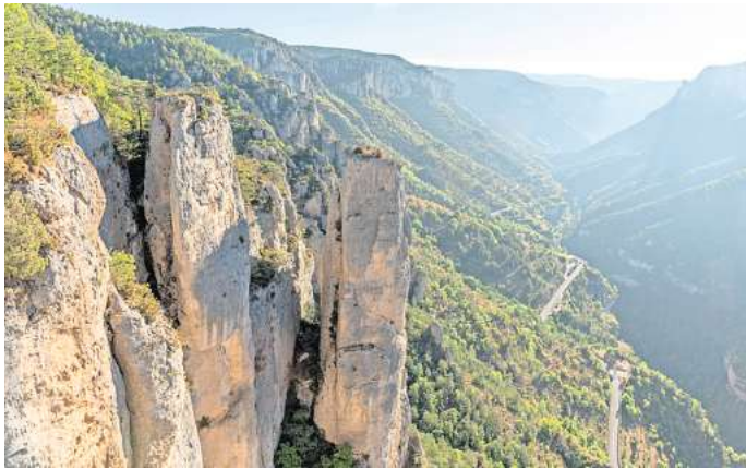
Landschaft eines wilden und geschützten Tals im Nationalpark Cevennen.

Mehr als 20.000 Pflanzenarten kommen in den Cevennen vor und mediterrane und mittelgebirgstypische Flora wechseln sich ab. Die immergrüne Steineiche ist hier ebenso beheimatet wie Nadelhölzer und die Esskastanie. Ab Mai verwandelt sich die Region vielerorts in einen blühenden Garten, in dem auch Orchideen blühen. Auf den Kalkebenen wachsen Thymian, Lavendel, Rosmarin, verschie-