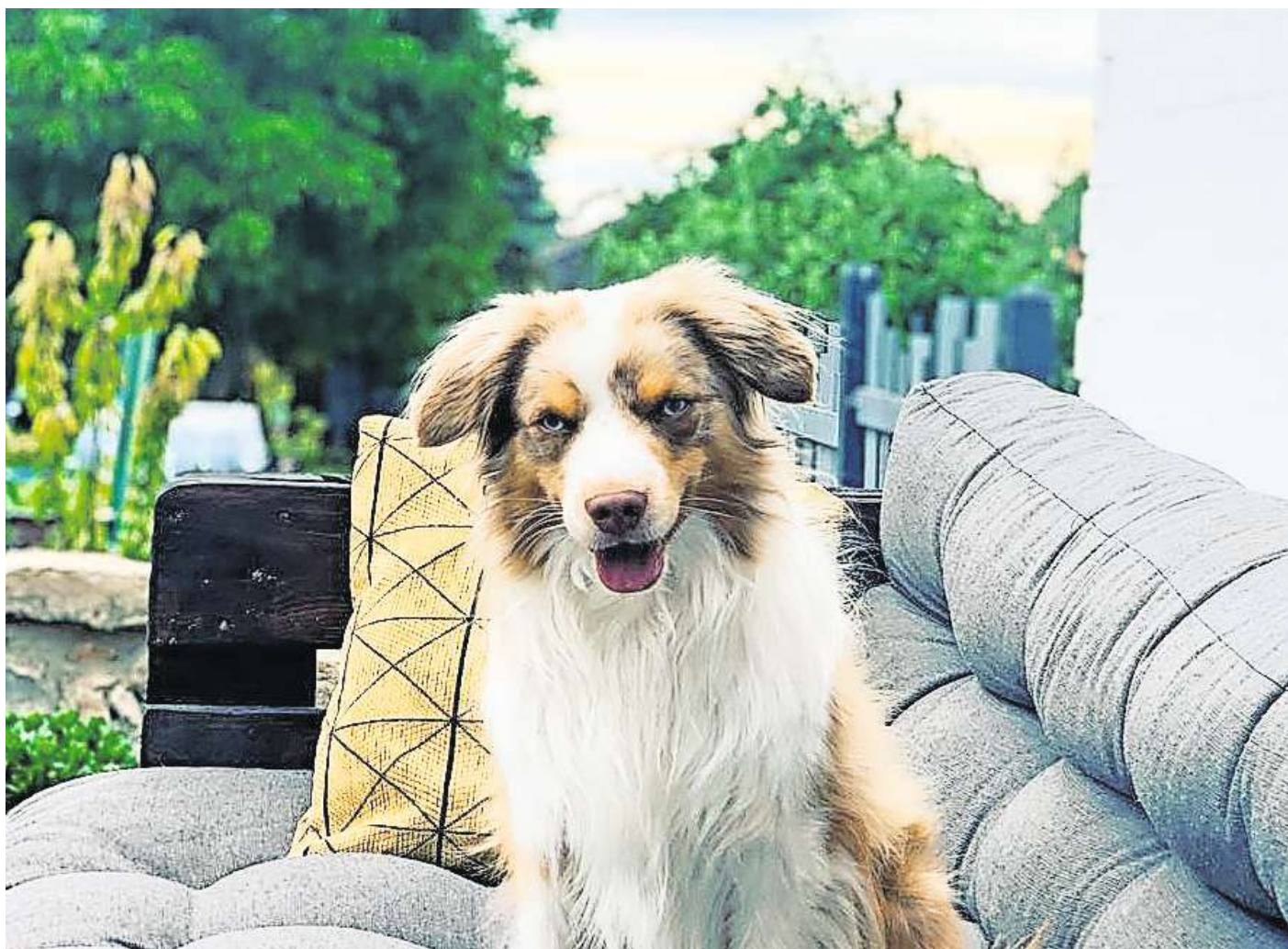
Australien Shepherd Ben wurde von einem Auto erfasst und so schwer verletzt, dass er eingeschläfert werden musste.