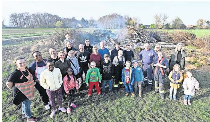
Noch vor dem vorzeitig abgebrannten Osterfeuer entwickelte die Mödesser Dorfgemeinschaft einen Plan für die „Neuaufgabe“.

Um 22.06 Uhr wurden die Freiwilligen Feuerwehren Edemissen und Mödesse alarmiert und zum Einsatz am Osterfeuerplatz in Mödesse gerufen. Als sie dort eintrafen, habe das angehäufte Strauchwerk bereits in nahezu voller Ausdehnung gebrannt und habe nicht mehr vor dem vollständigen Abbrennen bewahrt werden können. Die Feuerwehren entschieden sich in Abstimmung mit der Polizei daher dafür, dass Feuer kontrolliert herunterbrennen zu lassen.