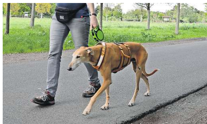
Eine Frau geht mit ihrem Hund spazieren. Während der sogenannten Brut- und Setzzeit dürfen die Vierbeiner etwa im Wald und auf Feldwegen nicht frei herumlaufen.

Trotz aller Vorsichtsmaßnahmen kann es jedoch vorkommen, dass ein Hund ein Wildtier verletzt oder tötet. In solchen Fällen sollte sofort der zuständige Förster oder eine Wildtierstation eingeschaltet werden, um dem verletzten Wildtier zu helfen, wenn es noch möglich ist. Zur Not könne auch die Polizei kontaktiert werden, die dann den Förster oder eine Wildtierstation informieren.