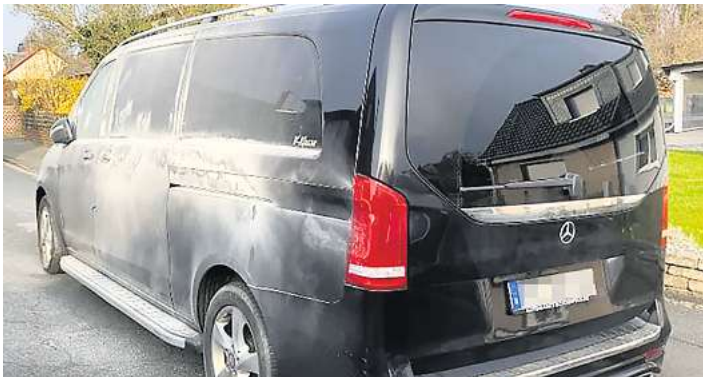
Der Mercedes des Ilseders Walter Bufo wurde mit Löschschaum überzogen.

72-jähriger Ilseder ist entsetzt – Ohne Schaden am Auto kann der Vorfall nicht angezeigt werden