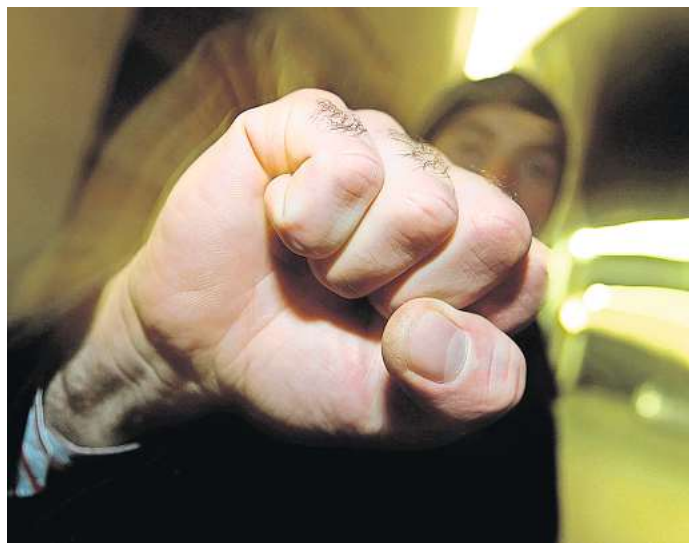
Weil sie einen Mann verprügelt und beraubt haben sollen, müssen sich drei Männer im Alter von 36, 33 und 32 Jahren vor dem Landgericht Braunschweig verantworten.

Der Prozess beginnt am Mittwoch, 10. April, um 9 Uhr. Fortsetzungstermine sind Mittwoch, 17. April, Dienstag, 7. Mai, und Dienstag, 14. Mai, jeweils um 9 Uhr.