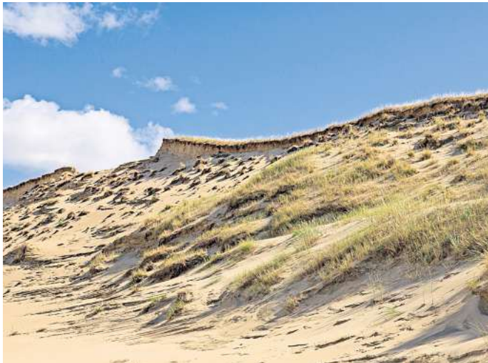
Die Parnidis Düne gilt als eine der größten in Europa.

An ihrer breitesten Stelle ist sie 3,8 Kilometer lang, an der schmalsten nur 380 Meter. Jahrhundertlange Abholzung