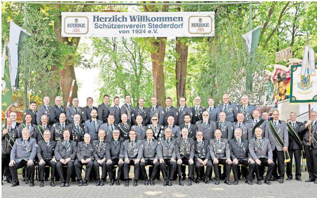
Feiert 100. Geburtstag: der Schützenverein Stederdorf. Alle sind gespannt, wem die Ehre zu Teil wird, als Jubiläumskönig in die Geschichte des Vereins einzugehen.