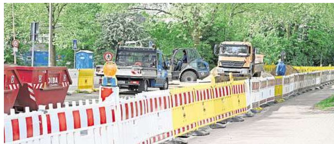
Wegen der Bauarbeiten am Fernwärmenetz ist zurzeit die Einmündung Hans-Gallinis-Straße/Am Silberkamp komplett gesperrt.

Zuständig für die Bundes- und Landesstraßen, die durch den Kreis Peine führen, ist die Niedersächsische Landesbehörde für Straßenbau und Verkehr. Eine besonders große Baustelle ist in Bett-