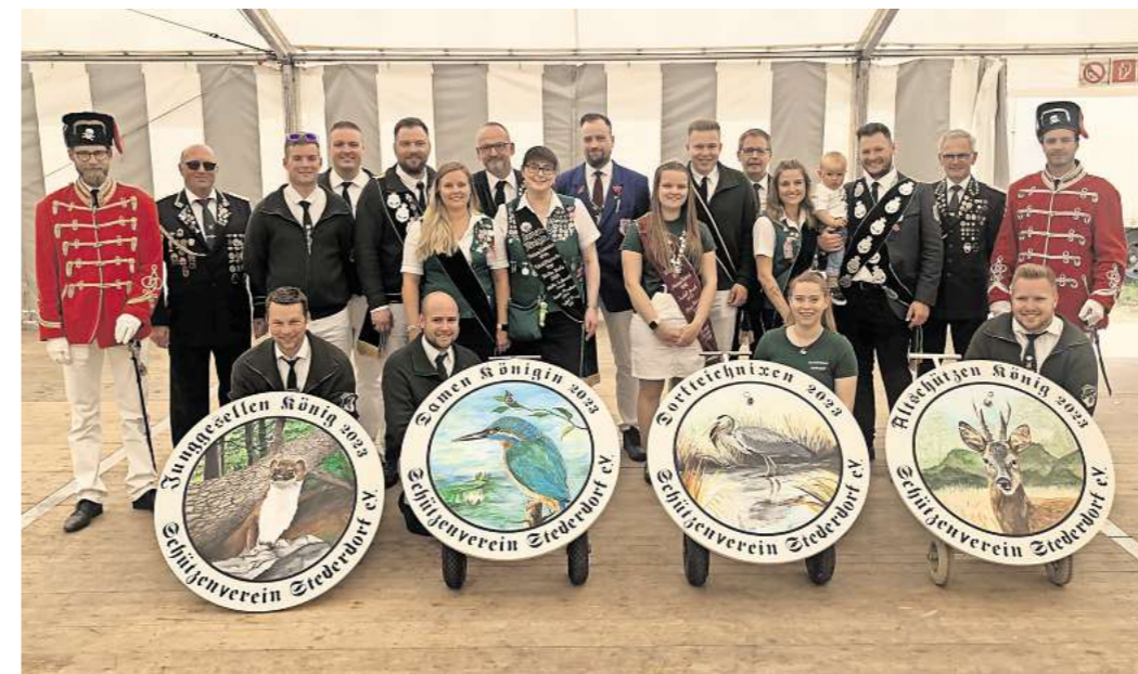
Die Spannung steigt, wer ihnen folgen wird: Die Majestäten 2023/2024 werden am bevorstehenden Pfingst-Wochenende abgelöst.