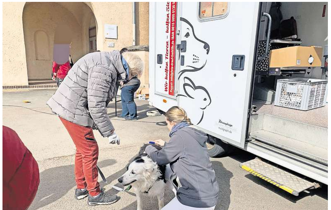
Mobile Tierarztpraxis auf vier Rädern: das Pfotenmobil.

Das Alleinstellungsmerkmal des Vereines ist, dass die Tierschützenden als einzige in der Region mit einer mobilen Tierarztpraxis unterwegs sind. Um den erkrankten Tieren zu helfen, fahren die Ehrenamtlichen mit ihrem Pfotenmobil regelmäßig in einschlägige Stadtteile und Orte. Dort helfen sie Tierhaltern, die beispielsweise aus finanziellen Gründen nicht in der Lage sind, einen Tierarzt aufzusuchen, geschweige denn ihn zu bezahlen. „Die Schwelle und die Scham, das kranke Tier zum Tierarzt zu bringen, ist wesentlich kleiner, wenn es einen Ort gibt, der direkt in der Nähe ist und zu dem nur Menschen kommen, die in der gleichen Situation sind – und genau das ermöglicht unser Pfoten-