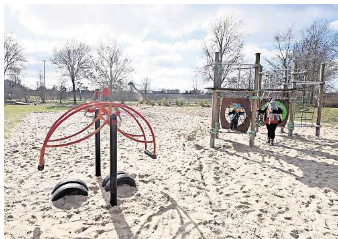
Die PAZ sucht gemeinsam mit Hallo Peine den besten Spielplatz im Landkreis.

rasante Rutschen bis hin zu gemütlichen Picknickplätzen – die nominierten Spielplätze im Landkreis Peine haben für jeden Geschmack etwas zu bieten. Ob in idyllischer Naturkulisse oder zentral gelegen im Herzen der Stadt, jeder dieser Orte hat seinen eigenen Charme und wartet nur darauf, von kleinen Abenteurern entdeckt zu werden. Doch nur einer kann zum besten Spielplatz gekürt werden, und dafür benötigen wir Ihre Stimme! Machen Sie mit bei der Wahl und entscheiden Sie mit, welcher Spielplatz die Krone verdient. Scannen Sie dazu einfach den QR-Code oder folgen diesem Link: https://aktion.paz-online.de/umfrage/spielplatz24 .