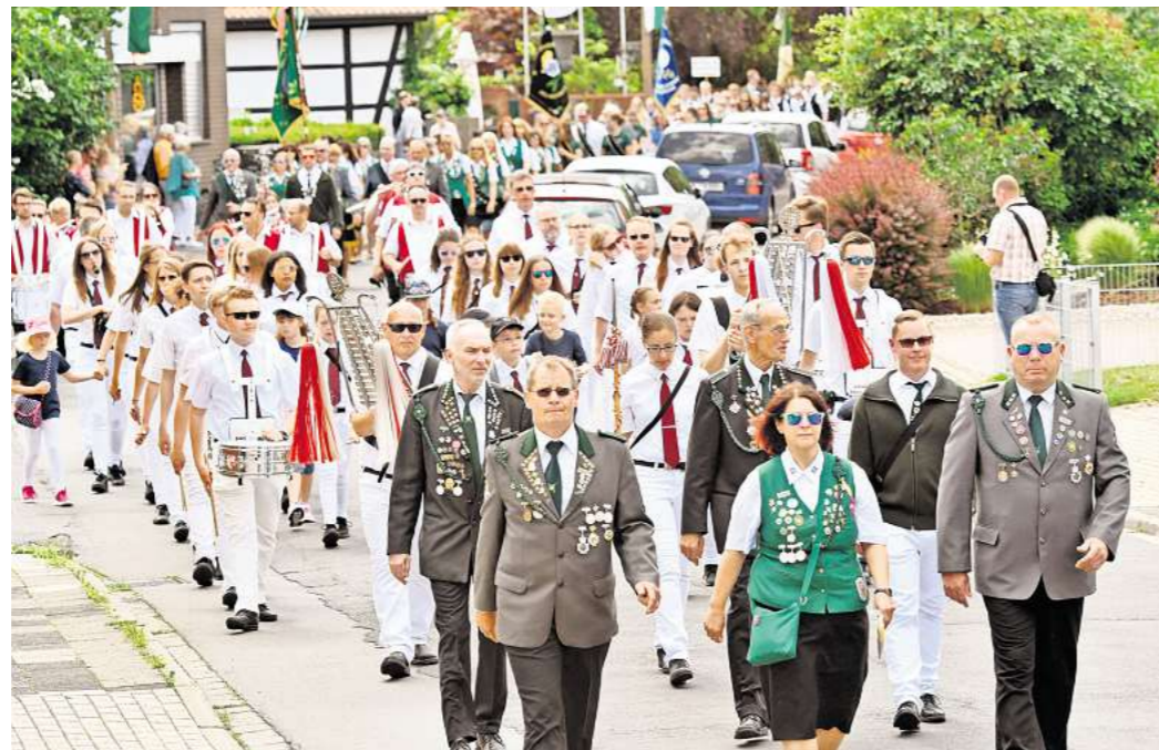
Am Pfingstsonntag ab 14.30 Uhr zieht der anlässlich des Jubiläums erweiterte Festumzug durch Stederdorf.

Fünf Spielmannszüge begleiten am Sonntag die Marschierenden – Nach umjubelter Premiere in 2023 gibt es erneut ein Feuerwerk