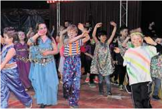
Eine Zirkusprojektwoche gehört auch zum Sommerferienprogramm.

Die Stadtjugendpflege Peine hat das Ferienprogramm veröffentlicht