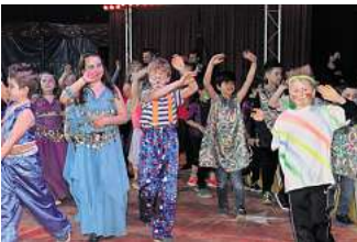
Eine Zirkusprojektwoche gehört auch zum Sommerferienprogramm.

Die Stadtjugendpflege Peine hat das Ferienprogramm veröffentlicht