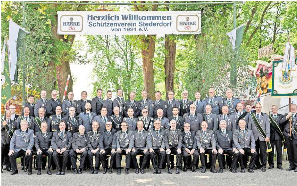
Feiert 100. Geburtstag: der Schützenverein Stederdorf. Alle sind gespannt, wem die Ehre zu Teil wird, als Jubiläumskönig in die Geschichte des Vereins einzugehen.