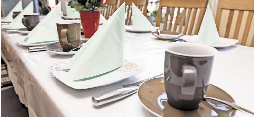
Umfrage: Wie viel würden Sie für eine Tasse Kaffee ausgeben?

Peine. Das Lieblingsgetränk der Deutschen ist der Kaffee. Ohne eine erste Tasse am Morgen gehen viele gar nicht aus dem Haus. Laut einer Erhebung der Techniker-Krankenkasse am Anfang dieses Jahres trinken rund acht von zehn Erwachsenen (79 Prozent) täglich oder mehrmals pro Woche Kaffee. Menschen über 60 Jahre trinken sogar noch mehr Kaffee: Hier liegt die Quote bei 91 Prozent. Doch würde das auch so bleiben, wenn die Preise steigen? Die Tasse Kaffee ist in den vergangenen Monaten bereits teurer geworden und die Preise könnten weiter steigen. Wegen einer neuen EU-Verordnung zum Schutz des Regenwaldes droht Kaffee-Trinkern ein weiterer Preisanstieg. Hintergrund: Ab 2025 sollen neue Regularien dafür sorgen, dass Im-