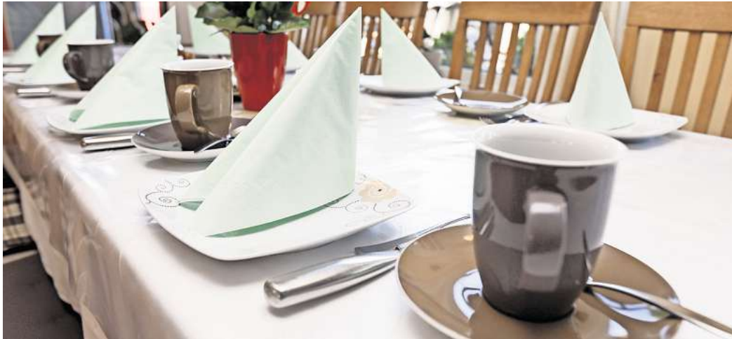
Umfrage: Wie viel würden Sie für eine Tasse Kaffee ausgeben?

Peine. Das Lieblingsgetränk der Deutschen ist der Kaffee. Ohne eine erste Tasse am Morgen gehen viele gar nicht aus dem Haus. Laut einer Erhebung der Techniker-Krankenkasse am Anfang dieses Jahres trinken rund acht von zehn Erwachsenen (79 Prozent) täglich oder mehrmals pro Woche Kaffee. Menschen über 60 Jahre trinken sogar noch mehr Kaffee: Hier liegt die Quote bei 91 Prozent. Doch würde das auch so bleiben, wenn die Preise steigen? Die Tasse Kaffee ist in den vergangenen Monaten bereits teurer geworden und die Preise könnten weiter steigen. Wegen einer neuen EU-Verordnung zum Schutz des Regenwaldes droht Kaffee-Trinkern ein weiterer Preisanstieg. Hintergrund: Ab 2025 sollen neue Regularien dafür sorgen, dass Im-