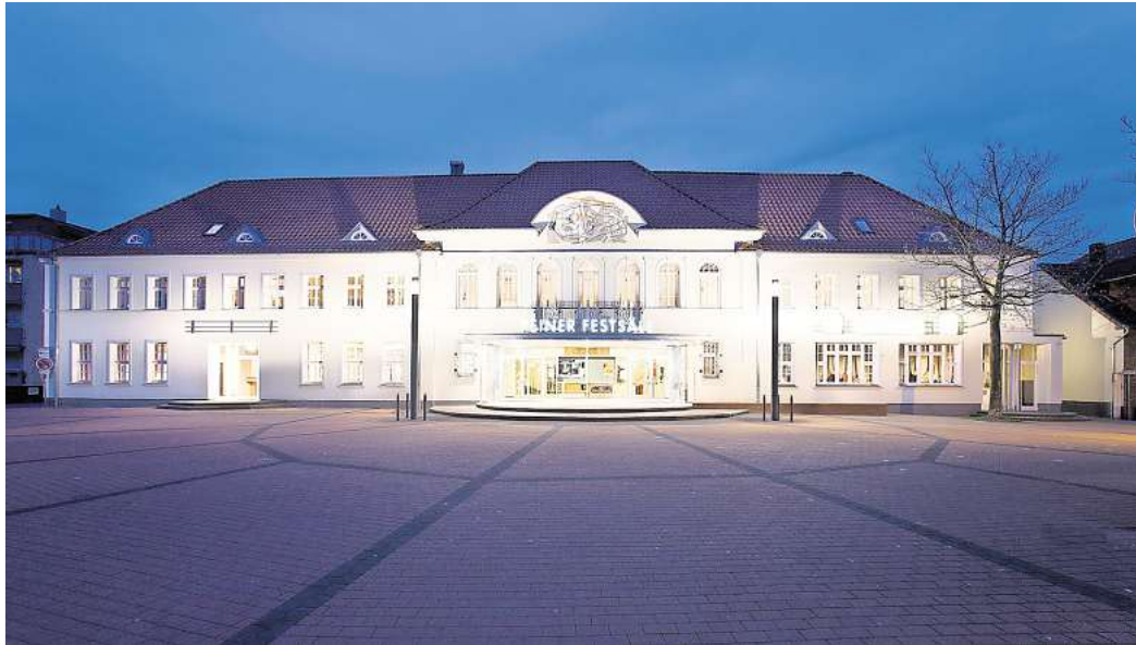
Das Stadtheater Peiner Festsäle: Hier beginnt die Führung.

Die Stadt Peine lädt alle Interessierten am 11. Mai zu dem Rundgang ein