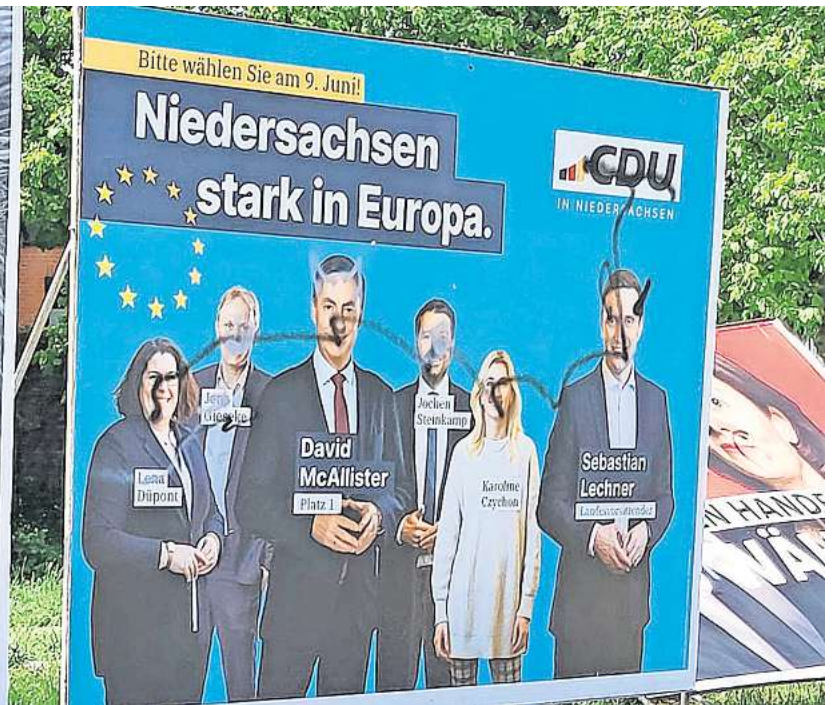
Einige der Großflächenplakate für die Europawahl wurden nicht nur beschmiert, sondern auch umgeworfen.