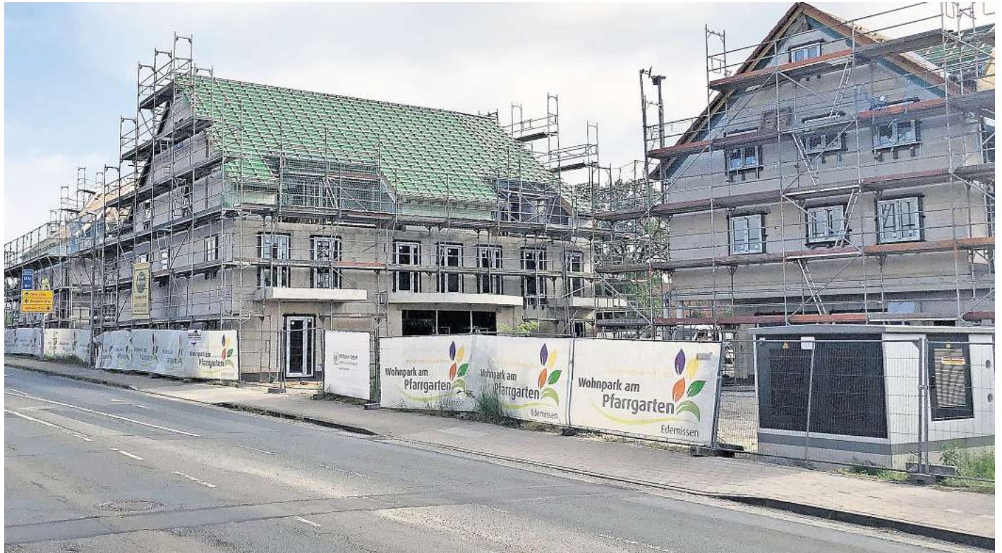
Die Bauarbeiten auf dem Redecke-Areal in Edemissen sollen nach dem Stillstand wieder aufgenommen werden.