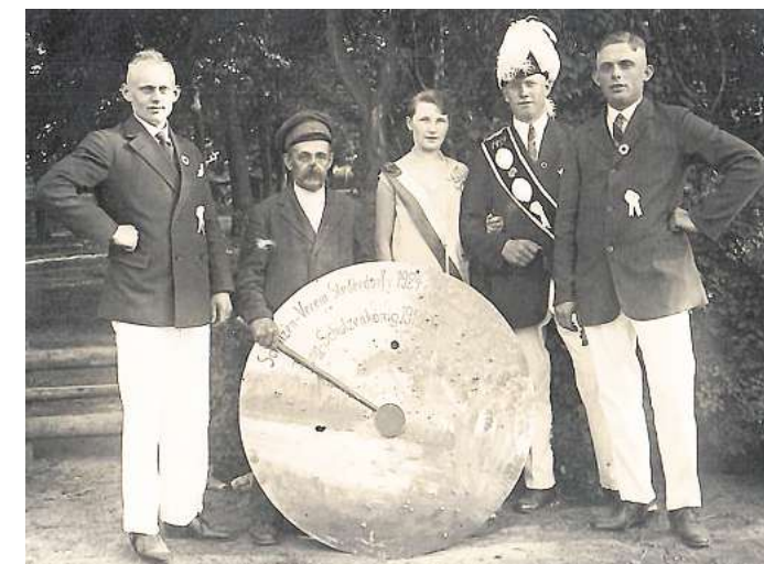
Dieses Foto aus dem Jahr 1925 gehört zu den ersten bekannten Bildern des Schützenvereins Stederdorf.

Nach der Rückkehr vom „Scheibenannageln“ geht das Fest ohne Unterbrechung im Festzelt weiter. Ab 18.30 Uhr legt ein DJ von Kube Events auf und lädt zum Tanz ein. So klingt das diesjährige Jubiläums-Schützenfest bei bester Musik