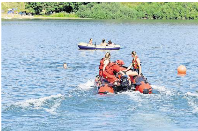
Das Team der DLRG Peine im Einsatz am Eixer See: Hier wagen sich oft unvorsichtige Schwimmer zu weit hinaus.

wieder vorkomme: Kinder spielen mit einem Ball, dieser landet im Wasser und treibt hinaus. Dann würden die Kinder oft versuchen, dem Ball hinterherzuschwimmen, doch das sei normalerweise ein hoffnungsloses Unterfangen, weiß Hofmann. Denn der Ball treibe in der Regel schneller ab, als die Kinder schwimmen können. Sinnvoller sei es, zu warten, bis der Ball am gegenüberliegenden Ufer ankommt, um ihn dort einzusammeln. Darauf würden die Ehrenamtlichen der DLRG die Kinder auch immer wieder hinweisen, erzählt Hofmann.