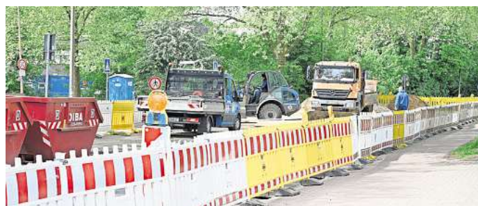
Wegen der Bauarbeiten am Fernwärmenetz ist zurzeit die Einmündung Hans-Gallinis-Straße/Am Silberkamp komplett gesperrt.

Zuständig für die Bundes- und Landesstraßen, die durch den Kreis Peine führen, ist die Niedersächsische Landesbehörde für Straßenbau und Verkehr. Eine besonders große Baustelle ist in Bett-