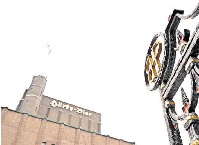
Das Härke-Gelände in Peine hat eine spannende Geschichte.

„Auch davon gibt es an anderen Häusern in Peine Figuren, wie zum Beispiel am Elefantenhäus. Das neue Torhaus entstand 1930, das neue Betriebsgebäude, das die Anmutung einer Burg mit Turm hat, von Beginn bis Mitte der 30er-Jahre. Hier gibt es