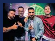
AFTER-WORK-PARTY DJ ALLSTARS Donnerstag, 04. Juli

Tickets für alle Arminen, Vechelder und Freunde sind jetzt im Vorverkauf erhältlich im Arminia Sportheim, bei Orlob Schuhe und im Friseurgeschäft „Styling by KASO“.