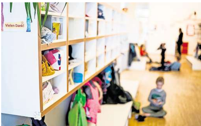
Blick in eine Betreuungseinrichtung: Fehlende Kita-Plätze sind vor allem in Peine und Ilsede ein Problem.

In der Gemeinde Wendeburg stehen 399 Kindergartenplätze und 134 Krippenplätze zur Verfügung. Zusätzlich gibt es zwölf Plätze in einem Spielkreis. Nach Auskunft der Verwaltung ist der Bedarf damit abgedeckt.