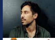
MAX GIESINGER SOMMERTOUR 2024 Samstag, 06. Juli