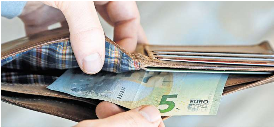
Die Armut im Landkreis Peine wächst, gerade auch bei Rentnerinnen und Rentnern.

Mit einer Armutsquote von 17,9 Prozent liegt der Landkreis Peine über dem Bundesdurchschnitt mit 16,8 Prozent beziehungsweise 14,2 Millionen Menschen. Besonders betroffen sind Alleinerziehende, kinderreiche Familien, Rentnerinnen und Rentner sowie Menschen mit einem niedrigen Bildungsabschluss oder ohne deutsche Staatsbürgerschaft. „Es ist erschreckend, dass zwei Drittel aller erwachsenen Menschen, die