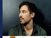
MAX GIESINGER SOMMERTOUR 2024 Samstag, 06. Juli