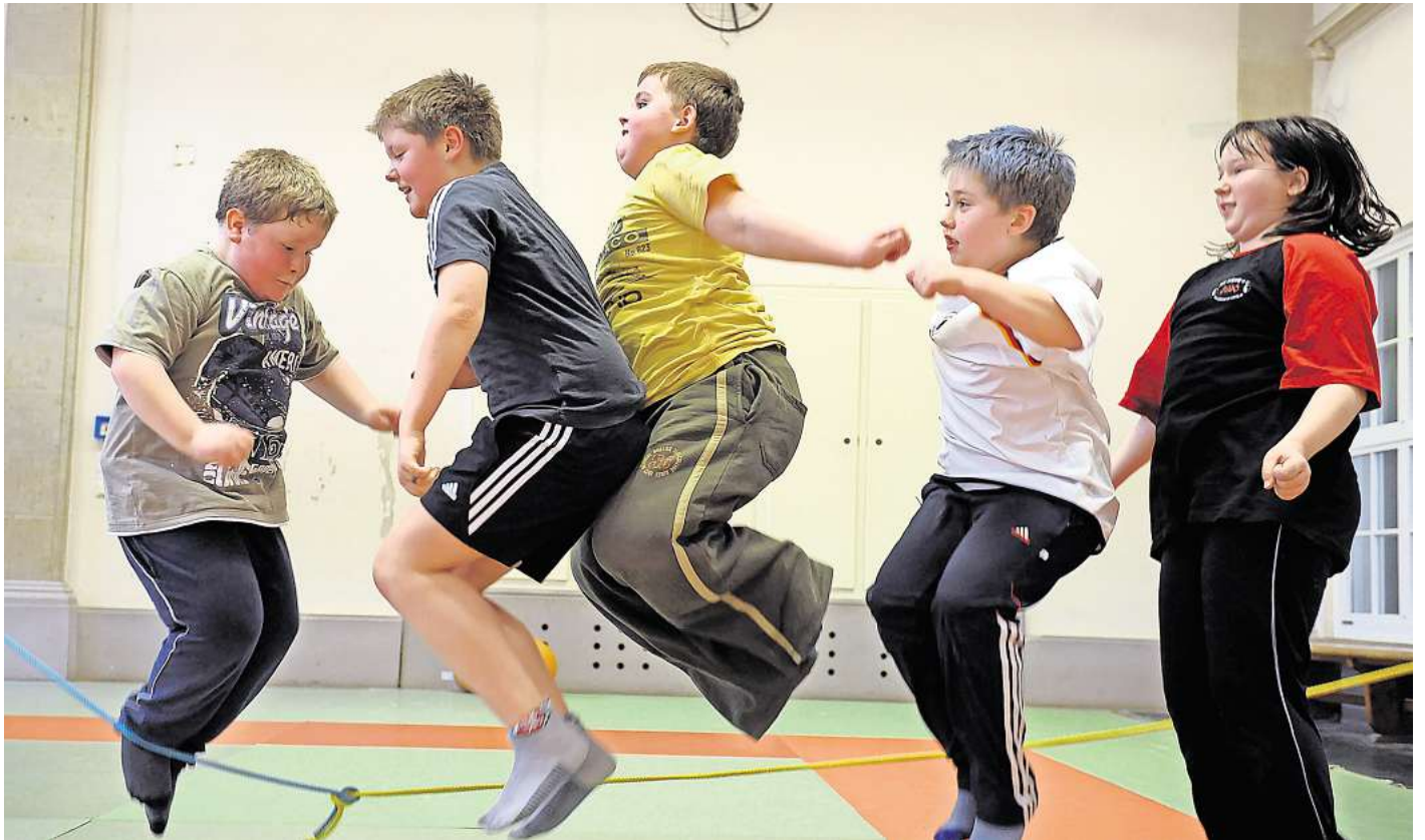
Sport gegen Adipositas: Übergewicht bei Kindern ist gefährlich. An Schulen gibt es für betroffene Kinder speziellen Förderunterricht.