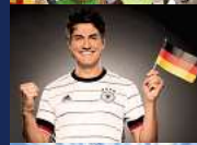
MATZE KNOP COMEDY ENTERTAINMENT Montag, 08. Juli