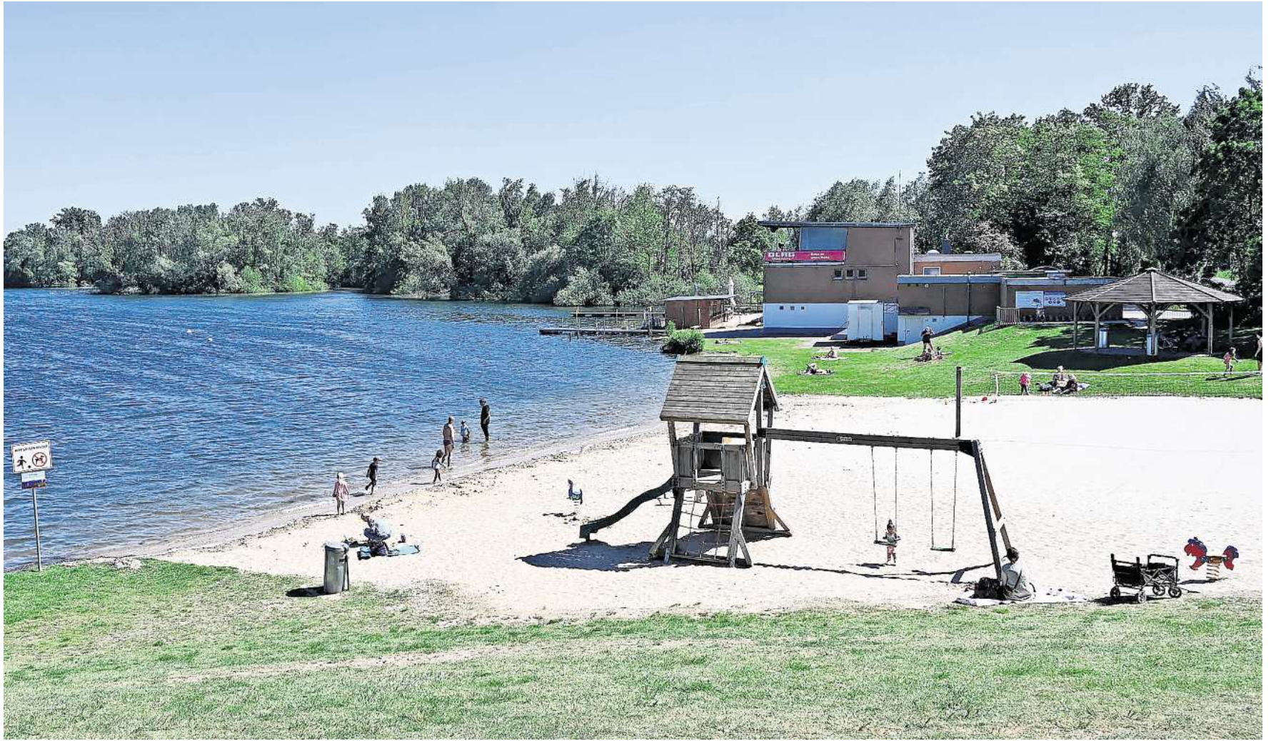
Die ersten Besucher zieht es an das Ufer des Eixer Sees. Die Badesaison steht vor der Tür.