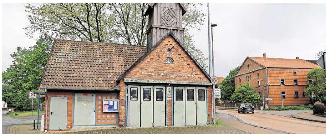
Das Feuerwehrhaus in Duttenstedt entspricht nicht mehr den aktuellen Anforderungen.

Nach dem Ortsrat werden sich der Ausschuss für Planung und öffentliche Sicherheit, der Verwaltungsausschuss mit dem Thema befassen, bevor der Rat der Stadt Peine den endgültigen Beschluss fasst.