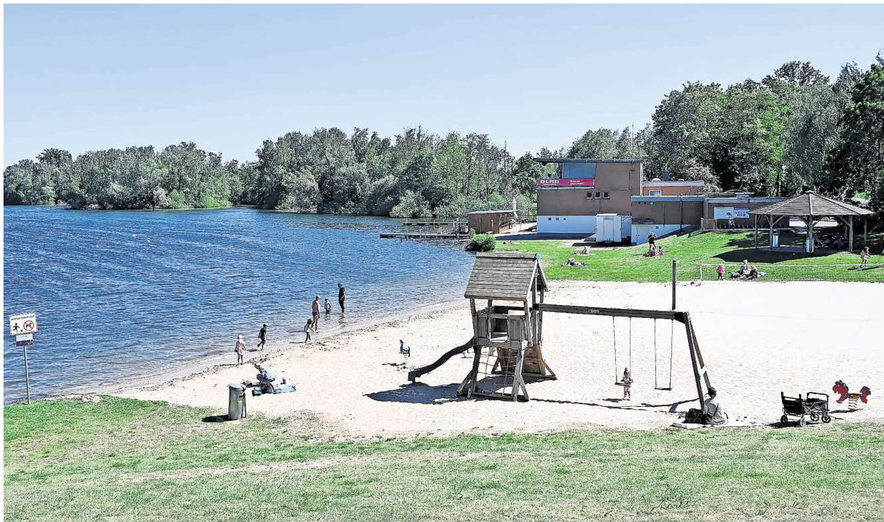
Die ersten Besucher zieht es an das Ufer des Eixer Sees. Die Badesaison steht vor der Tür.