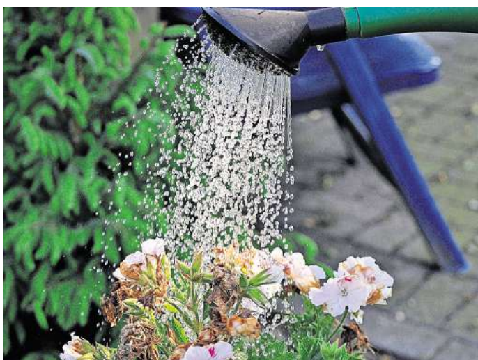
Spitzenabnahmen beim Wasser stellt der Wasserverband in diesem Jahr deutlich früher fest.

Deswegen appelliert er dazu, bei sommerlichen Temperaturen generell sorgsam mit Trinkwasser umzugehen. „Das betrifft vor allem die Tagesspitzen am Morgen