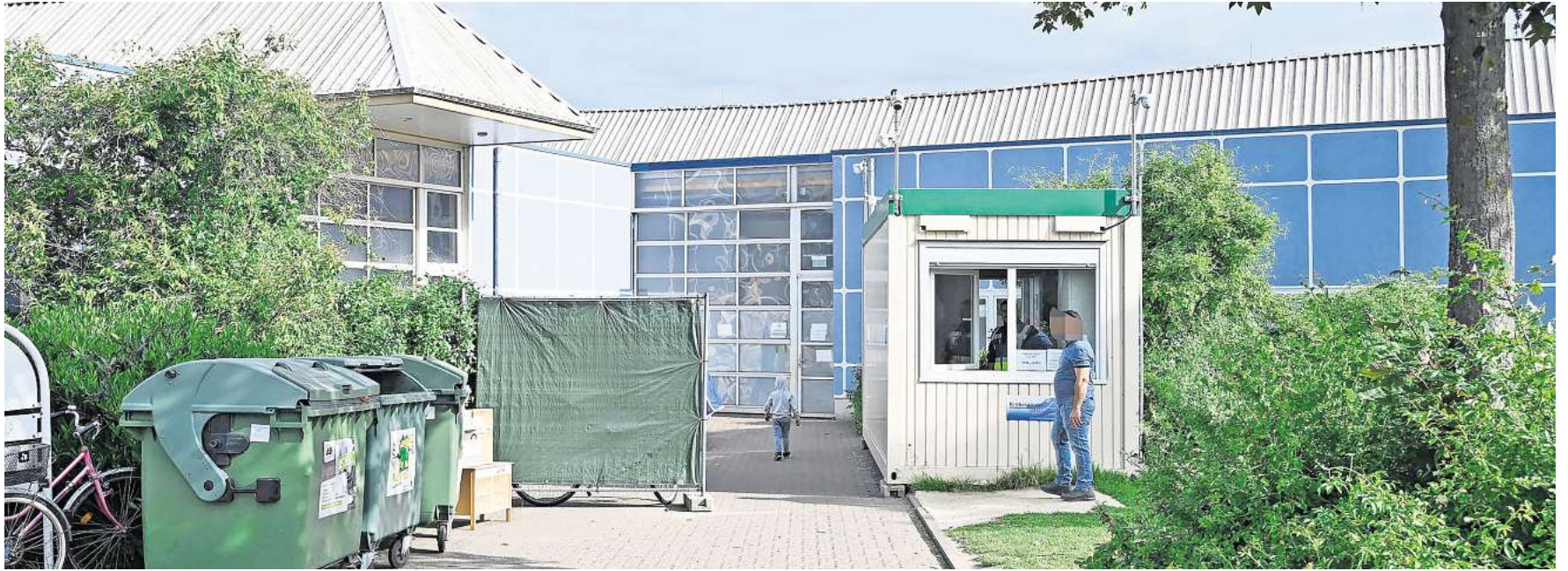
Ein Teil des Unternehmensparks Peine an der Woltorfer Straße wird auch weiterhin als Flüchtlingsunterkunft von der Stadt Peine genutzt.