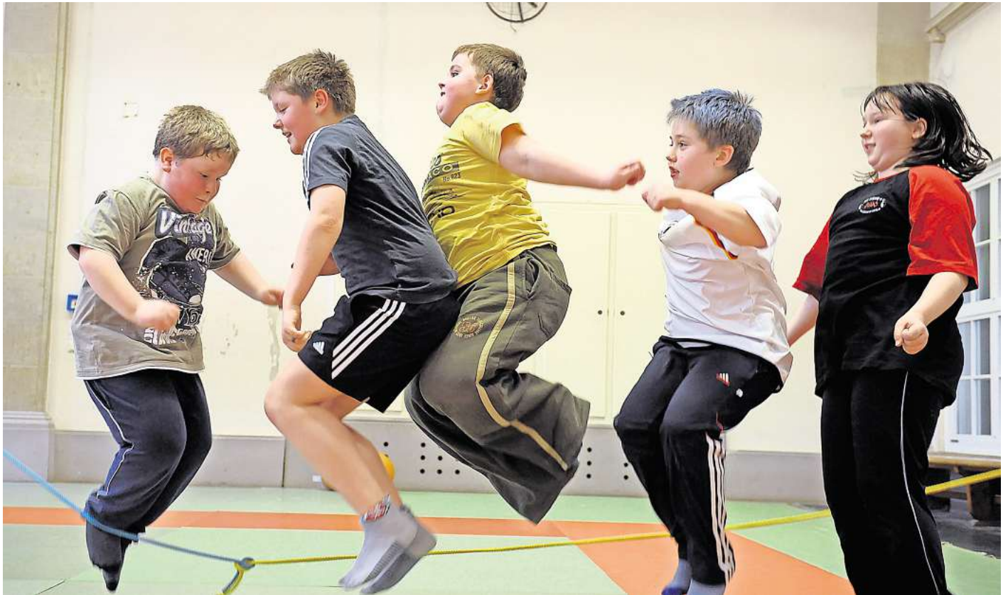
Sport gegen Adipositas: Übergewicht bei Kindern ist gefährlich. An Schulen gibt es für betroffene Kinder speziellen Förderunterricht.

Das Resultat: Der natürliche Bewegungsdrang, die eigene Körperwahrnehmung und das Erlernen der eigenen Selbsteinschätzung gehen verloren. „Diese Probleme müssen heute in den Schulen aufgefangen werden“, sagt Schönaich. „Schulen müssen sich aufmachen, Bewegung in den Alltag einzubauen.“ Auch an seiner Schule gebe es Kinder, die stark übergewichtig sind. „Es sind bislang noch Einzelfälle“, so Schönaich. „Fehlendes Wissen über gesunde Ernährung und Bewegungsmangel betrifft aber