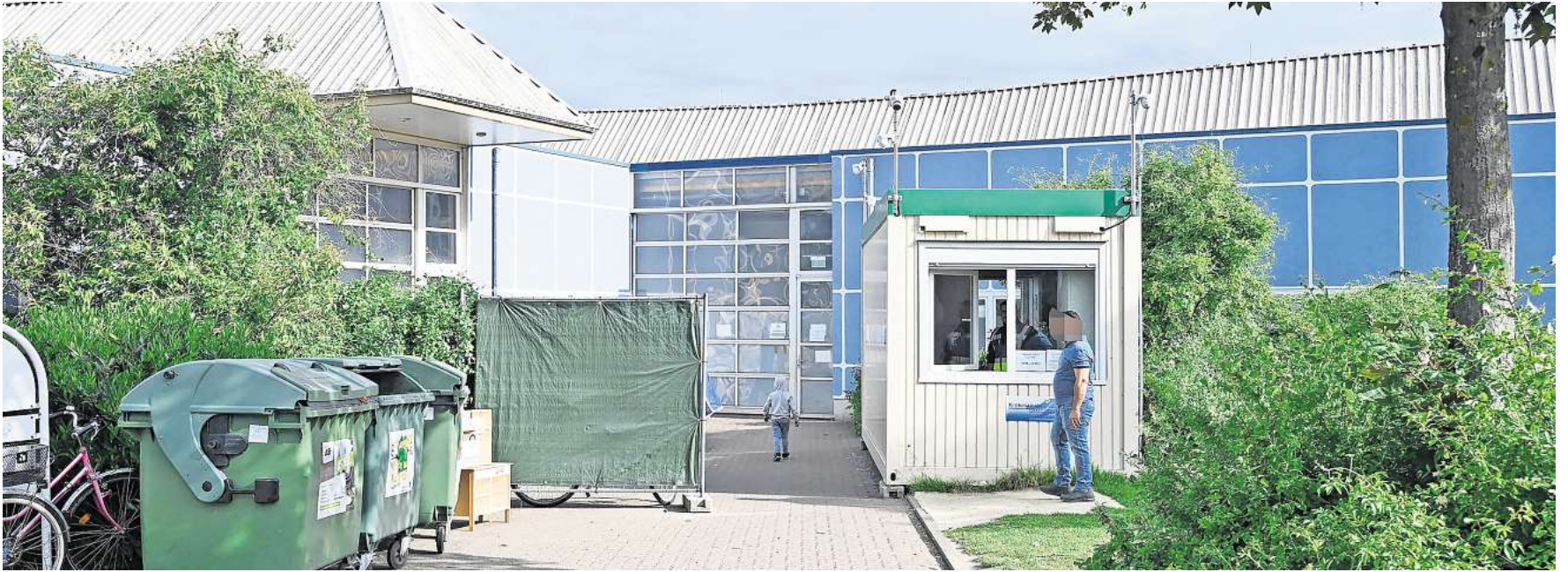
Ein Teil des Unternehmensparks Peine an der Woltorfer Straße wird auch weiterhin als Flüchtlingsunterkunft von der Stadt Peine genutzt.