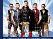
KÖNIGLICH BAYRISCHES VOLL- GAS ORCHESTER „SOMMER WIES'N“ Dienstag, 09. Juli