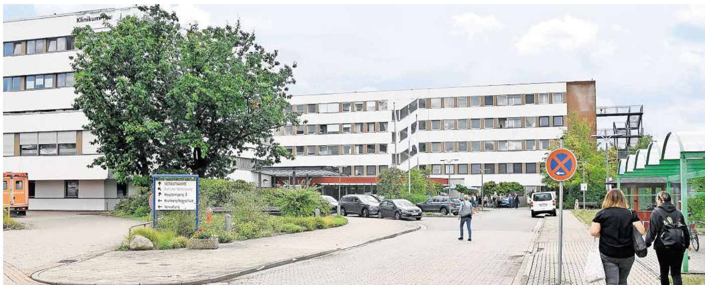
Peiner Klinikum: Der Krankenhausatlas gibt unter anderem Auskunft zu den Fallzahlen.

Der Krankenhausatlas gibt außerdem Informationen zum sogenannten Pflegepersonalquotienten der Krankenhäuser. Der Quotient setzt die Pflegekraft, also den Aufwand der Pflegefälle, in Bezug zur Anzahl des Pflegepersonals. Angegeben wird im Krankenhausatlas ein Kehrwert, je niedriger der ausfällt, desto besser. Konkret: Das Krankenhaus hat bei einem niedrigen Wert also weit überdurchschnittlich viel Pflegepersonal bezogen auf die Pflegekraft. Und hier schneidet das Peiner Klinikum unterdurchschnittlich ab: 149 Pflegekräfte gibt es laut dem Krankenhausatlas im Peiner Klinikum. Der Kehrwert liegt bei 55,93. Das Klinikum liegt damit kurz vor dem roten Bereich. Zum Vergleich: Sowohl das Städtische Klinikum Braunschweig (48,79) als auch das Helios Klinikum in