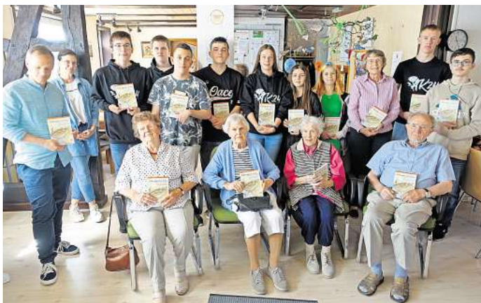
Vier 90-Jährige (vorn) berichteten Zehntklässlern ihre Erlebnisse im Nationalsozialismus sowie mit Flucht und Vertreibung.

Die ersten 200 Exemplare ihres Buches waren schnell vergriffen, aufgrund der großen Nachfrage wurde – finanziert von der Claus-Bendorff-Stiftung – eine zweite Auflage gedruckt. Jeder Schüler bekam ein von den vier anwesenden Zeitzeugen signiertes Exemplar überreicht. Zudem erhielt der Klassenlehrer einen Klassensatz für den Unterricht nachfolgender Schuljahre überreicht.