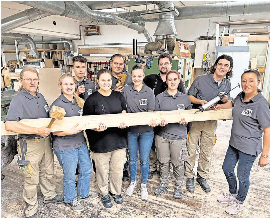
Frauen im Bauhandwerk: In der Tischlerei Meyer & Comp. in Velpke ist die Hälfte der Belegschaft weiblich.