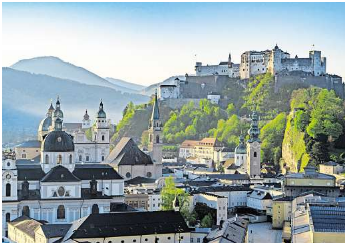
Hoch über der Stadt thront die Festung Hohensalzburg.

Das Wahrzeichen Salzburgs ist die Festung Hohensalzburg, de-