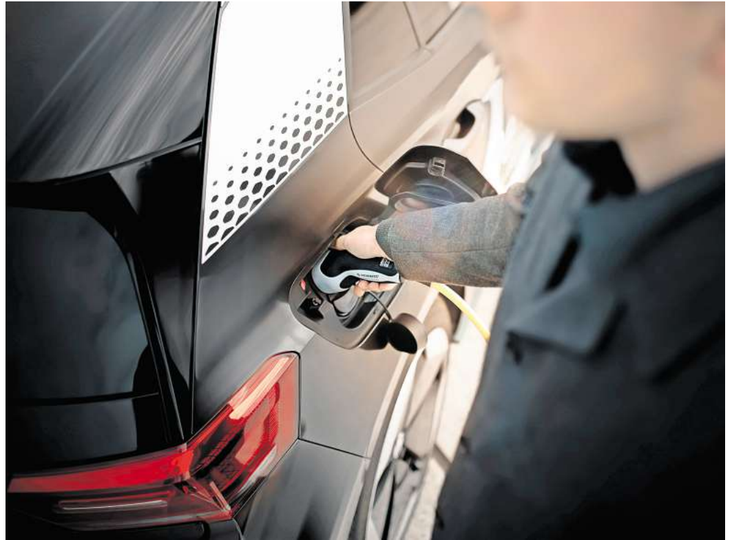
Mit bidirektionalem Laden kann ein E-Auto Strom speichern und wieder abgeben.

„Bidirektionales Laden wird in Zukunft ein attraktives Zusatzangebot für die Nutzerinnen und Nutzer von Elektroautos sein: Das eigene Auto wird damit zum Stromspeicher – zuerst für den Verbrauch im eigenen Zuhause und in Zukunft auch für die Rückspeisung ins Stromnetz.“