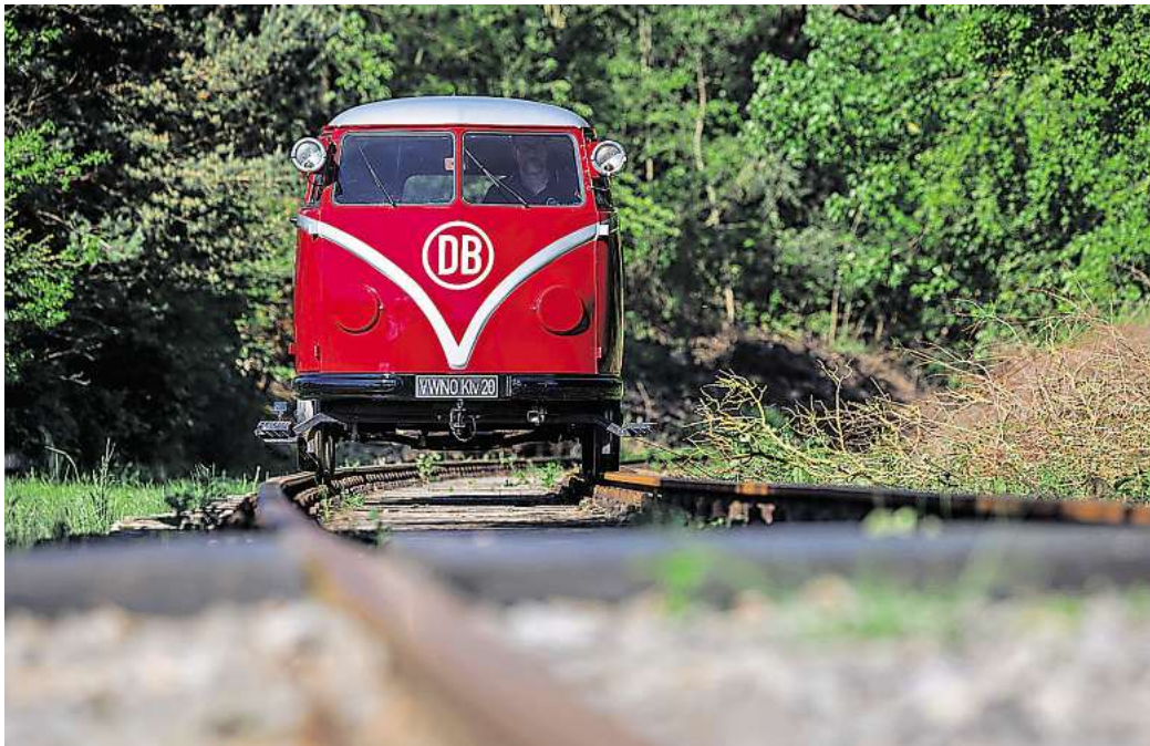
Ungewöhnlicher Neuzugang: Die Sammlung von Volkswagen Nutzfahrzeuge Oldtimer wurde um den sogenannten Draisinen-Bulli erweitert.

So ein Klv-20 besteht im Wesentlichen aus drei Komponenten: der Karosserie eines T1 Kombi, einem Volkswagen Industriemotor mit 21 kW/28 PS sowie einem Fahrgestell mit einer hydraulischen Hebe-Drehvorrichtung. Damit konnte der Klv-20 von einer Person auf der Stelle angehoben, gedreht und wieder eingeparkt werden.