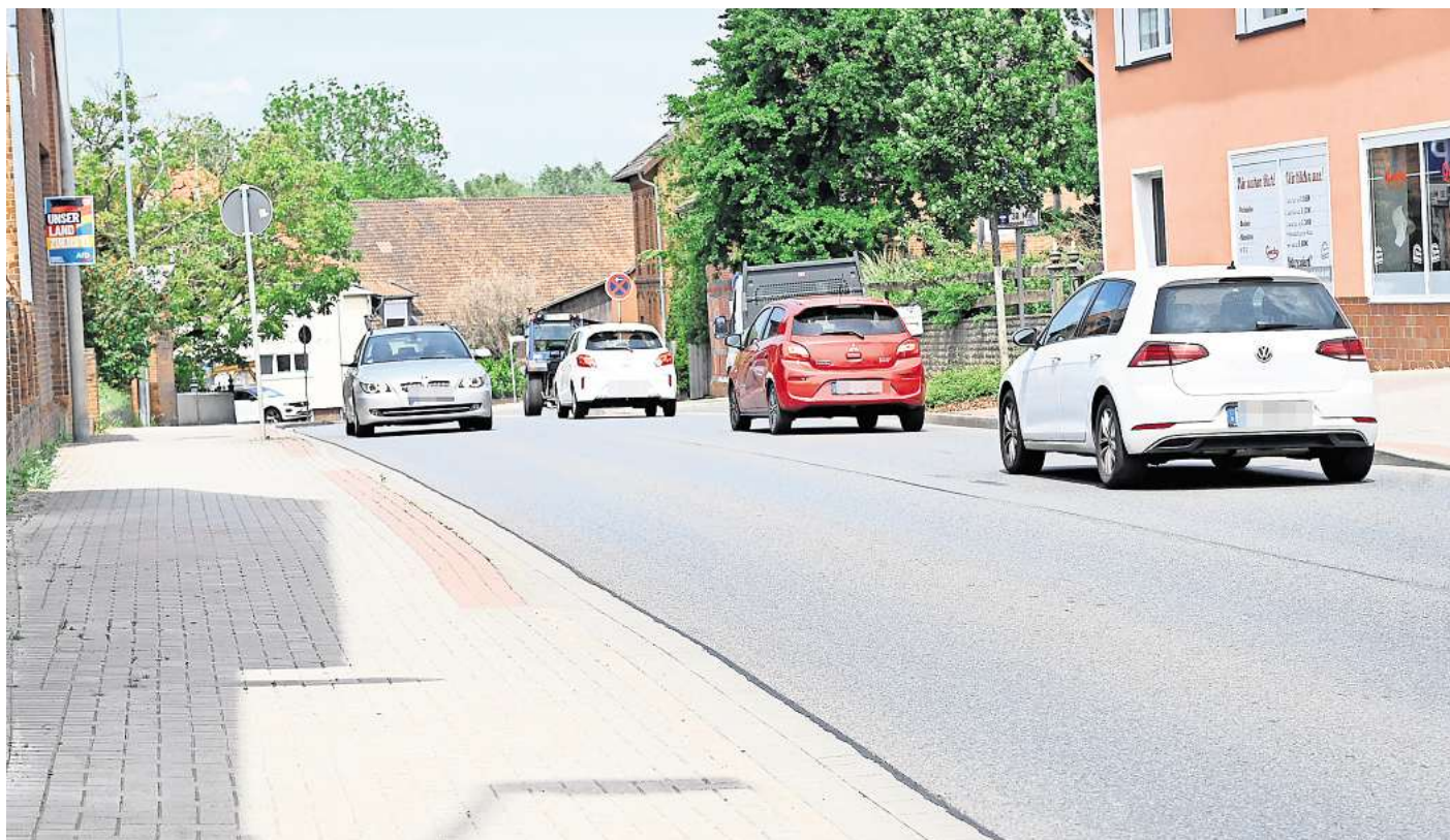
Das tägliche Verkehrsaufkommen an der B 444 ist sehr hoch. Knapp 12.000 Fahrzeugen fahren täglich durch Klein Ilse.

Eine bauliche Maßnahme könnte zeitig in Groß Lafferde umgesetzt werden. 2021 diskutierte die zuständige Landesbehörde für Straßenbau in Wolfenbüttel erste Planungen für einen Umbau der Bierstraße (B 1). Für die Einmündung an die B 444 gab es