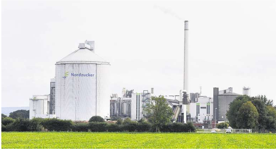
Die Nordzucker AG hatte ein sehr erfolgreiches Geschäftsjahr 2023/24. Auch im Werk in Clauen wurden viele Rüben verarbeitet.

Operatives Ergebnis von 421 Millionen Euro – Ausschüttung der Rekorddividende von 2 Euro pro Aktie