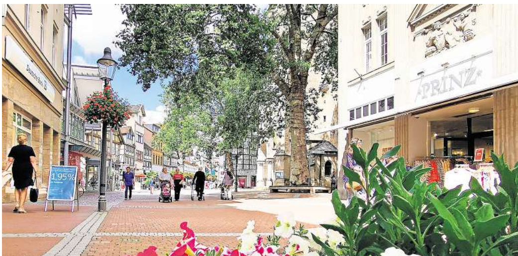
Die Peiner Fußgängerzone ist durchaus sehenswert.

Naherholung beginnt in Peine direkt vor der Haustür: In und rund um Peine lässt sich prima entspannt Zeit verbringen. Die Badeseen – allen voran der Eixer See – die Natur, die gerade jetzt im Wonnemonat Mai besonders ins Freie zieht oder Ziele im näheren Umland laden zu Ausflü-