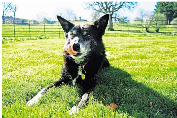
Das Omihunde-Netzwerk hilft alten oder gebrechlichen Hunden in Deutschland.

Genau hier setzt der Verein „Omihunde-Netzwerk e.V.“ an. Gegründet im November 2010 hat sich der gemeinnützige Verein darauf spezialisiert, sich mit viel Herzenswärme um in Not geratene, alte Fellnasen zu kümmern. Dazu werden sie zuerst in privaten Pflegestellen aufgenommen und dort liebevoll umsorgt. Zwar ist auch weiterhin die