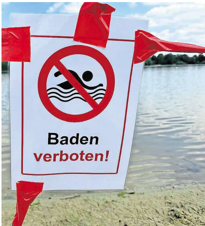
Wegen E.coli-Bakterien ist zurzeit der gesamte Eixer See gesperrt.

Blaualgen scheiden Toxine aus. Diese Giftstoffe können bei Menschen durch Verschlucken und Hautkontakt Übelkeit, Erbrechen, Durchfall, Gliederschmerzen, Bindehautentzündungen, Ohrenschmerzen und Atemwegserkrankungen auslösen. Sogenannte Blaualgen-Blüten treten vor allem in den Sommermonaten bei hohen Wassertemperaturen auf.