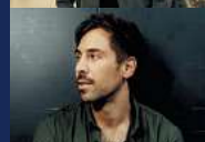
MAX GIESINGER SOMMERTOUR 2024 Samstag, 06. Juli