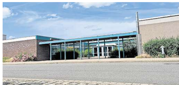
Soll saniert werden: das Dorfgemeinschaftshaus in Vöhrum.