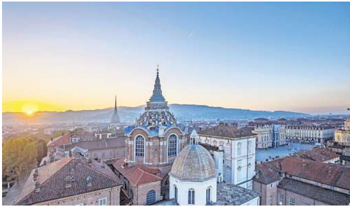
Turin gehört zu den unterschätzten Städten Italiens.

Wer nach Turin in Norditalien reist, bekommt alles. Außer das Meer. Italiens viertgrößte Stadt nennen rund 850.000 Einwohnerinnen und Einwohner ihr Zuhause und sie war von 1861 bis 1865 die erste Hauptstadt des vereinten Italiens. Das Tramezzino wurde in Turin erfunden, die Abwandlung des Sandwiches, bei der zwischen den rindenlosen weißen Toastscheiben Leckereien eingebettet sind. Die Geburtsstätte des Sandwich-Ablegers ist das Caffè Mulassano, das die belegten Ecken noch heute anbietet. Wer sich weiter durch die Leckereien, die in Turin erfunden wurden, schlemmen möchte, kann losle-