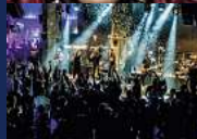
LADIES NIGHT GOODFELLAS Donnerstag, 11. Juli