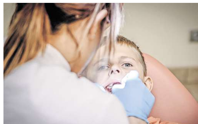
Zahnärzte warnen: Eine flächendeckende Versorgung sei unter den politischen Rahmenbedingungen kaum noch zu gewährleisten.