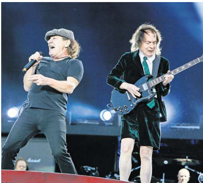
Vor neun Jahren: 2015 haben AC/DC ebenfalls auf dem Messegelände in Hannover gespielt. Hier rocken Brian Johnson (links) und Angus Young die Bühne.

So riesig die Euphorie war, so schnell folgte auch die große Enttäuschung: Der erste Termin