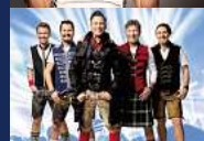
KÖNIGLICH BAYERISCHES VOLL- GAS ORCHESTER „SOMMER WIES'N“ Dienstag, 09. Juli