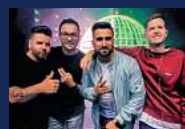
AFTER-WORK-PARTY DJ ALLSTARS Donnerstag, 04. Juli