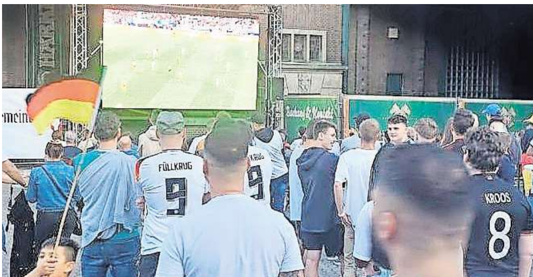
Gemeinsam Fußball schauen: Auf dem Härke-Hof in Peine ist am Samstag das EM-Achtelfinale zu sehen.

Dann werden sich wieder zahlreiche Fans die großen Namen überstreifen. Füllkrug, Kroos,