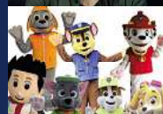
PAW PATROL UNITED KIDS FOUNDATIONS- FAMILIENTAG Sonntag, 07. Juli