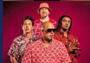
CULCHA CANDELA FINALE PARTY Samstag, 13. Juli