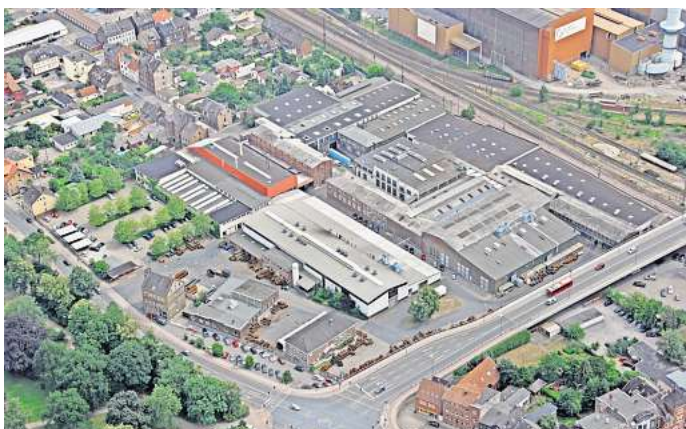
Das Firmengelände der Peiner Umformtechnik an der Wolterfer Straße aus der Vogelperspektive.

Am 10. Juni hatte es wie berichtet eine Video-Konferenz gegeben, an der neben dem Insolvenzverwalter, dem möglichen Investor, der IG Metall und dem Betriebsrat auch der niedersächsische Wirtschaftsminister Olaf Lies (SPD) und Experten aus seinem Ministerium beteiligt waren. Auch nach diesem Termin hätten Gespräche zwischen den Beteiligten stattgefunden, um sich bei den unterschiedlichen Positionen