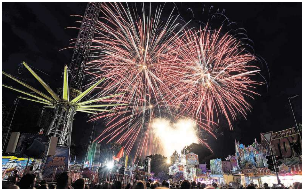
Ein Höhepunkt im Festprogramm ist das spektakuläre Höhenfeuerwerk am späten Freitagabend.

Pyrotechniker präsentieren Kometenbögen und tanzende Sterne