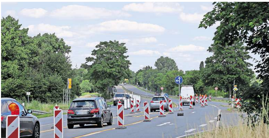
Aktuell ist der Abzweig von der B65 nach Handorf noch gesperrt. Umleitungen und Baustellen gibt es aber auch an vielen anderen Stellen im Peiner Land.

Die Landesbehörde für Straßenbau und Verkehr in Wolfenbüttel hat bereits Bauarbeiten auf der Bundesstraße 65 angekündigt. So wird am Montag, 24. Juni, der Bauabschnitt zwischen dem Ortseingang Mehrum und der Triftstraße voraussichtlich bis zum 8. Juli in beide Richtungen gesperrt. Anschließend beginnen die Bauarbeiten von der Triftstraße bis zum Ortseingang Schwicheldt, ebenfalls unter Vollsperrung. Im ersten Bauabschnitt erfolgt die Umleitung von Haimar kommend über Hohenhameln, Stedum, Equord und zurück zur B65, umgekehrt in der Gegenrichtung. Der zweite Bauabschnitt erfordert die Änderung der Umleitung. Diese läuft dann über Stedum und Rosenthal zurück zur B65 und umgekehrt. Im zweiten Bauabschnitt ist auch der Kreisverkehr der Landesstraße 413 mit der B65 gesperrt, sodass der aus Richtung Hämelerwald kommende Verkehr auf der L413 über Sievershausen und Vöhrum zur B65 geleitet wird. Es sind noch weitere Baustellen auf