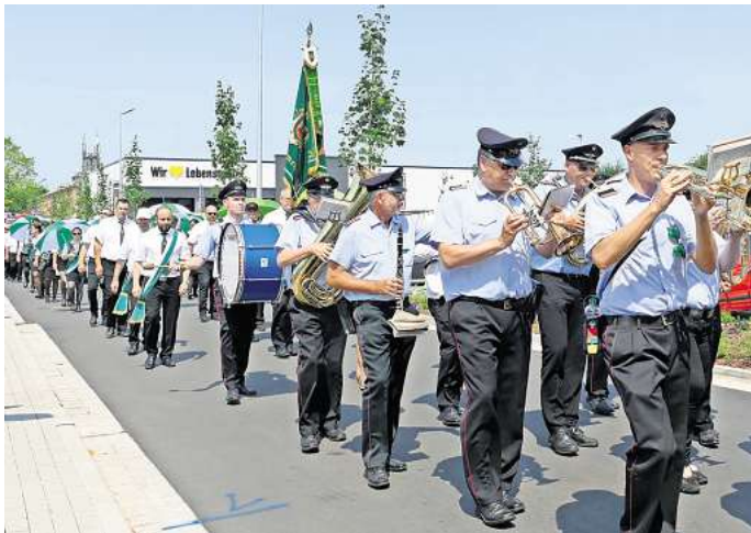
Mit Musik und guter Laune zieht der Umzug am 14. Juli durch Hohenhameln.

Am Samstag, 13. Juli, beginnt das Programm mit dem festli-