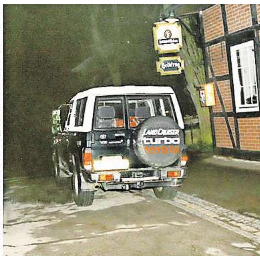
Cold Case „Heidkrug“-Mord: Bauunternehmer Artur Linzmaier wurde auf dem Parkplatz des Gasthauses „Heidkrug“ in Wipshausen von tödlichen Schüssen getroffen.