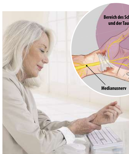
Abbildung Betroffenen nachempfunden

Der Karpaltunnel ist ein enger, 4 bis 5 cm langer Durchgang am Handgelenk, durch den der sensible Medianusnerv, der Mittellarmnerv, verläuft. Dieser gilt als echter „Superheld“ unter den Nerven, denn er ist für die Steuerung der Bewegungen von Fingern, Handgelenken und Daumen sowie das Greifen und Halten von Gegenständen zuständig. Wird der Medianusnerv durch eine Verengung des Karpaltunnels gequetscht oder eingeklemmt, bezeichnet man das als Karpaltunnelsyndrom. Die Folge: Nervenschmerzen, die sich häufig auch durch Kribbeln oder Taubheitsgefühle äußern.