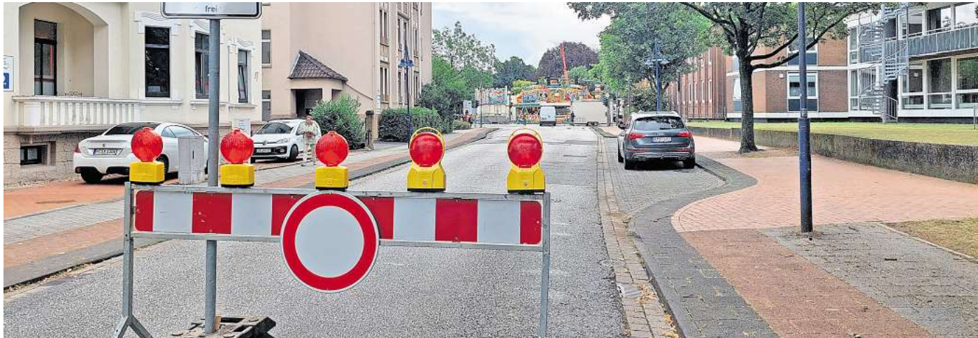
Die Werderstraße ist zum Peiner Freischießen gesperrt. Autofahrer müssen Umleitungen in Kauf nehmen.

Ausweichstrecke für Autofahrer verläuft etwas anders als üblich – das ist der Grund