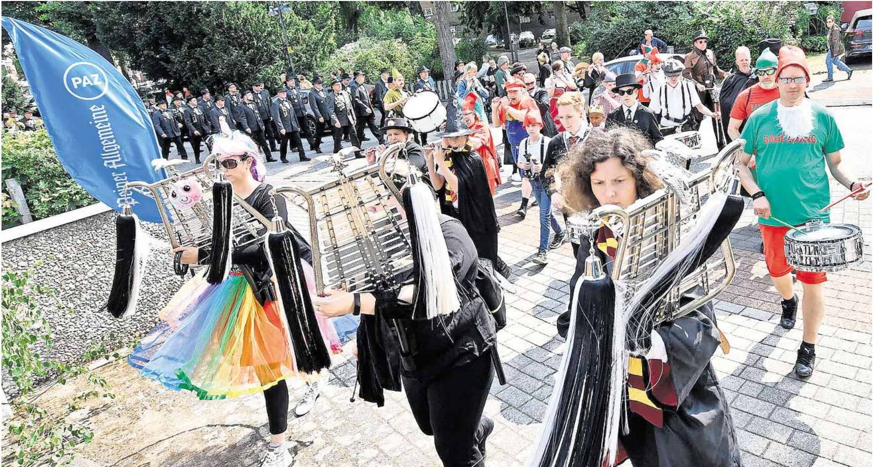
Peine feiert beim Freischießen: Die schönsten Bilder davon gibt es exklusiv im E-Paper der PAZ, das von Sonntag bis Mittwoch kostenfrei zur Verfügung steht.