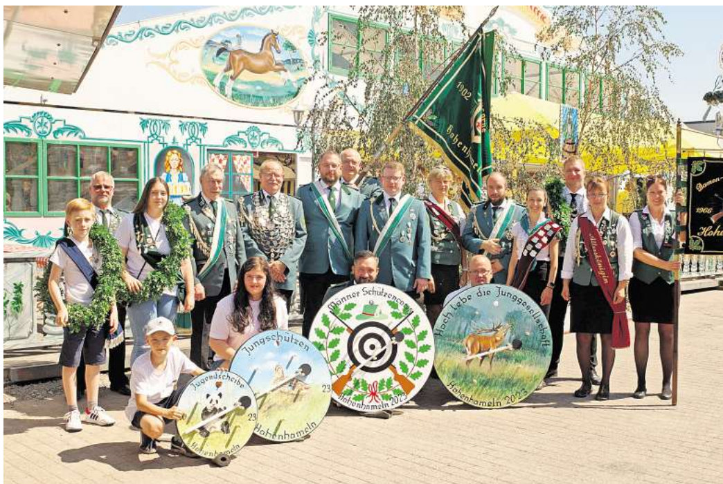
Die Würdenträger 2023: Am kommenden Wochenende werden die Hohenhamelner Majestäten abgelöst. Die Spannung, wer ihnen folgen wird, ist groß.

„Wir hoffen, euch zahlreich in Hohenhameln begrüßen zu dürfen, um diese wundervollen Tage gemeinsam mit euch zu feiern“, lädt die Junggesellschaft alle ein, dabei zu sein.