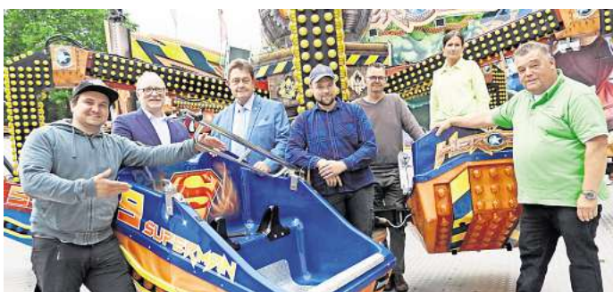
Treffen auf dem Heroes-Karussell: Bürgerschaffer und Schausteller wollen wieder für jede Menge Trubel beim Freischießen sorgen.