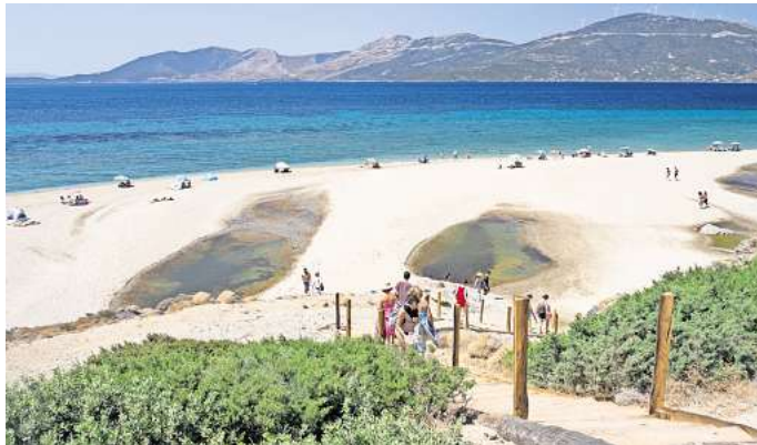
Rund um Marmari im Süden befinden sich einige der schönsten Strände der Insel.

Ein historisches Highlight von Chalkida ist die Burg Karababas, auch Kanithos genannt. Das 1684 fertiggestellte Bauwerk thront auf dem Hügel Fourka,