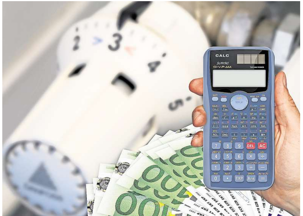
Verzögerungseffekt: Hohe Energiekosten kommen mit Zeitversatz bei Verbrauchern an.

„Die tatsächlichen Abrechnungsdaten geben leider keinen Anlass zur Entwarnung“, sagt Lessing, im Gegenteil: „Viele Mieterinnen und Mieter werden