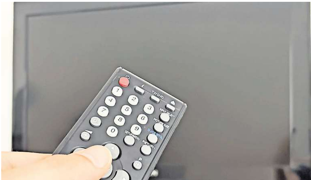
Neuregelung beim Kabelfernsehen: Nutzen Sie die Gelegenheit zum Umstieg auf andere Techniken?

Mieterinnen und Mietern steht ab Sommer die Wahl des Empfangsweges völlig offen. Sie können dann entweder einen einzelnen Vertrag mit einem Kabel-TV-Anbieter abschließen oder künftig auf Satellit, Antenne oder internetbasiertes Fernsehen setzen. Für welche Technik entscheiden Sie sich beziehungsweise nutzen sie bereits