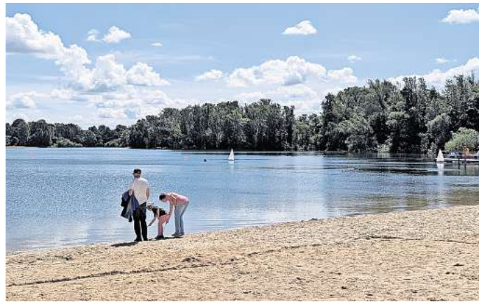
Der Eixer See ist wieder frei gegeben. Doch Badegäste bleiben noch aus.