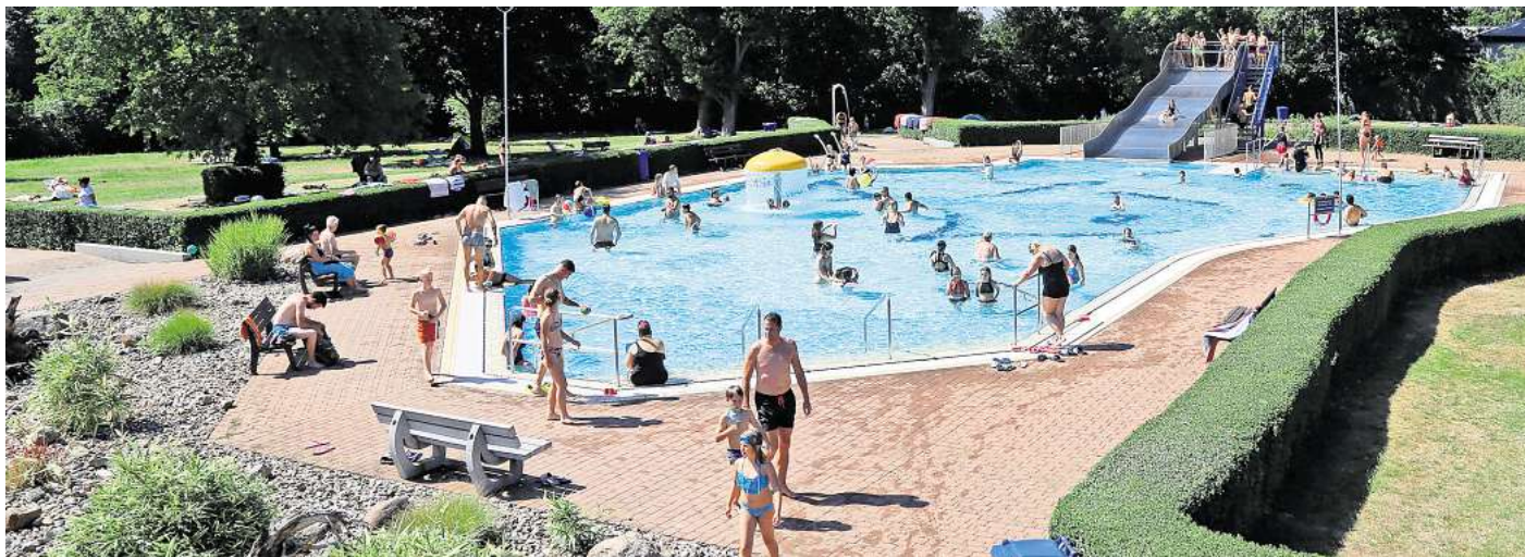
Das Freibad am Bolzberg in Gadenstedt bietet keine Kurzzeit-Tarife für Spontanschwimmende an.

Ermäßigte Eintrittspreise für Gäste, die nur kurz im Freibad schwimmen wollen, sind nicht ohne Weiteres erhältlich