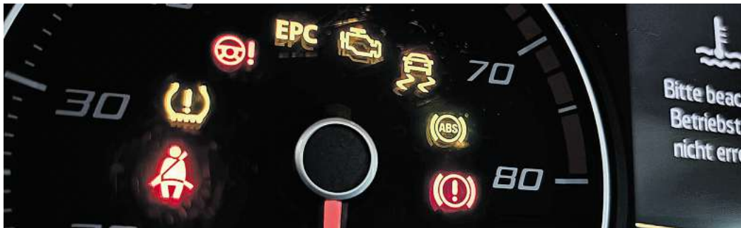
Warnleuchten im Tachometer: Viele Assistenzsysteme sind für Neuwagen in der EU nun Pflicht.