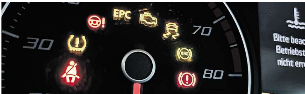
Warnleuchten im Tachometer: Viele Assistenzsysteme sind für Neuwagen in der EU nun Pflicht.