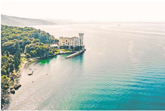
Weiß leuchtend und mit Traumblick auf den Golf von Triest: Das Schloss Miramare.