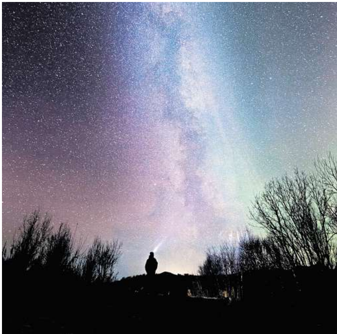
Existiert außerirdisches Leben? Diese Frage beschäftigt die Menschen schon seit Jahrtausenden.

Schon, aber wir haben nicht richtig geguckt. Die Leute glauben,