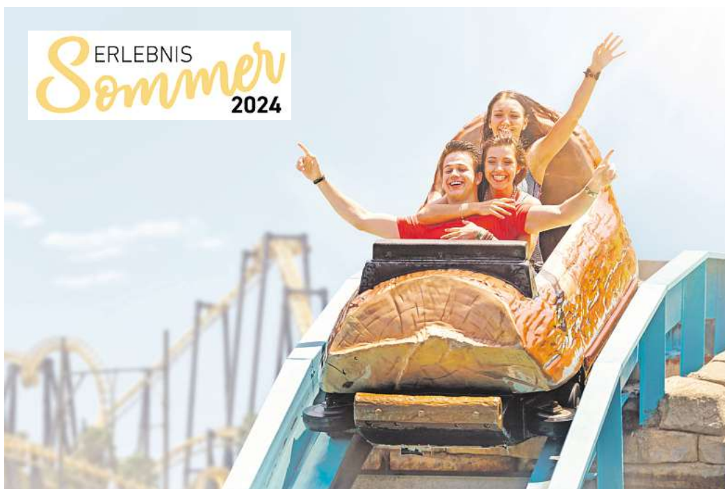
Das Abenteuer ruft, günstige Ticketpreise locken: Der „Erlebnissommer 2024“ bietet erneut jede Menge Freizeitspaß für wenig Geld.

Im Angebot sind unter anderem noch Eintrittskarten für das Rasti-Land in Salzhemmendorf, für das Sea-Life in Hannover, den Dinopark Münchshagen, den Wildpark Lüneburger Heide und weitere Ziele. Für die Erwachsenen ist ein Wertgutschein zur Einlösung eines Fahrsicherheitstrainings beim ADAC Hannover