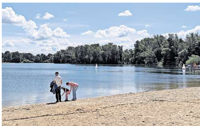
Der Eixer See ist wieder frei gegeben. Doch Badegäste bleiben noch aus.

Blaualgen scheiden Giftstoffe aus, die bei Menschen durch Verschlucken und Hautkontakt Übelkeit, Erbrechen, Durchfall, Gliederschmerzen, Bindehautentzündungen, Ohrenschmerzen und Atemwegserkrankungen auslösen. Sogenannte Blaualgen-Blüten treten vor allem bei hohen Wassertemperaturen auf. „Hier ist aber niemand besorgt“, meint Schwarznecker. Auch die Rettungsschwimmerinnen und Rettungsschwimmer haben keine Bedenken, in das Wasser zu gehen – notfalls auch, wenn der See wegen einer hohen Bakterien-Konzentration gesperrt ist.