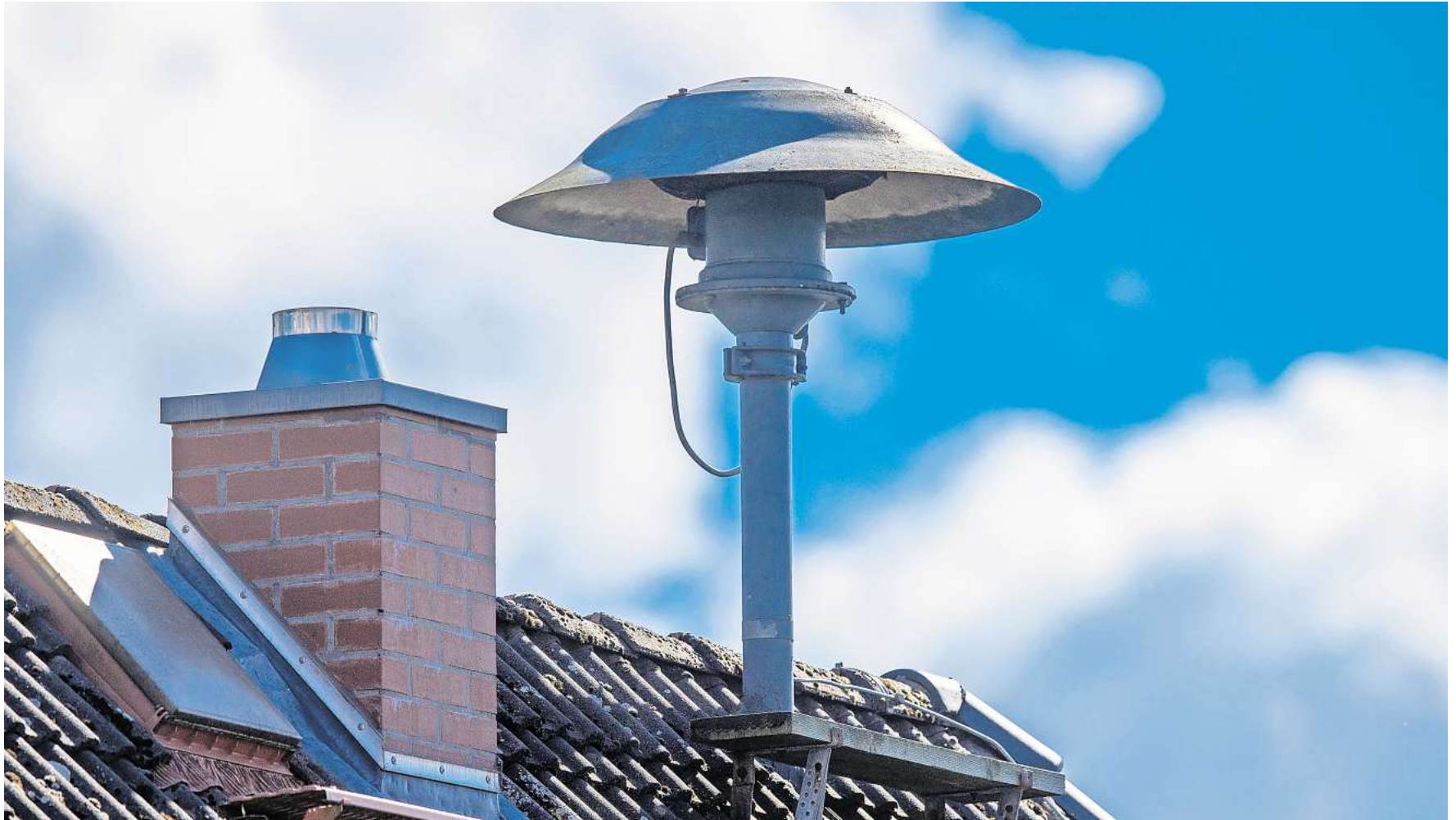
Früher gab es im Kreis Peine deutlich mehr Sirenen als heute. Um die Bevölkerung im Katastrophenfall warnen zu können, sollen neue Sirenenstandorte geschaffen werden.