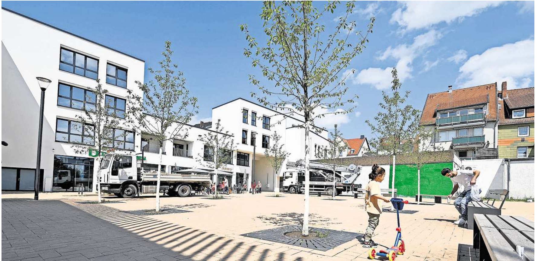
Der Platz östlich vor dem Edeka-Center soll zu Ehren des früheren Stadtdirektors „Dr.-Willy-Boß-Platz“ heißen.