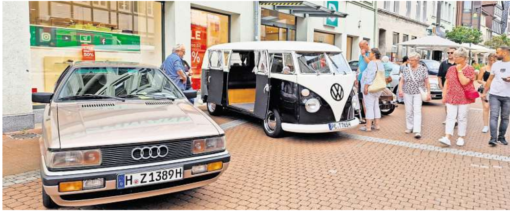
Neben neuen Autos sind beim Brawo Mobility Summer auch Oldtimer in der Innenstadt ausgestellt.