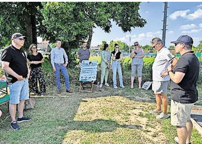
Die neue Boule in Vechelde: Der erste Test verlief erfolgreich.