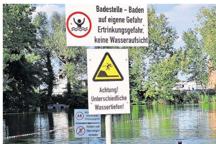
Am Pfannteichbad in Hohenhameln weist ein Schild darauf hin, dass es keine Wasseraufsicht gibt.

Hintergrund: Der Pfannteich in Hohenhameln wird in diesem Jahr zum zweiten Mal nach 2023 als Badestelle betrieben. Das heißt, es wird kein Eintritt erhoben, es gibt aber auch keine Attraktionen, keine Badeaufsicht und der Aufenthalt und das Baden erfolgen auf eigene Gefahr. Geöffnet ist täglich von 9 bis 19 Uhr. Neben dem See gibt es ein Beachvolleyball-Feld, eine Tischtennisplatte, Spielgeräte und einen Kioskverkauf.