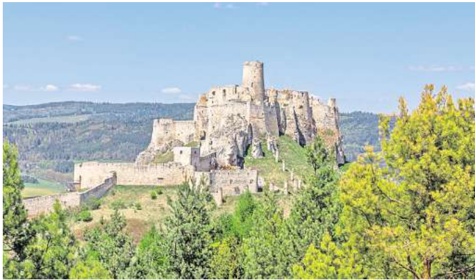
Die Burg Spišský hrad im Osten der Slowakei gehört zu den schönsten des Landes.

Mit der Hohen Tatra stellt die Slowakei sogar einen Rekord auf, denn hierbei handelt es sich um das kleinste Hochgebirge der Welt. Der Anblick im Norden des Landes erinnert an die Alpen und es gibt insgesamt 24 Gipfel, die über 2500 Meter hoch sind. Gleichzeitig ist es auch der älteste Nationalpark der Slowakei und gilt als solcher seit 1949. Du findest hier Latschenkiefern, Zirbelkiefern und sogar die seltene Blume Alpenedelweiß. Auch Braunbären, Gämse und Murmeltiere fühlen sich hier wohl.