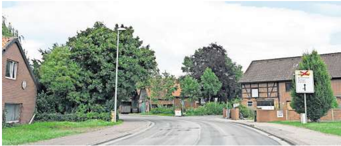
Die Bauarbeiten an der Ortsdurchfahrt Mehrum sind weitgehend abgeschlossen. Jetzt folgt der zweite Bauabschnitt.

In Mehrum wurde der erste von zwei Abschnitten fertiggestellt. „Ursache für die zeitlichen Verschiebungen bei der Baumaßnahme sind zusätzliche Arbeiten und die Niederschläge in den vergangenen Wochen, welche die Arbeiten zeitweise stark beeinträchtigt haben und somit die ursprüngliche Terminplanung nicht umsetzbar machten“, erklärt der Leiter der zuständigen Landesbehörde für Straßenbau und Verkehr in Wolfenbüttel. Die Arbeiten auf dem zweiten Abschnitt zwischen der Triftstraße