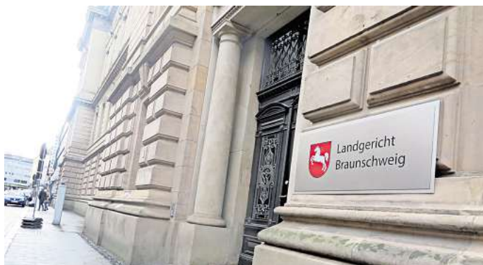
Das Landgericht Braunschweig: Hier wird der Fall verhandelt.