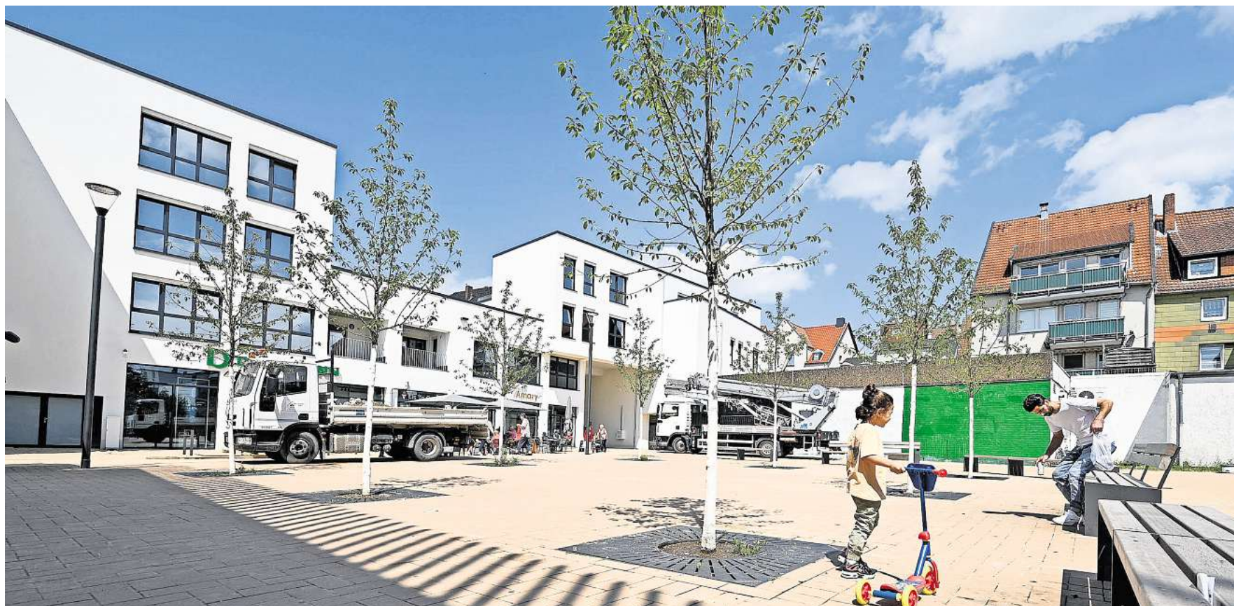
Der Platz östlich vor dem Edeka-Center soll zu Ehren des früheren Stadtdirektors „Dr.-Willy-Boß-Platz“ heißen.