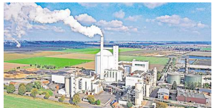
Von der Zuckerfabrik Clauen wehen faulige Gerüche in die Ortschaften Clauen und Soßmar – Schuld sind Probleme bei den Schlammteichen (rechts).

Vor allem bei Westwind – die in Soßmar gängige Windrichtung – würden die Gerüche stark ins Dorf ziehen. „Einige Anwohnende beschwerten sich massiv“, schildert Strübe, der grundsätzlich Verständnis für die Situation hat. „Irgendwann ist aber ein Punkt überschritten. Ich erwarte, dass bei der Veranstaltung Maßnahmen vorgestellt werden, die schnellstmöglich wirken.“