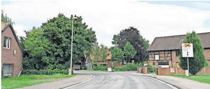
Die Bauarbeiten an der Ortsdurchfahrt Mehrum sind weitgehend abgeschlossen. Jetzt folgt der zweite Bauabschnitt.

In Mehrum wurde der erste von zwei Abschnitten fertiggestellt. „Ursache für die zeitlichen Verschiebungen bei der Baumaßnahme sind zusätzliche Arbeiten und die Niederschläge in den vergangenen Wochen, welche die Arbeiten zeitweise stark beeinträchtigt haben und somit die ursprüngliche Terminplanung nicht umsetzbar machten“, erklärt der Leiter der zuständigen Landesbehörde für Straßenbau und Verkehr in Wolfenbüttel. Die Arbeiten auf dem zweiten Abschnitt zwischen der Triftstraße