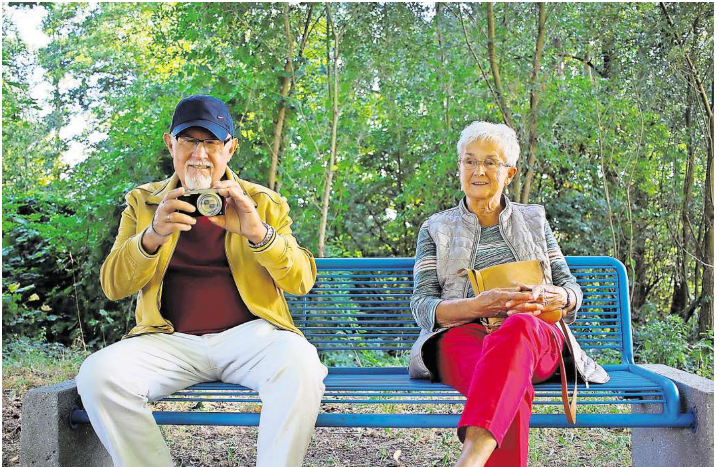
Mehr als die Hälfte der Menschen, die noch nicht im Ruhestand sind, würden am liebsten bis maximal 63 Jahre arbeiten.

Die Studienmacher wollten auch wissen, wie die Befragten zu einer Steigerung des Rentenniveaus stehen, das aktuell bei 48 Prozent liegt. 67 Prozent fanden, dass es steigen müsste – auch wenn das etwas höhere Rentenbeiträge bedeuten könnte. 13 Prozent waren unsicher und gaben „weiß nicht“ an, 11