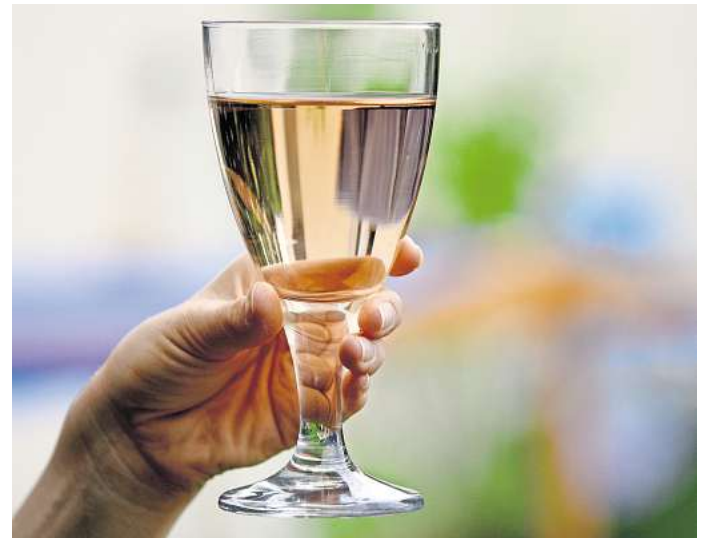
13.06.2019 Themenfoto Alkohol und durch Alkohol geschädigte Kinder.

Direkt zur Umfrage: Einfach den QR-Code mit dem Handy scannen.