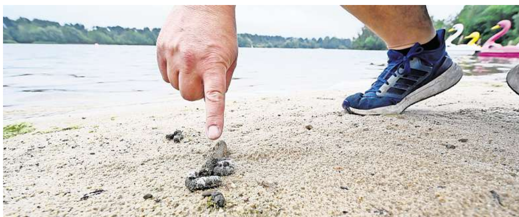
Besucher des Eixer Sees beschwerten sich über Gänse-Kot am Strand, auf dem Spielplatz und den Liegewiesen.

Neben kurzfristig angedachten Vergrämnungsmaßnahmen wird parallel an einem dauerhaften Konzept gearbeitet, das die Belange des Schutzgebietes berücksichtigt, ohne die Aufenthaltsqualität am See zu schmälern. Insbesondere das Einbringen von Schwimm- und Folienbarrieren in und an dem See sowie Begehungsverbote bestimmter, den Gänsen vorbehalten Seebereiche soll vermieden werden. Auch von der Wito geht die dringende Bitte an die Besucher des Sees, die Wildgänse nicht zu füttern.