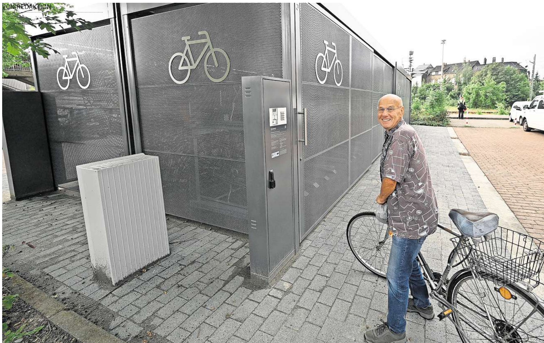
Die neuen Fahrradboxen am Peiner Bahnhof: Der Bund hat zur Finanzierung rund 360.000 Euro dazugegeben.

Neue Abstellanlage umfasst 96 Plätze – Gesamtkosten belaufen sich auf 420.000 Euro