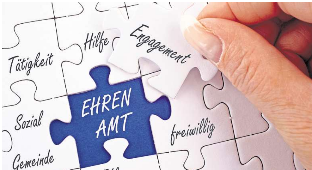
Wer eine ehrenamtliche Betätigung sucht, findet bei der Freiwilligen-Agentur Unterstützung.

Und die sind überaus vielfältig: Man kann ehrenamtlich eine gesetzliche Betreuung übernehmen, den Weltladen mit Ladenständen unterstützen, sich in einem Sportverein oder einer sozialen Institution engagieren