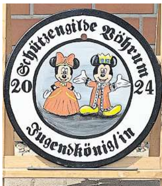
Königsscheibe des Jugendkönigs.