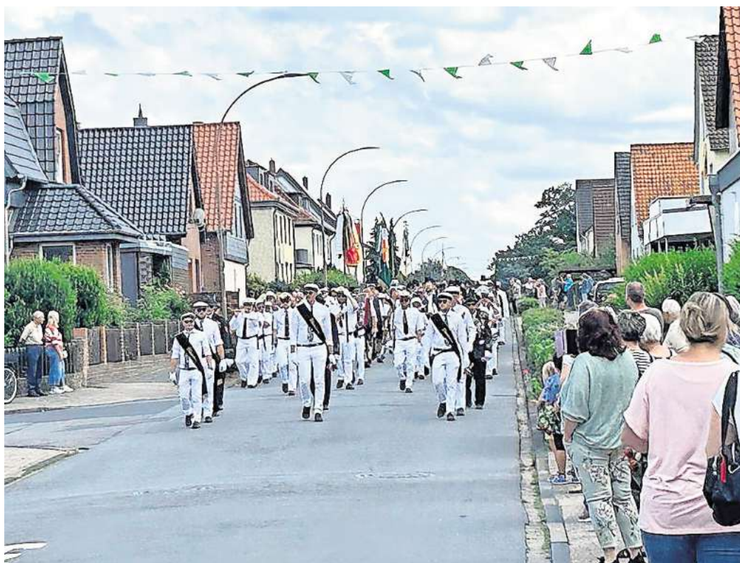
Der traditionelle Schützenausmarsch ist ein Highlight des Festes.