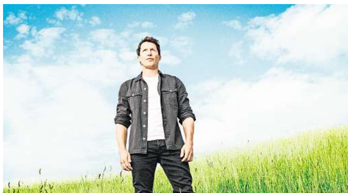
Tritt in der Autostadt auf: James Blunt startete seine Karriere im Jahr 2005 mit seinem Debütalbum „Back To Bedlam“ und dem Megahit „You're Beautiful“.

Die PAZ verlost einmal zwei Tickets für dieses Konzert und der glückliche Gewinner oder die glückliche Gewinnerin erlebt gemeinsam mit einer Begleitperson den Auftritt des Ausnahmekünstlers James Blunt und dessen mitreißende Songs live, hautnah und sogar gratis! Was Sie tun müssen, um die Tickets zu gewinnen? Scannen Sie ein-