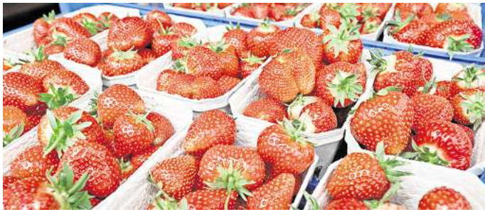
Erdbeeren auf einem Wochenmarkt: Der Ökolandbau in Niedersachsen wächst weiter.

Wir würden gerne von Ihnen wissen: Wie oft kaufen Sie Bioprodukte ein? Nehmen Sie an unserer Umfrage teil und gewinnen Sie einen 50-Euro-Gutschein von