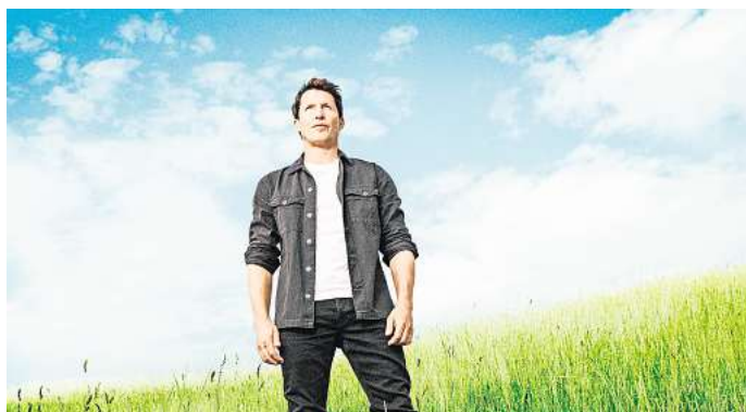
Tritt in der Autostadt auf: James Blunt startete seine Karriere im Jahr 2005 mit seinem Debütalbum „Back To Bedlam“ und dem Megahit „You're Beautiful“.

Die PAZ verlost einmal zwei Tickets für dieses Konzert und der glückliche Gewinner oder die glückliche Gewinnerin erlebt gemeinsam mit einer Begleitperson den Auftritt des Ausnahmekünstlers James Blunt und dessen mitreißende Songs live, hautnah und sogar gratis! Was Sie tun müssen, um die Tickets zu gewinnen? Scannen Sie ein-