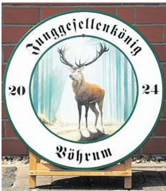
Königsscheibe des Jungesellenkönigs.

11.30 Uhr: Königsfrühstück 16.00 Uhr: Bunter Umzug 20.00 bis 2.00 Uhr: Tanz mit DJ Kai Nürnberger