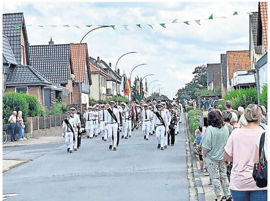
Der traditionelle Schützenausmarsch ist ein Highlight des Festes.