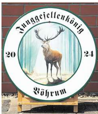
Königsscheibe des Jungesellenkönigs.

11.30 Uhr: Königsfrühstück 16.00 Uhr: Bunter Umzug 20.00 bis 2.00 Uhr: Tanz mit DJ Kai Nürnberger