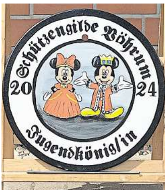
Königsscheibe des Jugendkönigs.