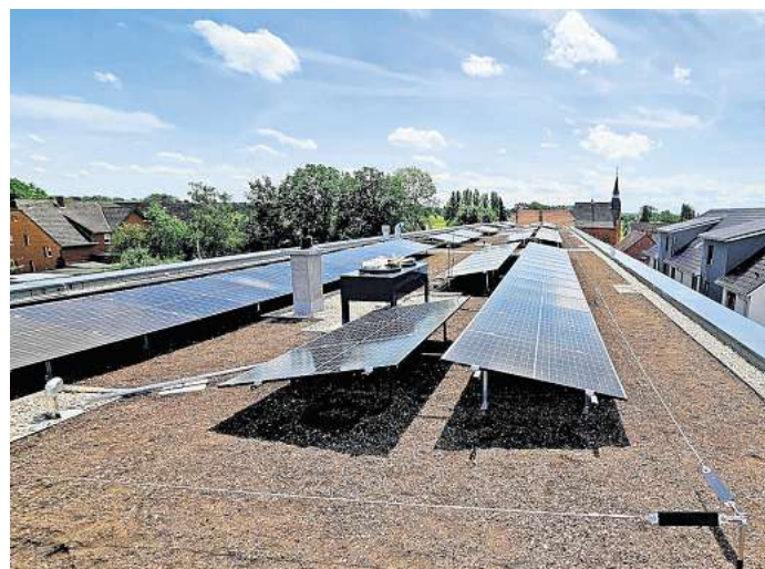
Die Grundschule in Essinghausen hat gerade Solarmodule erhalten.

Für die Mitarbeiter des Peiner Rathauses stehen bei den Dienstwagen zwei E-Autos sowie ein Hybrid-Fahrzeug zur Verfügung. Zudem werden acht elektrische Fahrzeuge im Bereich der Städtischen Betriebe genutzt. Auch ein E-Dienstfahrrad gehört zum Fuhrpark. „Eine weitere Elektrifizierung des Fahrzeugbestands wird sicherlich stattfinden“, blickt Stadtsprecherin Petra Neumann voraus. Es ist also noch Luft nach oben.