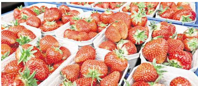
Erdbeeren auf einem Wochenmarkt: Der Ökolandbau in Niedersachsen wächst weiter.

Wir würden gerne von Ihnen wissen: Wie oft kaufen Sie Bioprodukte ein? Nehmen Sie an unserer Umfrage teil und gewinnen Sie einen 50-Euro-Gutschein von