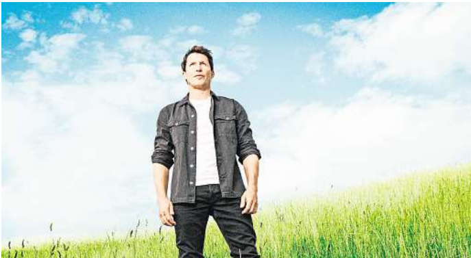
Tritt in der Autostadt auf: James Blunt startete seine Karriere im Jahr 2005 mit seinem Debütalbum „Back To Bedlam“ und dem Megahit „You’re Beautiful“.

chert. Doch nicht nur musikalisch hat James Blunt einiges zu bieten, auch sein trockener, selbstironischer und britischer Humor begeistert seine Fans. In wenigen Tagen, am 4. August, kommt der erfolgreiche Musiker zum Sommerfestival 2024 in die Wolfsburger Autostadt. Die PAZ verlost einmal zwei Tickets für dieses Konzert und der glückliche Gewinner oder die glückliche Gewinnerin erlebt gemeinsam mit einer Begleitperson den Auftritt des Ausnahmekünstlers James Blunt und dessen mitreißende Songs live, hautnah und sogar gratis! Was Sie tun müssen, um die Tickets zu gewinnen? Scannen Sie ein-