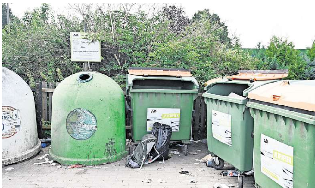
Die Wertstoffinsel am Saarlandring in Telgte gilt als Hotspot, wenn es um wild entsorgten Müll geht.

Liebe Leser, wenn Sie eine verschmutzte Wertstoffinsel sehen, mailen Sie bitte Fotos und eine genaue Standortbeschreibung an redaktion@paz-online.de .