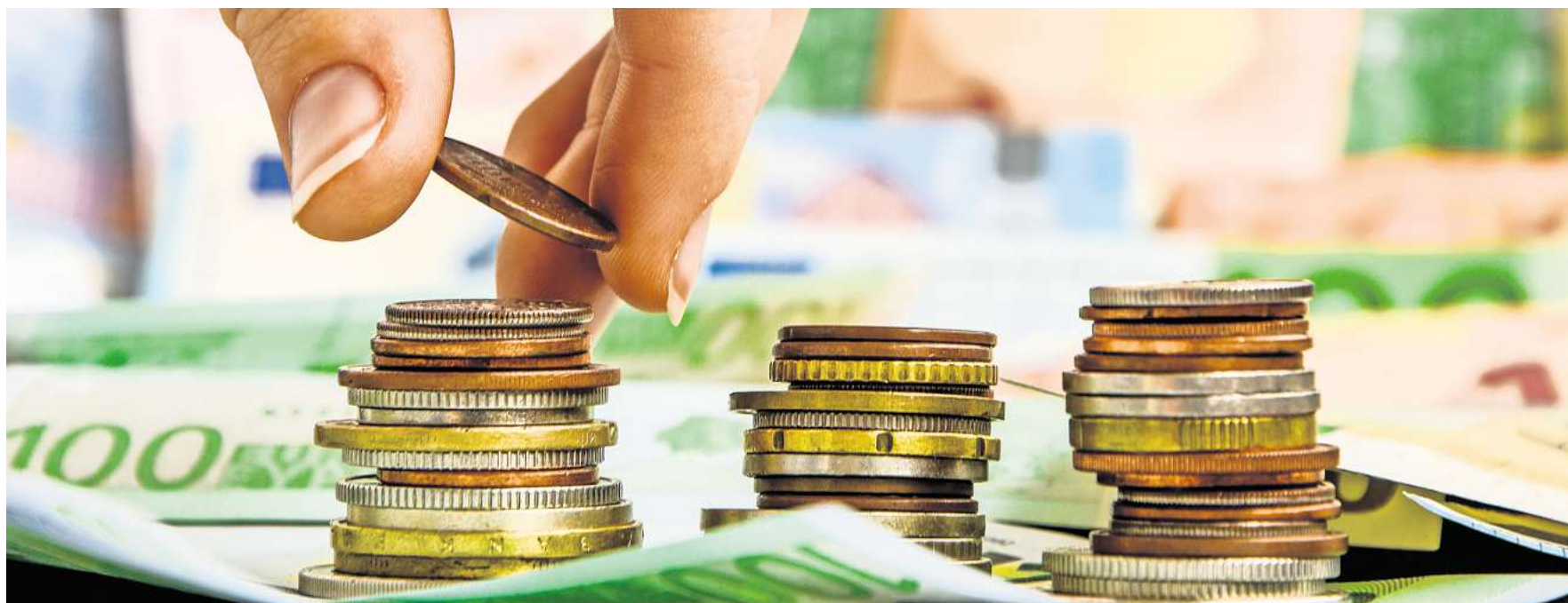
Ein Mann hat vom Jobcenter in Peine Sozialleistungen beantragt, obwohl dieses für ihn gar nicht zuständig war.

Gerichtsurteil: Einschlägig vorbestrafter 55-Jähriger hat vorsätzlich einen Wohnortwechsel nicht angezeigt