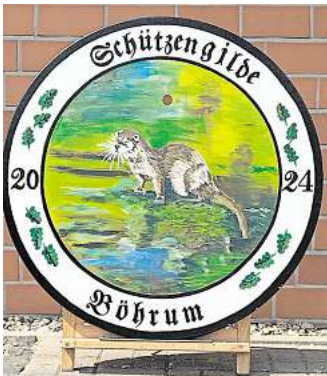
Königsscheibe des Gildekönigs.