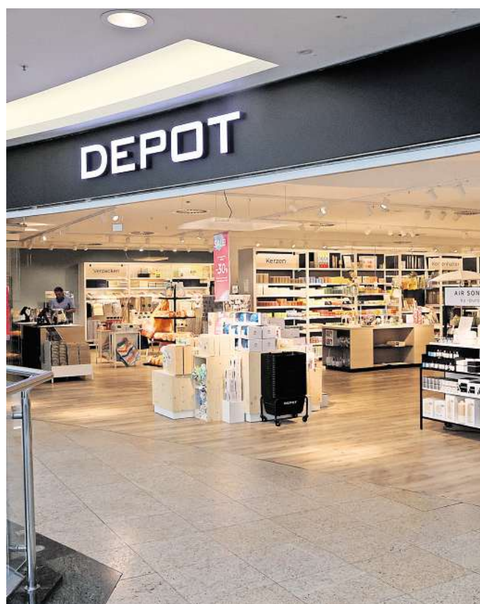
Die Filiale von Depot in der City-Galerie in Wolfsburg. Erst im Herbst war das Geschäft umgezogen.

Nach Unternehmensangaben erwirtschaftete die Gries Deco Company GmbH zuletzt einen Umsatz von rund 390 Millionen Euro. Angaben zu Gewinn oder Verlust wurden nicht gemacht. Zum Unternehmen zählten etwa 4.400 Beschäftigte und mehr als 300 Filialen in Deutschland.