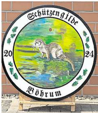
Königsscheibe des Gildekönigs.