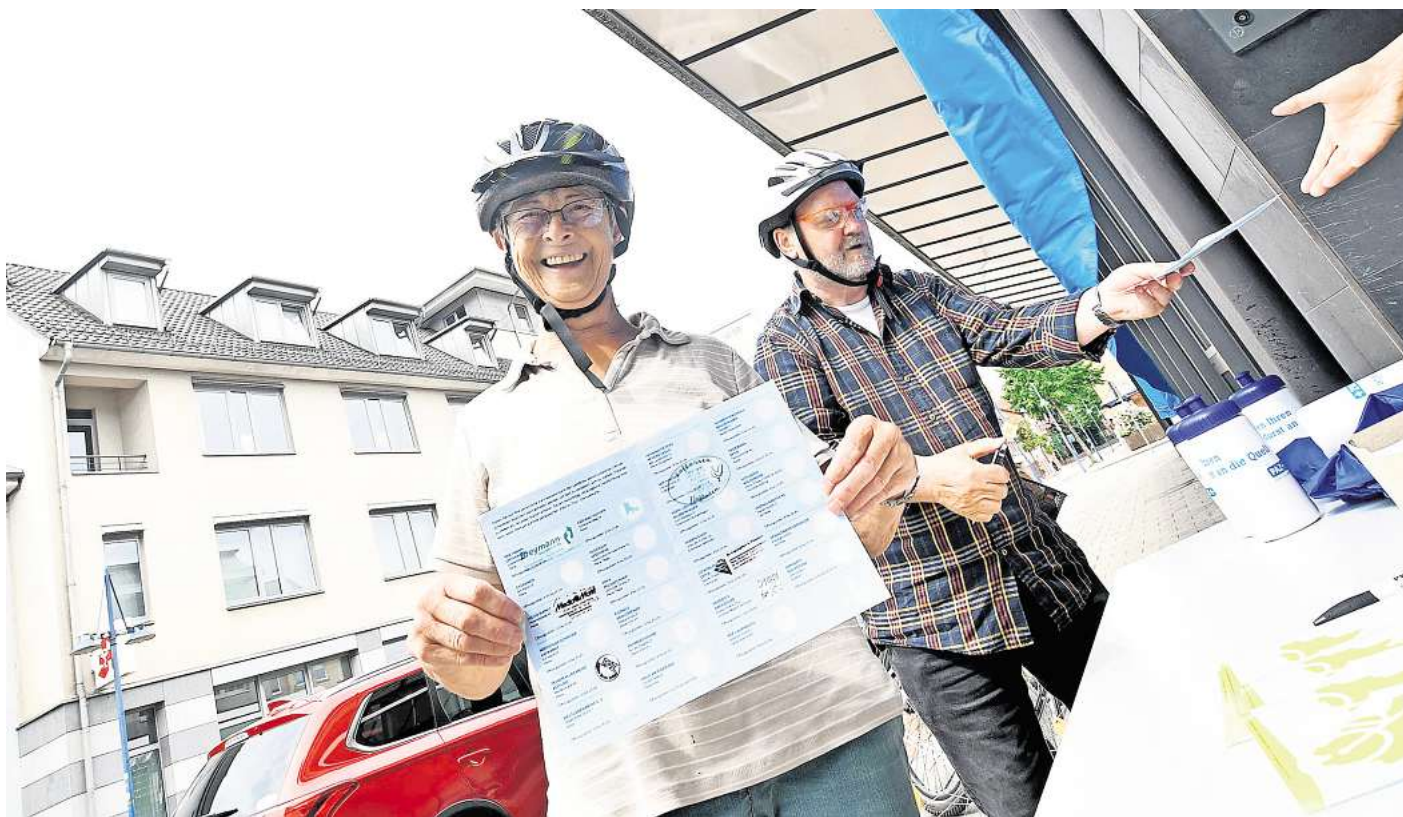
Das Verlagsgebäude der PAZ ist wieder eine beliebte Stempelstation.

Der PAZ liegt am Samstag eine zwölfseitige Sonderveröffentlichung bei, in der die teilnehmenden Einzelhändler und Betriebe der „PAZ on