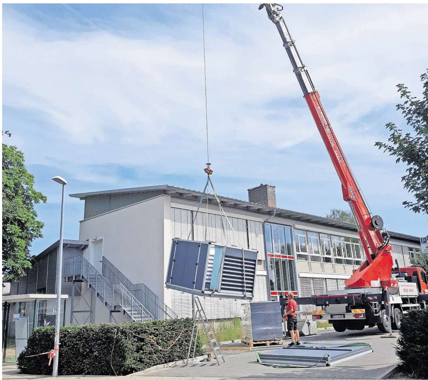
Zur energetischen Heizungsanierung erhält die Grundschule Lengede eine Wärmepumpe.