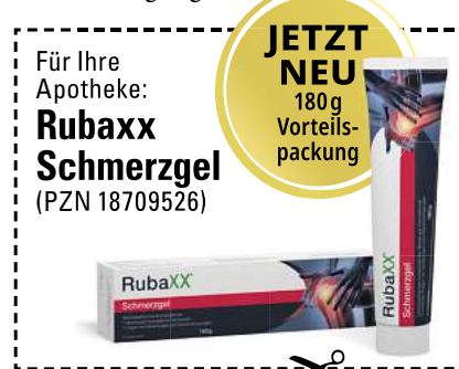
Abbildung Betroffenen nachempfunden, Namen geändert

stoff Linderung. Rubaxx Schmerzgel bietet wirksame und gut verträgliche Hilfe aus der Natur. Es lässt sich gezielt auf den zu behandelnden Stellen auftragen und ist auch zur Anwendung bei chronischen Schmerzen geeignet.