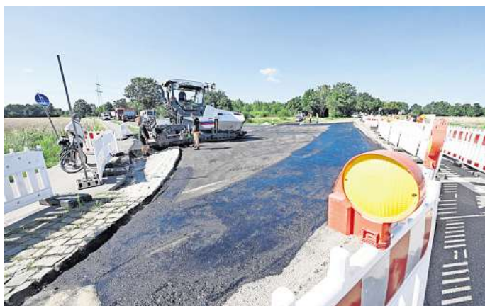
Die Bauarbeiten am Abzweig in Richtung Handorf und Bülten laufen.

Die Umleitung für die Kreisstraße erfolgt im Osten über Groß Ilsede und Klein Ilsede zurück zu B65 und im Westen über Solschen. Der Geradeausverkehr hingegen hat in beide Rich-