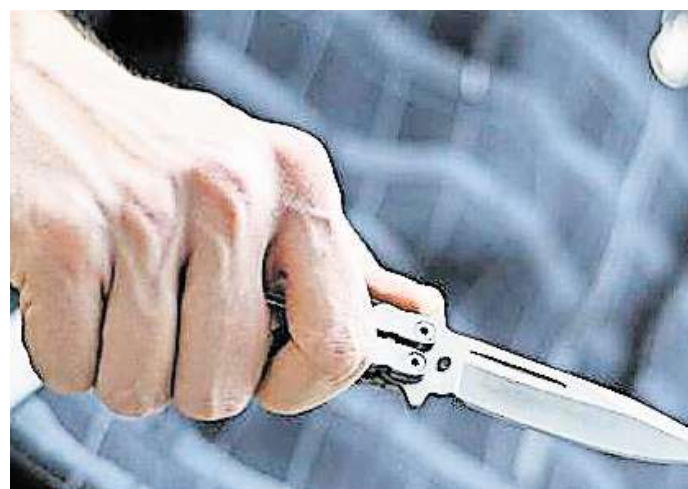
Gestellte Szene: Ein Mann schwingt ein Messer.

Fortsetzungstermine sind am 16. (9 Uhr) und 22. August (10 Uhr) jeweils im Saal 134.