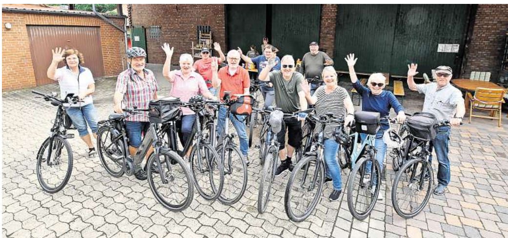
„PAZ on Tour“-Radfahrer können wie die Gruppe „Tisch 8“ mit Damen durchs Peiner Land radeln.

Zudem erhalten die Fahrrad- und E-Bikefahrer heute dort ihre Stempel für die Gewinnspiel-Karte, die bei allen teilnehmenden Stationen erhältlich ist und unter www.paz-online.de/ontour beziehungsweise über den QR-Code auch selbst ausgedruckt werden kann. Eine feste Route gibt es nicht, jeder Teilnehmer kann nach Lust und Laune losra-