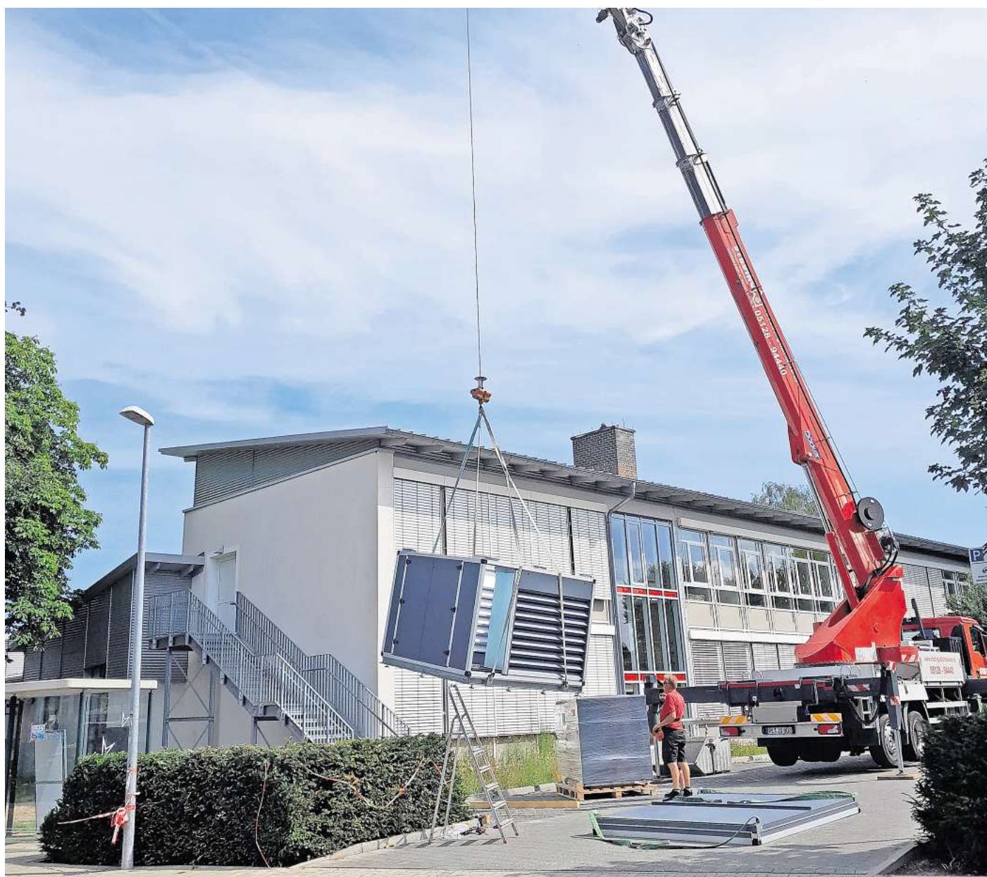
Zur energetischen Heizungssanierung erhält die Grundschule Lengede eine Wärmepumpe.