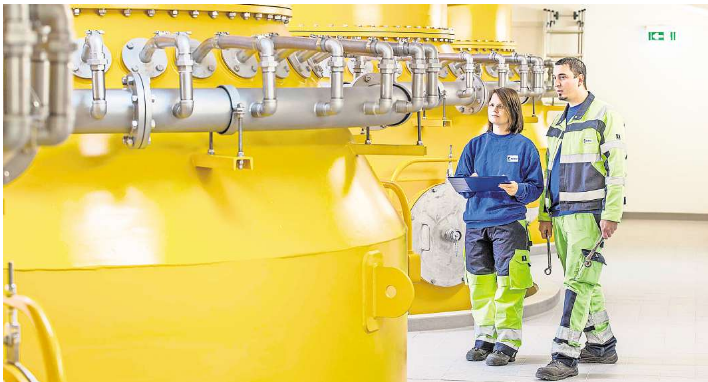
Fachkräfte des Wasserverbands Peine im Wasserwerk: Die Trinkwasserversorgung ist ein wichtiger Teil der kommunalen Daseinsvorsorge.