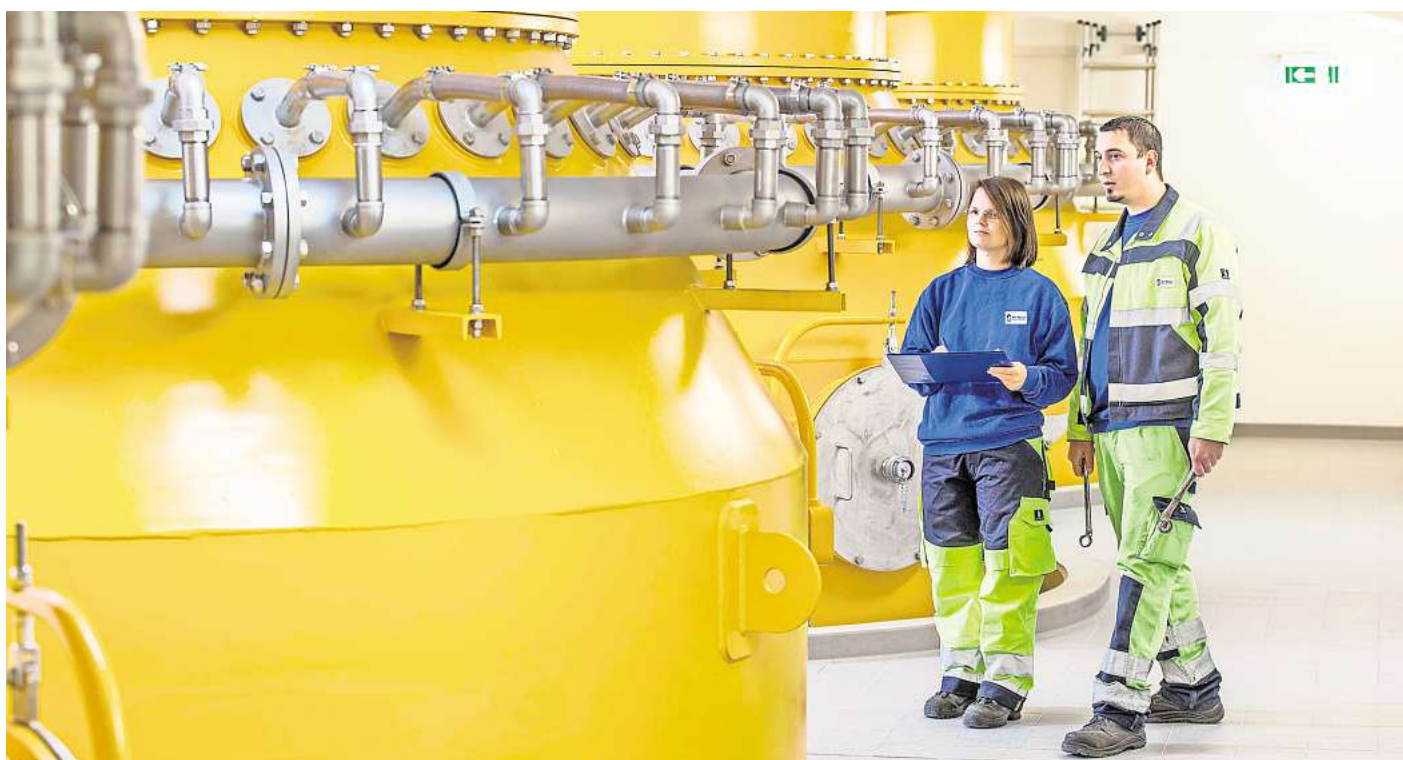
Fachkräfte des Wasserverbands Peine im Wasserwerk: Die Trinkwasserversorgung ist ein wichtiger Teil der kommunalen Daseinsvorsorge.