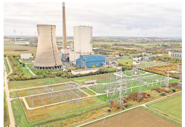
Blick auf das alte 220-Kilovolt-Umspannwerk in Mehrum.

führt werden, um den Verkehr auf der Triftstraße nicht zu belasten.