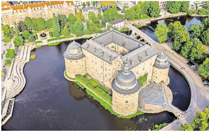
Das Schloss von Örebro ist eines der bekanntesten Wahrzeichen der Stadt.

Wann genau das Schloss errichtet wurde, weiß bis heute niemand, wohl aber, dass ab dem 13. Jahrhundert eine Festungsanlage vor Ort entstand. Das Ge-