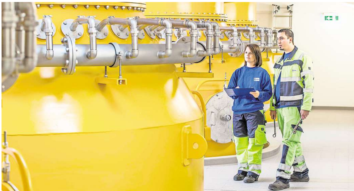
Fachkräfte des Wasserverbands Peine im Wasserwerk: Die Trinkwasserversorgung ist ein wichtiger Teil der kommunalen Daseinsvorsorge.