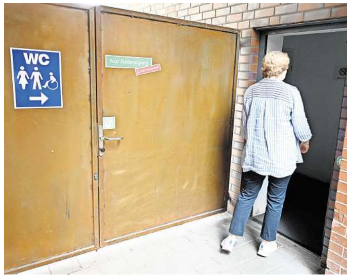
Welcher Zustand mag einen hier erwarten? Die Suche nach öffentlichen Toiletten gestaltet sich schwierig.

An insgesamt acht Standorten betreibt die Peiner Stadtverwaltung öffentliche und kostenlose WC-Anlagen, die auch für Men-