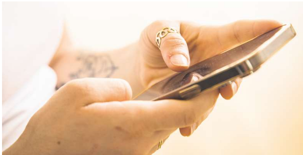
Die Betrugsvideos landen auch auf dem Smartphone.