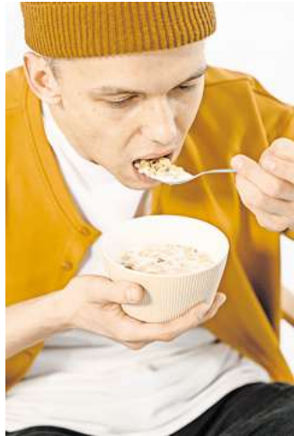
Ungesund: Wer sein Essen runterschlingt und wenig kaut, tut seinem Körper nichts Gutes.

Wenn ich meine Sättigungssignale besser wahrnehme, weil ich besser kaue, dann esse ich insgesamt kleinere Portionen. Wenn ich