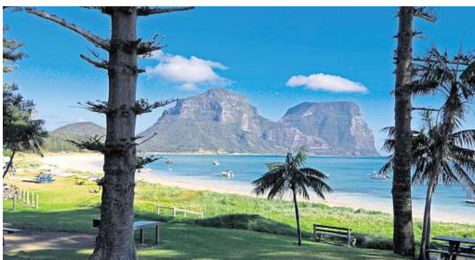
Naturidylle und Strandparadies: Hinter Lagoon Beach auf Lord Howe Island ragen die spektakulären Berge im Süden der Insel empor.

Die Bilder von den malerischen Stränden und dschungelüberwucherten Bergen faszinieren viele Touristinnen und Touristen. Doch die Inselbewohnerinnen und Inselbewohner lassen sie schlichtweg nicht hinein.