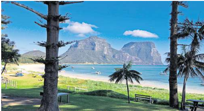
Naturidylle und Strandparadies: Hinter Lagoon Beach auf Lord Howe Island ragen die spektakulären Berge im Süden der Insel empor.

Die Bilder von den malerischen Stränden und dschungelüberwucherten Bergen faszinieren viele Touristinnen und Touristen. Doch die Inselbewohnerinnen und Inselbewohner lassen sie schlichtweg nicht hinein.