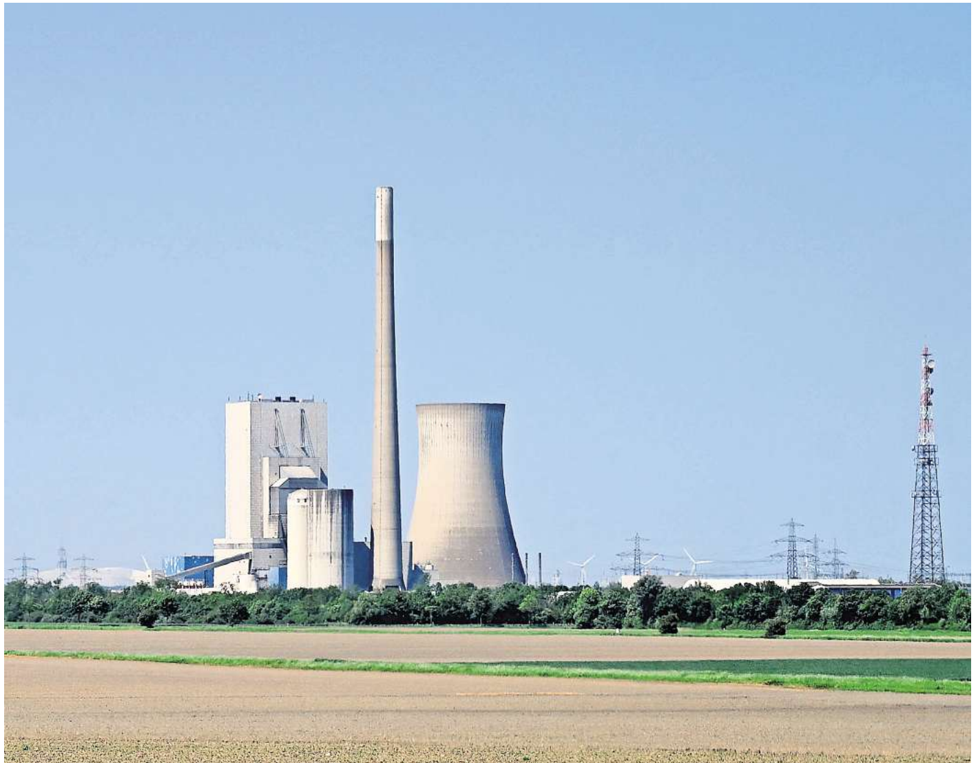
Noch ist das Kraftwerk mit Kühlturm, Schornstein, Aschesilos und dem eckigen Kesselhaus weithin zu sehen. Doch das wird sich in absehbarer Zeit ändern.

Wenn es nach Fieber geht, könnte auf einem zurzeit brachliegenden Teilbereich des Kraftwerksgeländes eine neue Anlage entstehen: Seit Längerem ist der