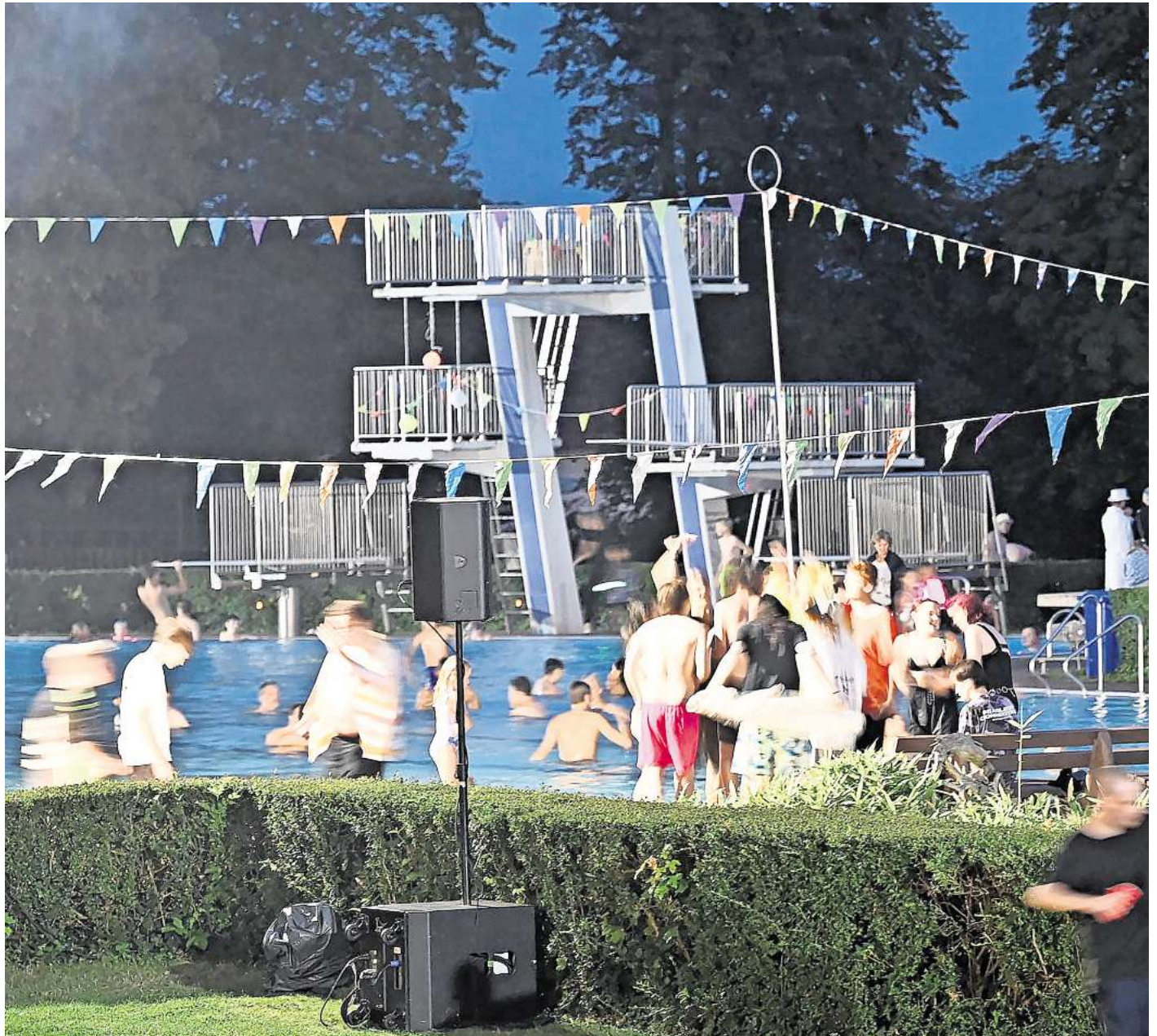
Festlich geschmückt und stimmungsvoll beleuchtet: Im Freibad am Bolzberg in Gadenstedt wurde gefeiert.

„Als das Bad eingeweiht wurde, war ich zwölf Jahre alt, ich habe die ganze Historie mitverfolgt und fühle eine große Loyalität. Deshalb ist es mir ein Anliegen, es zu unterstützen“, sagt er. Anschaffungen wie vor einigen Jahren die Wasserrutsche, kleine dezentrale Umkleidekabinen auf dem Gelände und ganz aktuell neue Fahrradbügel würden gesponsert, aber auch sportliche Angebote. So übernimmt der Verein derzeit die Kosten für die Ausbildung einer Übungsleiterin für Wassergym-