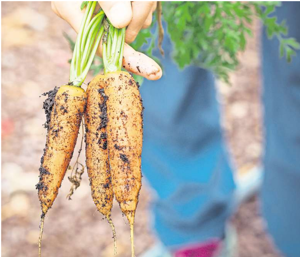
Die ökologisch bewirtschaftete Fläche in Niedersachsen ist 2023 nach Angaben des Landwirtschaftsministeriums gewachsen – um etwa vier Prozent auf rund 154.000 Hektar.

Niedersachsen belegt deutschlandweit nach Bayern und Baden-Württemberg Platz drei bei der Anzahl der ökologisch wirtschaftenden Land-