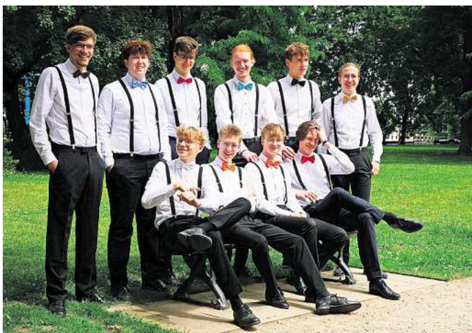
Das Männerchor-Ensemble Sonus Aeternus gibt ein Konzert.