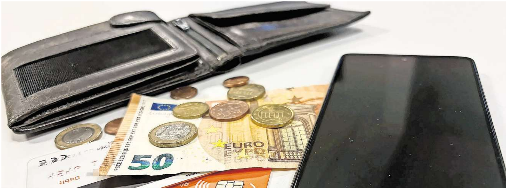
Bargeld, EC-Karte, Smartphone: Welche Zahlungsart bevorzugen Sie?