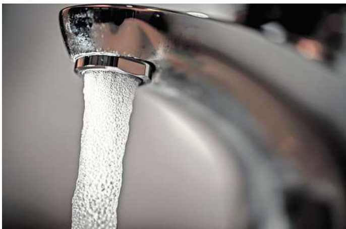
Trinkwasser läuft aus einem Wasserhahn. Es gibt neue Leitungen in Solschen.

Sprecherin Sandra Ramdohr sagt: „Da die Arbeiten in offener Bauweise mit entsprechendem Straßenaufbruch erfolgen, wird der Verkehr entsprechend des Baufortschritts gesteuert. Rund 440.000 Euro investieren wir in diese nachhaltig wirkende Infrastrukturmaßnahme. In der Bau-phase bleibt die Wasserversorgung über das bestehende Leitungsnetz gesichert. Lediglich beim Anschluss der Hausleitungen an den neuen Rohrverlauf kommt es zu einer kurzzeitigen Unterbrechung der Versorgung