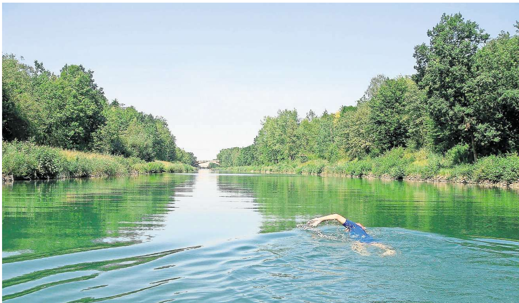
Wer im Mittellandkanal schwimmen möchte, muss zu seiner eigenen Sicherheit einiges beachten.

Wasserqualität wird nur an Badegewässern überprüft – Am Mittellandkanal lauern allerhand Gefahren