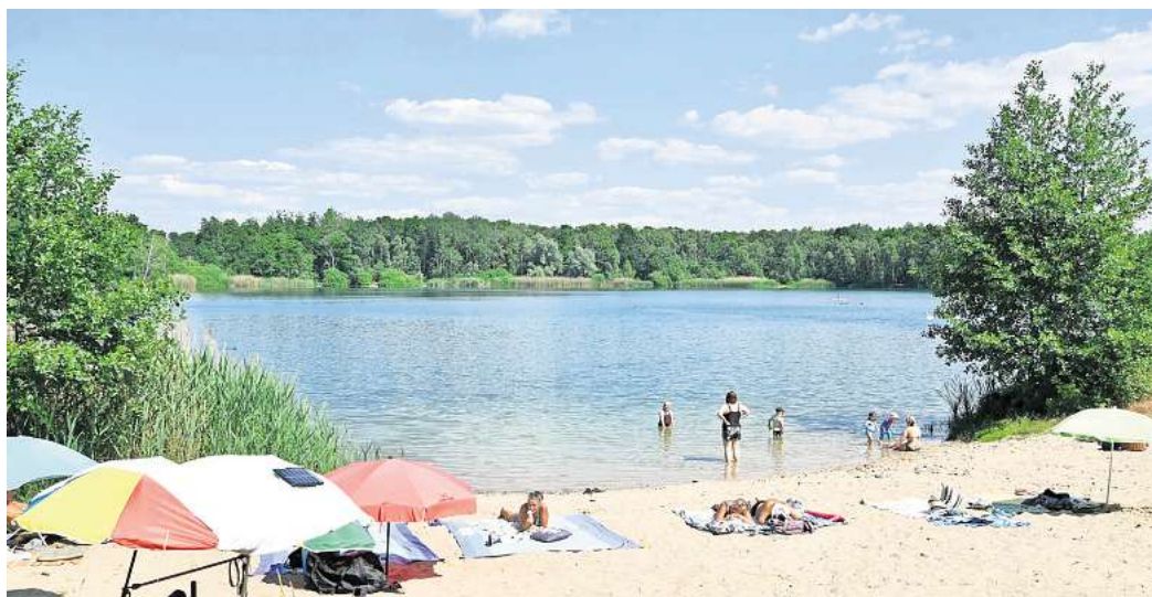
Nicht nur der Wehnsee bietet im Kreis Peine Abkühlung während der Sommertage.

Die PAZ ruft alle Wasserratten und Sonnenanbeter dazu auf, uns ihre Vorschläge für den schönsten und besten Badensee der Region zu schicken. Welcher ist Ihr Lieblings-Badensee? Mit welchem Freizeitangebot punktet ihr Lieblingsort für heiße Sommertage? Wasser-Ski? Stand-up-Paddling? Beachvolleyball? Zählt für Sie die Zahl der