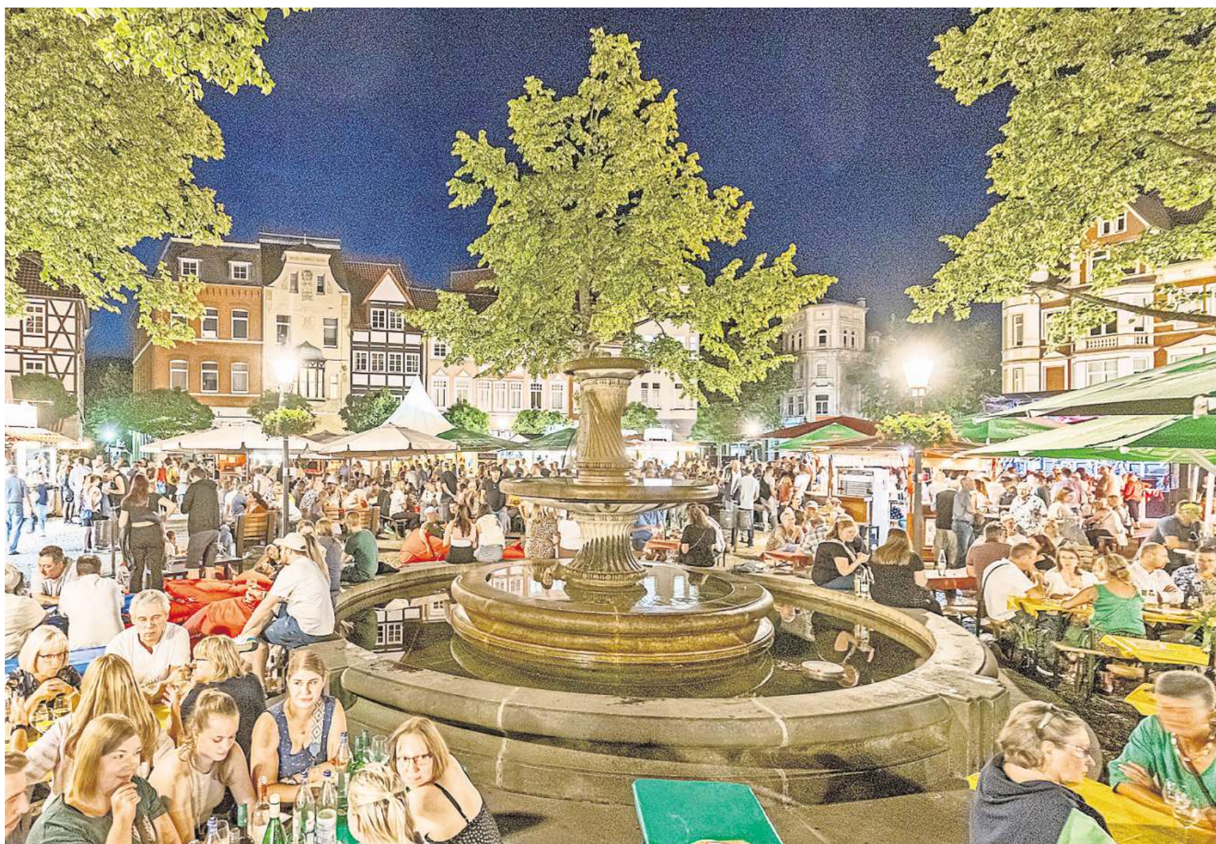
Das Weinfest in Peine lockt jedes Mal zahlreiche Besucherinnen und Besucher auf den historischen Marktplatz.

Weine aus der Region und der Pfalz – Kulinarische Spezialitäten und Musik