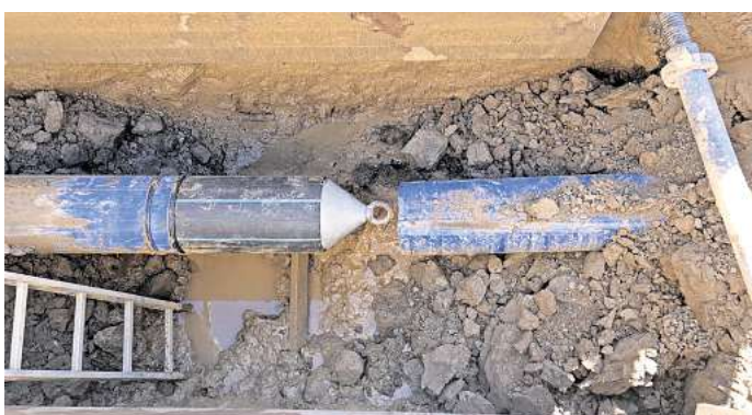
Neue Trinkwasserleitungen werden verlegt.