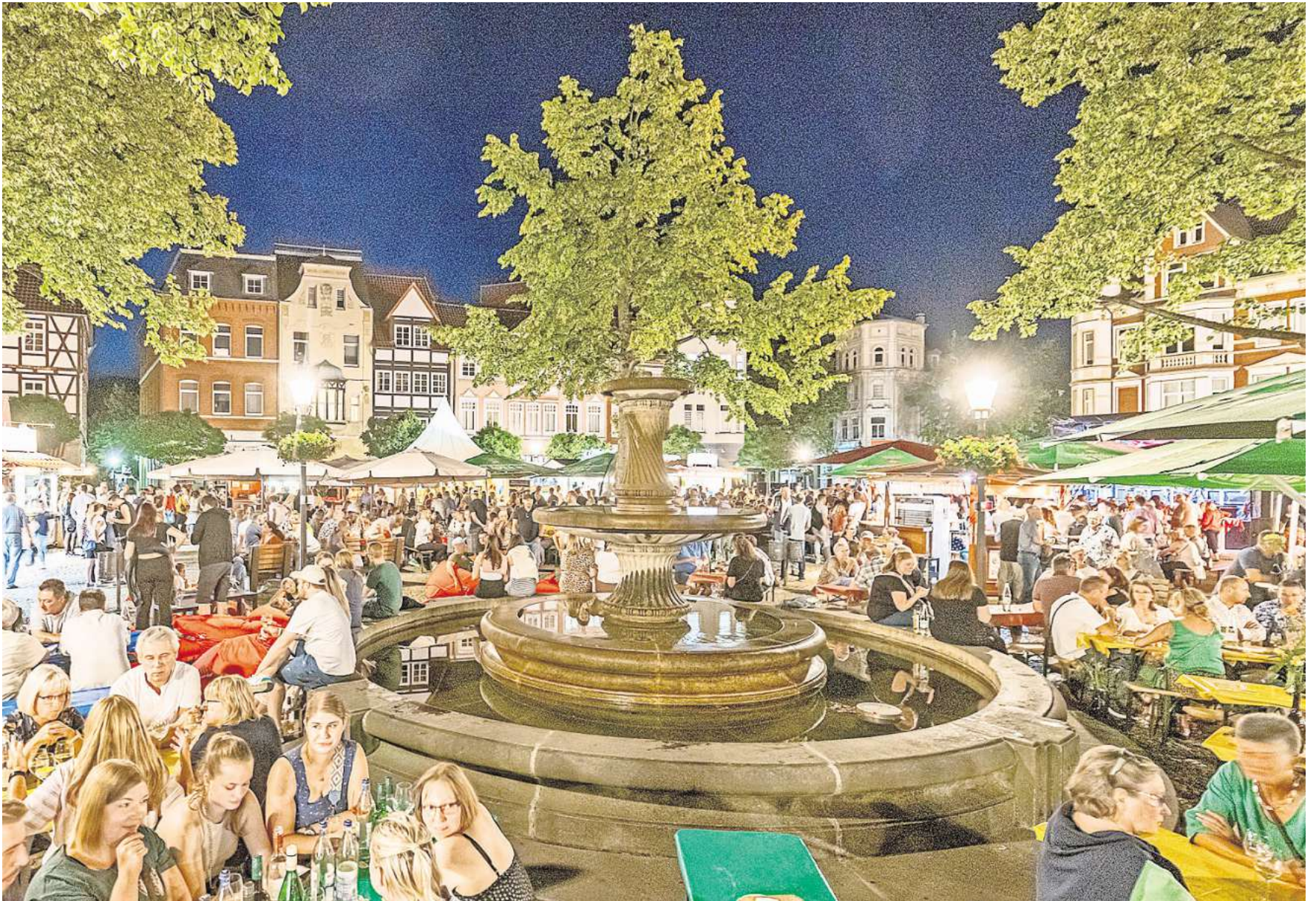
Das Weinfest in Peine lockt jedes Mal zahlreiche Besucherinnen und Besucher auf den historischen Marktplatz.

Weine aus der Region und der Pfalz – Kulinarische Spezialitäten und Musik