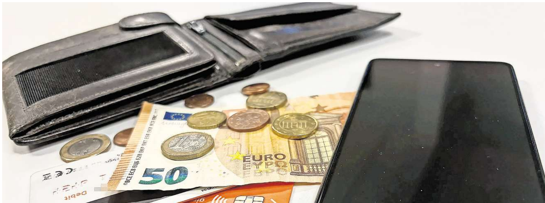
Bargeld, EC-Karte, Smartphone: Welche Zahlungsart bevorzugen Sie?