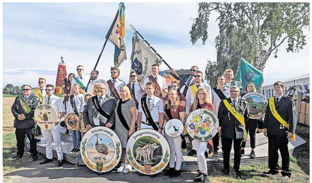
Das Eixer Königshaus 2022/23: Die Nachfolger der noch amtierenden Würdenträger werden am kommenden Wochenende proklamiert.

Eine Sonderveröffentlichung von Hallo Wochenende