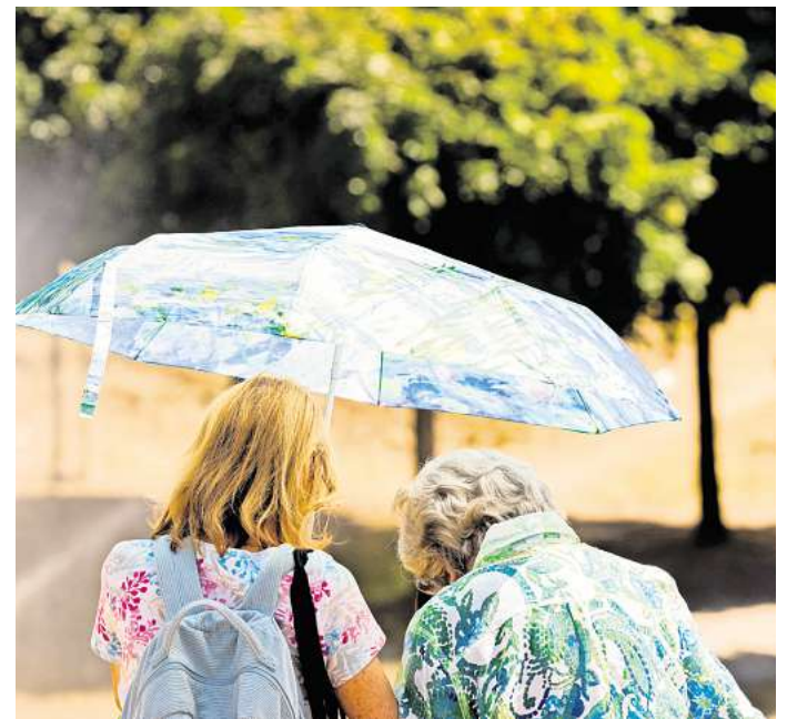
Hitzewarnung: Vor allem ältere Menschen leiden unter extremen Temperaturen.

Die Stadt Wolfsburg weist zum Thema Hitze und Senioren auf den „Hitzeknigge“, der unter anderem auf ihren Internetseiten zu finden ist. Auch er bietet „Tipps für heiße Tage“: von der Vermeidung körperlicher Aktivitäten über „leichtes, frisches und kühles Essen“, luftige Kleidung sowie eine Kühlung des Körpers