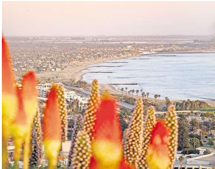
Vom Serra Cross Park aus kannst du einen herrlichen Blick über die Pazifikküste genießen.

Du kannst dort Achterbahn und Riesenrad fahren, alles über den rauschenden Wellen des Pazifiks. Eine Fahrt mit dem Riesenrad ist vor allem bei Sonnenuntergang zu empfehlen, dann hast du einen atemberaubenden Blick über die Region und kannst in der Ferne sogar Los Angeles sehen. Das ist übrigens nur 20 Autominuten entfernt –