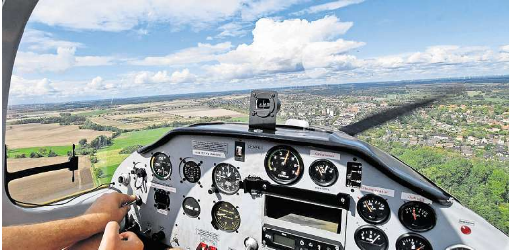
Der Landkreis aus der Vogelperspektive: Die PAZ verlost Rundflüge über die Fuhsestadt im Rahmen des Flugtag-Wochenendes auf der Peiner Glindbruchkippe.

Im Mittelpunkt des Flugtag-Wochenendes stehen aber die Maschinen, die über Peine abheben werden. Doch nicht nur die Piloten erhalten bald eine Start-erlaubnis. Denn mit etwas Glück haben drei Personen die Gelegenheit, Peine aus der Vogel-