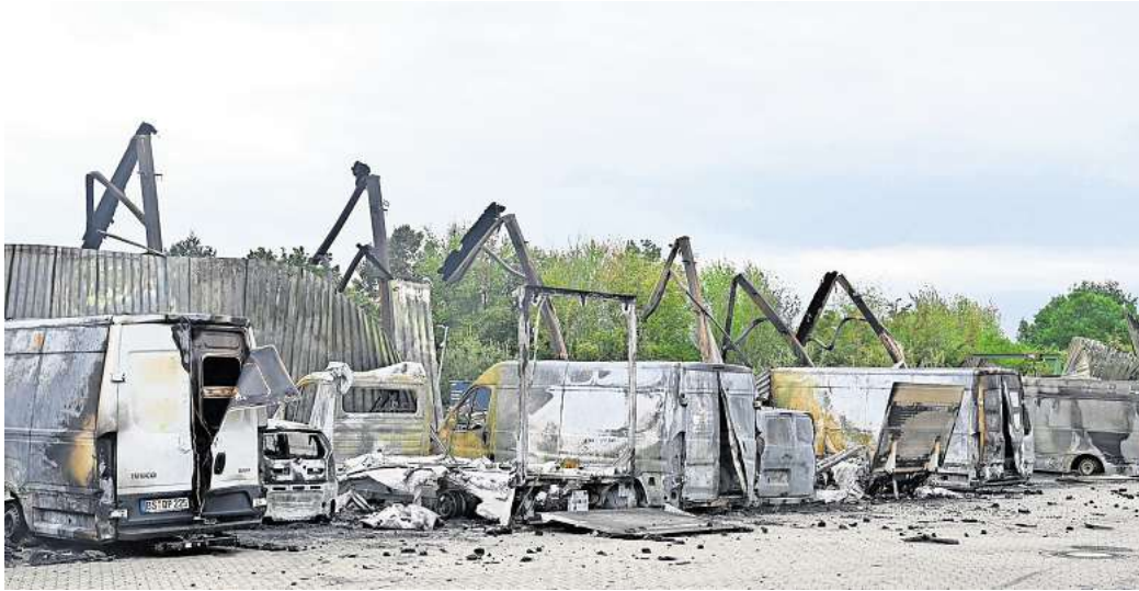
Bei dem Großbrand in Stederdorf sind auf dem angrenzenden Gelände der Lagerhalle insgesamt 16 Autos der Autovermietung Harms verbrannt sowie weitere Fahrzeuge der Lkw-Werkstatt Ferronordics. Augenzeugen zufolge soll der Brand von einem Fahrzeug auf die Halle übergegriffen haben. Ob sich dieser Verdacht bestätigt, muss ein Brandermittler klären.

Dass einer der Mietwagen durch einen technischen Defekt in Brand geraten ist und dadurch das Feuer auf die Halle übergreifen konnte, kann sich die Agen-