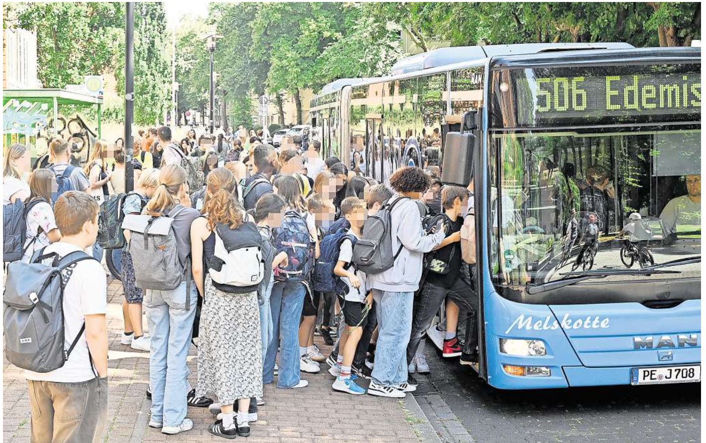
Gedränge an der Bushaltestelle am Ratsgymnasium in Peine.

Die rot-grüne niedersächsische Landesregierung hat im Koalitionsvertrag der aktuellen Legis-