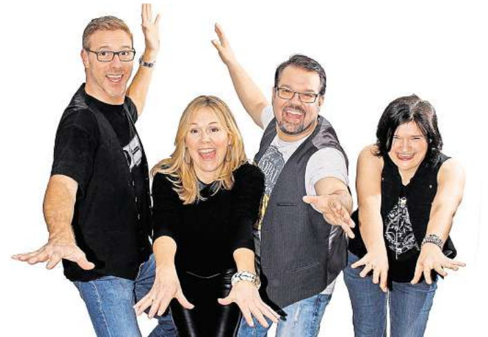
Die Partyband "Show Line" sorgt am Samstagabend für ausgelassene Stimmung im Festzelt. Um 20 Uhr geht's los.

Spannend wird es nach den ersten Runden auf dem Tanzboden um 21.30 Uhr, wenn die Verleihung des grünen Bandes samt