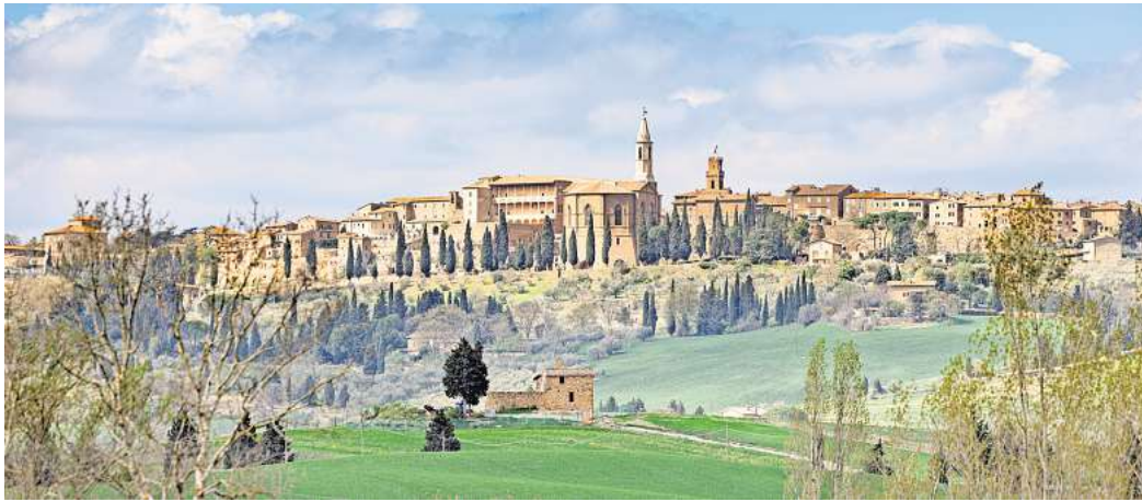
Der neue Wanderweg führt durch das Tal Val d'Orcia rund um Pienza.

Die Kleinstadt wurde im 15. Jahrhundert zu einer Idealstadt umgebaut und neben der sehenswerten Architektur ist Pienza für seinen Pecorino-Käse bekannt. Romantik ist außerdem bei der Erkundung der Straßennamen vorprogrammiert, wenn du beispielsweise durch die Via dell'Amore (Liebesstraße) und Via del Bacio (Kussstraße) spazierst. Um zum Startpunkt des