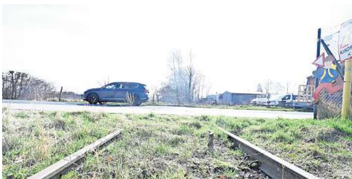
Weitere 21 stillgelegte Bahnstrecken werden überprüft: Beim Reaktivierungsprogramm des Landes Niedersachsen gibt es nun grünes Licht für eine zweite Stufe. Die Verlängerung des Spargelexpress' von Harvesse hinaus bis nach Wipshausen ist nicht dabei.