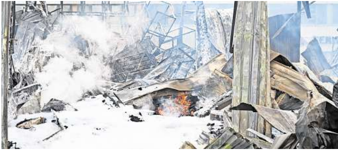
Hätte das Ausmaß des Feuers, das eine Lagerhalle in Stederdorf vernichtete, geringer gehalten werden können? Das fragt sich der frühere Chef der Braunschweiger Berufsfeuerwehr.