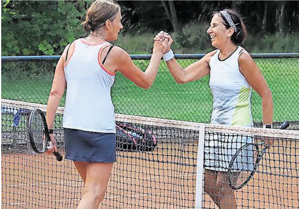
Drei Tage Tennis, drei Tage gute Laune: Die 6. Elli Oil Open stehen bevor.