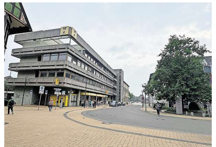
Das alte Postgelände in Peine soll abgerissen werden. Der Hamburger Investor Cureus plant eine Seniorenresidenz auf dem mehr als 4.000 Quadratmeter großen Areal zu bauen.

Sa 15 Uhr, So 10.30 Uhr Einkaufen – Feiern – Genießen