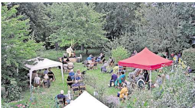
Konzert im Landhausgarten in Mehrum: Auf dem Kunsthof findet ein dreitägiges Musikfestival statt.

Den Start macht die siebenköpfige Band „Feathers and Freed“, die ihr außergewöhnliches Musikgenre selbst als „PsychedelicArtRock“ bezeichnet. Als „Psychedelic Rock“ wird eine Spielart der Rockmusik bezeichnet, zu deren Pionieren Bands wie die Beatles oder The Doors gehörten und beschreibt einen experimentellen Umgang mit Musikstrukturen. „Mit Gesängen, Gitarren, Cello,