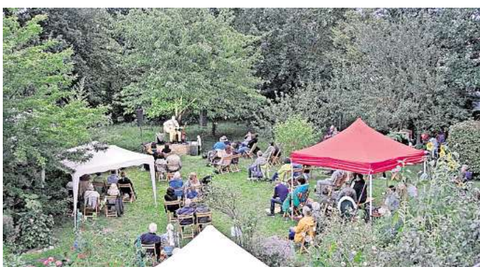
Konzert im Landhausgarten in Mehrum: Auf dem Kunsthof findet ein dreitägiges Musikfestival statt.

Den Start macht die siebenköpfige Band „Feathers and Freed“, die ihr außergewöhnliches Musikgenre selbst als „PsychedelicArtRock“ bezeichnet. Als „Psychedelic Rock“ wird eine Spielart der Rockmusik bezeichnet, zu deren Pionieren Bands wie die Beatles oder The Doors gehörten und beschreibt einen experimentellen Umgang mit Musikstrukturen. „Mit Gesängen, Gitarren, Cello,