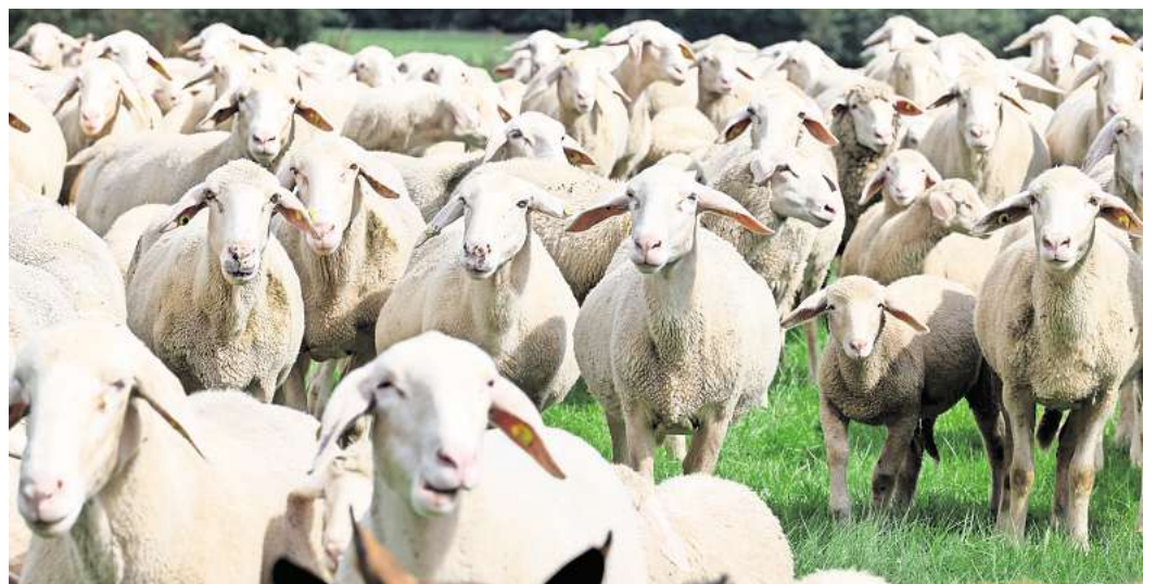
Der Verlauf der Blauzungenkrankheit kann insbesondere bei Schafen sehr schwer sein.