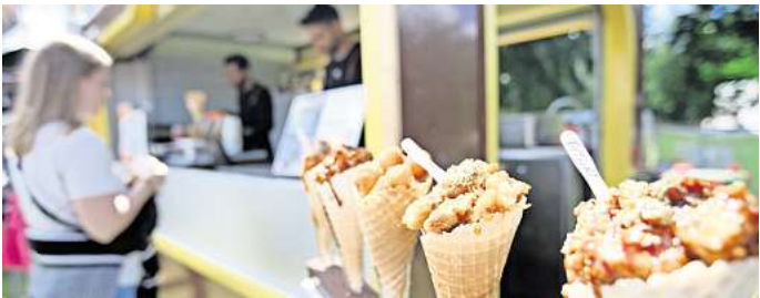
Ein Foodtruck-Festival findet in Peine statt.

Handgemachte Bio-Köstlichkeiten von der einzigen Kroppkakor-Manufaktur südlich von Schweden. Und es gibt einen verkaufsoffenen Sonntag am 29. September: Dazu lädt die Peiner Kaufmannsgilde ein. Von 13 bis 18 Uhr hat man die Möglichkeit, durch die Geschäfte der Innenstadt zu bummeln und nach Herzenslust einzukaufen