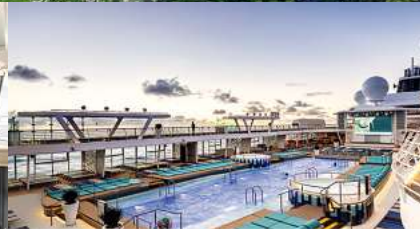
Mein Schiff 2, Poolbereich