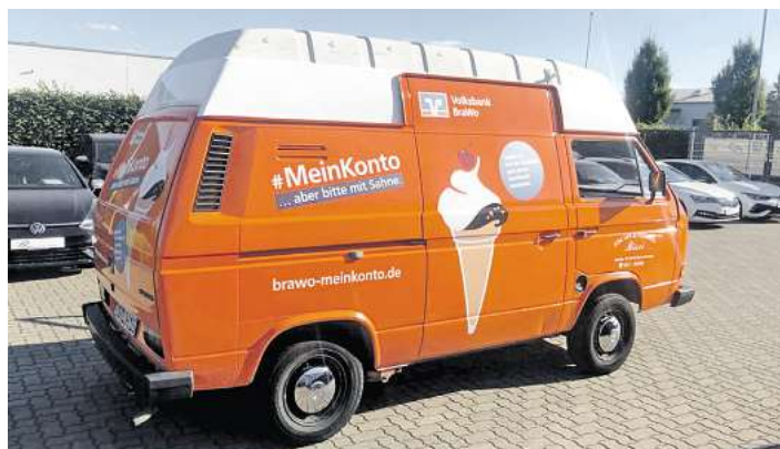
Aber bitte mit Sahne: Eis und Finanzen.

ILSEDE. Gelungener Start: Die 8. Ilseder Jobboerse ist erfolgreich online am Start und kann bis 29. September rund um die Uhr im Internet besucht werden. Beim Präsenzttag am kommenden Donnerstag, 12. September, in der Ilseder Gebläsehalle, stellen sich viele der