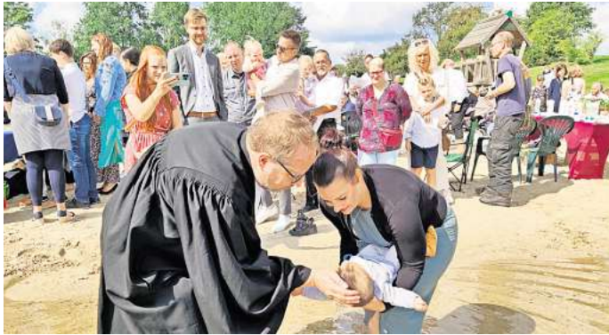
Tauffest am Eixer See: 59 Täuflinge wurden größtenteils mit Seewasser getauft.

Ihre Kolleginnen und Kollegen aus den Gemeinden hatten sich direkt am See Tauffische einge-