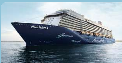
Mein Schiff 3