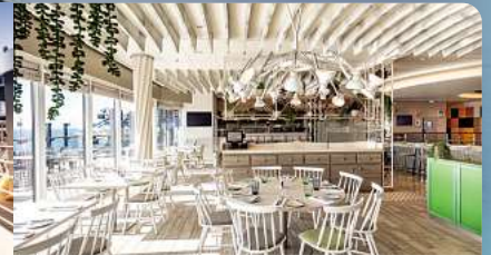
Mein Schiff 2, Bistro