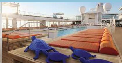
Mein Schiff 3, Poolbereich