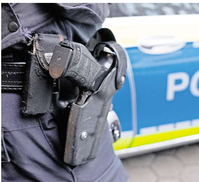
Die Polizisten trafen den Peiner (43) im Stadtpark an.

„Seid ruhig, sonst knalle ich euch ab“, soll der alkoholisierte Mann den Kindern zugerufen haben. Laut Anklage der Staatsanwaltschaft habe er eine Schreckschusswaffe gezogen und einen Schuss in den Himmel abgegeben. Die Kinder sollen daraufhin die Polizei alarmiert haben. Als diese im Stadtpark eintraf, waren die Kids verschwunden, sie haben aber den Angeklagten mit