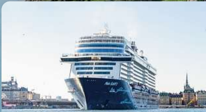
Mein Schiff 2