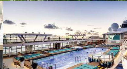
Mein Schiff 2, Poolbereich