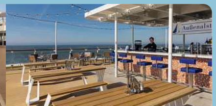
Mein Schiff 3, Bar & Grill

Unsere inkludierten Leistungen: ✓ Transfer zum/ab Schiff in Bremerhaven ✓ Übernachtung in der gebuchten Kabinenkategorie ✓ Anspruchsvolle und vielfältige Gastronomie ✓ Erstsicherer Service an Bord – und direkt am Platz ✓ Gastronomie rund um die Uhr für Ihren individuellen Urlaubsrhythmus ✓ Durchgängig große Auswahl an Getränken ✓ Exquisite Cocktails für Genießer ✓ Zutritt zu den großzügigen Wellness- und Fitnessbereichen ✓ Abwechslungsreiches Entertainment mit Niveau ✓ Inspirierendes Bordprogramm ✓ Altersgerechte Kinderbetreuung mit viel Spaß ✓ Täglich Kabinenservice ✓ Trinkgelder im Reisepreis inbegriffen ✓ Fuhmann Mundstock Reisebegleitung ab 24 Teilnehmern ✓ Haustürabholung zubuchbar für 60,- € p. P. *Reisepass erforderlich