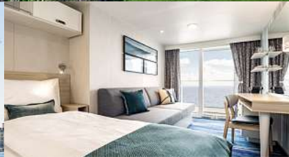
Mein Schiff 2, Balkonkabine