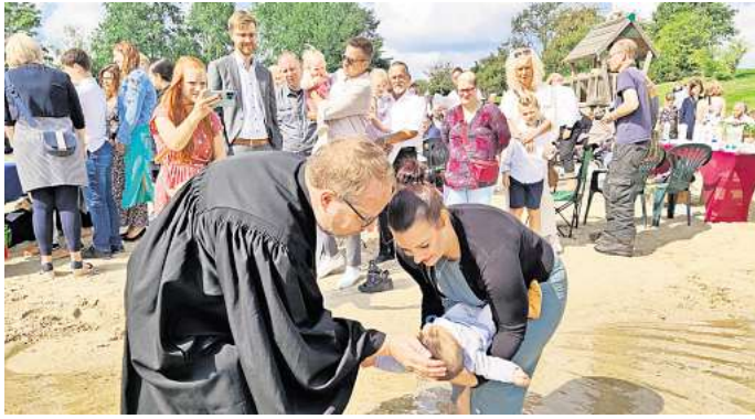
Tauffest am Eixer See: 59 Täuflinge wurden größtenteils mit Seewasser getauft.

Ihre Kolleginnen und Kollegen aus den Gemeinden hatten sich direkt am See Tauffische einge-