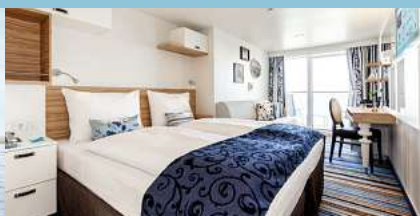
Mein Schiff 3, Balkonkabine