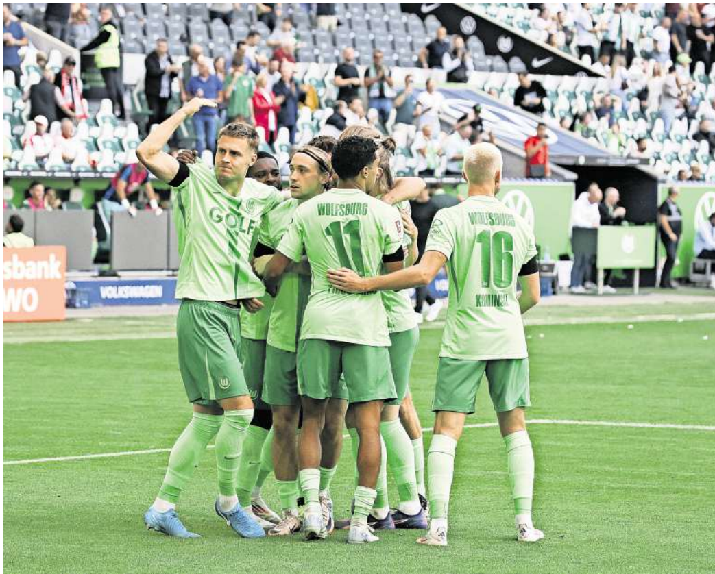
Am Samstag, 14. September, trifft der VfL Wolfsburg vor heimischem Publikum auf Eintracht Frankfurt. Für diese Partie können PAZ-Leser Eintrittskarten gewinnen.

Direkt vor der Länderspielpause konnte der VfL Wolfsburg dann seinen ersten Sieg der neuen Spielzeit feiern. Mit einem überzeugenden 2:0-Erfolg gegen Holstein Kiel sicherten sich die Wölfe drei wichtige Punkte. Nach der Pause steht für das Team um Trainer Ralph Hasenhüttl nun das nächste Heimspiel auf dem Programm. Am Samstag, 14. September, kommt Eintracht Frankfurt in die Volkswagen Arena nach Wolfsburg. Anpfiff ist um 15:30 Uhr.