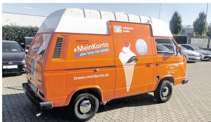
Aber bitte mit Sahne: Eis und Finanzen.

ILSEDE. Gelungener Start: Die 8. Ilseder Jobboerse ist erfolgreich online am Start und kann bis 29. September rund um die Uhr im Internet besucht werden. Beim Präsenztage am kommenden Donnerstag, 12. September, in der Ilseder Gebläsehalle, stellen sich viele der