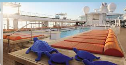
Mein Schiff 3, Poolbereich