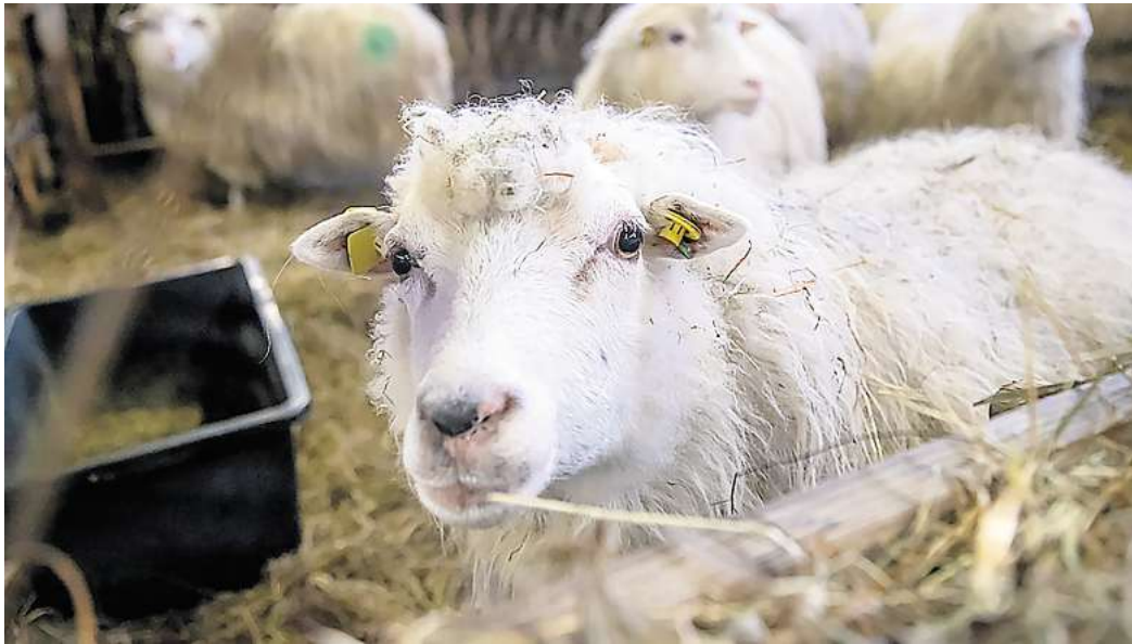
Blauzungenkrankheit: Im Landkreis Peine wurde die durch Gnitzen verbreitete Infektion bislang in zehn Betrieben - darunter achtmal bei Schafen - festgestellt.

Die Symptome der Blauzungenkrankheit seien bei Schafen gravierender und reichen von hohem Fieber, allgemeiner Apathie und Schwäche bis hin zu hochgradig schmerzhaften Schwellungen am Kopf, Schleimhautablösungen an Zunge, Maul und Nase