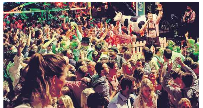
Premiere im Gebrauchtwagenzentrum der Automeile Wolfsburg: Am Samstag, 28. September, steigt dort das Oktoberfest Wolfsburg mit den Alpenbanditen.

Direkt zur Verlosung: Einfach den QR-Code mit dem Handy scannen.