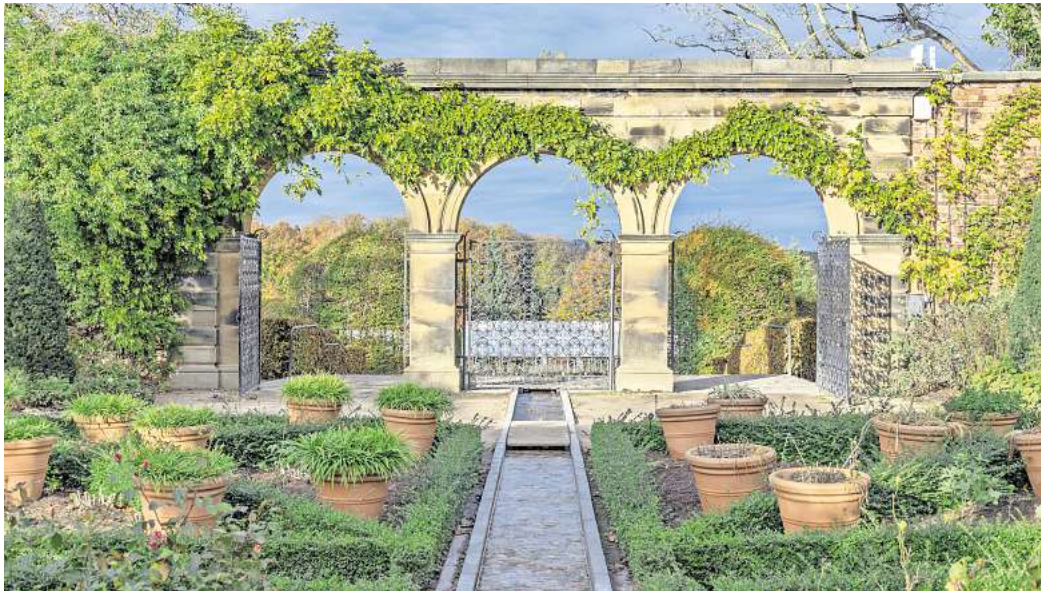
Wäre beinahe zum Parkplatz geworden: Der Alnwick Garden in der Grafschaft Northumberland.

Der Garten ist Teil der Gartenanlage The Alnwick Garden, die bereits seit 1750 existiert und jährlich rund 600.000 Besuche-