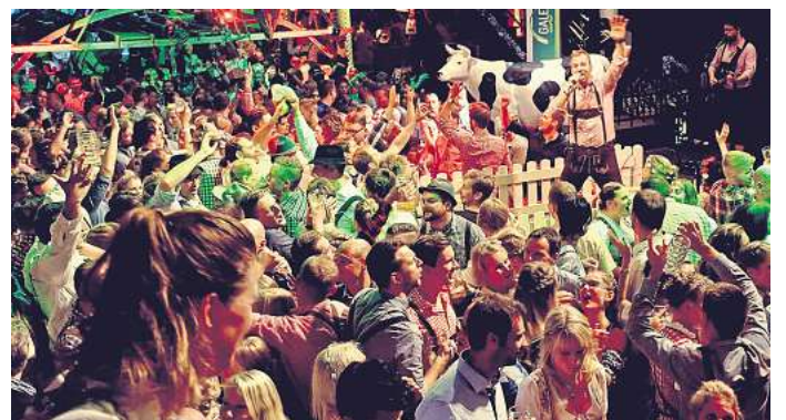
Premiere im Gebrauchtwagenzentrum der Automeile Wolfsburg: Am Samstag, 28. September, steigt dort das Oktoberfest Wolfsburg mit den Alpenbanditen.

Direkt zur Verlosung: Einfach den QR-Code mit dem Handy scannen.