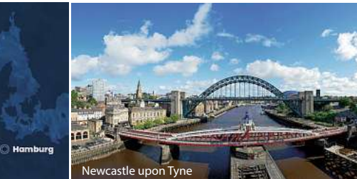
Newcastle upon Tyne

Von der Alster bis zum Mittelmeer ab Hamburg/bis Genua – Costa Favolosa