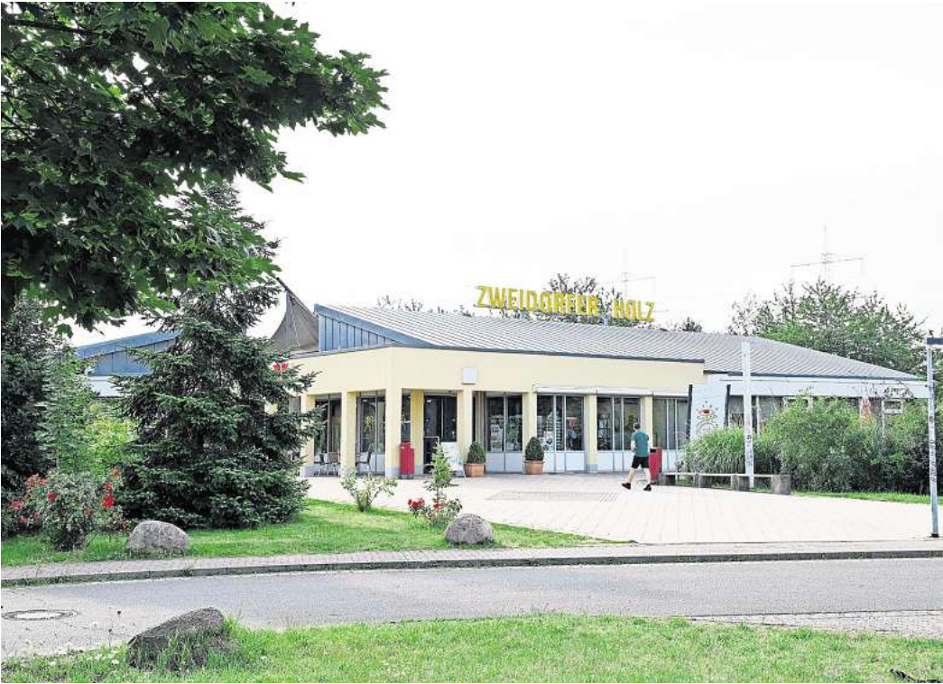
Die Raststätte „Zweidorfer Holz Süd“ wurde vom ADAC getestet.

Positiv ins Gewicht fielen ferner eine „außergewöhnlich große Auswahl an warmen Speisen“ im Restaurantbereich, eine Kinderspielecke im Rastgebäude, der „sehr gute Zustand“ der Sanitäranlagen mit samt „optisch sehr sauberer Toiletten“, funktionalen barrierefreier Toilette sowie Babywickelraum. „Sehr günstig“ sind laut des ADAC-Tests die Speisen im Restaurant. So kostet, wie schon angedeutet, das Schnitzel mit Pommes bei Peine unschlagbare 10,99 Euro, während man an den anderen Test-Raststätten dafür mit bis zu 19,99 Euro zur Kasse geben wird. „Reisen ist schon anstrengend genug. Wir wollen den Reisenden mit dem Test eine Richtschnur an die Hand geben, welche Rasthöfe sie eher anfahren sollten“, meint Alexandra Kruse. Dass das „Zweidorfer Holz Süd“ nicht zu dieser Kategorie gehört, geht aus dem ADAC-Test nicht hervor. Übrigens: Die gegenüberliegende A2-Raststätte „Zweidorfer Holz Nord“ in Fahrtrichtung Hannover wurde aktuell nicht getestet. Die rote Laterne hält bei dem Vergleich „Fuchsberg Süd“ in Mecklenburg-Vorpommern an der A20. Insgesamt gibt es entlang der 13.000 Autobahnkilometer in Deutschland rund 440 bewirtschaftete Rasthöfe mit Tankstelle, Restaurant oder Shop sowie etwa 1.500 unbewirtschaftete Raststätten.