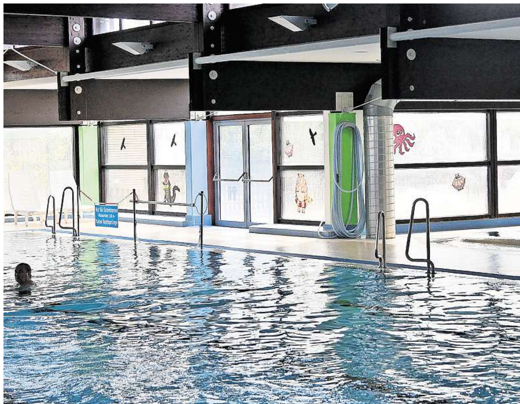
Nicht nur technische Probleme: Das Hallenbad Mehrum, das aktuell geschlossen ist, bedarf einer energetischen Sanierung.

Gemeinde erwartet Steuer Mehreinnahmen - Politik dämpft hohe Erwartungen