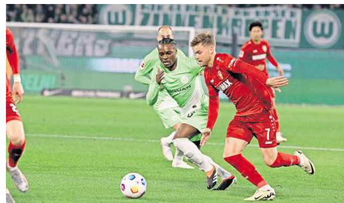
Sport, Fußball Bundesliga, VfL Wolfsburg - VfB Stuttgart, Saison 2023/24, Volkswagen Arena, 02.03.2024

Direkt zur Verlosung: Einfach den QR-Code mit dem Handy scannen.