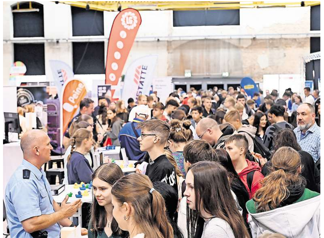
Rund 2.000 Schülerinnen und Schüler besuchten die Ilseder Jobbörse.