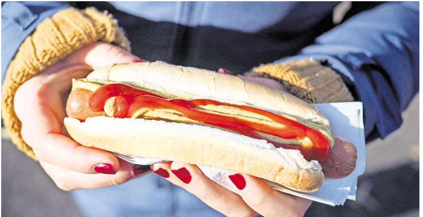
Auch Brötchen für Hotdogs enthalten manchmal geringe Mengen an Alkohol.

„Versteckter“ Alkohol finde sich besonders häufig in Süßigkeiten, Desserts und Fertiggerichten, sagte die Verbraucherschützerin. Salatdressings, Feinkostsalate und Konfitüren enthielten gelegentlich ebenfalls Alkohol. In den Zutatenlisten lau-