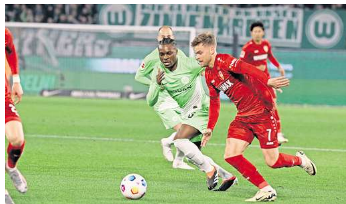
Sport, Fußball Bundesliga, VfL Wolfsburg - VfB Stuttgart, Saison 2023/24, Volkswagen Arena, 02.03.2024

Direkt zur Verlosung: Einfach den QR-Code mit dem Handy scannen.