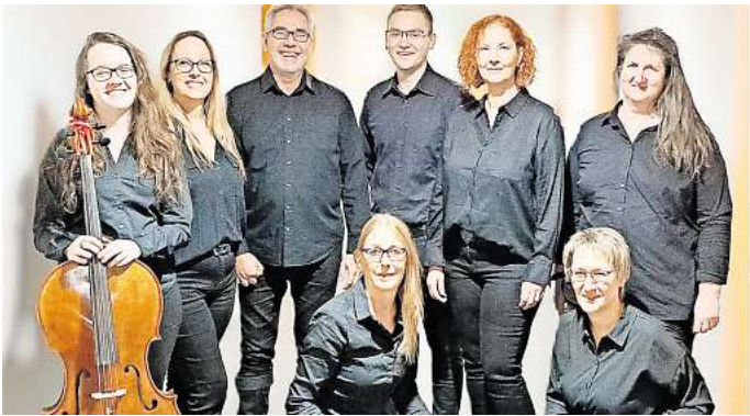
Lädt ein zum Jahreskonzert: Das Akkordeon Ensemble Lengede spielt am 12. Oktober in Solschen.

Lengede. Ein Akkordeon kann nicht nur Seemannslieder. Das ist das Credo des Akkordeon Ensembles Lengede, in dem derzeit acht Hobbymusiker und -musikerinnen aktiv sind. Sie spielen fünf Akkordeons, ein Cajon und ein Cello. Zusammen mit ihrem musikalischen Leiter bereiten sie sich auf das Jahreskonzert vor am Samstag, 12. Oktober, um 18 Uhr in St. Pankratii in Solschen. Das Repertoire hat eine große Bandbreite und reicht von Schlager und Musicals über Operetten bis hin zu Shantys wie Biscaya, die eigentlich immer mit dem Akkordeon in Verbindung gebracht wird. Weitere Konzerte beginnen am Samstag, 19. Oktober, um 18 in der ev. Kirche in Oberg und am Sonntag, 10. November, um 18 Uhr in der ev. Kirche in Vechelde. Wer Interesse hat, mitzuspielen, kann sich an das Ensemble wenden unter www.akkordeon-ensemble-harmonie-le.jimdo.free.com .