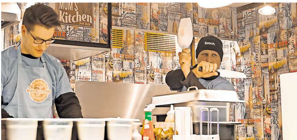
Am letzten September-Wochenende findet das erste Foodtruck-Festival in Peine statt.

Gemütliche Sitzgelegenheiten an der Breiten Straße laden die Besucherinnen und Besucher zum Verweilen ein. Auf der