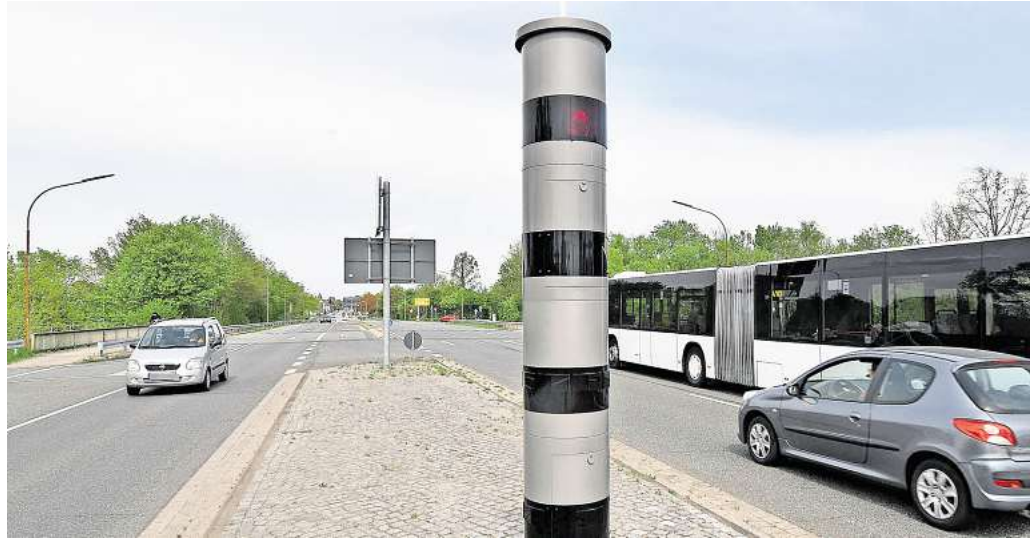
Besonders oft ausgelöst in Peine: Der Blitzer an der Ilseder Straße.

Besonders spektakulär stellt sich in der Fuhsestadt die höchste Geschwindigkeitsüberschreitung 2024 dar. „Im Rahmen einer gemeinsamen Verkehrsüberwachungsaktion mit der Polizei wurde Anfang August ein Südtiroler in Höhe der Kleingärten Stederdorf während einer Probefahrt mit einem in Braun-