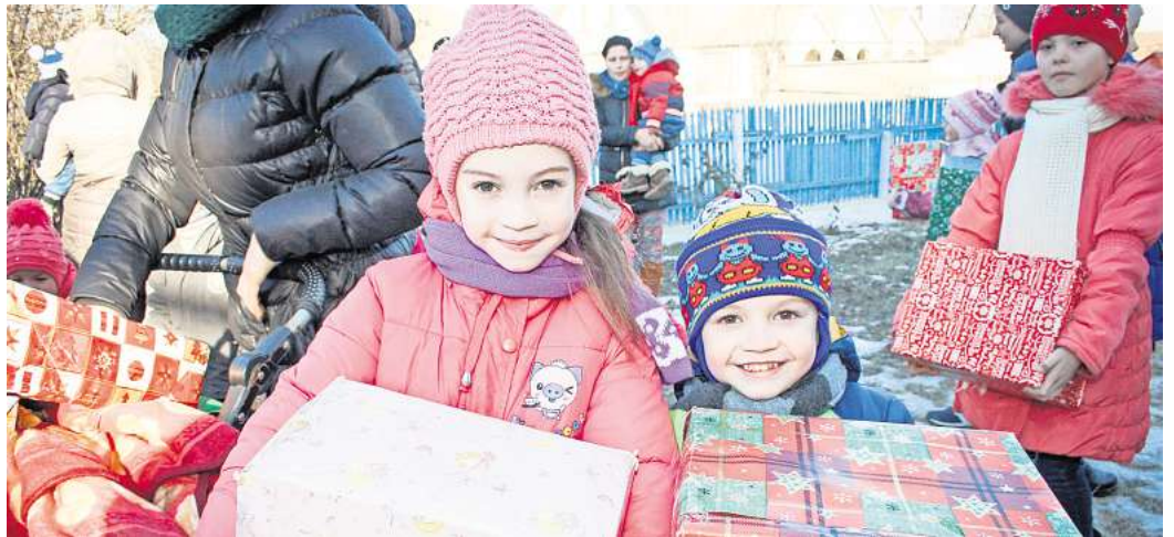
Die Freude ist jedes Jahr groß, wenn die Weihnachtspäckchen bei den Kindern in Osteuropa ankommen.

Die Päckchen muss man, bevor diese bei den Annahmestellen abgegeben werden, mit einem Aufkleber mit Angaben zum Geschlecht und dem Alter des zu beschenkenden Kindes versehen. Diese Aufkleber sind auf der