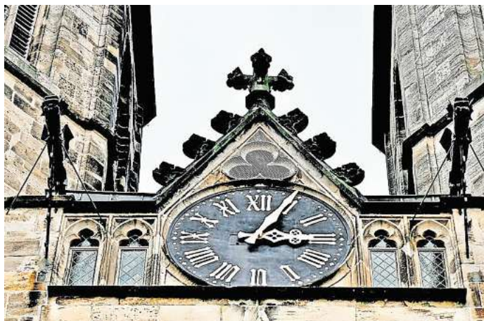
Direkt zur Umfrage: Einfach den QR-Code mit dem Smartphone scannen.

Seit Jahren scheiden sich an der zweimaligen Zeitumstellung pro Jahr die Geister. Die einen befürworten sie, die anderen hätten sie am liebsten schon lange abgeschafft. Eigentlich war die Abschaffung auch schon beschlossen. Doch da zwischen unterschiedlichen Staaten bis-