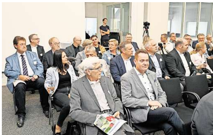
Rund 80 Gäste verfolgten den Wirtschaftstalk bei Baustoff Brandes.