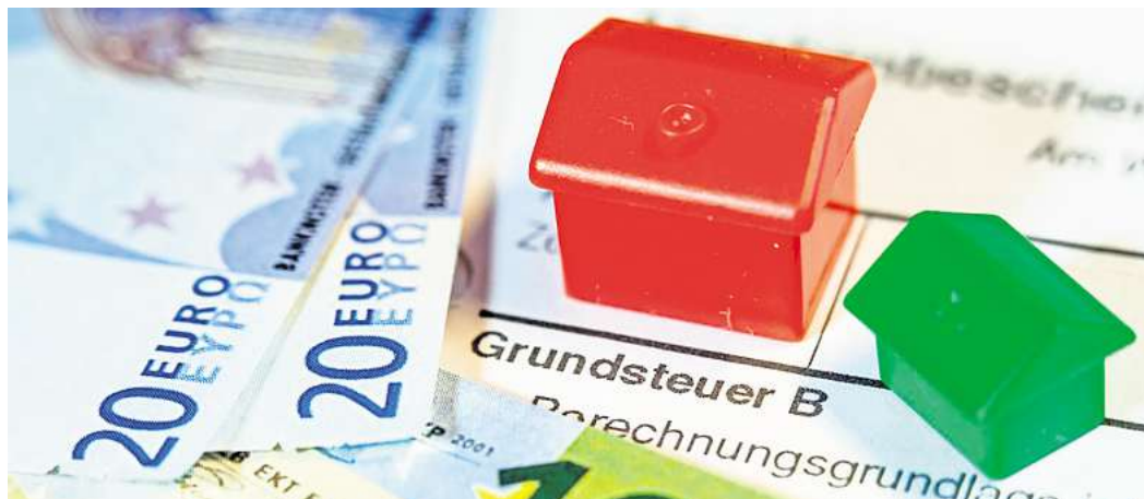
Die Höhe der Grundsteuer wird neu berechnet. Noch nicht alle Gemeinden im Landkreis Peine haben die Hebesätze schon festgelegt.

Vor dem Hintergrund dieser Entwicklung fordert die IHK Niedersachsen, dass sich die Kommunen bei der Festlegung der Hebesätze für 2025 unbedingt von der Aufkommensneutralität leiten lassen sollten. Damit diese gesetzliche Vorgabe erfüllt werden könne, sollte es aus IHKN-Sicht ein Informationsangebot geben, mit dem Bürger und Unternehmen transparent einsehen können, mit welchem Hebesatz Aufkommensneutralität gewährleistet wäre. „Da die Veröffentlichung eines aufkommensneutralen Hebesatzes in Niedersachsen gesetzlich vorgeschrieben ist, wäre es ein logischer Schritt, über ein Portal oder durch ein vergleichbares Angebot für Transparenz zu sorgen“, so Frank Hesse, IHKN-Sprecher für Wirtschaftspolitik und Mittelstand. Die IHKN werde dazu den zuständigen Ministerien einen Vorschlag machen.