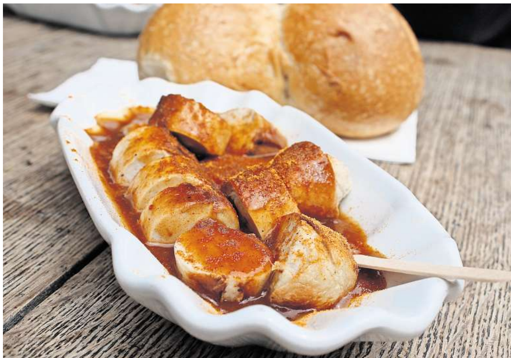
Wo gibt es die leckerste Currywurst in Wolfsburg? Machen Sie mit bei der WAZ-Aktion.

Was eine richtig gute Currywurst ausmacht, hängt dabei nicht nur