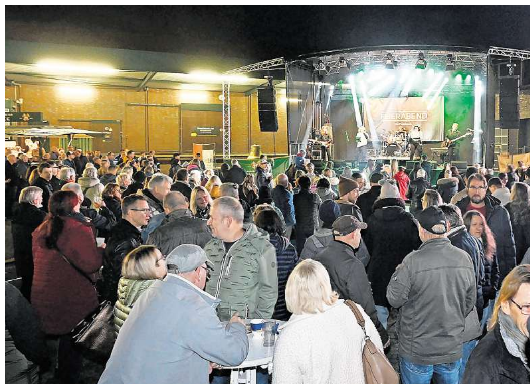
Tolle Stimmung, tolles Wetter: Das Härke-Hoffest kam gut an.