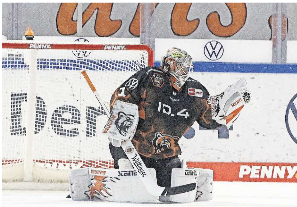
Am 20. Oktober treffen die Grizzlys Wolfsburg in der EisArena auf die Eisbären Berlin. (Symbolbild)

Sie können bei dem Duell der Grizzlys Wolfsburg gegen die