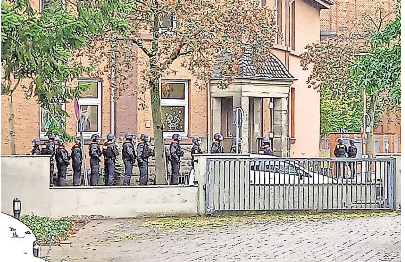
An der Bodenstedtschule in Peine gab es eine Amok-Lage.

Seit 2005 entwickelt die Polizei Niedersachsen Aus- und Fortbildungskonzepte für Einsatzlagen mit besonderem Gefährdungsgrad, die stetig aktualisiert und angepasst werden. Die Einsatzkräfte werden speziell vorbereitet, auch in Bezug auf den möglichen psychischen