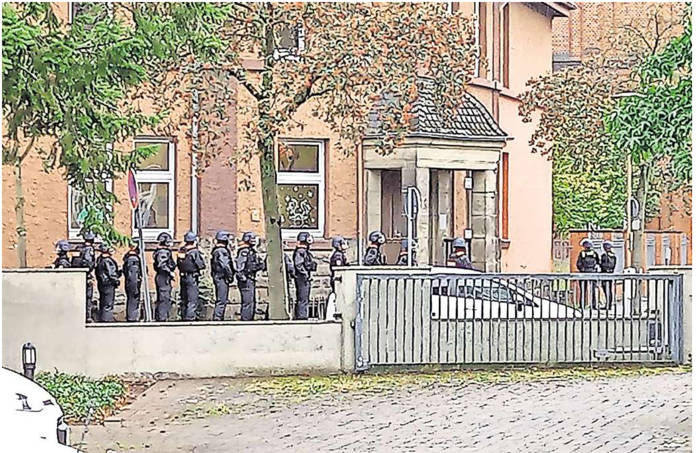
An der Bodenstedtschule in Peine gab es eine Amok-Lage.

Seit 2005 entwickelt die Polizei Niedersachsen Aus- und Fortbildungskonzepte für Einsatzlagen mit besonderem Gefährdungsgrad, die stetig aktualisiert und angepasst werden. Die Einsatzkräfte werden speziell vorbereitet, auch in Bezug auf den möglichen psychischen