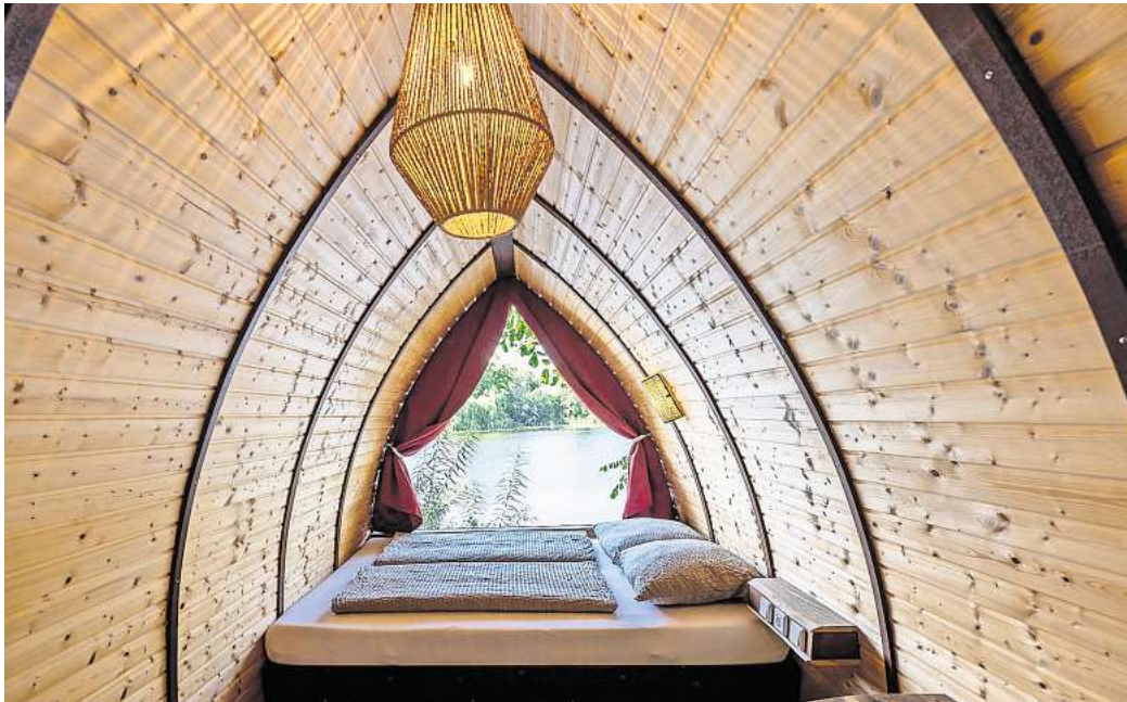
Nur ein Bett und etwas Stauraum: Das kleinste Tiny-Ferienhaus mit dem großen Fenster zum See ist das beliebteste.