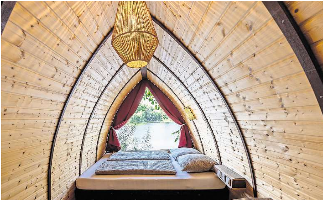
Nur ein Bett und etwas Stauraum: Das kleinste Tiny-Ferienhaus mit dem großen Fenster zum See ist das beliebteste.