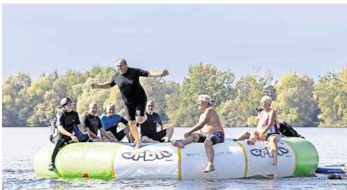
Der Surf-Club Peine feierte 40. Geburtstag: Die Mitglieder hatten Spaß auf dem Wasser.