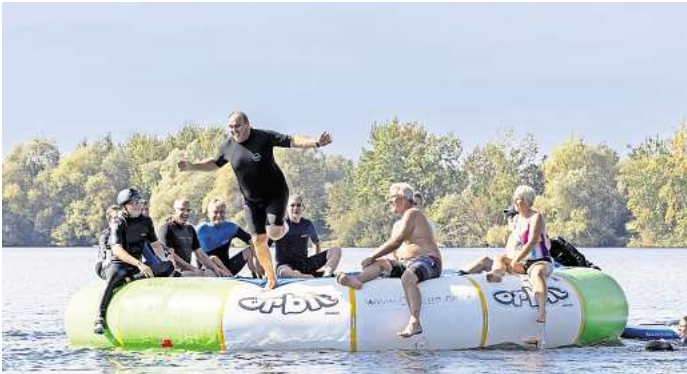
Der Surf-Club Peine feierte 40. Geburtstag: Die Mitglieder hatten Spaß auf dem Wasser.

eintreten möchte, ist herzlich willkommen: Für einen geringen jährlichen Clubbeitrag bietet der Verein jede Menge Spaß rund