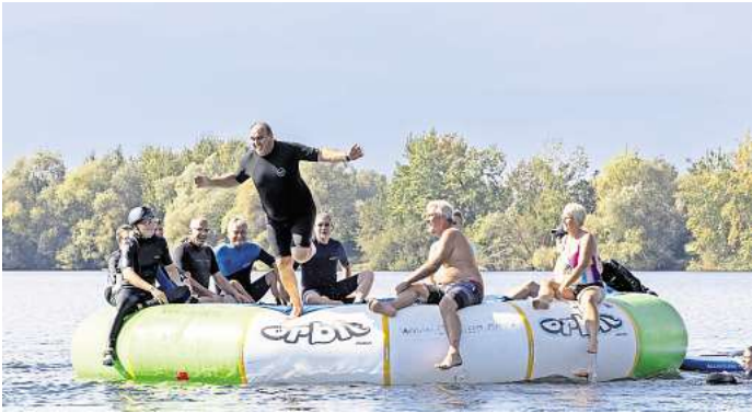
Der Surf-Club Peine feierte 40. Geburtstag: Die Mitglieder hatten Spaß auf dem Wasser.

eintreten möchte, ist herzlich willkommen: Für einen geringen jährlichen Clubbeitrag bietet der Verein jede Menge Spaß rund