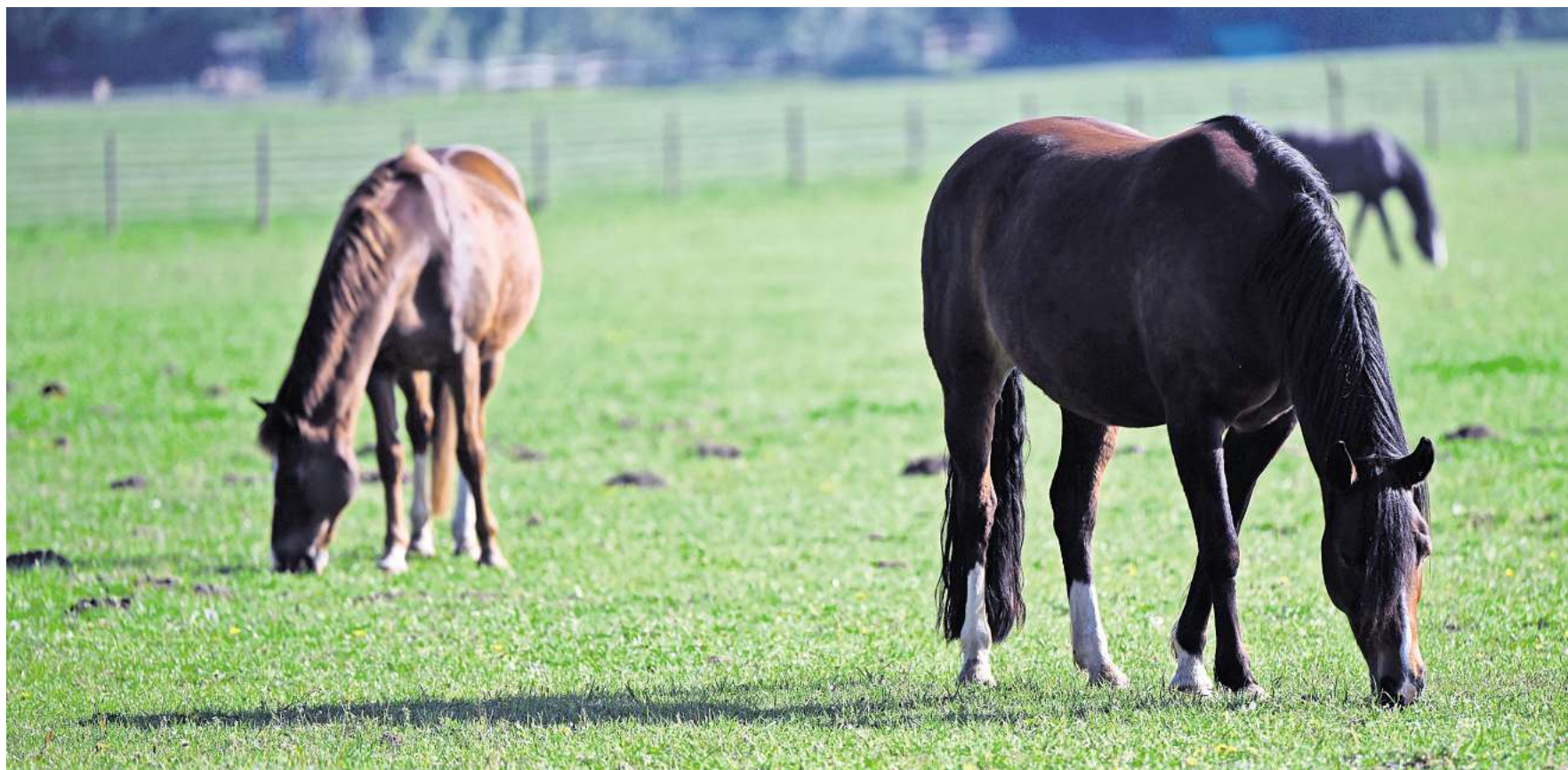
Das West-Nil-Virus kann sich über Mücken auf Pferde übertragen. Im Kreis Peine gibt es jetzt den ersten nachgewiesenen Fall.