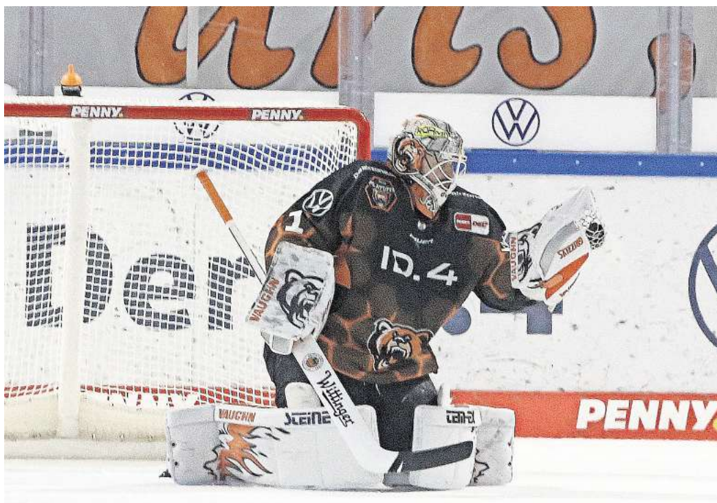
Am 20. Oktober treffen die Grizzlys Wolfsburg in der EisArena auf die Eisbären Berlin. (Symbolbild)

Sie können bei dem Duell der Grizzlys Wolfsburg gegen die