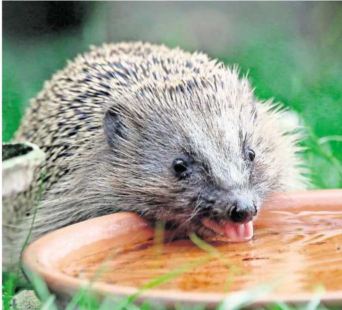
Eine willkommene Erfrischung: Ein Igel trinkt aus einer Schale.

Wenn die Temperaturen mild sind, können die stacheligen Tiere noch bis Ende Dezember unterwegs sein, um sich Winterspeck anzufressen. Will man ihnen helfen, kann man Schächte im Garten abdecken, in die die Tiere stürzen könnten. Auch kann man den Igeln Verstecke schaffen, beispielsweise mit Haufen aus Herbstlaub. Auch Martina Schulenburg von der Igelstation Ummern kennt sich mit Igeln aus. Schon seit mehr als 35 Jahren kümmert sie sich um kleine, aber auch große Igel. Losgegangen sei alles, als sie früher als Gemeindeschwester - heute vergleichbar mit einer ambulanten Krankenpflegerin - gearbeitet hat, erzählt sie. „Eine Kollegin