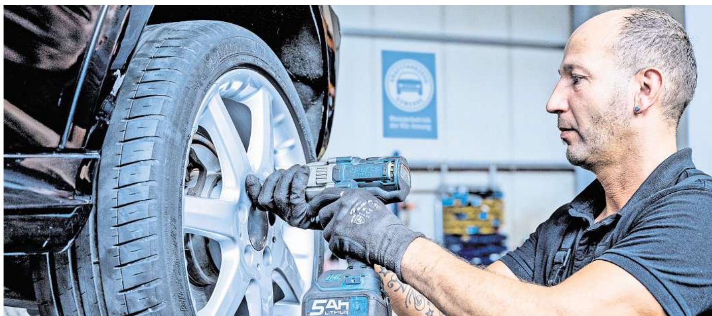
Höchste Zeit für den Reifenwechsel: Wer jetzt noch mit Sommerreifen unterwegs ist, sollte schnell auf die Winterpendants wechseln.

Die Fahrt mit „Sommerpuschen“ in der kalten Jahreszeit kann teuer werden