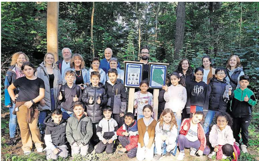
Die Klasse 3a der Wallschule sowie einige Eltern und Lehrkräfte waren die ersten, die den neu installierten Mach-Mit-Pfad im Herzberg ausprobierten.