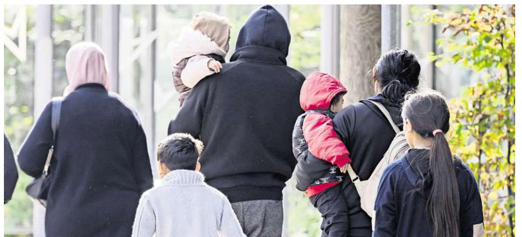
Mit dem neuen Verteilkontingent steht fest, wie viele Geflüchtete im Landkreis Peine Schutz bekommen sollen.