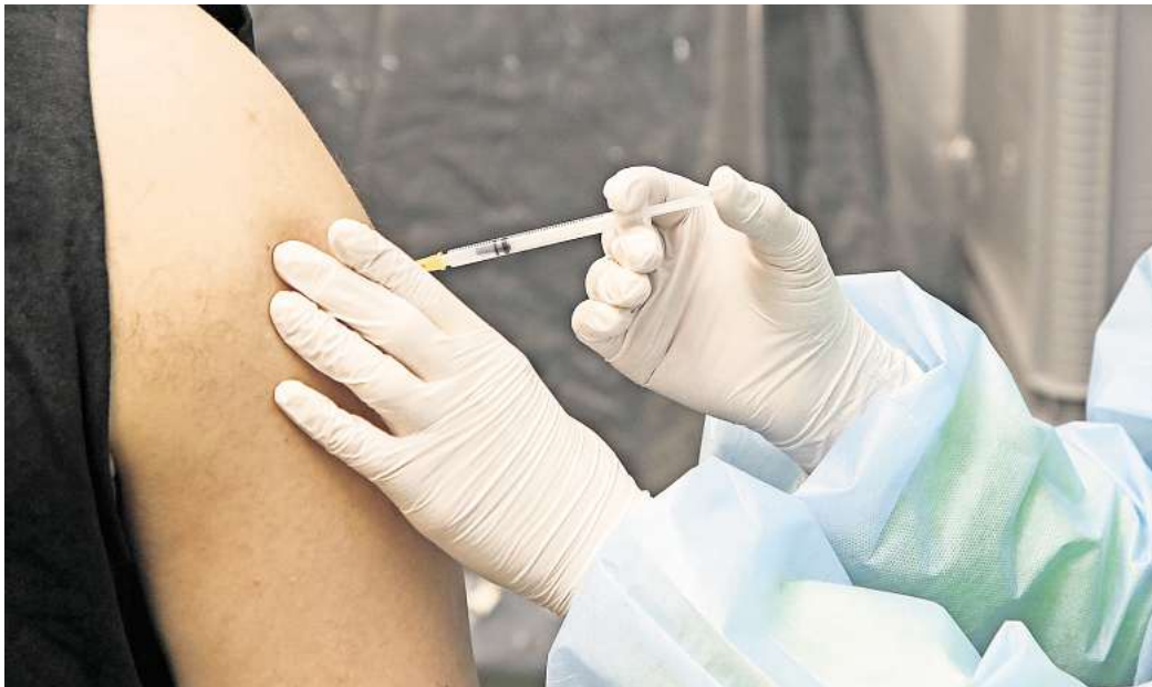
Umfrage: Lassen Sie sich gegen Grippe und Corona impfen?

Auch die Auffrischung der Covid-19-Impfung legt die Stiko der oben angeführten Personen-Gruppe ans Herz, ausgenommen Schwangere ohne Grunderkrankungen, für die die Basisimmunität als ausreichend bewertet wird. Laut dem Robert Koch-Institut (RKI) ist eine Basisimmunität dann erreicht, wenn das Immunsystem dreimal Kontakt mit Bestandteilen des Erregers (Impfung) oder dem Erreger selbst (Infektion)