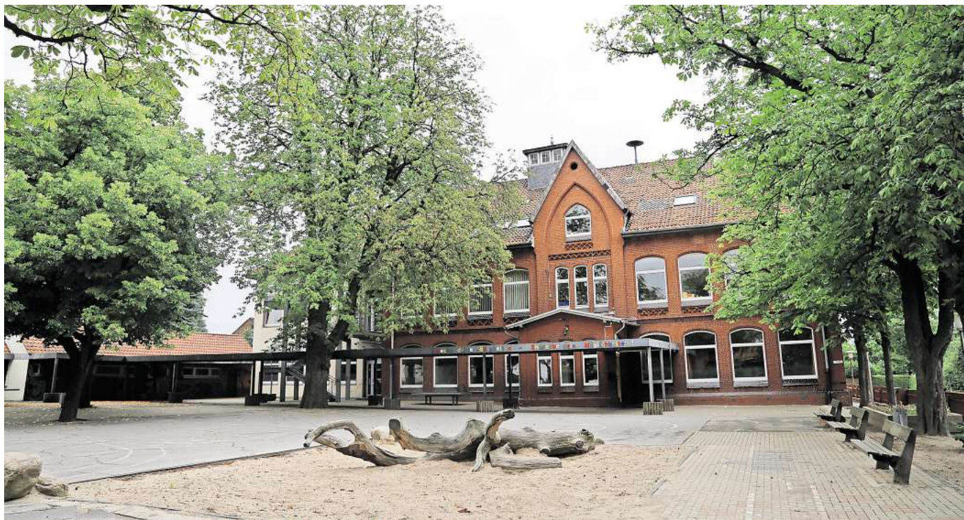
Die alte Grundschule in Stederdorf steht erneut leer.

Doch das Bauprojekt sorgte durch seine zahlreichen Verzögerungen infolge von Liefer- und Personalengpässen infolge der Corona-Pandemie für Ärger - vor allem bei den betroffenen Eltern, die nicht nur die fehlende Integration ihrer Kinder ins Dorfleben sowie die viele Fahrten zwischen Essinghausen