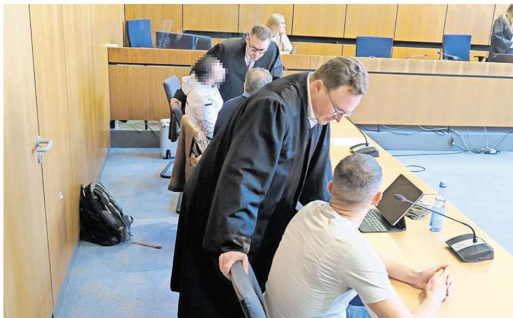
Die beiden Angeklagten (helle Shirts) mit ihren Verteidigern.

Beide Männer wollen sich zu den Vorwürfen am nächsten Prozesstag, dem 18. Oktober 2024, äußern. Dann wird auch der Sachverständige dabei sein, der beide Angeklagte wegen ihres Drogenkonsums zu begutachten hat. Als Zeugin wird dann auch die Hohenhamelnerin erwartet.