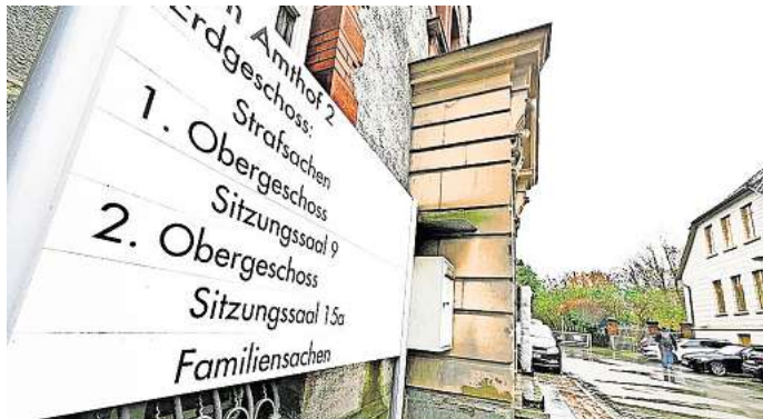
Amtsgericht Peine: Ein handgreiflicher Streit zweier Mütter auf einem Spielplatz landete jetzt dort.

„Sie hat mir mein Kopftuch heruntergerissen und auf den Boden geworfen, als sie mich von hinten angriff. Anschließend hat sie mich mit dem Kopftuch ge-