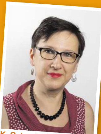
K. Galuszka-Stolz Foto: Senioren- und Pflegestützpunkt