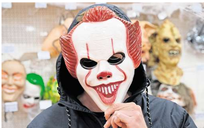
Besonders beliebt an Halloween: gruselige Masken.

50-Euro-Gutschein von Media Markt zu gewinnen