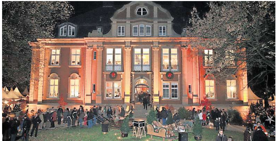
Die PAZ verlost Freikarten für die Winter-Träume auf Schloss Eldingen.

Geöffnet hat das Schloss Eldingen von Freitag bis Samstag zwischen 10 und 20 Uhr, am Sonntag verkürzt sich die Zeit dann auf 18 Uhr. Wer die Chance auf eine Freikarte verpasst, der zahlt an der Tageskasse 15 Euro. Kinder bis 12 Jahre haben freien Eintritt, Schüler, Studenten, Be-