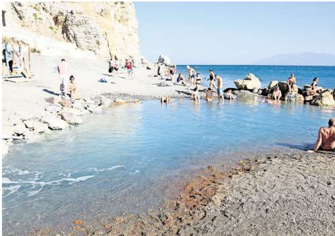
Die Embros-Therme auf Kos gehört zu den heißen Quellen Griechenlands.

Möglich ist das beispielsweise in den Thermalquellen von Loutra Pozar, die rund 100 Kilome-