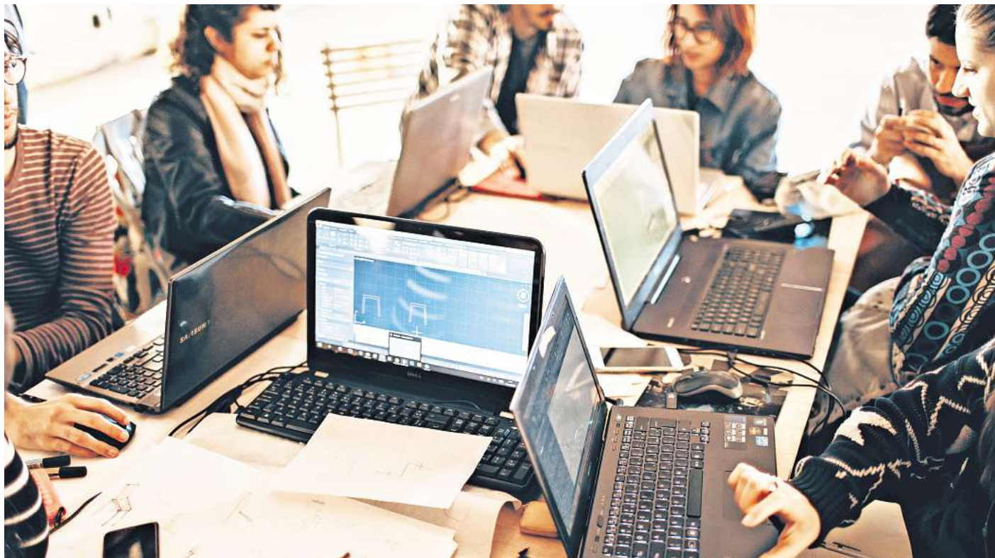
Nur jeweils etwa 7 Prozent aller Smartphones und aller Laptops in Unternehmen stammen aus zweiter Hand.

Warum muss es so häufig Neuware sein? Da dürften schlicht auch Gewohnheit und eingespielte Prozesse eine Rolle spielen. Sie stammen oft noch aus den alten Zeiten, als spätestens alle zwei Jahre aktuelle Modelle angeschafft werden mussten, weil sich die Hardware und