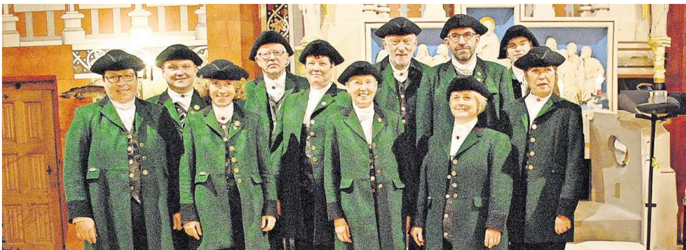
Begleitet die Hubertusmesse: Das Parforcehorncorps „Die Jagdfanfare“ aus dem Hildesheimer Land kommt nach Peine.