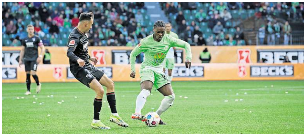
Der VfL Wolfsburg empfängt am Samstag, 2. November, den FC Augsburg.

Für die Partie des VfL Wolfsburg gegen den FC Augsburg