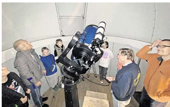
Viele Gäste kamen zur Peiner Sternwarte, um sich den Himmel anzuschauen.

nach Westen haben, möglichst von einem dunklen Standort aus. Weil der Komet gerade die Sonne passiert habe und daher viel Material verdampfe, könnte sein Schweif besonders ausgeprägt sein. Wie gut die Beobachtbarkeit des Himmelskörpers allerdings tatsächlich sein wird, lasse sich allerdings nicht völlig sicher vorhersagen. C/2023 A3 Tsuchinshan-Atlas zähle zu den nicht-periodischen Kometen, die – wenn überhaupt – erst nach längeren Zeiträumen wieder in Erdnähe kommen. In absehbarer Zeit werde der Komet wohl nicht wiederkehren.