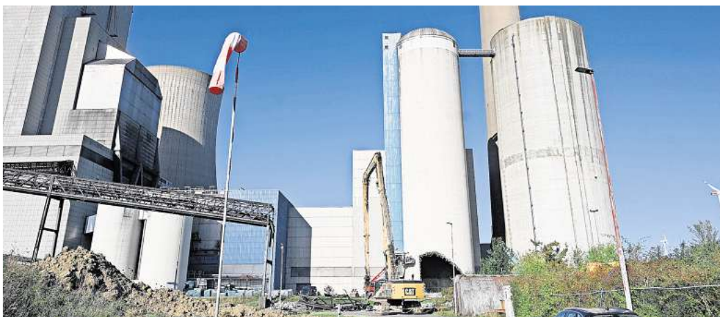
Das Kraftwerk Mehrum wird zurückgebaut. Zwei Silos sollen jetzt gesprengt werden.

Deshalb werde der Kühlturm höchstwahrscheinlich in 2025 zusammen mit dem 250 Meter