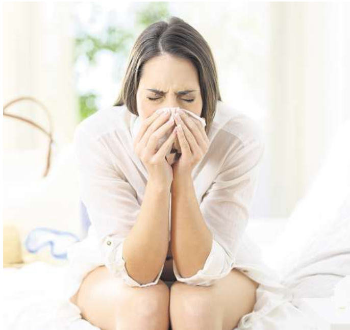
Wenn du im Urlaub krank bist, brauchst du eine Krankschreibung, um deine Urlaubstage später nachholen zu können.

Es ist manchmal schon ein ungeschriebenes Gesetz, dass man krank wird, sobald der Urlaub angefangen hat. Der Körper hat scheinbar plötzlich Zeit dafür. Doch du hast dir die Urlaubstage ja nicht genommen, um sie krank im Bett zu verbringen. Das ist sogar im Bundesurlaubsgesetz festgehalten, informiert unter anderem die Techniker-Krankenkasse: Wenn Beschäftigte während des Urlaubs erkranken, werden diese Tage nicht auf den Jahresurlaub angerechnet. Allerdings nur unter einer Bedingung: Die Arbeits-