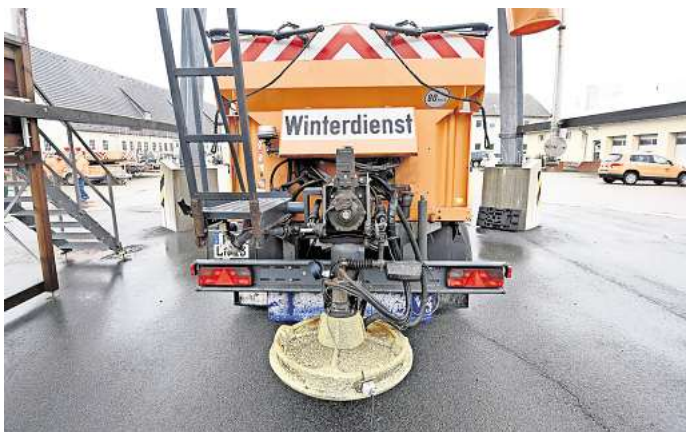
Auf dem Betriebshof des Landkreises Peine wird das Salz für den Winterdienst in einem Silo gelagert.