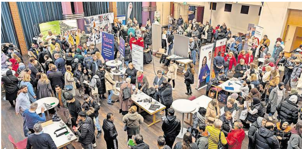
Hunderte Flüchtlinge kamen zur Jobmesse im Forum.