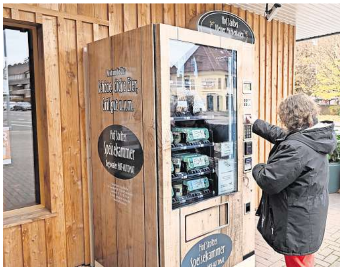
Vor dem „Kleinen Mühlenladen“ am Schwarzen Weg in Peine steht einer von drei neuen „Hof-Automaten“.

Die Produkte in den Automaten sollen letztendlich mehr Kundschaft in den Einzelhandel locken. Die Besonderheit der Hofläden: „Man weiß immer, wo die Ware herkommt. Ich kann zu jedem Produkt eine Geschichte erzählen“, sagte Stolte. Neben dem hausgemachten Eierlikör stammten die „hofprozentigen“ Liköre aus einem Betrieb in Rotenburg an der Wümme, wo die Tropfen noch in traditionellen Steinzeuggefäßen reifen. Das Mehl werde aus einer Biomühle