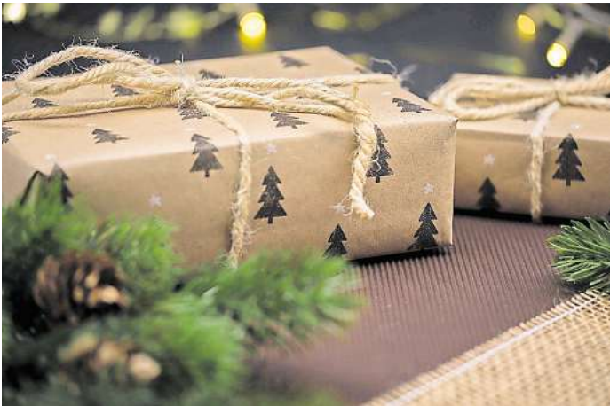
Die Teilnahme ist ganz einfach: Scannen Sie mit Ihrem Smartphone den QR-Code.