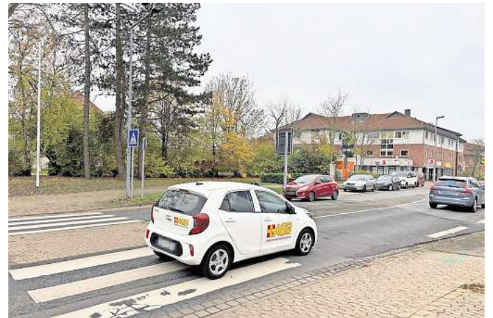
Das Medizinische Versorgungszentrum soll an der Eichstraße neben dem Ärztehaus entstehen.

Das Projekt sei auf einem guten Weg. Es gebe bereits einen möglichen Investor und einen potenziellen Bauunternehmer und auch Interessenten für den Betrieb. „Aktuell sieht es danach aus, als könnte es eine größere Praxis mit mehreren Ärzten geben. Im Idealfall sind auch Fachärzte dabei“, verrät Neuhäuser. Konkrete Namen möch-