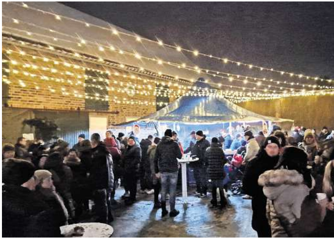
Der Hof der Familie Lahmann wird am 30. November wieder zum weihnachtlichen Treffpunkt für die ganze Familie.

Auch die Lebenshilfe Peine-Burgdorf ist wieder vor Ort mit