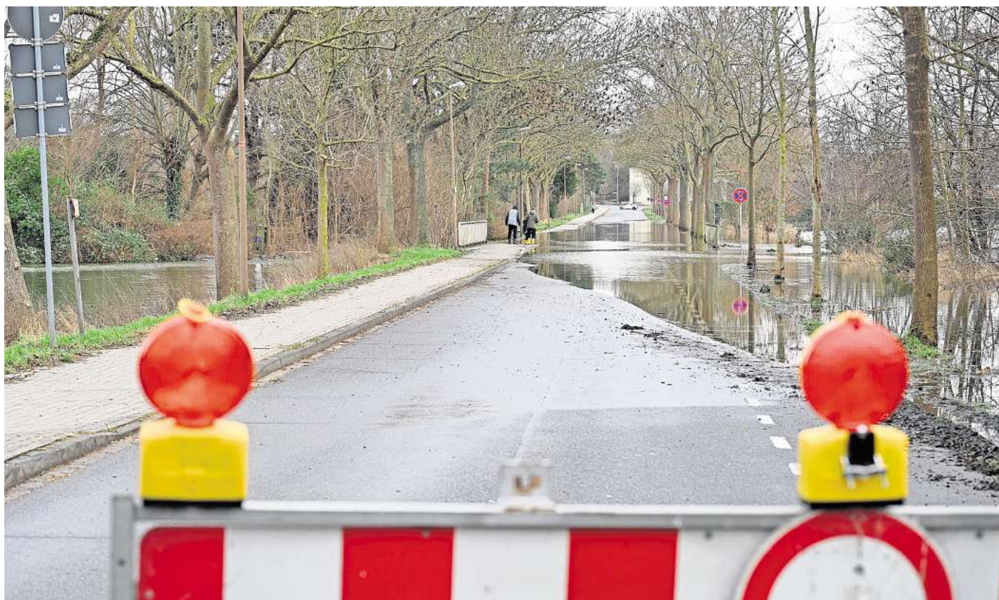
Rückblick in den letzten Winter: Der Madamenweg in Peine war wegen Hochwassers gesperrt.

Neben Starkregen bieten auch vollgelaufene Flüsse wie die Fuh-