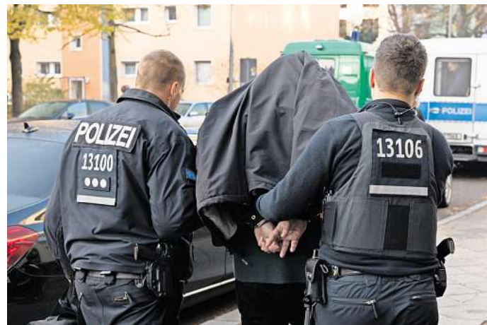
Polizeibeamte führen ein Clan-Mitglied mit Handschellen ab.

In Peine kam es in den vergangenen Jahren öfter zu gewalttätigen Auseinandersetzungen mit Clan-Hintergrund: Drogenhandel, Messer-Attacken und Massenschlägereien, am heftigsten zum Beispiel in der Silvester-