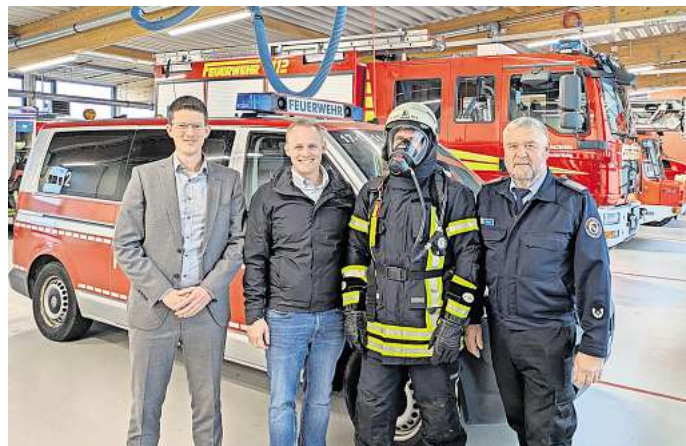
Einheitliche Ausstattung der Ortswehren: Künftig soll ein gemeinsamer Atemschutzverbund im Landkreisgebiet dafür sorgen.

An die jeweiligen Ortsfeuerwehren werden nun sukzessive, neben den Atemschutzgeräten inklusive Lungenautomaten, neue Atemschutzmasken, Mas-