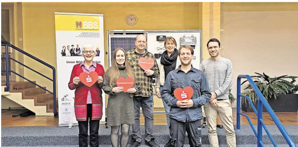
Spende für die BBS Peine: Die Sparkassenstiftung hat 5316 Euro übergeben.

Das BNE-Projekt der BBS Peine sieht vor, dass Schülerinnen und Schüler der BFS-Elektrotechnik eigenverantwortlich ein Balkonkraftwerk planen, kaufen, bauen und betreiben. Zur Visualisierung der durch das Balkonkraftwerk erzeugten Energie dient ein Display in der Aula. Die gespeicherte Energie