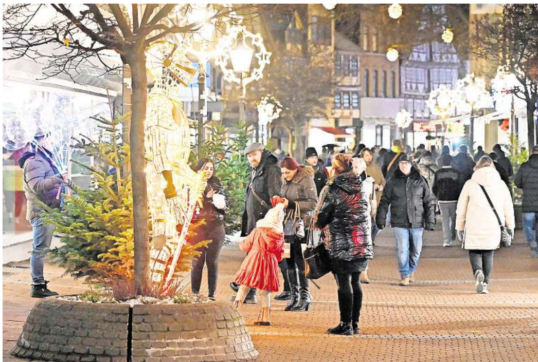
Hell erleuchtet: Die Peiner Weihnachtsstadt lädt zum Besuch ein.

Der Advent hält Einzug auf dem Marktplatz und in der Fußgängerzone – Offizielle Eröffnung mit dem Lampionumzug der Kinder