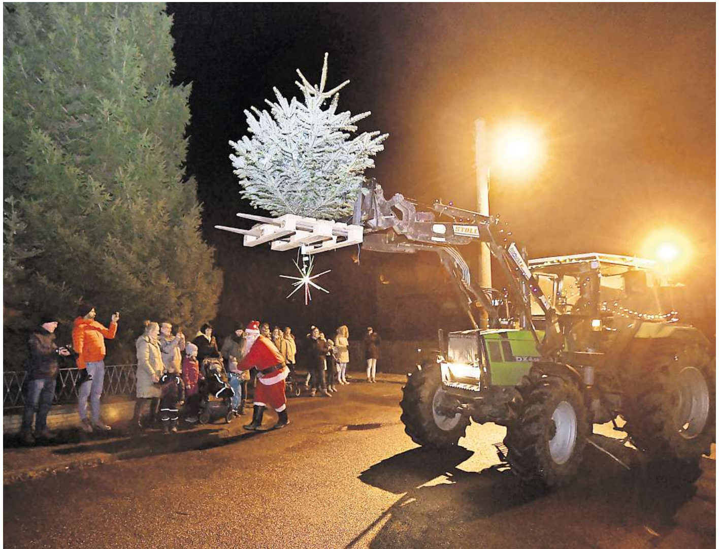
Anwohner freuten sich: 2021 hat in Schmedenstedt eine Lichterfahrt stattgefunden.

Nun sorgt allerdings ausgerechnet das niedersächsische Ministerium für Landwirtschaft und Verkehr für Verwirrung: Am 11. November gab es