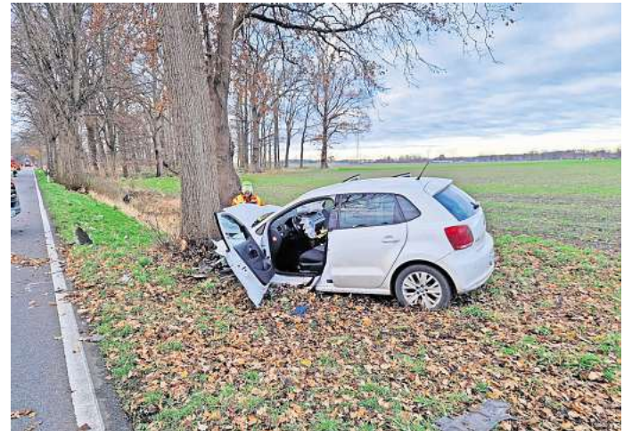
Ursache noch ungeklärt: In den Unfall auf der L387 waren zwei Mütter mit ihren Kindern verwickelt.

Trümmerteile beider Fahrzeuge lagen über die Fahrbahn verteilt. Der Einsatz für die Feuerwehrleute dauerte bis etwa 9.15 Uhr. Die Ermittlungen zur Unfallursache dauern an.