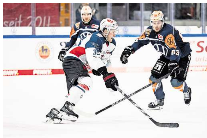
Für die Partie der Grizzlys Wolfsburg gegen die Nürnberg Ice Tigers können Hallo-Leser Tickets gewinnen.

Direkt zur Verlosung: Einfach den QR-Code mit dem Handy scannen.