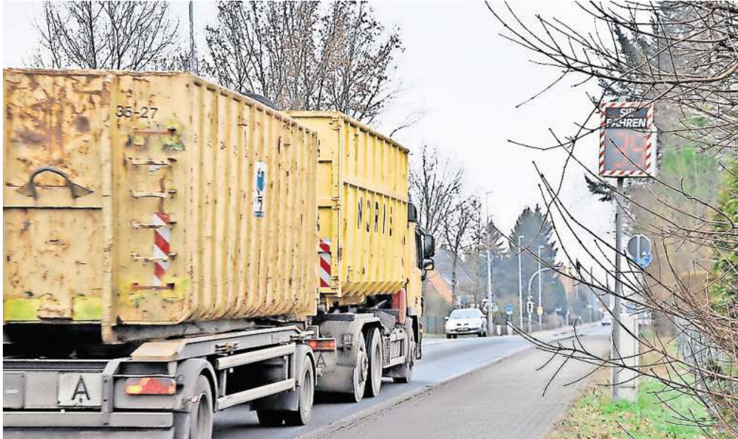
Der südliche Ortseingang von Hämelerwald: Der Ortsrat fordert jetzt Tempo 30 auf der gesamten Ortsdurchfahrt.