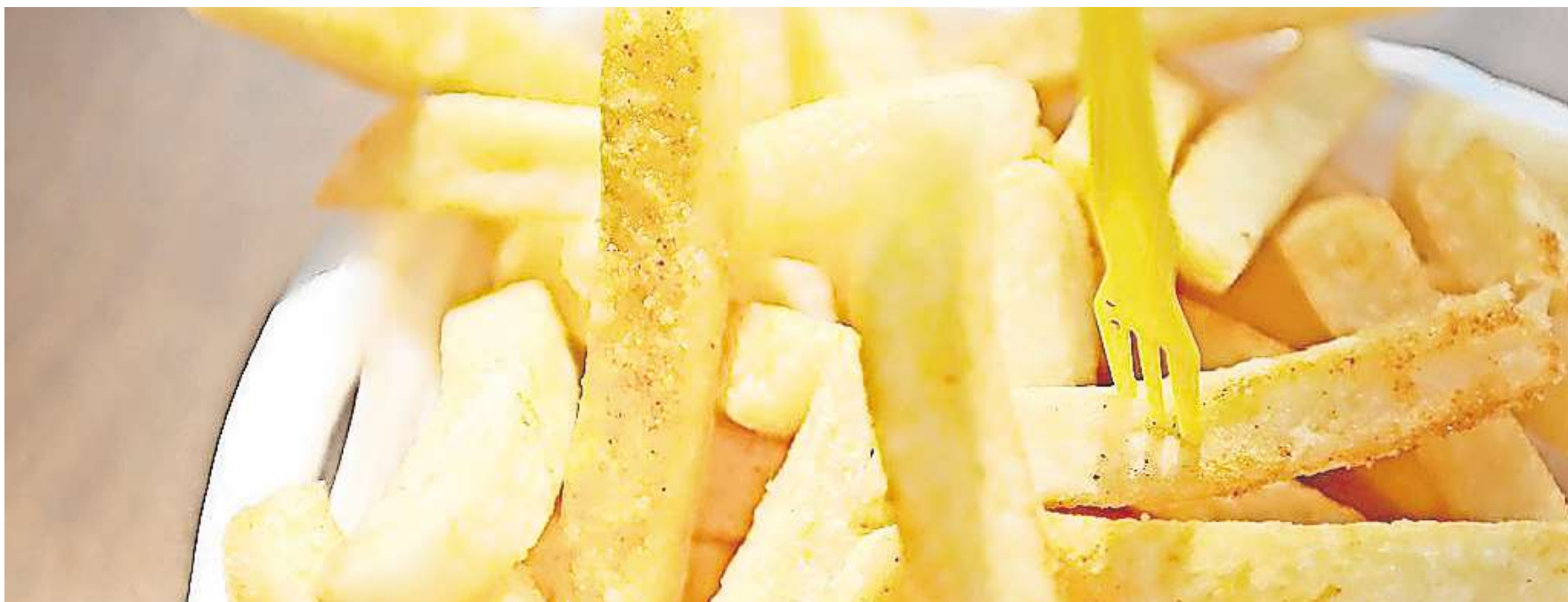
Pommesfabrik bei Hämelerwald: Es gibt 200 Stellungnahmen zu dem Vorhaben.