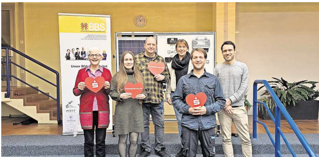
Spende für die BBS Peine: Die Sparkassenstiftung hat 5316 Euro übergeben.

Das BNE-Projekt der BBS Peine sieht vor, dass Schülerinnen und Schüler der BFS-Elektrotechnik eigenverantwortlich ein Balkonkraftwerk planen, kaufen, bauen und betreiben. Zur Visualisierung der durch das Balkonkraftwerk erzeugten Energie dient ein Display in der Aula. Die gespeicherte Energie