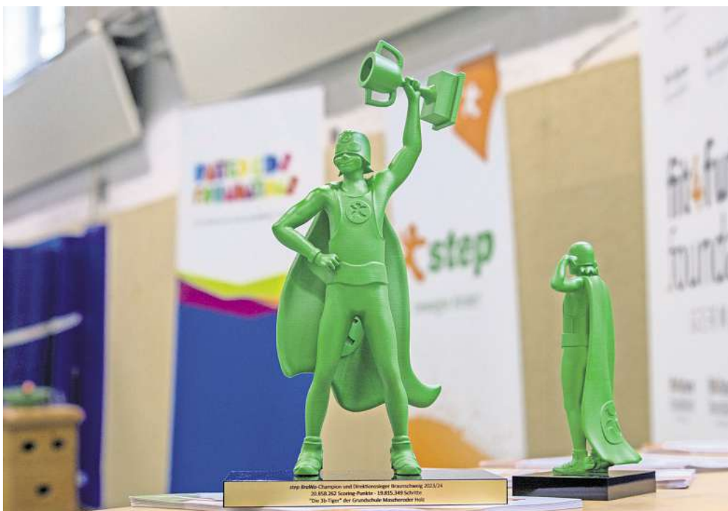
Schritte für den grünen Champion-Pokal: Die Brawo-Stiftung veranstaltet wieder einen Schrittwettbewerb.