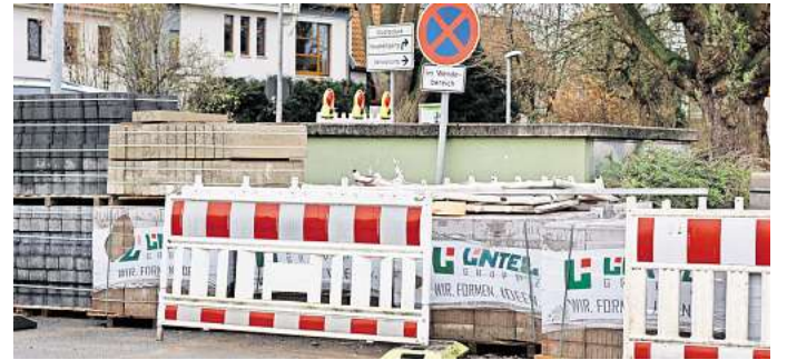
Das Bild zeigt eine innerörtliche Baustelle. In Peine müssen sich Anlieger künftig nicht mehr direkt an den Sanierungskosten beteiligen.

Bürgermeister Klaus Saemann hatte bereits 2020 den Vorschlag für eine Bürgerbefragung unterbreitet. Bis zur Umsetzung dieser Idee hat es also vier Jahre gedauert. Begründet wurde dies von der