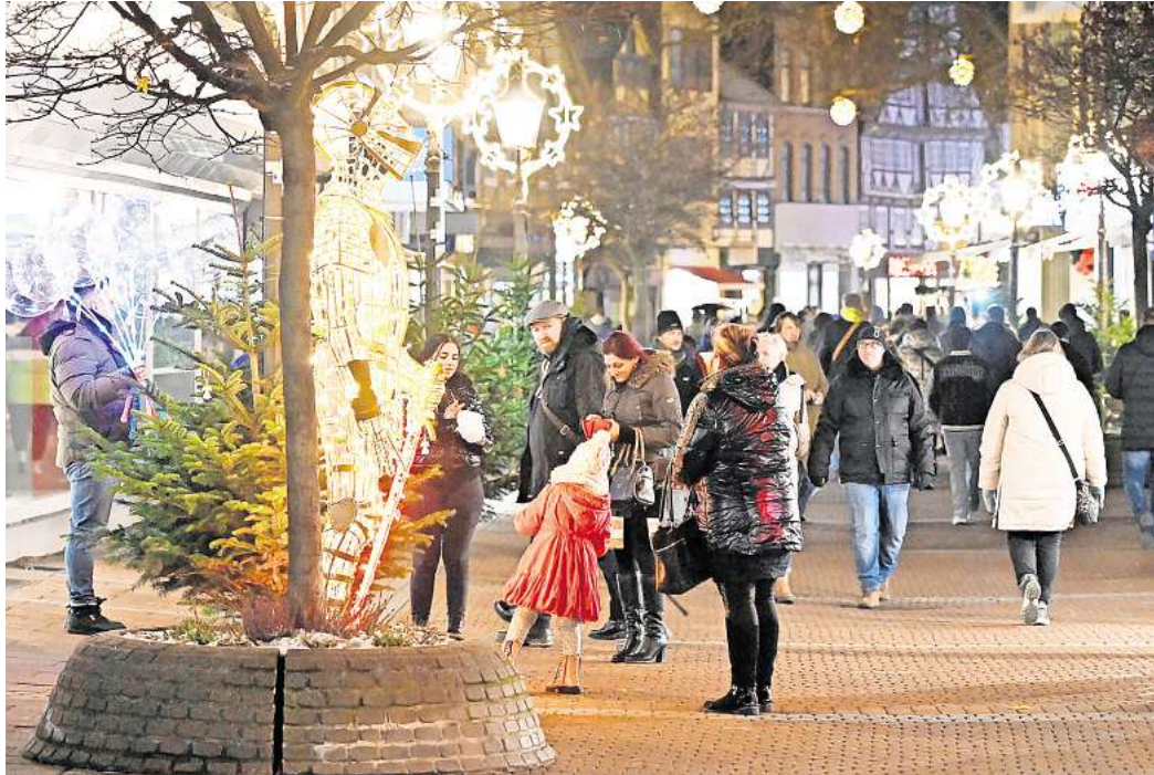
Hell erleuchtet: Die Peiner Weihnachtsstadt lädt zum Besuch ein.

Der Advent hält Einzug auf dem Marktplatz und in der Fußgängerzone – Offizielle Eröffnung mit dem Lampionumzug der Kinder