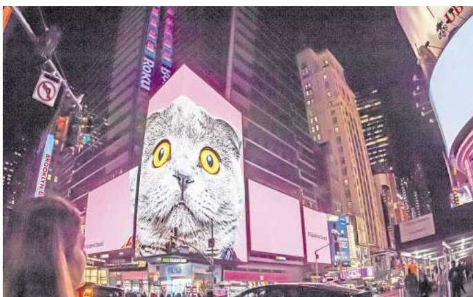
In New York City und anderen Orten der Welt gibt es Katzen, die immer wieder Reisende anlocken und begeistern.

Die viele Katzen in Istanbul sind kein Phänomen der Neuzeit. Schon zu Zeiten des Osmanischen Reichs lebten sie zu Tausenden in den Straßen der Stadt.