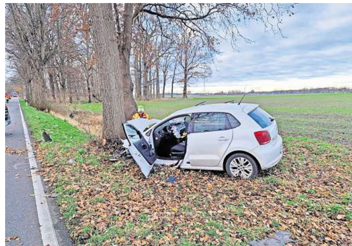
Ursache noch ungeklärt: In den Unfall auf der L387 waren zwei Mütter mit ihren Kindern verwickelt.

Trümmerteile beider Fahrzeuge lagen über die Fahrbahn verteilt. Der Einsatz für die Feuerwehrleute dauerte bis etwa 9.15 Uhr. Die Ermittlungen zur Unfallursache dauern an.