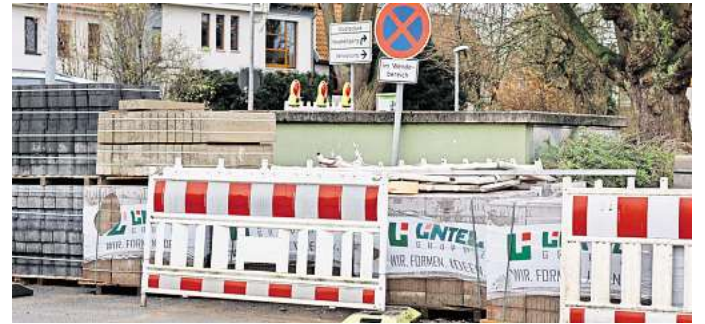
Das Bild zeigt eine innerörtliche Baustelle. In Peine müssen sich Anlieger künftig nicht mehr direkt an den Sanierungskosten beteiligen.