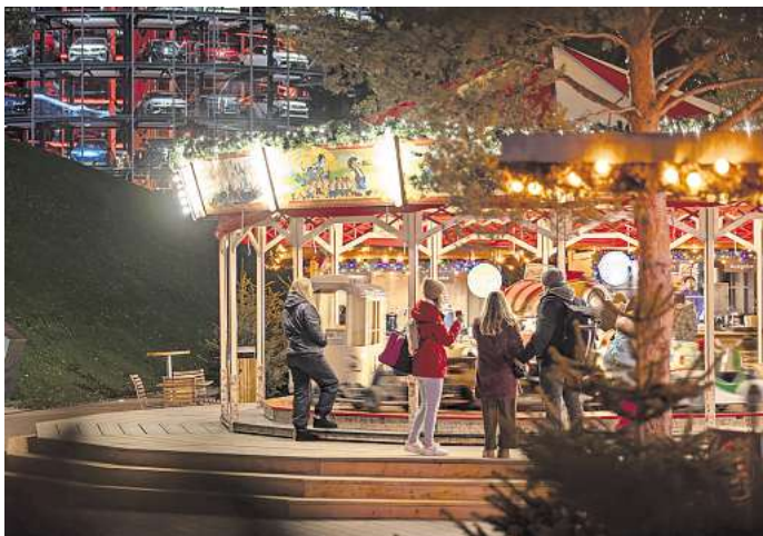
Winterwunderland in Wolfsburg: Der Weihnachtsmarkt in der Autostadt.

Direkt zur Umfrage: Einfach den QR-Code mit dem Handy scannen.