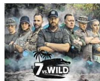
Die Teilnehmerinnen und Teilnehmer der zweiten Staffel „7 vs. Wild“.