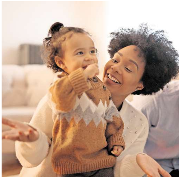
Die bedürfnisorientierte Erziehung ist für Eltern mit viel Arbeit verbunden.

Für Hummel stellt die bedürfnisorientierte Erziehung einen guten Mittelweg zwischen autoritärer und laissez-faire Erziehung dar. „Alles, was wir aus der pädagogischen Forschung wissen, sagt: Je zugewandter und beziehungsstärker wir erziehen,