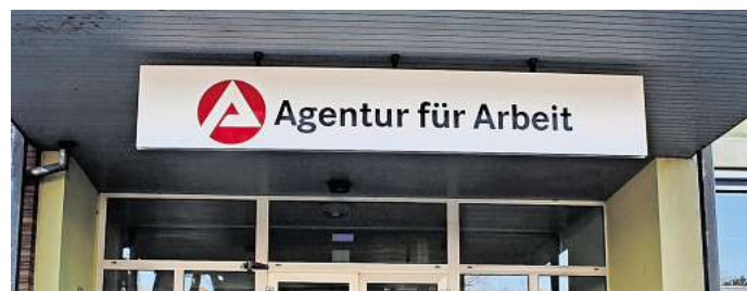
Die Agentur für Arbeit meldet die Arbeitslosenzahlen für Peine im November.

Zurzeit sind 4.337 Bewohnerinnen und Bewohner des Kreises arbeitslos gemeldet, 1.355 davon beziehen Arbeitslosengeld I, 2.982 Bürgergeld. Arbeitssuchend gemeldet sind sogar 6.707 Personen. Die Arbeitslosenquote im Landkreis liegt unverändert im Vergleich zum 2000| Vorjahreswert bei 5,9 Prozent, davon sind 40,2 Prozent Langzeiterwerbslose. Mit 54,8 Prozent ist der Anteil der Männer unter den Arbeitslosen höher als der der Frauen (45,2 Prozent), 37,2 Prozent der Arbeitslosen sind Ausländer, zwei Prozent jünger als 20 Jahre und