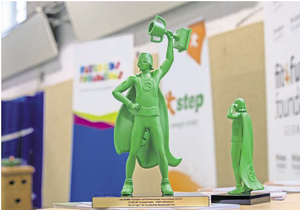
Schritte für den grünen Champion-Pokal: Die Brawo-Stiftung veranstaltet wieder einen Schrittwettbewerb.