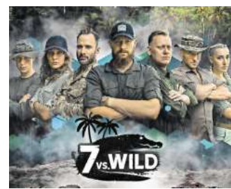
Die Teilnehmerinnen und Teilnehmer der zweiten Staffel „7 vs. Wild“.