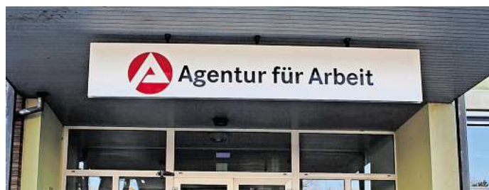
Die Agentur für Arbeit meldet die Arbeitslosenzahlen für Peine im November.

Zurzeit sind 4.337 Bewohnerinnen und Bewohner des Kreises arbeitslos gemeldet, 1.355 davon beziehen Arbeitslosengeld I, 2.982 Bürgergeld. Arbeitssuchend gemeldet sind sogar 6.707 Personen. Die Arbeitslosenquote im Landkreis liegt unverändert im Vergleich zum 2000 Vorjahreswert bei 5,9 Prozent, davon sind 40,2 Prozent Langzeiterwerbslose. Mit 54,8 Prozent ist der Anteil der Männer unter den Arbeitslosen höher als der der Frauen (45,2 Prozent), 37,2 Prozent der Arbeitslosen sind Ausländer, zwei Prozent jünger als 20 Jahre und