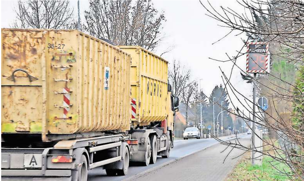
Der südliche Ortseingang von Hämelerwald: Der Ortsrat fordert jetzt Tempo 30 auf der gesamten Ortsdurchfahrt.