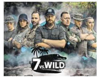
Die Teilnehmerinnen und Teilnehmer der zweiten Staffel „7 vs. Wild“.