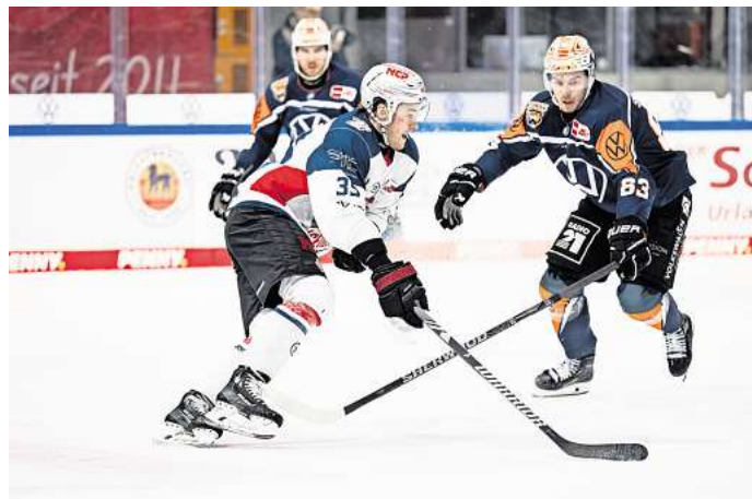
Für die Partie der Grizzlys Wolfsburg gegen die Nürnberg Ice Tigers können Hallo-Leser Tickets gewinnen.

Direkt zur Verlosung: Einfach den QR-Code mit dem Handy scannen.