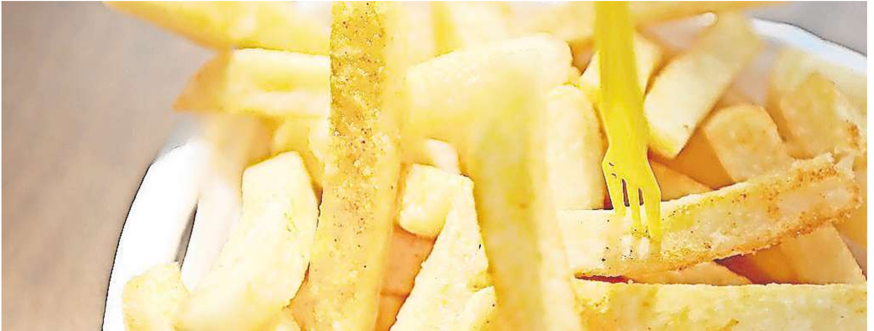
Pommesfabrik bei Hämelerwald: Es gibt 200 Stellungnahmen zu dem Vorhaben.