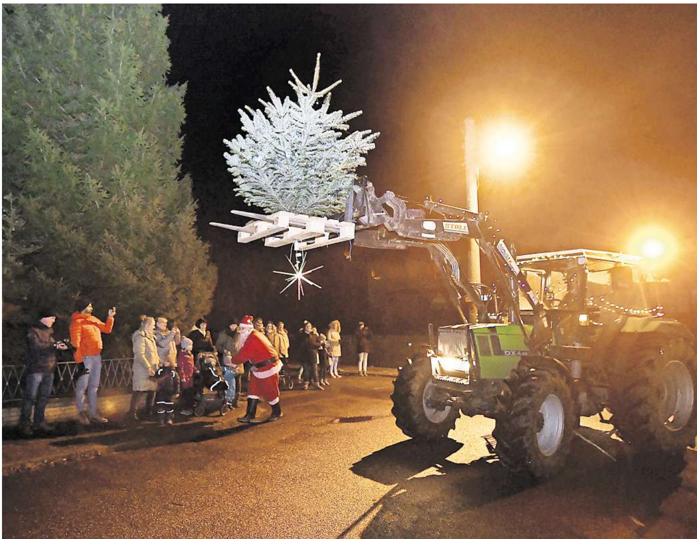
Anwohner freuten sich: 2021 hat in Schmedenstedt eine Lichterfahrt stattgefunden.

Nun sorgt allerdings ausgerechnet das niedersächsische Ministerium für Landwirtschaft und Verkehr für Verwirrung: Am 11. November gab es