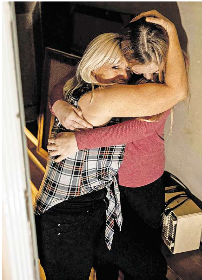
Mütter werden bei Streitigkeiten um das Sorgerecht oft benachteiligt, sagt eine Studie.

Im Zentrum der Studie steht der Umgang mit einer Annahme, die als wissenschaftlich überholt gilt und etwa in Leitfäden für Ärzte nicht mehr empfohlen wird: die absichtliche Entfremdung eines Elternteils vom Kind (Parental Alienation Syndrome, PAS). In der Studie heißt es, das PAS könne nach wie vor „einen zentralen Stellenwert bei Jugendämtern und in familienrechtlichen Verfahren haben“. Mütter würden dabei als „Störfaktor in der Beziehung des Kindes zum Vater“ dargestellt, die Kontakte zum Vater aus egoistischen Motiven einschränkten. Macht- und Kontrollverhalten von Vätern würde häufig ignoriert oder verharmlost.