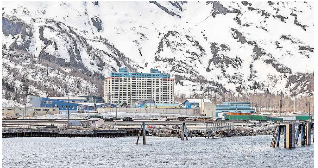
In diesem Haus in Alaska leben fast alle Einwohnerinnen und Einwohner der Stadt.

Ein weiteres besonderes Erlebnis ist eine Kajakfahrt durch das ruhige Gewässer des