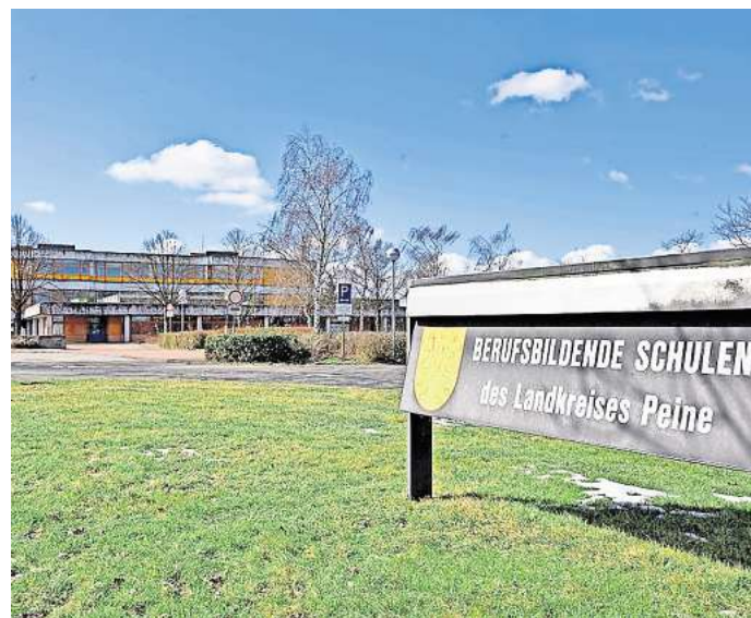
Jetzt anmelden: Die Berufsbildenden Schulen (BBS) des Landkreises Peine in Vöhrum bieten künftig Ingenieurwissenschaften an.

Ein Vorteil des neuen Schwerpunkts sei die Möglichkeit für die Schülerinnen und Schüler, verschiedene ingenieurwissenschaftliche Fachrichtungen kennenzulernen, ohne sich von Anfang an für einen bestimmten Be-