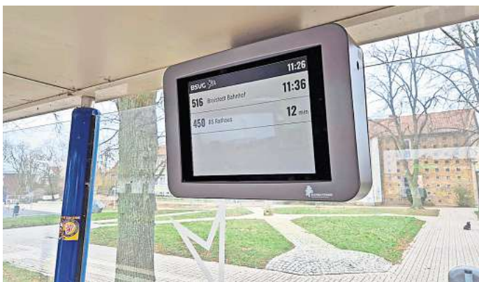
Moderne Technik im Rahmen des Hilde-Projektes: DFI-Monitor an der Bushaltestelle „Wahler Weg“ in Vechede.

Das DFI-System funktioniert ohne vorhandenen Stromanschluss und wird üblicherweise über ein Solarmodul mit Energie