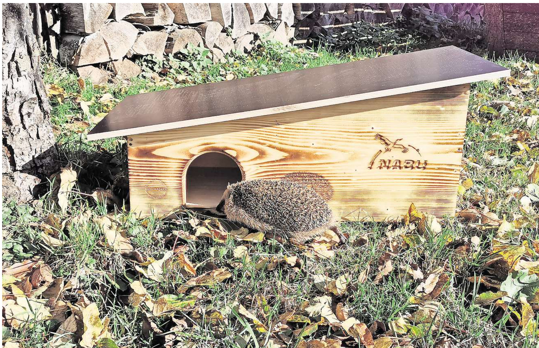
Ein sicherer Unterschlupf für den Winterschlaf: Der NABU bietet Baupläne für eine kleine Igelburg an.

Der NABU in Salzgitter lädt die Naturfreunde dazu ein, 2025 zum ganz persönlichen Igeljahr machen