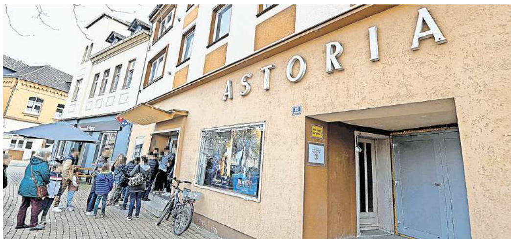
Das Astoria in Peine: Wir würden gerne von Ihnen wissen, wie oft Sie im Jahr ins Kino gehen.

Direkt zur Umfrage: Einfach den QR-Code mit dem Handy scannen.