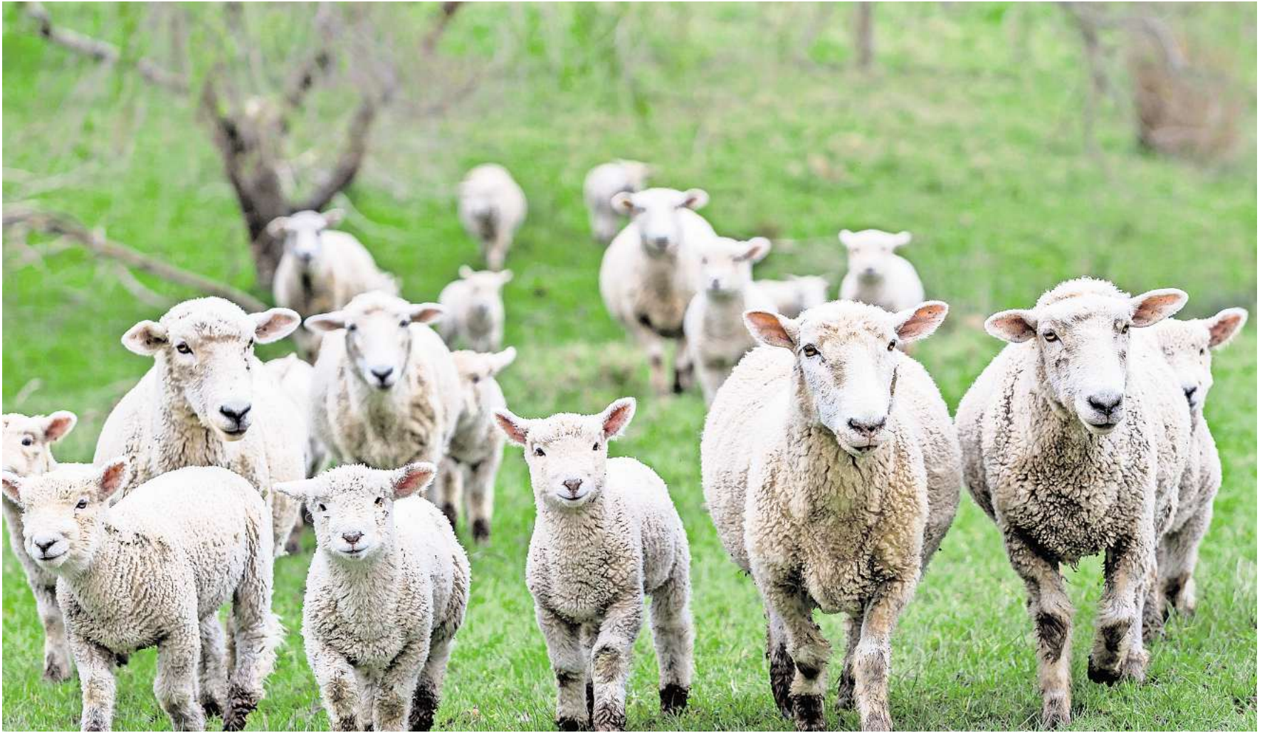
Nahe Brandenburg ist die Maul- und Klauenseuche ausgebrochen.