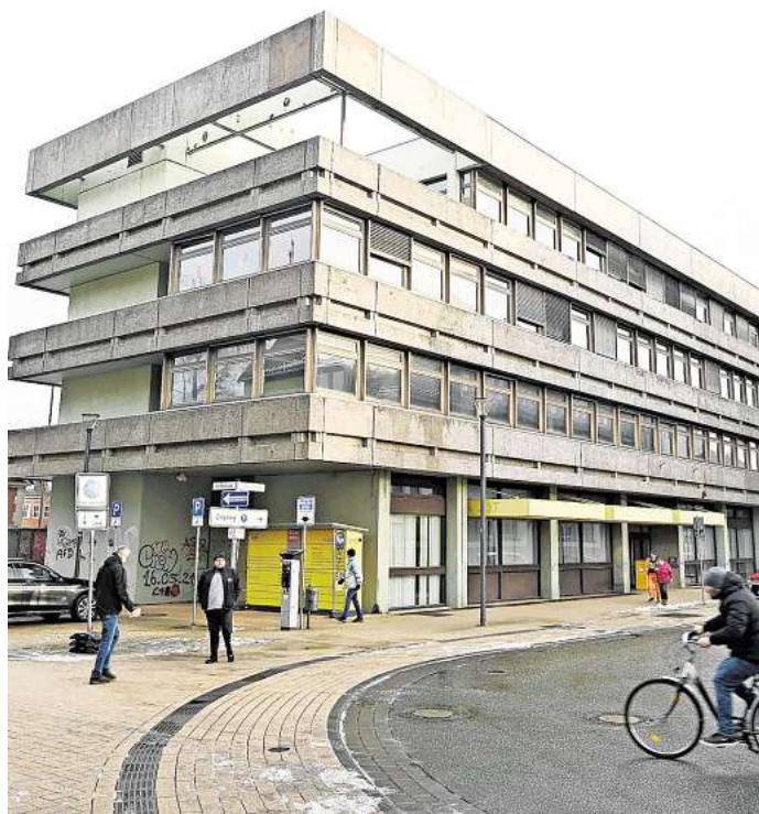
Anstelle des alten Postgeländes in Peine soll bald ein neues Seniorenheim stehen.

es seit 2005. Das Unternehmen betreibt nach eigenen Angaben knapp 100 Seniorenresidenzen in Deutschland. „An einem neuen Standort, wie der Seniorenresidenz in Peine, erleben die Bewohner nicht nur ein modernes, sicheres Zuhause, sondern auch ein vielseitiges Serviceangebot“, sagt Compassio-Sprecherin Christine Breyer. Die „Schönes-Leben“-Gruppe ist seit 2017 auf dem Markt aktiv und verfügt in Deutschland aktuell über vier Wohnanlagen inklusive ambulanter Pflege und Tagespflege, darunter auch ein Haus in Wolfsburg.