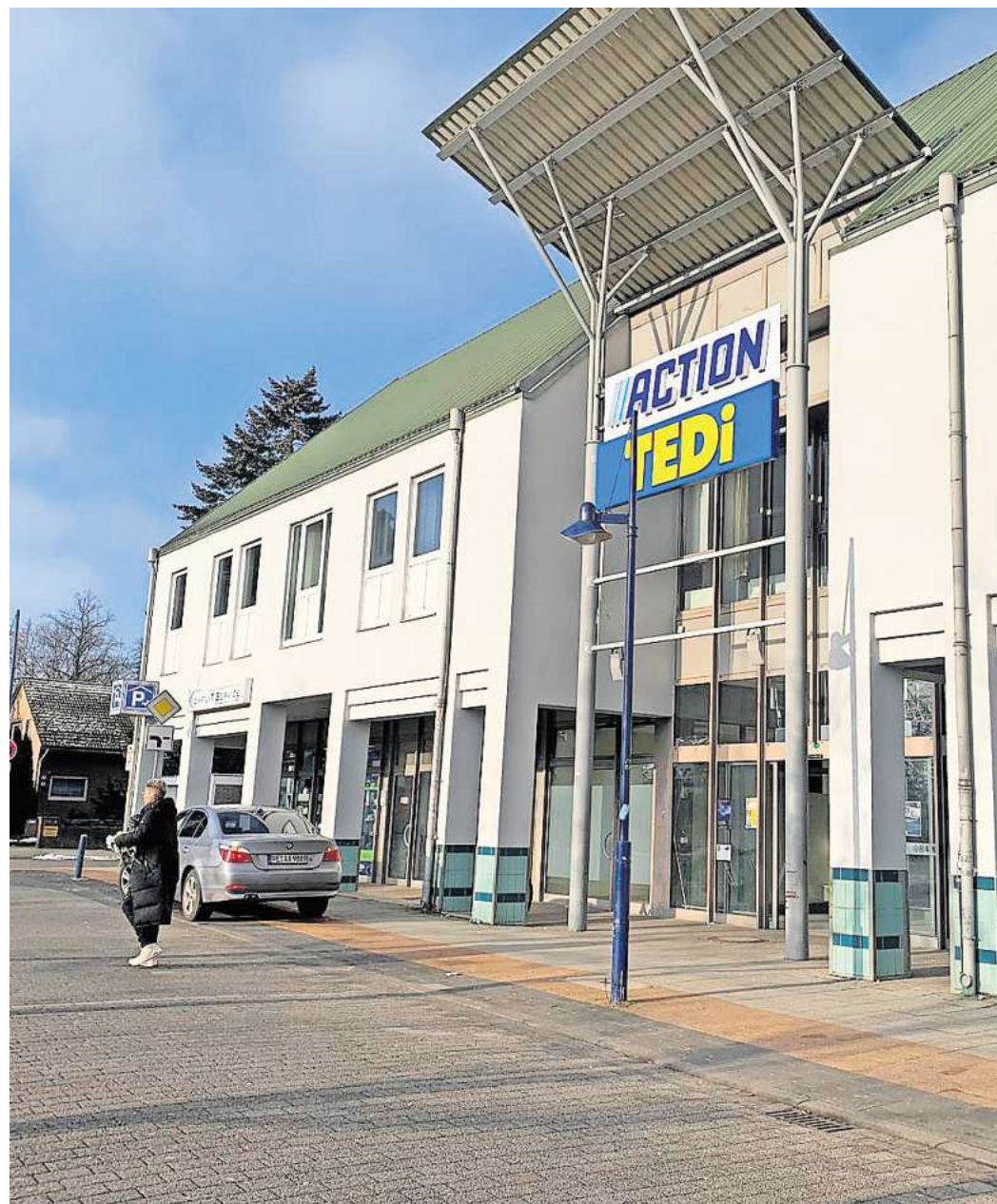
Das Angebot im E-Center wird erweitert. Was genau für Freizeitattraktionen sind geplant?