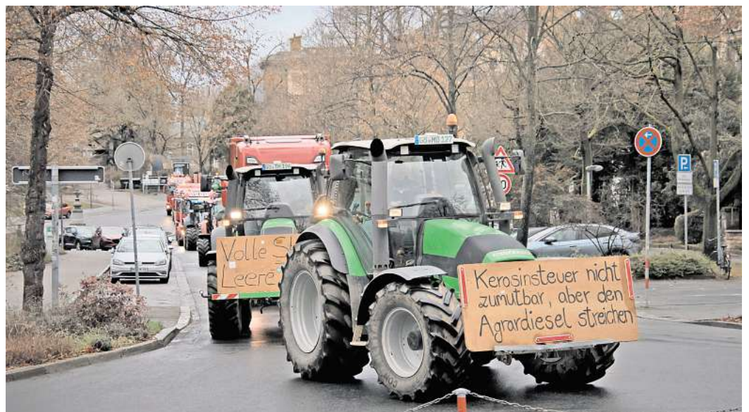
Vor einem Jahr: Aufgebrachte Landwirte protestierten in Peine. Auch jetzt noch sind sie mit ihrer Situation unzufrieden.