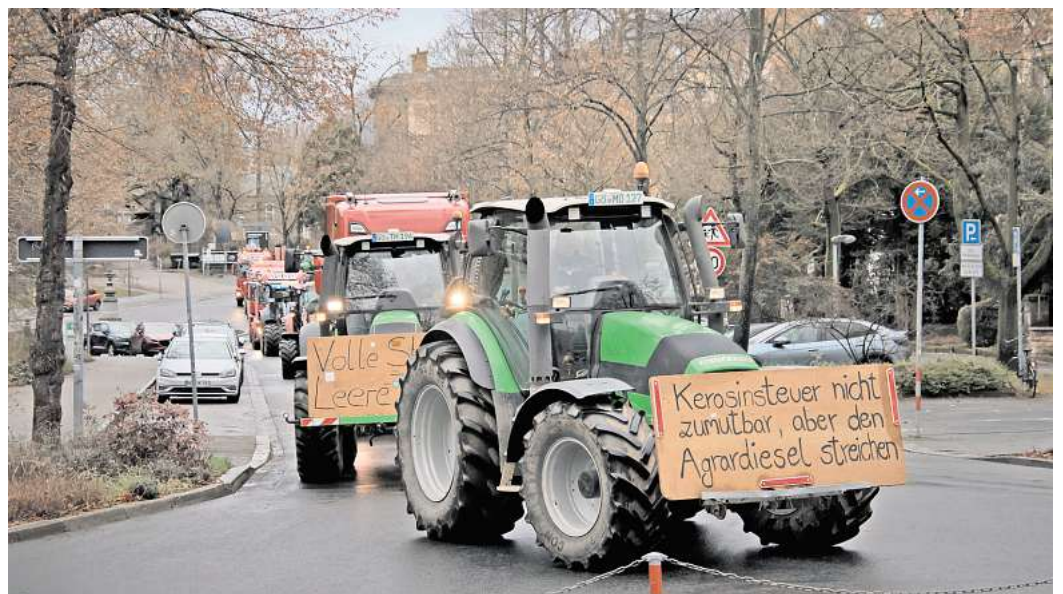
Vor einem Jahr: Aufgebrachte Landwirte protestierten in Peine. Auch jetzt noch sind sie mit ihrer Situation unzufrieden.