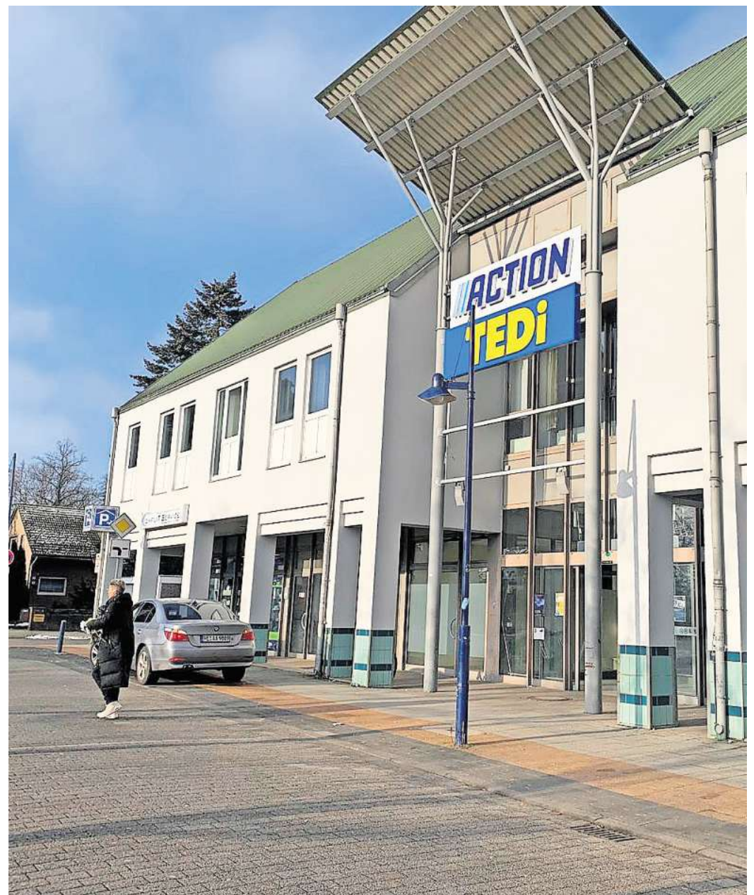
Das Angebot im E-Center wird erweitert. Was genau für Freizeitattraktionen sind geplant?