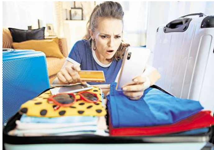
In vielen Bereichen wird Urlaub 2025 teurer.

Reisende, die viel mit dem Auto unterwegs sind, müssen mit deutlichen Mehrkosten in Deutschland rechnen. Zum 1. Januar 2025 ist der festgelegte CO 2 -Preis angestiegen. Statt wie bisher 45 Euro werden 55 Euro pro Tonne CO 2 fällig. Wenn die Anbieter diese Zusatzkosten eins zu eins auf Verbraucherinnen und Verbraucher umlegen, werden Diesel und Benzin spürbar teurer sein. Für den Liter