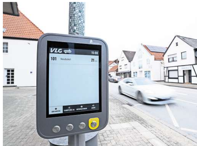
Mehr digitale Fahrplanauskünfte: Der Regionalverband Großraum Braunschweig stattet immer mehr Bushaltestellen in der Region Gifhorn, Peine und Wolfsburg mit modernen Anzeigesystemen aus.