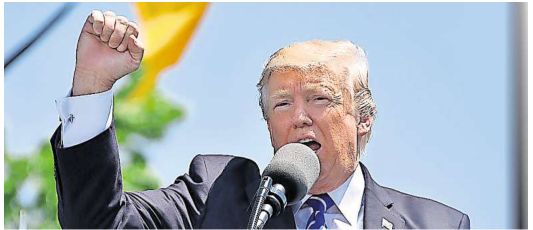
Donald Trump wurde am 20. Januar als 47. Präsident der Vereinigten Staaten von Amerika vereidigt.

dabei, das zu organisieren“, erklärte Trump vor einer Woche in Florida. Die Aussagen stoßen in der Ukraine überwiegend auf Skepsis. Kiew befürchtet, dass Trump einen für die Ukraine ungünstigen Deal mit Moskau anstreben könnte, der möglicherweise territoriale Zugeständnisse oder eine Schwächung der westlichen Unterstützung beinhaltet. Viele Experten und Politiker weltweit diskutieren nun, ob Trumps Ansatz tatsächlich zu einem raschen Ende des Ukrainekriegs führen könnte oder ob seine angekündigte Strategie den Konflikt möglicherweise verschärfen wird.