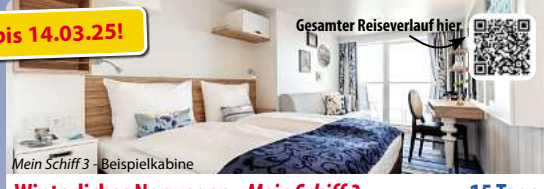
Gesamter Reiseverlauf hier