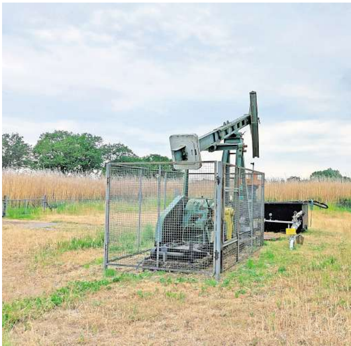
Das Erdölfeld Oelheim-Süd bei Wendesse ist derzeit das einzige, das im Landkreis Peine, durch Vermilion Energy Germany betrieben wird.

Darüber hinaus betreibe Vermilion noch weitere Erdölfelder im Landkreis Gifhorn und bei Hannover. Im Bereich der Erdgasförderung sei das Unternehmen dagegen lediglich an Standorten im Kreis Celle sowie in Ostfriesland aktiv. Im Nachbarlandkreis Gifhorn liegen die Erdölfelder in Vorhop, Knesebeck und Hankensbüttel. Mit knapp 15.400 Tonnen im Jahr 2021 weist das Erdölfeld in Vorhop die