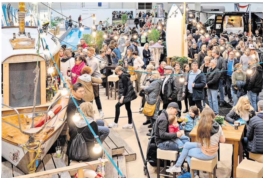
Für die ABF 2025 in Hannover können Leser Eintrittskarten gewinnen.

Direkt zur Verlosung: Einfach den QR-Code mit dem Handy scannen.