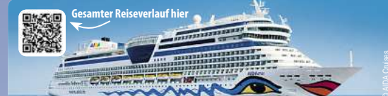
Gesamter Reiseverlauf hier