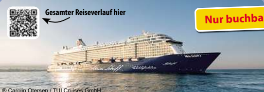
Gesamter Reiseverlauf hier