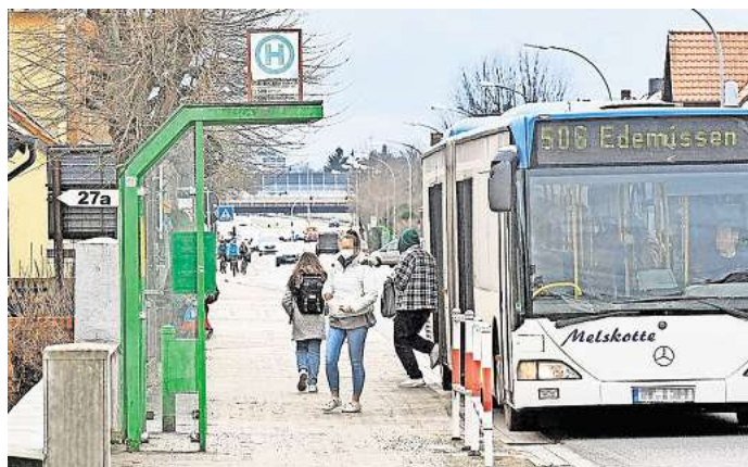
Zahlreiche Bushaltestellen werden in Peine saniert oder neu gebaut.

Das Land Niedersachsen gewährt mehr als zwei Millionen Euro Fördermittel