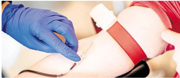
Dem DRK Peine mangelt es aktuell an Blutspenden.

Jede und jeder habe die Möglichkeit, sogar mehrfach im Jahr zu spenden. So könnten Frauen inner-