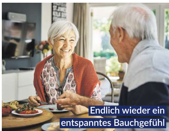
Endlich wieder ein entspanntes Bauchgefühl

Magen-Tropfen, sorgen sechs clever kombinierte natürliche Wirkstoffe für eine deutlich spürbare, schnelle „Erste Magen- und Verdauungshilfe“. Bitterstoffe aus Wermut-, Benediktenkraut und Angelikawurzel steigern rasch die Speichelproduktion und stoßen im Magen-Darm-Trakt die Produktion von Gallensaft und Magensäure an. 1,2 Dank Gänsefingerkraut, Süßholzwurzel sowie Kamillenblüten entspannen Magen und Darm.