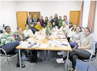
Neue Qualifizierung „Stand up! Mitarbeitende in der Pflege stärken“: Insgesamt nehmen fünf Pflegeeinrichtungen an der Maßnahme teil.

freiwilliger Basis mit einem Abschlusskolloquium und soll weitere Schritte zur persönlichen und fachlichen Qualifizierung enden.