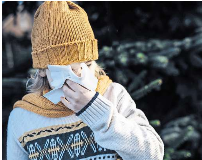
Laut dem Robert-Koch-Institut rollt die Grippe-Welle an.

„Gerade in den Wintermonaten ist es deshalb sinnvoll, die allgemeinen Hygieneregeln einzuhalten, um sich vor Ansteckung zu schützen“, empfiehlt der Sprecher. Experten raten zur Corona-