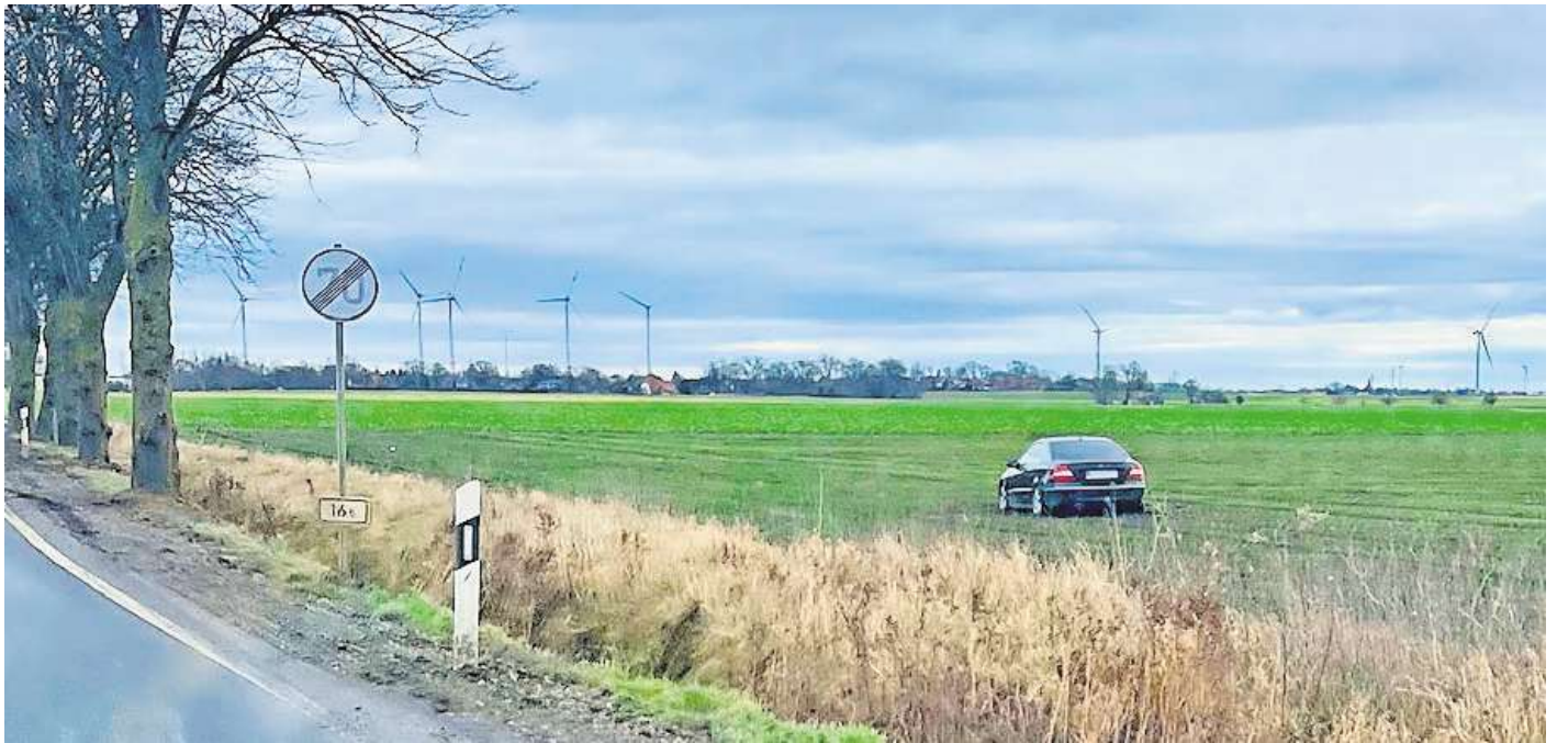
Die Verfolgungsjagd endete auf dem Acker: Ein 17-Jähriger ist in Hohenhameln auf der Flucht vor der Polizei mit einem Auto auf einem Feld gelandet.

Eine Hildesheimer Polizeistreife habe ihn dort entdeckt - und dazu noch den Fahrer, der sich in der Nähe des Fahrzeugs aufhielt. Er war unverletzt geblieben.