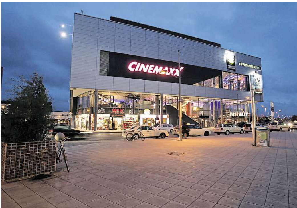
hallo-Leser können CinemaxX-Gutscheine gewinnen.

Einen Tag vor dem Valentinstag starten einige neue Filme in Deutschland. Die Fortsetzung des Kino-Hits Wunderschön läuft am 13. Februar an. WUNDERSCHÖNER, eine dramatische Komödie von Karoline Herfurth, begleitet die liebgewonnenen Figuren aus dem ersten Teil auf ihrem weiteren Weg zu sich selbst. Für Fans von Spannung und Adrenalin läuft Captain America 4: New World Order. Der vierte Teil der beliebten Superhelden-Reihe ga-