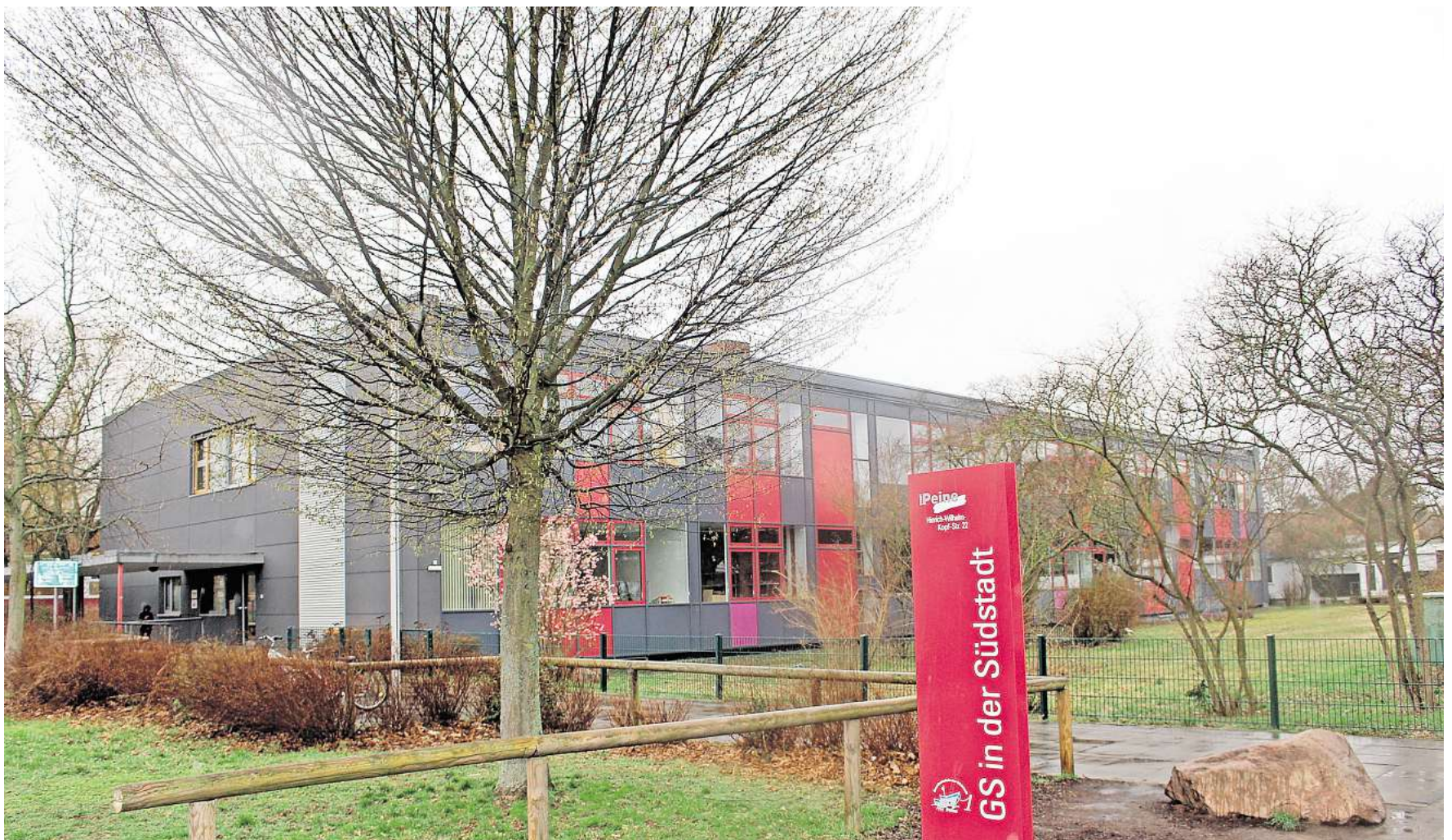
Eines der großen Investitionsprojekte der nächsten Jahre: Die Grundschule in der Südstadt soll ausgebaut und erweitert werden.

Der nächste Haushalt der Stadt Peine wird für 2027 und 2028 gelten. In der Verantwortung sind dann ein neuer Rat und möglicherweise auch ein anderer Bürgermeister, denn 2026 stehen Kommunalwahlen an.