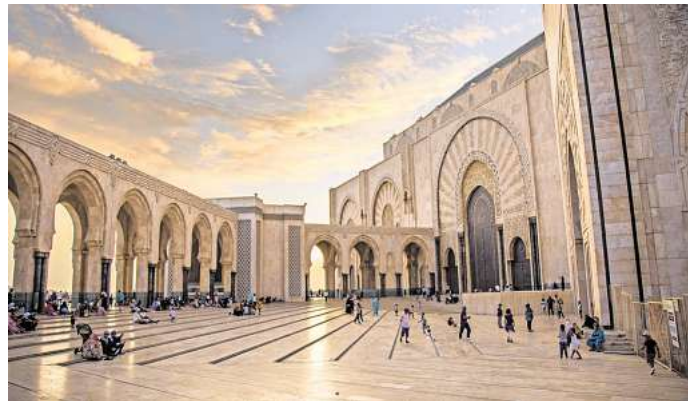
Die Hassan II Moschee in Casablanca ist zu jeder Tageszeit ein Erlebnis und sollte unbedingt auf deiner Aktivitätenliste stehen!

Fès ist ein echter Marokko-Liebling. Nicht wenige Globetrotter nennen die Millionen-