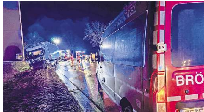
Der Tatverdächtige (77) hatte einen schweren Unfall auf der B214 in Höhe der Abfahrt nach Uetze.

Aufgrund des Unfalls wurde ein Großaufgebot der umliegenden Feuerwehren alarmiert. Bei