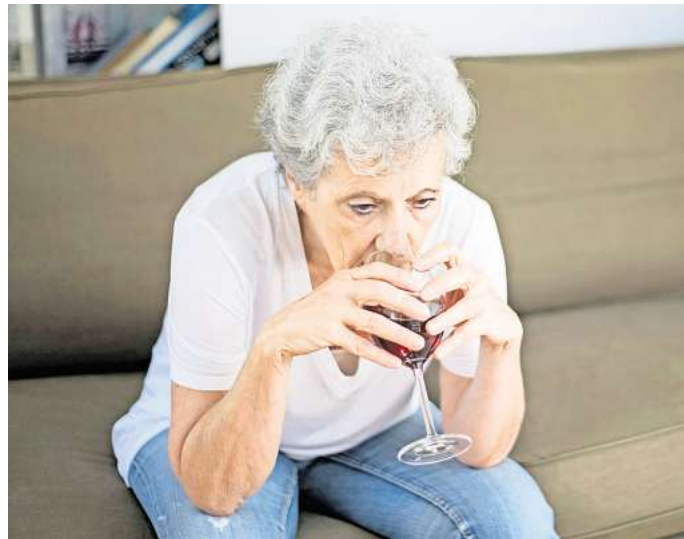
Alkohol wird mit zunehmendem Alter vom Körper immer weniger vertragen.

Auch die Arzneimittel spielen eine Rolle: Durch alterstypische Erkrankungen müssten häufiger Medikamente genommen werden. Wolter: „Das erhöht das Risiko von Wechselwirkungen, was sich nicht zuletzt auf die