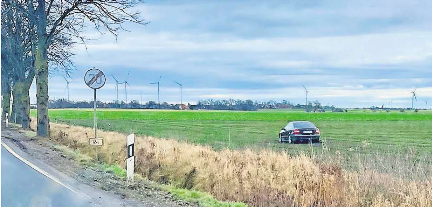
Die Verfolgungsjagd endete auf dem Acker: Ein 17-Jähriger ist in Hohenhameln auf der Flucht vor der Polizei mit einem Auto auf einem Feld gelandet.

Eine Hildesheimer Polizeistreife habe ihn dort entdeckt - und dazu noch den Fahrer, der sich in der Nähe des Fahrzeugs aufhielt. Er war unverletzt geblieben.