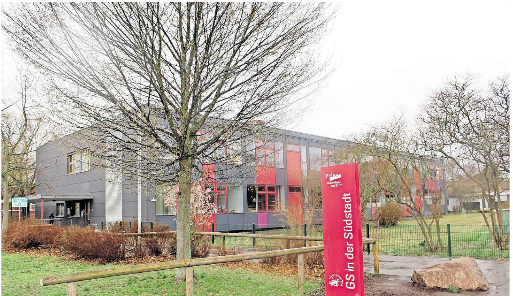
Eines der großen Investitionsprojekte der nächsten Jahre: Die Grundschule in der Südstadt soll ausgebaut und erweitert werden.

Der nächste Haushalt der Stadt Peine wird für 2027 und 2028 gelten. In der Verantwortung sind dann ein neuer Rat und möglicherweise auch ein anderer Bürgermeister, denn 2026 stehen Kommunalwahlen an.