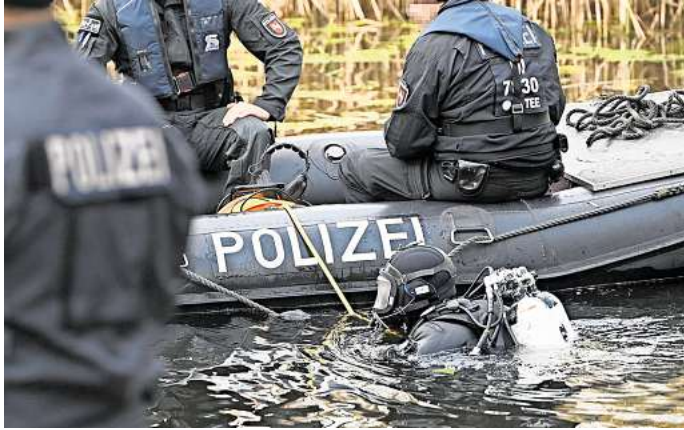
Großeinsatz: Acht Polizeitaucher suchen nach der vermissten Frau in dem Waldsee bei Hämelerwald.

Die Suche nach der Peinerin hatte viele Menschen berührt – und beschäftigt. Ende Oktober folgte eine Heerschar an Helfern dem Aufruf von Angehörigen der Frau sowie der Feuerwehr. Unter dem Motto „Wir wollen Heike suchen“ durchstöberten dann rund 350 Menschen das etwa 700 Hektar große und zum Teil sehr unüber-