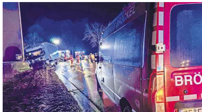
Der Tatverdächtige (77) hatte einen schweren Unfall auf der B214 in Höhe der Abfahrt nach Uetze.

Aufgrund des Unfalls wurde ein Großaufgebot der umliegenden Feuerwehren alarmiert. Bei