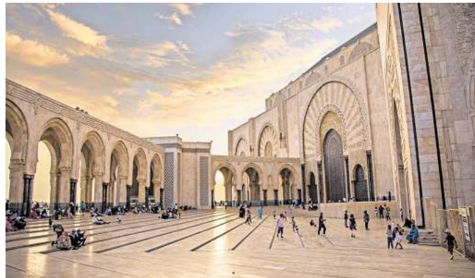
Die Hassan II Moschee in Casablanca ist zu jeder Tageszeit ein Erlebnis und sollte unbedingt auf deiner Aktivitätenliste stehen!

Fès ist ein echter Marokko-Liebling. Nicht wenige Globetrotter nennen die Millionen-