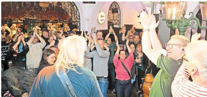
Rückblick 2024: Die Band „Juicy Fruits“ feiert mit den Gästen beim Honky-Tonk im Härke-Brauerei-Ausschank.

2024 waren hunderte jüngere und ältere Menschen zum Honky-Tonk unterwegs. Dabei öffneten der Härke-Brauerei-Ausschank, das Härke-Braustübchen, die Garage sowie der Saal und das Restaurant des Schützenhauses ihre Türen. „Die Lokale aus 2024 hätten wahrscheinlich sogar wieder mitgemacht. Aber fünf Lokale sind einfach zu we-