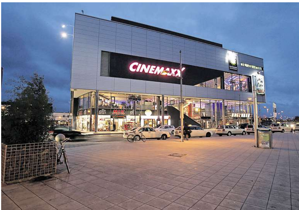
hallo-Leser können CinemaxX-Gutscheine gewinnen.

Einen Tag vor dem Valentinstag starten einige neue Filme in Deutschland. Die Fortsetzung des Kino-Hits Wunderschön läuft am 13. Februar an. WUNDERSCHÖNER, eine dramatische Komödie von Karoline Herfurth, begleitet die liebgewonnenen Figuren aus dem ersten Teil auf ihrem weiteren Weg zu sich selbst. Für Fans von Spannung und Adrenalin läuft Captain America 4: New World Order. Der vierte Teil der beliebten Superhelden-Reihe ga-