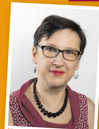
K. Galuszka-Stolz Foto: Senioren- und Pflegestützpunkt

FIPS-Referenten informieren über Krankheitsbilder, bei denen APP erteilt wird, wie man eine Versorgung erhält, was APP leistet, Dauer und Besonderheiten.