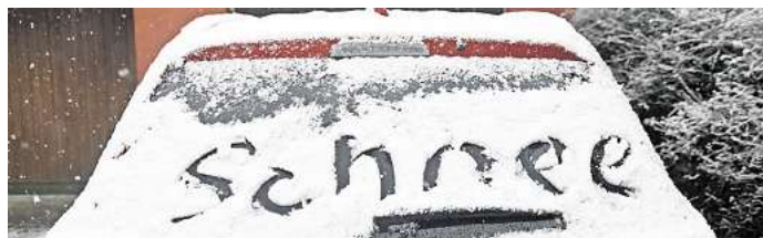
Der Winter ist bislang mehr oder weniger ausgefallen. Wünschen Sie sich noch einmal Schnee in diesem Frühjahr? (Symbolbild)