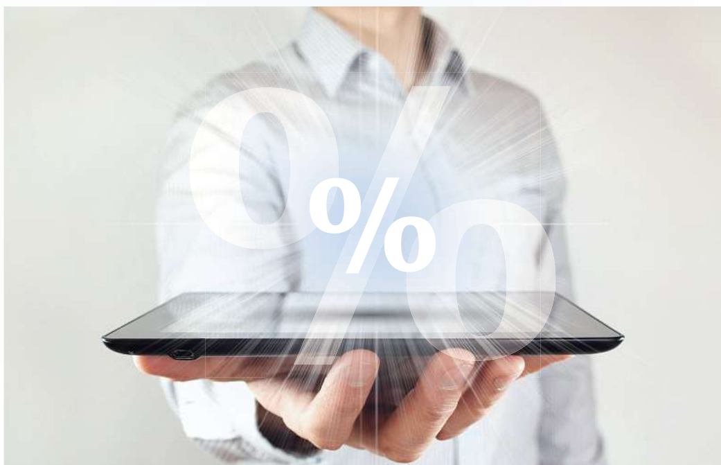
Die neuesten Nachrichten auf dem Samsung Galaxy Tab A9+ oder dem Apple iPad (10. Gen.) – die PAZ macht es möglich.

Das E-Paper der PAZ mit den neuesten und wichtigsten