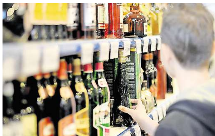
Hochprozentiger Alkohol darf in Deutschland erst ab 18 Jahren gekauft werden.

Das Jugendschutzgesetz regelt den Schutz von Kindern und Jugendlichen in der Öffentlichkeit und besagt unter anderem, dass der Verkauf von Wein, Bier und Sekt an Jugendliche unter 16 Jah-