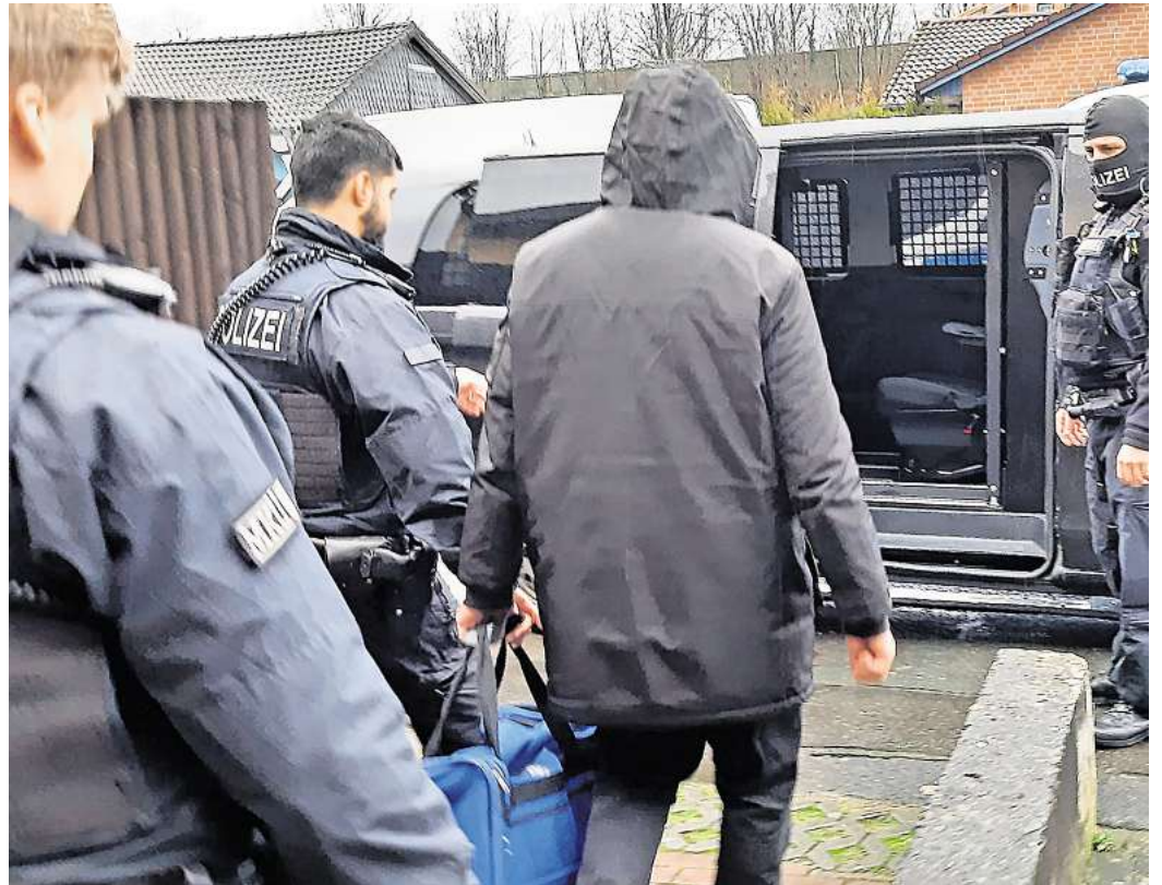
Razzia gegen Schleuserbande: Hier wird der mutmaßliche Kopf der Bande in Garbsen festgenommen, auch in Peine und Gifhorn gab es Durchsuchungen bei jeweils einem Beschuldigten.

Ebenso sei ihm noch nicht bekannt, ob und was in Gifhorn und Peine sichergestellt worden ist. Insgesamt haben die Ermitt-