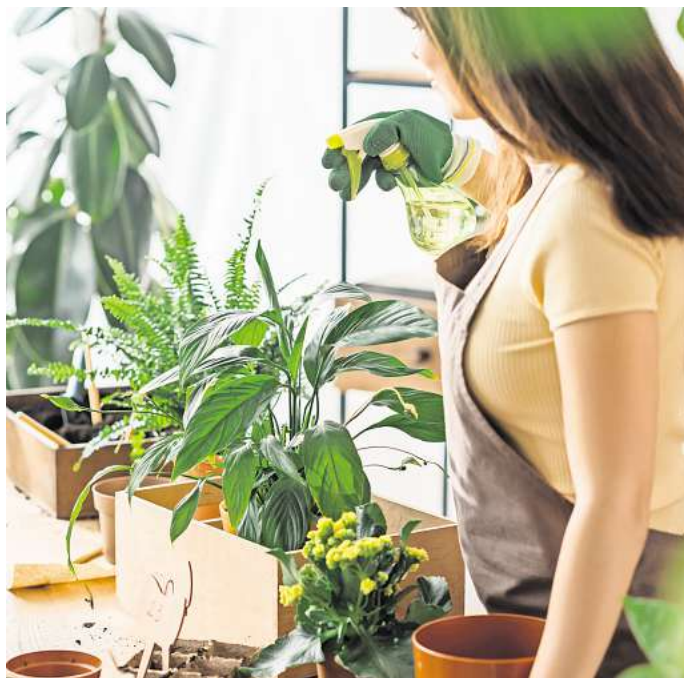
Gartenarbeit hat viele Facetten.