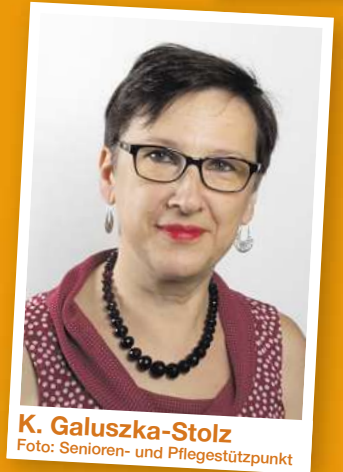
K. Galuszka-Stolz

FIPS-Referenten informieren über Krankheitsbilder, bei denen APP erteilt wird, wie man eine Versorgung erhält, was APP leistet, Dauer und Besonderheiten.