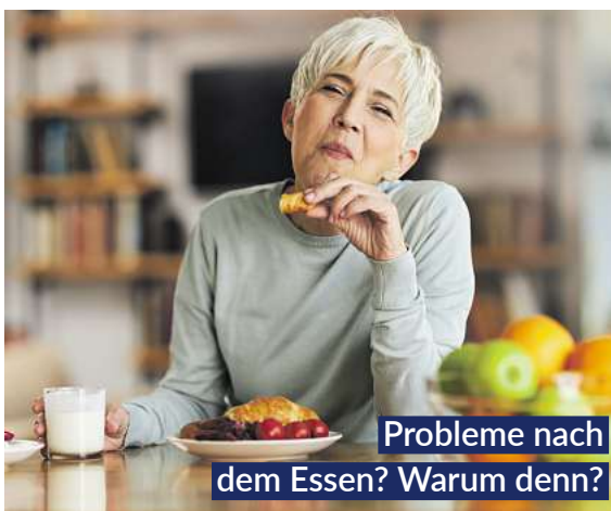
Probleme nach dem Essen? Warum denn?

Tropfen mit ihrer einzigartigen Kombination aus beruhigenden und bitterstoffhaltigen Heilpflanzen sorgen für schnelle Linderung. Direkt nach dem Essen eingenommen, aktivieren Bitterstoffe, z.B. enthalten in Wermut-, Benediktenkraut und Angelikawurzel, die Verdauungssäfte. 1,2 Krampflösendes Gänsefingerkraut, zusammen mit Süßholzwurzel und Kamillenblüten, entspannt den gesamten Magen-Darm-Trakt.