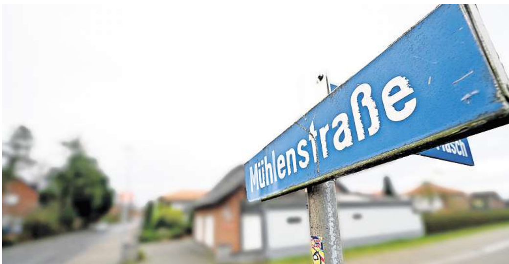
Es gibt neue Erkenntnisse im Fall der 62-Jährigen Getöteten aus Wendeburg.

Am Morgen des 24. Januar machte ein Angehöriger die schreckliche Entdeckung: Die 62-Jährige lag tot in ihrem Haus an der Mühlenstraße. Laut Polizei wies die Frau massive Ver-