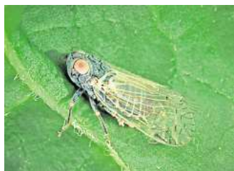
Die Schilf-Glasflügelzikade gefährdet die Ernte.

Noch richtet die Schilf-Glasflügelzikade hauptsächlich in Süddeutschland Schäden an. Von dort wurden bereits massive Ernteaufälle gemeldet. Doch das Insekt breitet sich nach Nor-