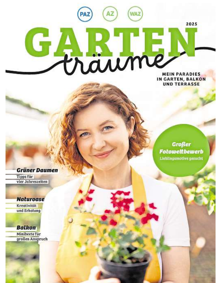
Das neue AZ/WAZ/PAZ-Gartenmagazin erscheint im März.

Mit einer Druckauflage von über 30.000 Exemplaren findet der Wettbewerb in der Region große Beachtung. Zusätzlich steht den mehr als 8.000 E-Paper-Abonnenten der PAZ, AZ und WAZ das Magazin eine Woche als Blätter-PDF zur Verfügung. Die Online-Reichweite ohne Mehrkosten ist zudem ein besonderer Service für Anzei-