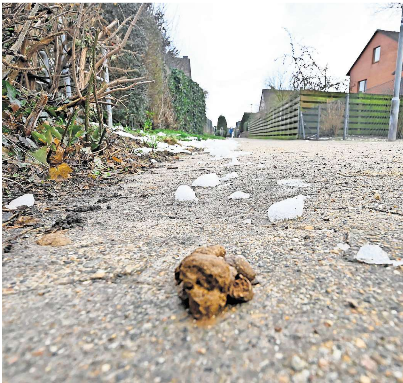
Am Thema Hundekotweg Dorfgraben erzürnen die Gemüter seit mehr als 30 Jahren. Was sagt die Stadt Peine dazu?