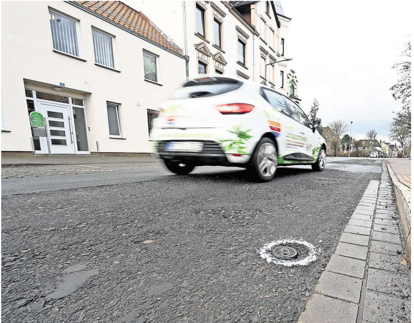
Auf der Peiner Straße „Am Silberkamp“ gibt es Schäden und Unebenheiten.