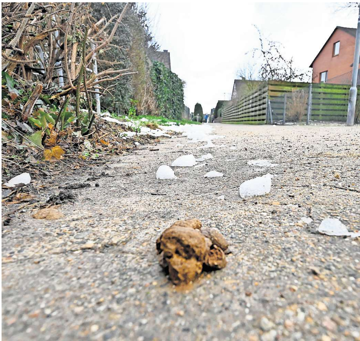
Am Thema Hundekotweg Dorfgraben erzürnen die Gemüter seit mehr als 30 Jahren. Was sagt die Stadt Peine dazu?