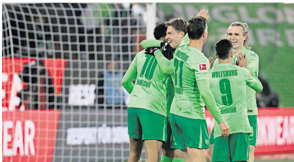
Drei Punkte als Ziel: Die Wölfe wollen auch gegen St. Pauli jubeln.

Die Wölfe stehen vor einer besonderen Herausforderung, wenn der FC St. Pauli in der Volkswagen Arena zu Gast ist. Die bisherige Bundesliga-Bilanz gegen die Kiezkicker dürfte für Trainer Ralph Hasenhüttl ein zusätzlicher Ansporn sein, denn Wolfsburg konnte in der höch-