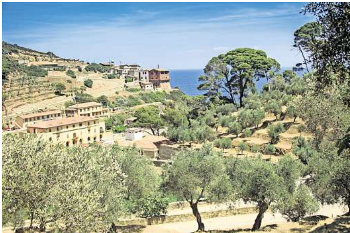
Die Gefängnisinsel Gorgona präsentiert sich als Idyll.

Während das bergige Gebiet im Westen bei der Punta Gorgona auf 225 Meter ansteigt, prä-