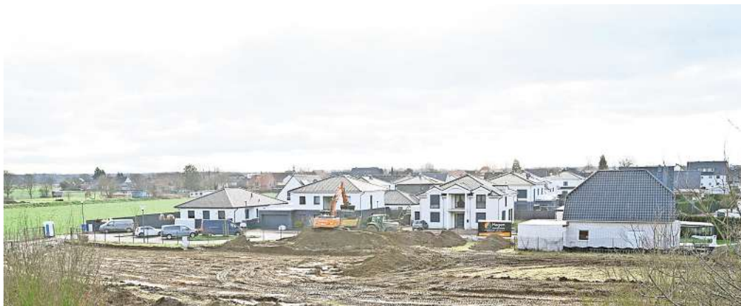
In Essinghausen nahe der Autobahn entsteht das Firmengebäude der Hagen GmbH. Im Hintergrund ist das Neubaugebiet „Nordblick“ zu sehen.

Peiner Firma investiert 3,5 Millionen Euro