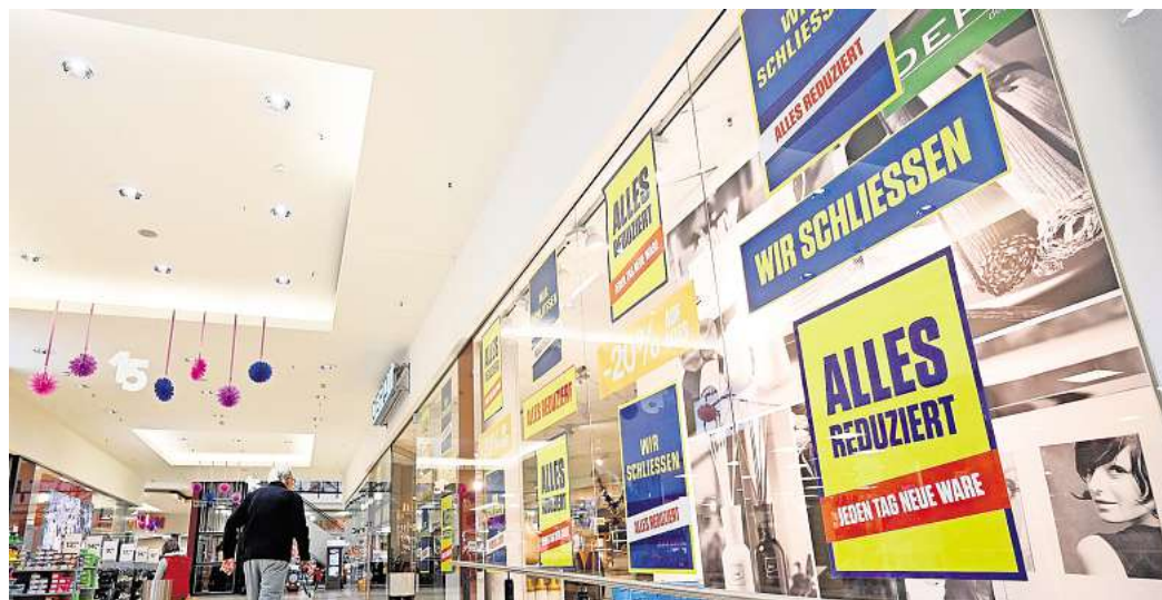
Depot in Peine: Wegen Insolvenz schloss die Kette auch die Peiner Filiale in der Innenstadt. Es ist eines von zahlreichen Geschäften im Landkreis, wie die aktuelle Statistik zeigt.