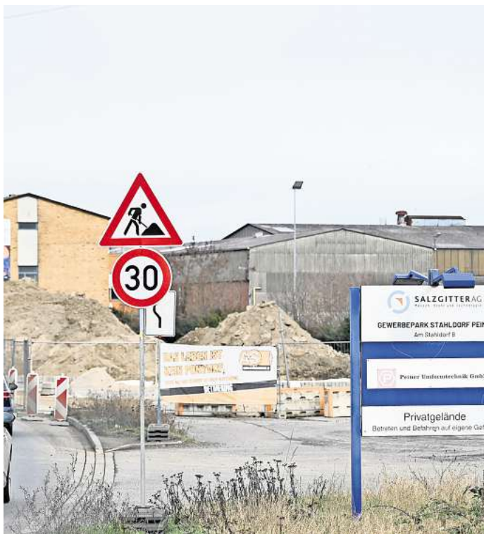
Ein Blick auf das Stahldorf-Areal: Das Gebäude mit den markanten Plakaten links im Bild soll abgerissen werden.

Für den Bau der Abfertigungsfläche soll auf dem PTG-Grundstück eine wild aufgelassene Grünfläche mit Baumbestand von rund 12.000 Quadratmetern entfernt werden. Als Ausgleichsfläche dient laut Reinecke ein benachbarter Bereich auf dem Werksgelände, der im kommenden Herbst neu bepflanzt werde.