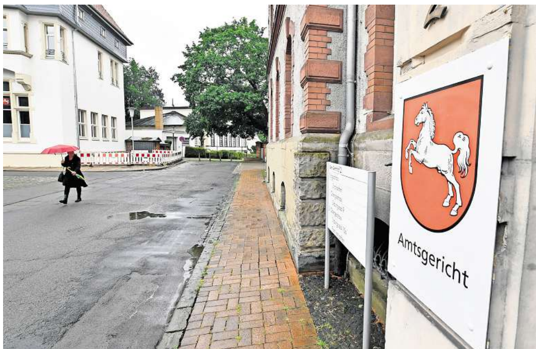
Verhandelt wurde der Fall am Amtsgericht Peine.

Der 24-jährige Angeklagte hat drei Einträge im Bundeszentralregister. Dreimal wurde er in den letzten zwei Jahren wegen Körperverletzungen zu Geldstrafen verurteilt. Wegen des Autodiebstahls erhielt er jetzt vom Amtsgericht eine Bewährungsstrafe von sechs Monaten. Weiterhin muss er in den nächsten sechs Monaten 120 Stunden gemeinnützige Arbeit leisten. Durch sein Geständnis habe der