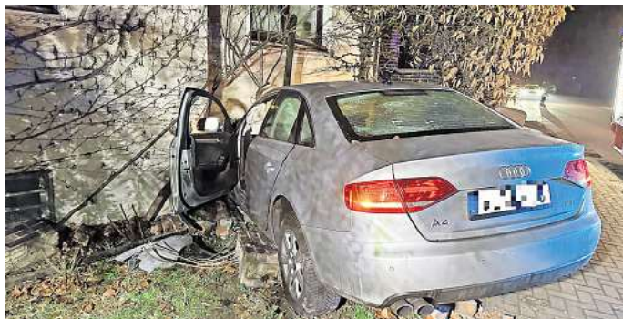
In Schmedenstedt krachte der Fahrer eines Audis gegen eine Hausmauer. Dass ein Auto genau an dieser Stelle gegen die Mauer prallt, ist nicht das erste Mal.