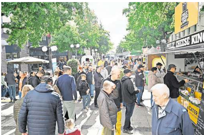
Das Foodtruck-Festival Ende September bietet viele Leckereien.