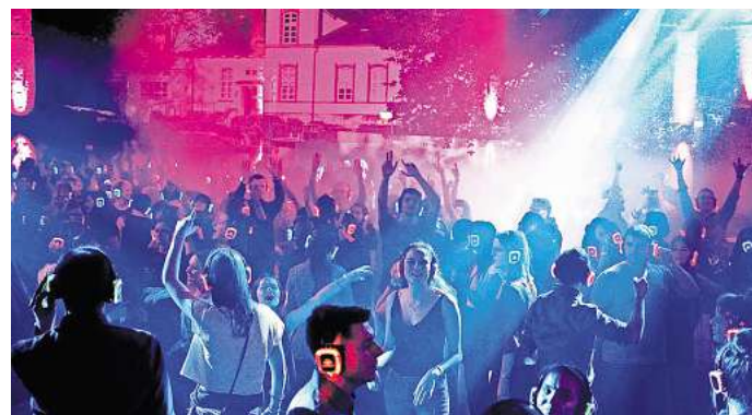
Im Peiner Burgpark findet die Silent Music Party statt.

beginnt am Freitag, 4. Juli, und endet am Dienstag, 8. Juli. Besondere Anziehungspunkte des bunten Festes sind das Höhenfeuerwerk, der Rummel auf dem Schützenplatz, die Aufmärsche der sieben Korporationen auf dem historischen Marktplatz, die „Bunten Umzüge“ und der Fackelumzug in der Peiner Innenstadt. Seit mittlerweile 427 Jahren gibt es diese Tradition, die nach wie vor das Publikum begeistert.