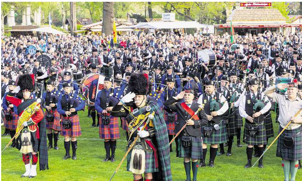
Mit Dudelsack und Trommeln: Zahlreiche Pipe-Bands und Solokünstler treten beim Highland Gathering im Peiner Stadtpark gegeneinander an.

Ein besonderes Erlebnis für Jung und Alt ist das Schmücken des Peiner Osterbrunnens: Am Samstag, 5. April, um 11 Uhr bildet die Aktion den Frühlingsauftakt für die Innenstadt. Um den Osterbrunnen mit Hunderten bunt bemalter Ostereier zu verzieren, arbeiten Peine Marketing