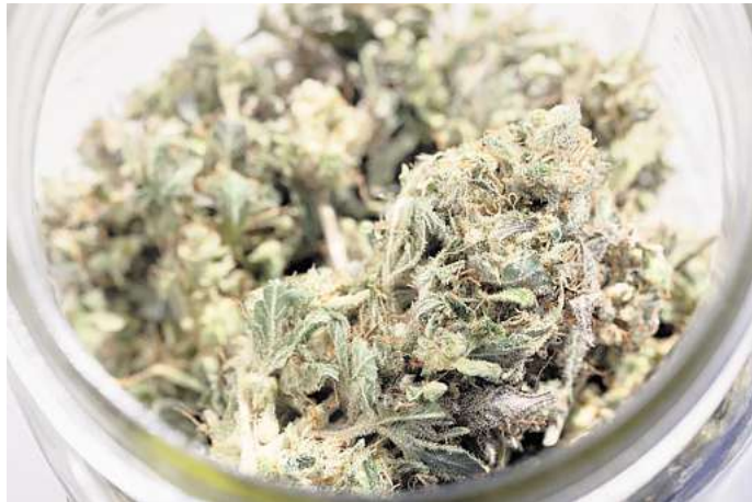
Die Polizei fand größere Mengen von Cannabis in der Wohnung des Peiners.

Wobei jedoch ein beträchtlicher Teil laut Laboruntersuchung einen geringen Wirkstoffgehalt gehabt habe, erklärte eine als Zeugin geladene Ermittlerin. Das spreche für Eigenanbau, der nicht fürs Handeltreiben geeignet sei. Allerdings hätten die Beamten in der Wohnung des Angeklagten unter anderem Klemmleistenbeutel und eine Feinwaage gefunden, die vermuten ließen, dass der 24-Jährige