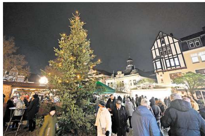
Die Weihnachtsstadt in Peine beginnt im November.

Zum Abschluss des Veranstaltungsjahres werden von Freitag, 28. November, bis Dienstag, 23. Dezember, die Hütten der Peiner Weihnachtsstadt auf dem historischen Marktplatz aufgebaut. Neben weihnachtlichen Genüssen gibt es für die Besucher ein buntes Programm an den Adventswochenenden. Dazu sorgen Beleuchtung und Walk-Acts für Einstimmung auf Weihnachten.