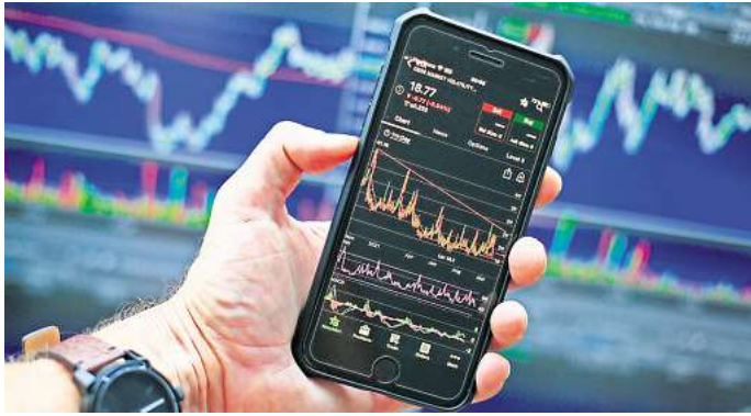
Umfrage: Besitzen Sie Aktien oder planen Sie welche zu kaufen?

Seit Jahresbeginn hat der DAX bereits deutlich zugelegt, und Experten sehen weiteres Potenzial. Sinkende Zinsen und die anhaltende Kauflaune vieler Anleger treiben die Märkte weiter an. Doch nicht alle sind am Aktienmarkt aktiv – trotz steigender Kurse bleibt die Zahl der