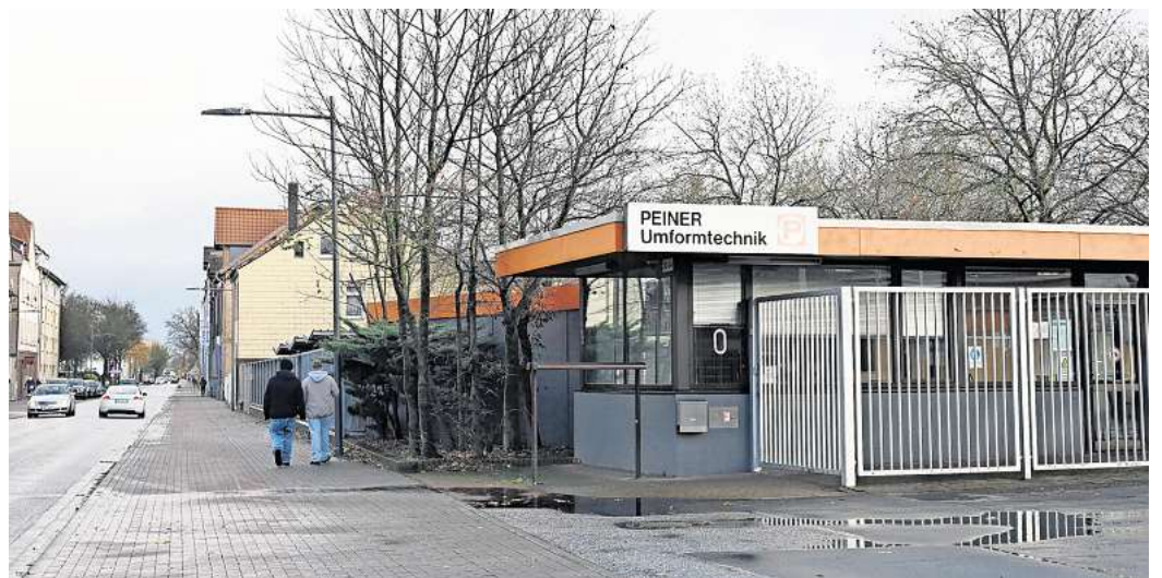
Die Firma Peiner Umformtechnik (PUT) gibt es nicht mehr.

Bei der PUT wurden Verbindungselemente und hochfest vorgespannte Stahlbauschrauben, sogenannte HV-Schrauben, gefertigt. Die Marke „Peiner Schraube“ ist weltweit bekannt. „HV-Garnituren“ aus Peine stecken zum Beispiel im Luxus-Hotel Burj al Arab in Dubai, im Chadstone-Shopping-Center in Melbourne oder auch in der Konstruktion des Baumwipfelpfades in Bad Harzburg.