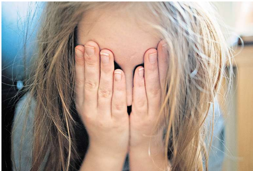
Ein junges Mädchen hält sich die Hände vor ihr Gesicht. Im Kreis Peine gibt es immer mehr Kinder, die in die Obhut des Jugendamtes kommen.