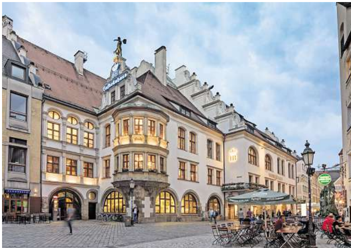
Im Hofbräuhaus kannst du bayerisch schlemmen.

Für die tellergroßen, dünnen Schnitzel mit der knusprigen