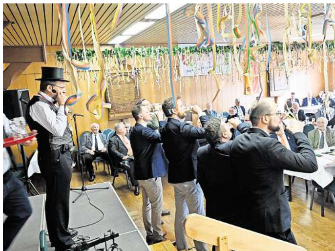
Büchler, Lafferde, Bauernthing, Fasching, Fastnacht, Einwiegen der Neubürger, Neubürger Gelebtes Brauchtum: Beim Bauernthing in Groß Lafferde herrschte fröhliche Stimmung.

In früheren Zeiten war das Bauernthing eine Gemeinde- oder Gerichtsversammlung, die sich mit den Rechtsangelegenheiten der bäuerlichen Gemeinschaft befasste. Doch aus der einst ernsten ist längst eine launige Veranstaltung geworden. Neben den musikalischen Beiträgen ist und bleibt das „Einkaufen“ der Neubürger der Höhepunkt der Versammlung. Zur Gaudi aller eröffnete ein Abgesandter des Hildesheimer Bischofs das Aufnahmeamt der Neubürger. Er vereidigte das Auswahl-Gremium mit Vogt, Gerichtsschreiber, Wiegemeister und Mundschenk in plattdeutscher Sprache.