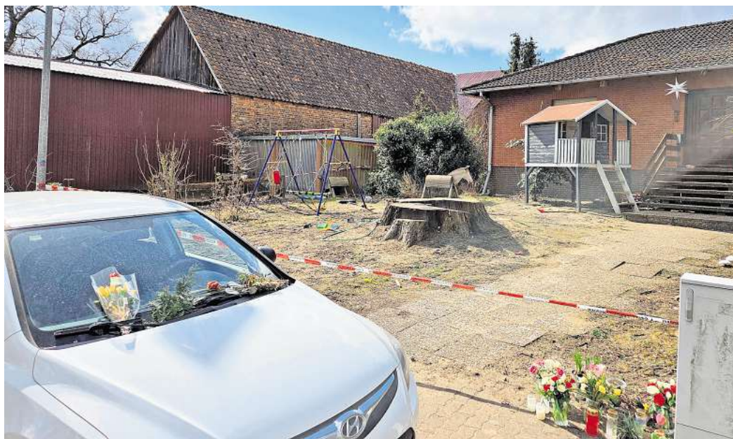
Immer wieder legen Anwohner neue Blumen vor das Haus am Ende der Straße.

Der Beschuldigte war laut der Staatsanwaltschaft bereits am Tattag vorläufig festgenommen, jedoch mangels dringenden Tatverdachts am selben Abend wieder aus dem Polizeigewahrsam entlassen worden. „Nach weiter-