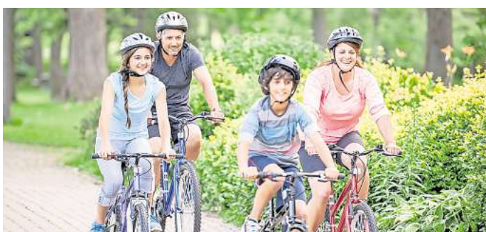
Gemeinsam auf Tour: Die Wirtschafts- und Tourismusfördergesellschaft Landkreis Peine hat auch 2025 einen Radler-Pass organisiert.