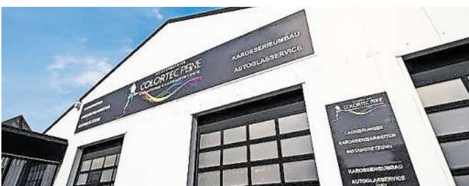
Setzt auf Service und erstklassige Arbeiten: die Lackiererei Colortec.

Mit Zusatzleistungen wie Hol- und Bringservice, persönlicher Beratung und der Direkt-