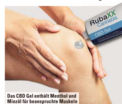
Das CBD Gel enthält Menthol und Minzöl für beanspruchte Muskeln

Mittels eines komplexen CO 2 -Verfahrens wurde aus der Cannabisart sativa L. hochwertiges CBD isoliert und mit einer Dosierung von ~900 mg CBD im Rubaxx Cannabis CBD Gel aufbereitet. Zudem enthält das Gel Menthol und Minzöl zur Pflege beanspruchter Muskeln. Dank der praktischen Gelform kann das Cannabis CBD Gel je nach Bedarf