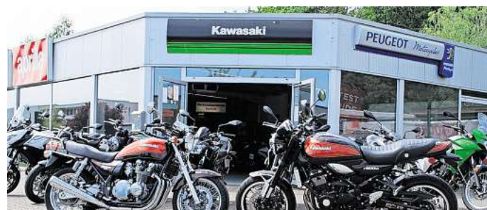
Motours lässt Biker-Hezen höher schlagen.

Außerdem werden in der Meisterwerkstatt auch Reparaturen und Umbauten vorgenommen.