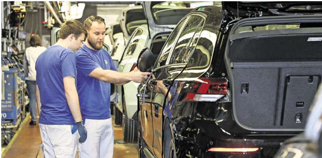
Wie finden Sie die Vier-Tage-Woche? (Symbolfoto)

Peine. Die Diskussion über die Einführung der Vier-Tage-Woche gewinnt weltweit zunehmend an Bedeutung. Viele Unternehmen und Länder prüfen, ob eine kürzere Arbeitswoche nicht nur die Produktivität steigern, sondern auch das Wohlbefinden der Mitarbeiter verbessern könnte. In Ländern wie Island und Spanien wurden bereits Tests durchgeführt, die positive Ergebnisse hinsichtlich der Work-Life-Balance und der Zufriedenheit der Arbeitnehmer zeigten.