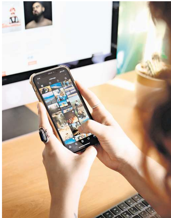
IdIntime Fotos auf einem Handy: Frauen sollten sich vor der Verbreitung solcher Bilder schützen.

Eine neue Studie der gemeinnützigen Organisation HateAid und der TU München hat jetzt außerdem gezeigt: Frauen, die sich politisch einsetzen, sind von digitaler Gewalt häufiger betroffen (63 Prozent) als ihre männlichen Kollegen (53 Prozent). 68