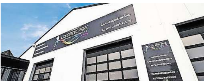
Setzt auf Service und erstklassige Arbeiten: die Lackiererei Colortec.

Mit Zusatzleistungen wie Hol- und Bringservice, persönlicher Beratung und der Direkt-