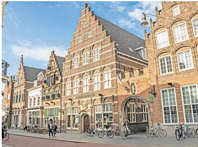
's-Hertogenbosch, die Geburtsstadt von Hieronymus Bosch.

Die Veluwe ist eine malerische walddreiche Region an der Grenze zu Deutschland, die vor allem für ihre beeindruckenden Landschaften und Nationalparks bekannt ist. Hier kannst du durch endlose Wälder ra-