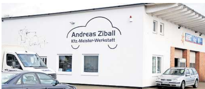
Die Kfz-Werkstatt Andreas Ziball ist für alle Fabrikate da.

Schnelle und meisterhafte Hilfe für ein breites Spektrum an Reparaturmöglichkeiten wird angeboten: Reifen tau-