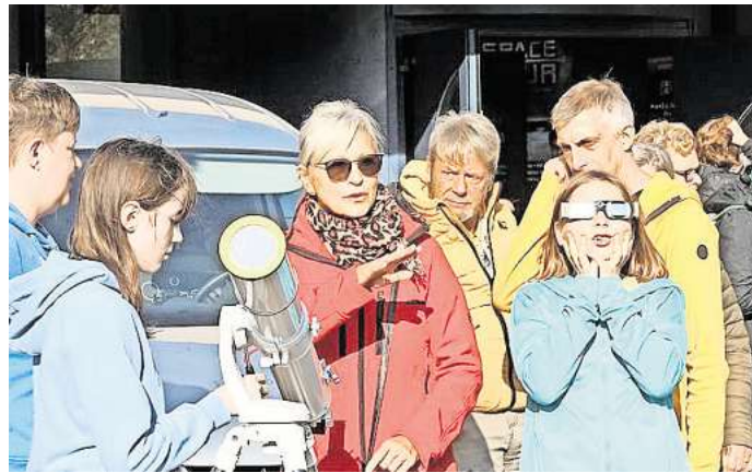
Rückblick zur partiellen Sonnenfinsternis 2022: Zuschauer erschauen durch die entsprechenden Brillen einen Blick auf das Naturspektakel.

Unter fachkundiger Anleitung der Sternfreunde vom Astronomie-Stammtisch wird in einem Raum unterhalb der Sternwartenkuppel an der Burgstraße mittels eines Beamers die partielle Sonnenfinsternis vom Teleskop auch live in den Übertragungsraum projiziert. Am selben Tag findet der bundes-