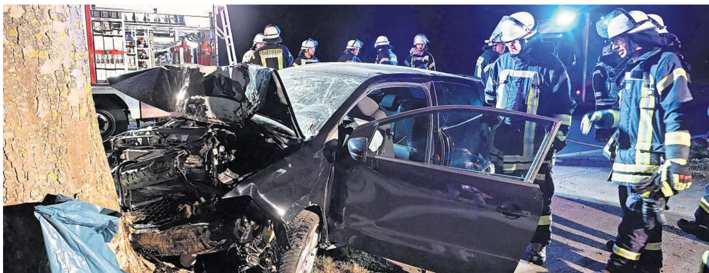
Bei einem Verkehrsunfall auf der K26 bei Oberg knallte ein 30-jähriger Autofahrer mit seinem VW-Polo gegen einen Baum.

Die 66-jährige Hyundai-Fahrerin und die 22-jährige VW-Fahrerin wurden verletzt in Krankenhäuser in Braunschweig gebracht. Die Feuerwehr aus Woltorf war mit 17 Einsatzkräften vor Ort. Zunächst waren auch Einsatzkräfte der Kernstadt und Sterdendorf zur Unfallstelle unterwegs. Diese Einsatzkräfte wur-