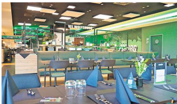
Die PartnerPool-Lounge in der Logenebene: hallo -Leser haben die Möglichkeit, für das Spiel des VfL Wolfsburg gegen Heidenheim VIP-Karten zu gewinnen.

Nach der enttäuschenden 0:1-Niederlage gegen den FC Augsburg am vergangenen Wochenende tritt der VfL Wolfsburg in der Tabelle weiterhin auf der Stelle. Dank günstiger Ergebnisse der Konkurrenz fällt die Mannschaft von Trainer Ralph Hasenhüttl jedoch nur um eine Position zurück – von Platz 7 auf 8. Nach sieben ungeschlagenen Spielen in Folge, mussten die Wölfe erstmals wieder eine Niederlage hinnehmen. Ein Rückschlag im Kampf um Europa? Kapitän Maximilian Arnold fand in den Katakomben der WWK-Arena eine klare Antwort: „Nein!“ Die Saison sei noch lang, die internationalen Plätze in Reichweite. Auch Hasenhüttl gab sich kämpferisch: