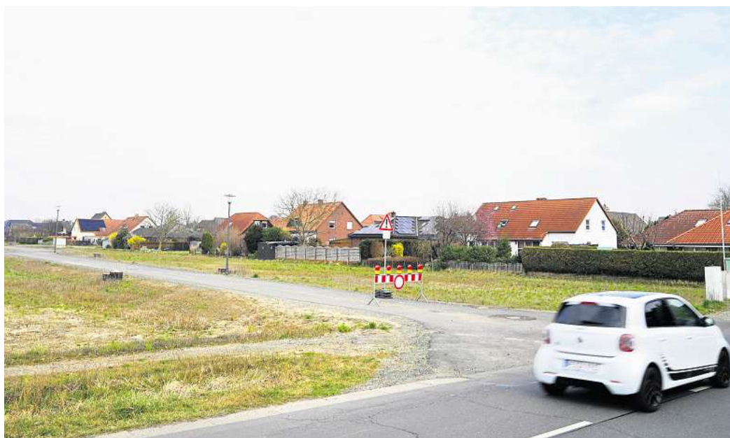
In Woltorf nördlich der Dungenbecker Straße gibt es derzeit noch 15 freie Bauplätze.

Geplant sind zudem weitere Baugebiete in Schmedenstedt und Stederdorf . Die jeweiligen Bebauungspläne befinden sich