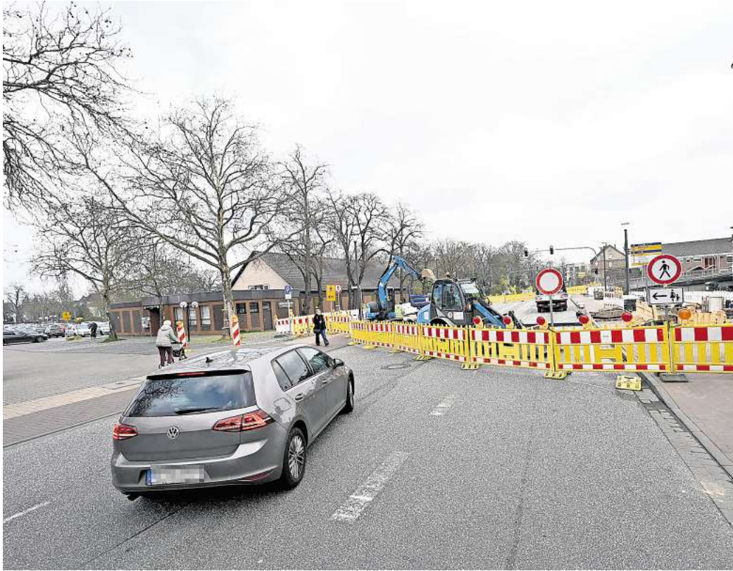
In Peine ist die wichtige Verkehrsader Woltorfer Straße voll gesperrt.

Neben der Woltorfer Straße gibt es in diesem Frühjahr zahlreiche Baustellen in den Gemeinden. Betroffen sind in Stederdorf das Teilstück „Am Dorfteich“ von „Teichstraße“ bis „Wendesser Landstraße“ sowie „Edemisser