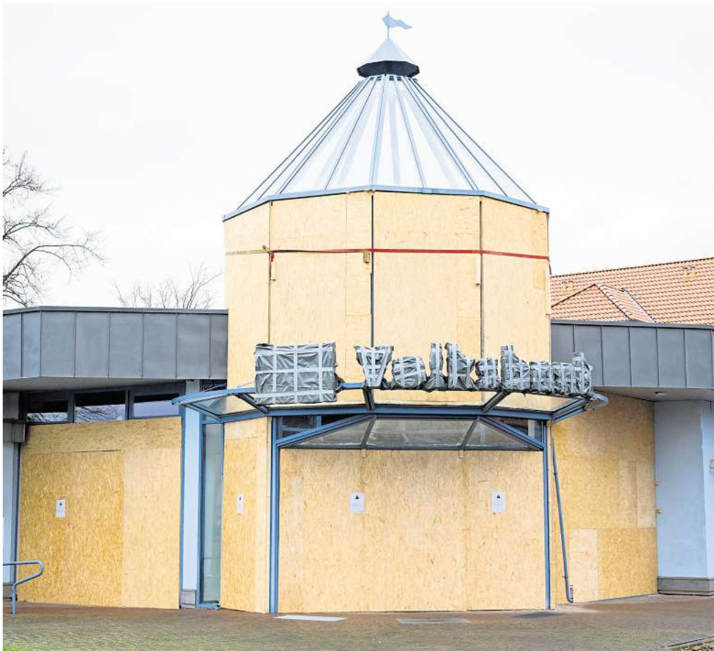
Die ehemalige Filiale der Volksbank in Edemissen ist seit dem Sprengstoffanschlag im Januar 2022 provisorisch mit Holzplatten verschlossen.

Aber die Räumlichkeiten sollen multifunktional nutzbar sein und auch als zusätzlicher Raum für Sitzungen politischer Gremien und Facharbeitsgruppen zur Verfügung stehen. Das solle zur Entlastung und als Ergänzung der Raumsituation im Rathaus dienen, heißt es in der Beschlussvorlage.