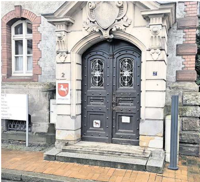
Das Amtsgericht in Peine.

„Ich habe meinen Ex-Freund nur aus Hannover abgeholt und wusste nichts von den Betäubungsmitteln, die er bei sich hatte“, beteuerte der 21-jährige Fahrer. Er gab jedoch zu, dass das defekte Klappmesser ihm gehöre. Die beiden Angeklagten räumten über ihre Verteidiger ein, Drogenkonsumenten zu sein. Der 20-jährige Angeklagte gab