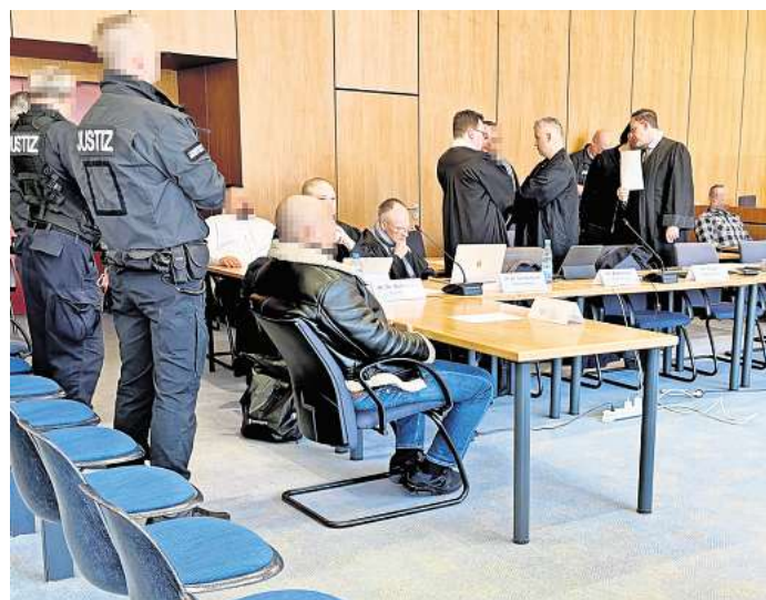
Vor dem Landgericht Hildesheim müssen sich sechs Angeklagte wegen der Brandanschläge in der Peiner Schäferstraße verantworten.

An einem der nächsten Prozesstage will sich der angeklagte Bauunternehmer und Vermieter des Gebäudes an der Schäferstraße in Peine zu den Vorwürfen äußern, das kündigte sein Verteidiger an. Der Prozess wird am 3. April fortgesetzt.