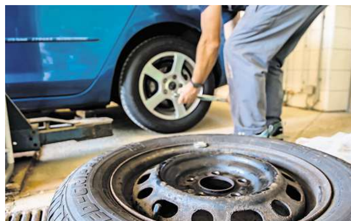
In der Osterzeit steht der Reifenwechsel an.

Ob die Sommerreifen vom Vorjahr noch ausreichen, hängt besonders von der Profiltiefe ab. Gesetzlich vorgeschrieben sind 1,6 mm, doch der ADAC empfiehlt mindestens 3 mm. „Mit einer 1-Euro-Münze kann jeder schnell und unkompliziert die Profiltiefe seiner Reifen selbst überprüfen“, erklärt Lehmann.