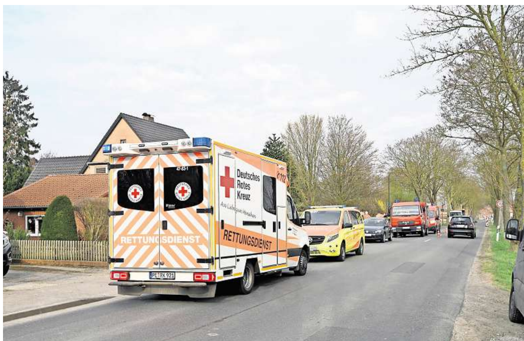
Rettungskräfte konnten einen Mann nur noch tot aus einem Teich bergen