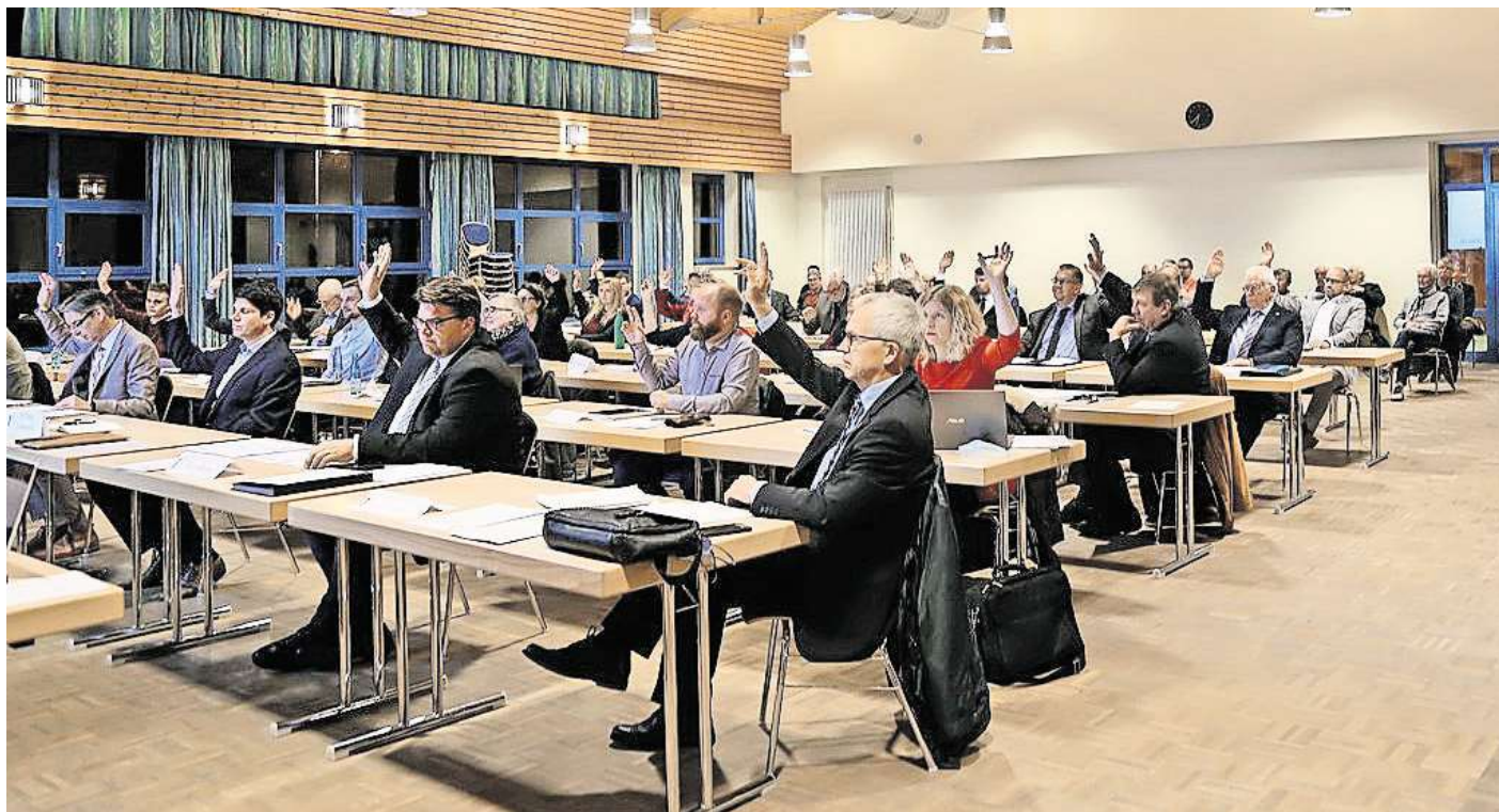
Während der Corona-Pandemie fanden die Ratssitzungen in der Aula der Grundschule Drachenstark statt.

Seine Hoffnung ist, dass mehr Bürgerinnen und Bürger die Möglichkeit haben, an den Sitzungen teilzunehmen und sich aktiv in die Entscheidungsprozesse einbringen. „Es ist mir wichtig, dass wir als Gemeinde