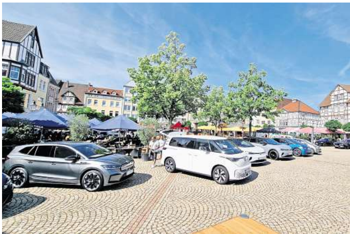
Zurück im Frühjahr: 2024 lief die Brawo Mobility Veranstaltung noch im Sommer.