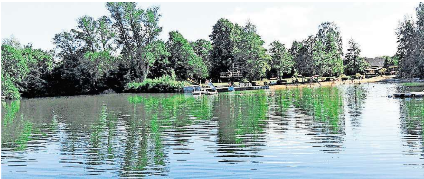
Blick auf das Wasser des Pfannteichs in Hohenhameln: Bürgerinnen und Bürger der Gemeinde sind aufgerufen, ihre Ideen für ein Naherholungskonzept auf dem Gelände einzubringen.

Zum Workshop sind alle Gemeindemitglieder eingeladen – egal ob als Privatperson oder Vertreter von Vereinen, Interessensgemeinschaften oder Politik. Die Gäste können unter der Moderation der beauftragten Planungsgesellschaften „Studiolandchaft“ und „Freiraumplanung“ Ideen und Wünsche teilen. Aus den