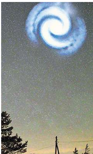
Am Himmel über Norddeutschland war am Montagabend eine spiralförmige Wolke am Himmel zu sehen.

Hierbei wurde der restliche Treibstoff in die obere Atmosphäre abgegeben. Nach Angaben von Raumfahrtexperten habe sich der Treibstoff in gro-