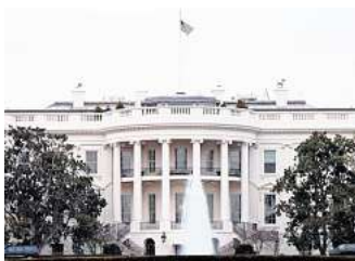
Das Weiße Haus in Washington, D.C. ist Amts- und offizieller Regierungssitz des Präsidenten der Vereinigten Staaten, Donald Trump.

Doch nicht nur wirtschaftlich, auch sicherheitspolitisch gerät Trump ins Visier der Kritik. Nach einem Eklat im Weißen Haus, bei dem er dem ukrainischen Präsidenten Wolodymyr Selenskyj öffentlich die Solidarität verweigerte, äußern Fachleute Zweifel an der Rolle der USA als verlässlicher Partner Europas.