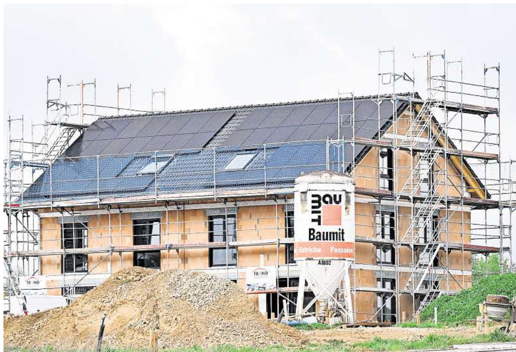
Die Gewerkschaft IG Bau Nord-Ost-Niedersachsen fordert einen Neubau-Turbo für bezahlbares und soziales Wohnen.

Mietenexplosion und Wohnungsnot: CDU und SPD im Kreis Peine sollen nach Berlin funken – IG Bau fordert Trendwende