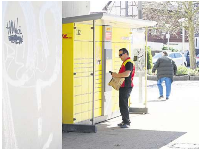
Ein Mitarbeiter der DHL steht vor einer Packstation in Peine.

Die Packstation kann dabei nicht nur von Mieterinnen und Mietern der Peiner Heimstätten, sondern auch von Externen genutzt werden. Die Konstruktion an der Woltorfer Straße ist