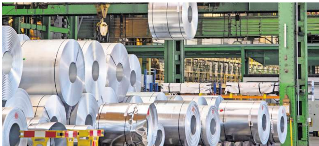
Die Stahlgeschäfte laufen nicht rund: Die Salzgitter AG rechnet für 2025 mit einem Ergebnis zwischen 100 Millionen Euro Verlust und 100 Millionen Gewinn.

Der Außenumsatz reduzierte sich aufgrund gesunkener Durchschnittserlöse für Stahlerzeugnisse sowie einer schwachen Auftragslage im Geschäftsbereich Stahlverarbeitung von 10,8 Milliarden im Vorjahr auf zehn Milliarden Euro.