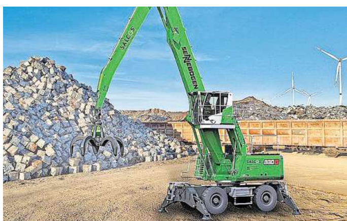
Nachhaltigkeit im Maschinenbau beginnt schon beim Material: Die Sennebogen Maschinenfabrik GmbH und die Salzgitter AG präsentieren eine Umschlagmaschine, deren Stahl weitgehend CO 2 -reduziert hergestellt wurde.

Beide Partner haben das gemeinsame Ziel der Dekarbonisierung. „Wir verfolgen bei Sen-