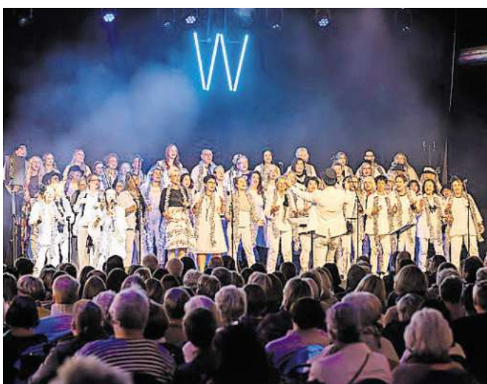
Will sein Publikum mit seinem Gesang berühren: Der St. Urban Gospelchor beim Konzert „Wir+Zusammen“ im November 2024 in der Gebläsehalle.

Zu hören ist der Gesang gleich viermal am Osterwochenende, erstmals am Karfreitag, 18. April, um 18.30 Uhr in der St.-Pancratii-Kirche in Solschen und um 21.30 Uhr in der St.-Urban-Kirche Klein in Ilse. Am Karsamstag, 19. April, geht es weiter um 18 Uhr in der Liebfrauenkirche in Woltorf und um 20.30 Uhr in der Friedenskirche Peine. Der Eintritt ist frei, Spenden sind willkommen.