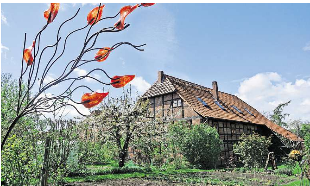
Im Kunsthof in Mehrum gibt es auch in diesem Jahr wieder eine Mischung aus verschiedenen Kunstformen, die man sehen und hören kann.