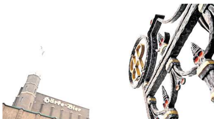
Am Ostersonntag wird der Turm der alten Härke-Brauerei "in Flammen" stehen.

Ab 21 Uhr gibt es Musik von DJ Olli im Saal des Braustübchens. Außerdem wird auf dem Hof ein Zelt aufgebaut. Getanzt werden darf allerdings erst ab null Uhr. Hintergrund: das Nie-