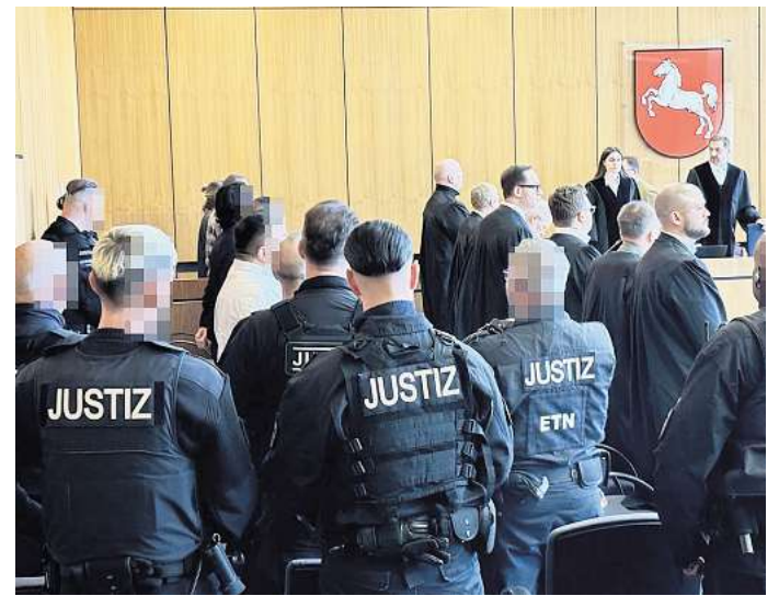
Landgericht Hildesheim: Hohe Sicherheitsvorkehrungen beim Prozess um die Brandanschläge in der Peiner Schäferstraße.

Offen bleibt, warum der Angeklagte seine Helfer nicht nach