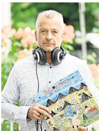
DJ Olli will bei Härke ab Mitternacht für Höchststimmung sorgen.

Darüber hinaus wird die ehemalige Brauerei durch den Einsatz von farbigen Lampen in den grün-roten Stadtfarben von Peine leuchten. Begleitet werden die