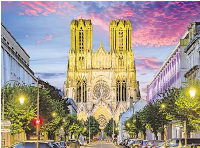
Die imposante Kathedrale von Reims.

Notre-Dame von Reims steht oft im Schatten ihrer berühmten Pariser Schwester – doch dafür gibt es eigentlich keinen Grund.