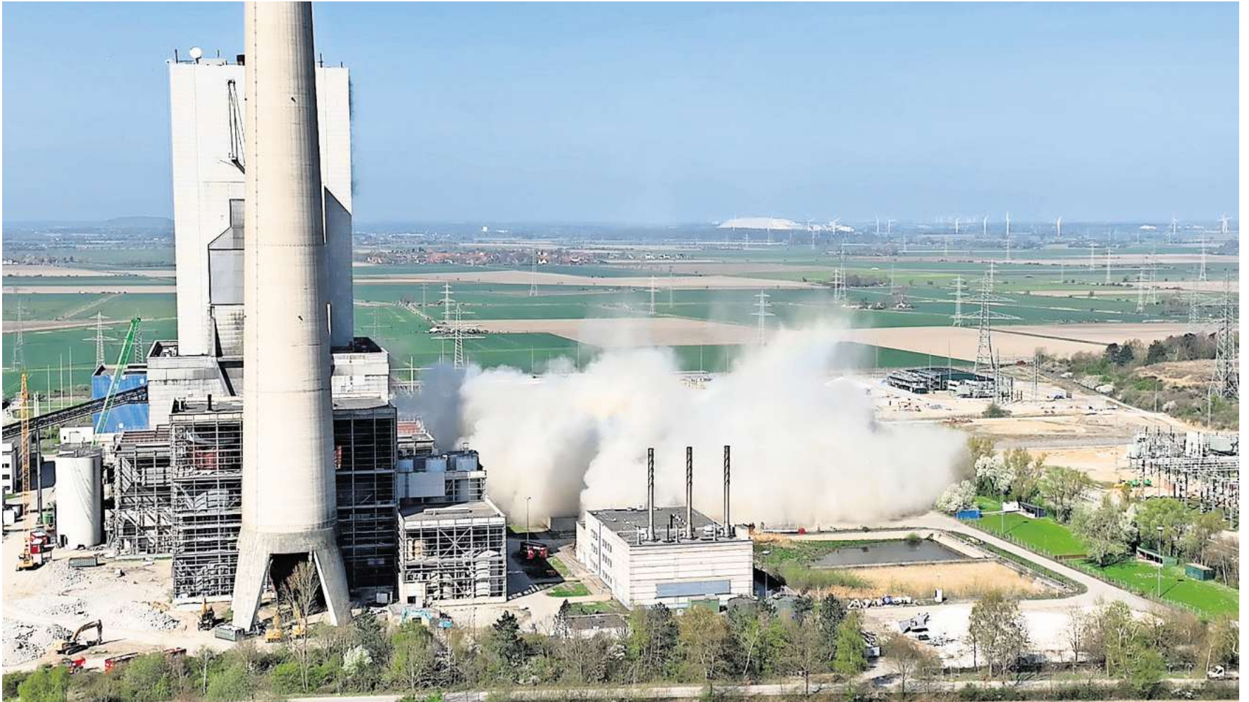
Der Kühlturm des Mehrumer Kraftwerks wurde kontrolliert gesprengt.