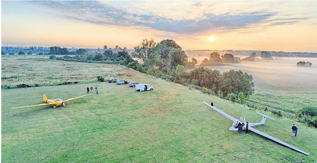
Der Flugplatz Peine-Glindbruchkippe: Hier starten und landen sowohl die Segel- als auch die Motorflugzeuge des Vereins Uhlenflug.

Besondere Voraussetzungen seien dafür nicht nötig, so Hitzel. Ein Fliegerarzt mache vorab einen Gesundheitscheck, um zu prüfen, ob man für einen Flugschein geeignet ist. Ist das der Fall, könne man sich für den Segelflugschein anmelden. Mindestens 30 Theoriestunden müssten absolviert werden, erklärt der Vereinsvorsitzende. Der Praxisteil umfasse mindestens 45 Starts, 50 seien es erfah-