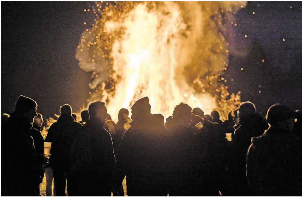
Osterfeuer sind ein beliebter Treffpunkt in den Ortschaften.

Soßmar: Am Sportplatz „Hasenwinkel“, Veranstalter: Freiwillige Feuerwehr Soßmar und Junggesellschaft Soßmar.