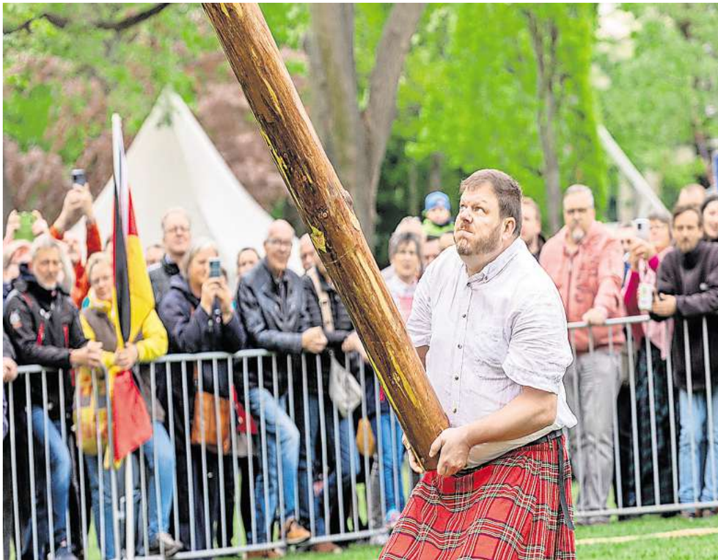
Baumstammwerfen: Eine der „Disziplinen“ bei den Highland-Gathering-Wettkämpfen. In diesem Jahr gibt es bei der 25. Ausgabe eine neue Disziplin.

Die Vorfreude steigt beim Highland-Games-Verantwortliche besonders für eine Disziplin: „Beim Tauziehen hat sich eine Frauenmannschaft aus Berlin angemeldet“, sagt Ende. Die Athletinnen hatten ihre Qualität im Tauziehen bereits bei Deutschen Meisterschaften unter Beweis gestellt. Ende ist sich daher sicher: „Die werden die Männer in Grund und Boden ziehen.“