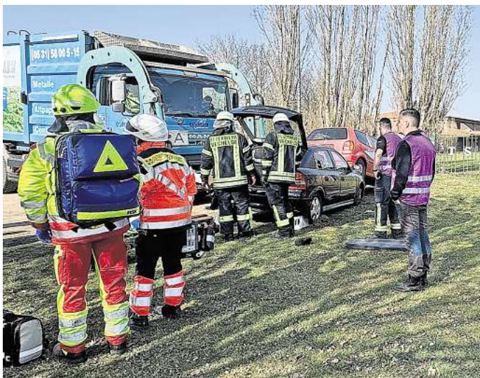
Ab Übungstag galt es für die Aktiven unterschiedliche Einsatzlagen zu bewältigen.

Ziel war es, die Zusammenarbeit der Ortsfeuerwehren in reali-