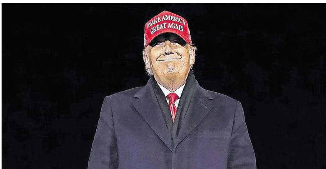
Der amerikanische Präsident Donald Trump sorgt international für Unruhe. Was denken Sie: Wird er zum Sicherheitsrisiko für Europa? Nehmen Sie an unserer Umfrage teil und sehen Sie, wie andere Leserinnen und Leser darüber denken.