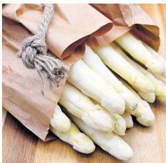
Bei Deutschen sehr beliebt: weißer Spargel.

Mithilfe der Sonne bildet der Grünspargel den Pflanzenfarbstoff Chlorophyll, der das Gemüse grün färbt und ihm seinen typisch nussigen Geschmack verleiht. Zudem enthält er viel Vitamin C und Provitamin A. Da er oberirdisch wächst und weniger Schutz vor Frost benötigt, muss er nicht von Hand gestochen werden. Deshalb ist er oft etwas