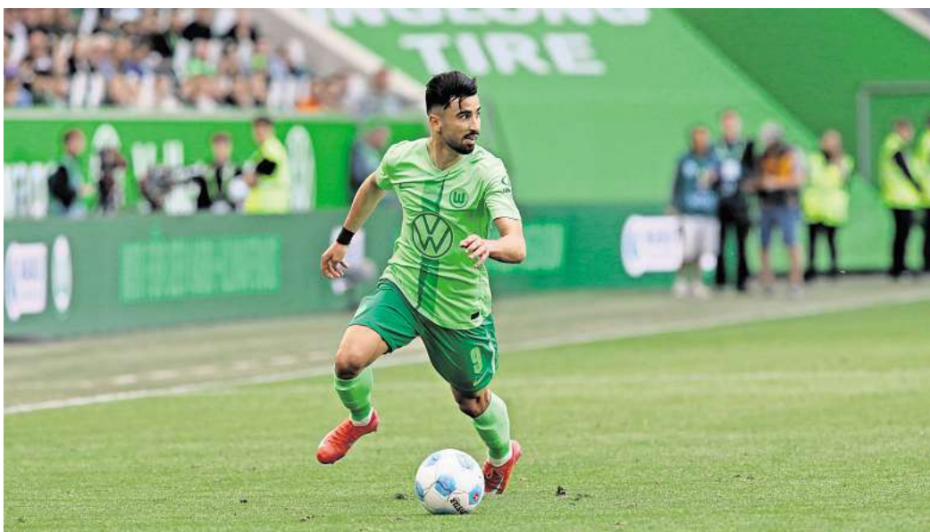
Für das Spiel des VfL Wolfsburg gegen Hoffenheim können hallo-Leser Eintrittskarten gewinnen.

Am Freitagabend haben die Wolfsburger nun die Chance,