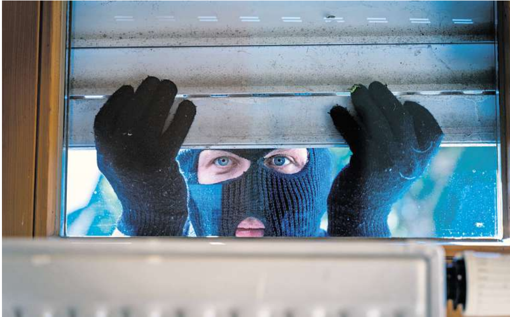
Einbrüche im Landkreis Peine finden auch tagsüber statt.

Statistiken zufolge wird in Deutschland mehr als die Hälfte der Einbrüche zwischen 10 und 18 Uhr verübt. Einbrecher scheuen nicht das Tageslicht, wohl aber die Begegnung mit den Bewohnern. Denn nachts ist