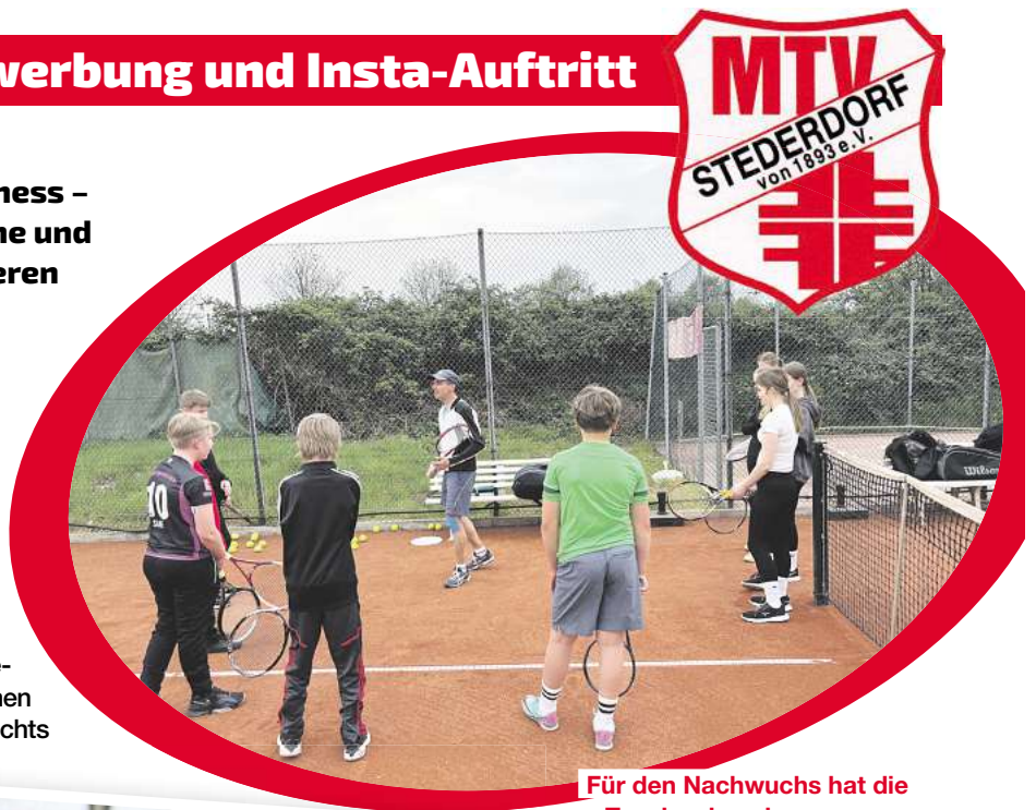
Für den Nachwuchs hat die Tennissaison begonnen.

„Tennis ist wieder richtig angesagt, im Fernsehen, durch Aktionen und einfach, weil die Sportart nichts