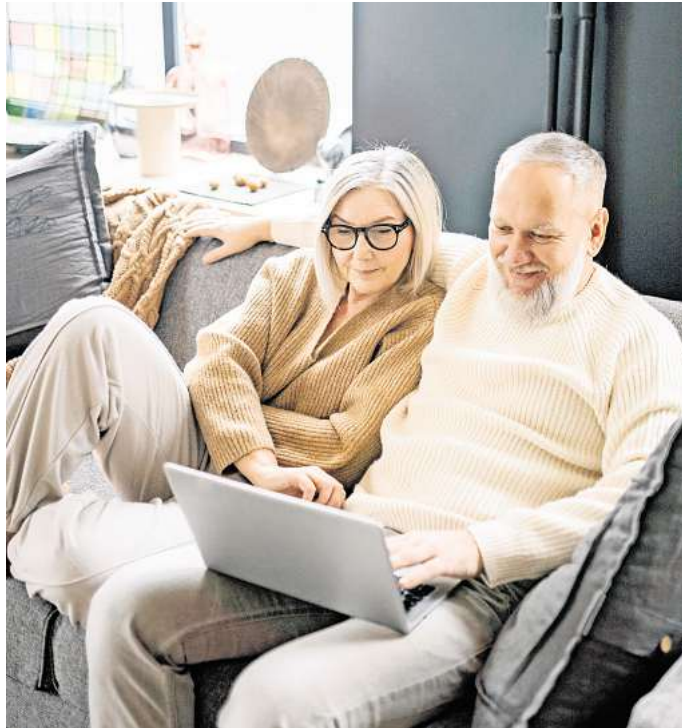
Eignet sich ChatGPT für die Paartherapie?