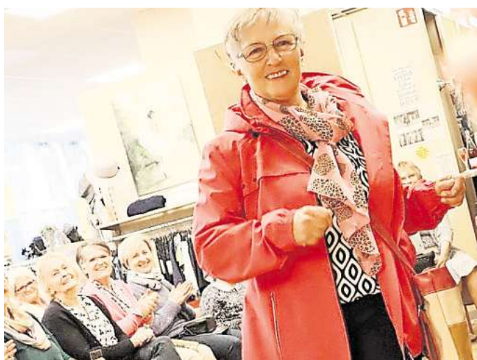
Mit Freude dabei: Die LandFrauen aus Hohenhameln bei der Vorführung im Modehaus Schridde.