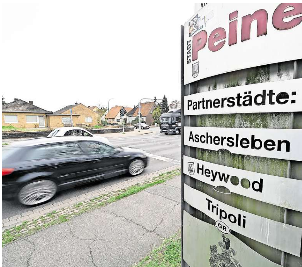
Die Stadt Peine hat eine neue Städtepartnerschaft beschlossen. Zwei bestehende werden derweil auf Eis gelegt.