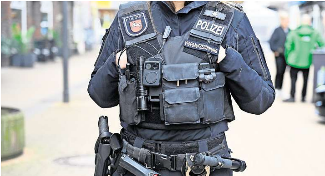
Wie sicher fühlen Sie sich in Peine?

Eine bundesweite ARD-Umfrage ergab, dass sich 40 Prozent im öffentlichen Raum eher unsicher oder sogar sehr unsicher fühlen – 17 Prozent mehr als noch im Jahr 2017. Damit ist die Zahl