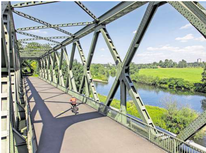
Radweg auf einer ehemaligen Bahntrasse entlang der Ruhr bei Essen.

Der Marschbahndamm-Radweg führt auf rund 33 Kilometern durch die malerische Landschaft der Vier- und Marschlande nahe Hamburg. Wo einst Züge über Deiche und durch weite Wiesen fuhren, können Radfahrerinnen und Radfahrer heute auf einer nahezu durchgängig asphaltierten Strecke entspannt die Natur genießen. Die Route verläuft entlang alter Bahnhöfe, von