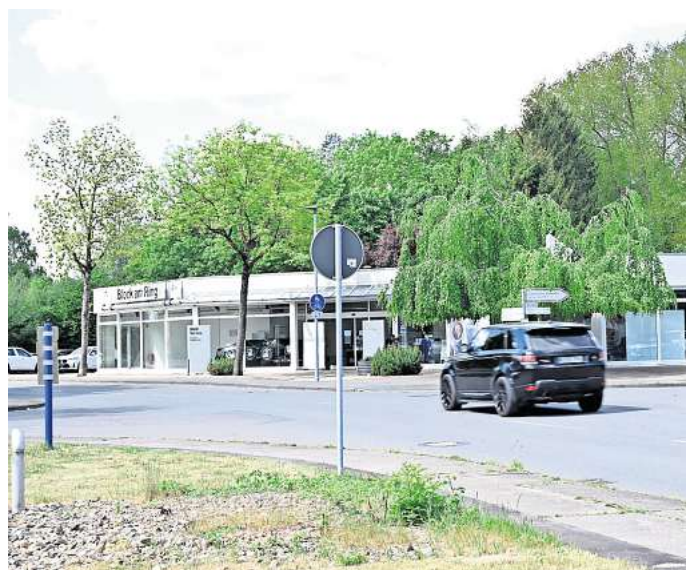
Das Autohaus Block am Ring hat am Horstweg in Peine eine Filiale.

Die Firmengeschichte von Block am Ring geht bis in das Jahr 1896 zurück, als das Unternehmen von August Block als Fahrradgeschäft gegründet wurde. Sitz war zunächst an der Kastanienallee. Seit dem Umzug 1903 an den Altwiekring firmiert es unter dem Namen Block am Ring.