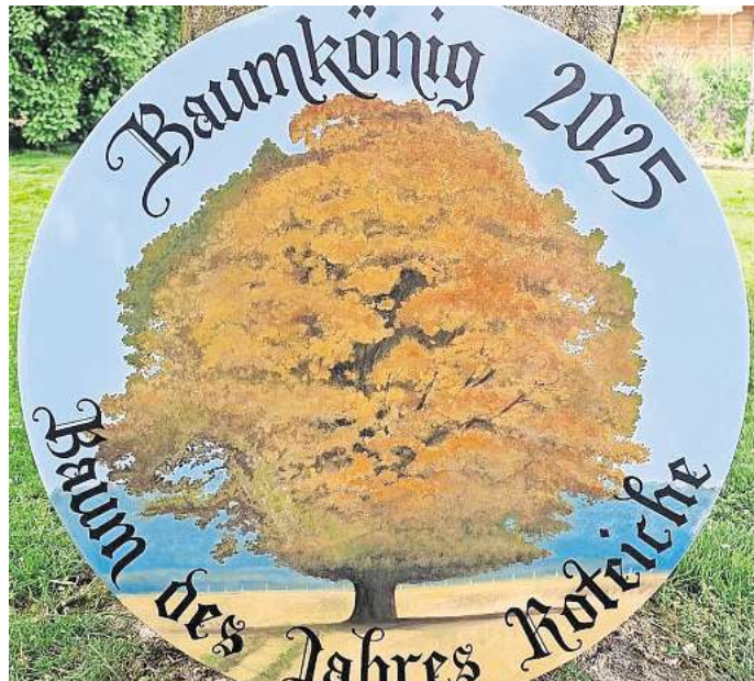
Die Scheibe des Baumkönigs 2025