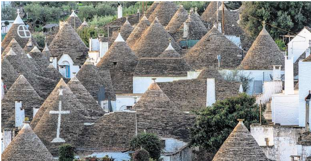
In Alberobello in Apulien stehen rund 1500 Trulli.

Doch als wahres Wahrzeichen Apuliens gelten die runden Steinhäuser mit dem spitzen Dach. Nirgendwo sonst gibt es sie in dieser Form. Die sogenannten Trulli findest du nur in