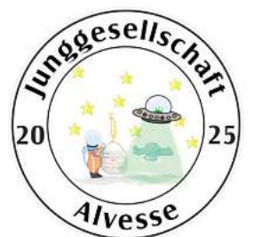
Scheibe Junggesellschaft 2025.