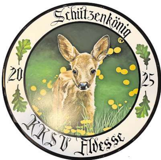
Scheibe Schützenkönig 2025

Tanzabend, Zeltgottesdienst, Festumzug: KKS V Eintracht Alvesse feiert sein Schützenfest