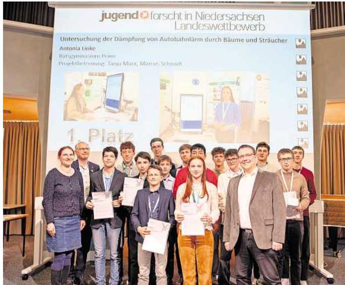
Landeswettbewerb Jugend forscht: Hier wurden die Finalisten für den Bundeswettbewerb in Hamburg ermittelt. Ein Gifhorer und eine Peinerin sind dabei.

So konnte die Jungforscherin zeigen, dass belaubte Bäume zwar eine gewisse Lärminderung bringen, kahle Bäume im Winter jedoch kaum einen Effekt erzielen. Zudem fand sie heraus, dass hochfrequente Rollgeräusche stärker gedämpft werden als niederfrequente Moto-