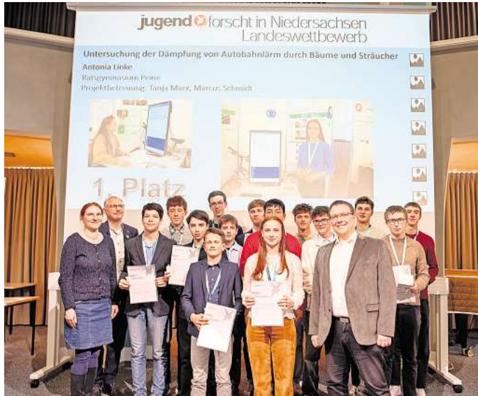
Landeswettbewerb Jugend forscht: Hier wurden die Finalisten für den Bundeswettbewerb in Hamburg ermittelt. Ein Gifhorer und eine Peinerin sind dabei.

So konnte die Jungforscherin zeigen, dass belaubte Bäume zwar eine gewisse Lärminderung bringen, kahle Bäume im Winter jedoch kaum einen Effekt erzielen. Zudem fand sie heraus, dass hochfrequente Rollgeräusche stärker gedämpft werden als niederfrequente Moto-