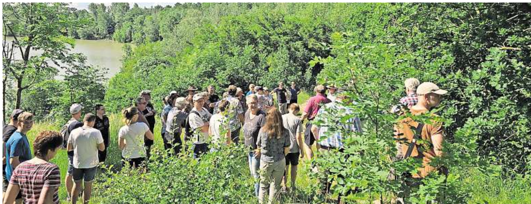
Wanderung: „Auf nach Hellas“ heißt es am 18. Mai.