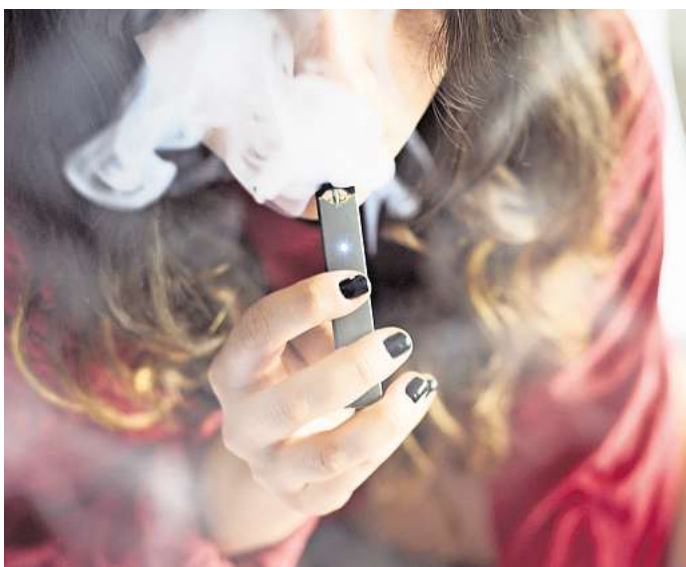
Vapes haben auf viele Kinder und Jugendliche eine anziehende Wirkung.

Über ältere Schüler und Freunde würden auch jüngere Kinder leicht an die Geräte herankommen. Für die Älteren kann das ernste Konsequenzen