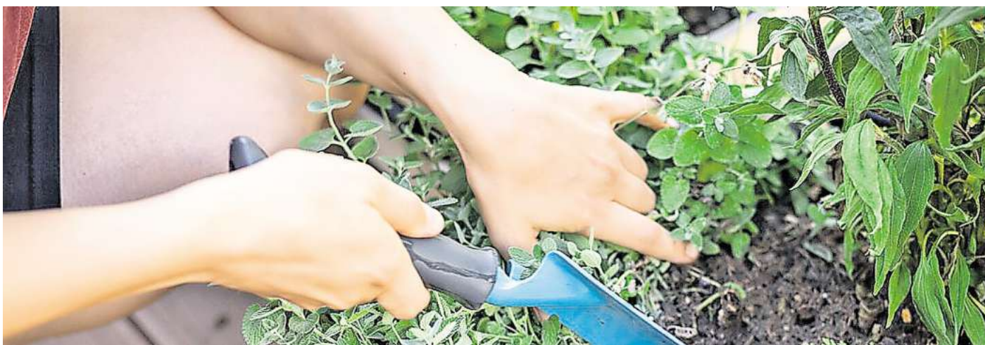
Zwischen Frost und Hoffnung – Pflanzzeit zu den Eisheiligen.