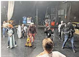
Gemeinsam mit dem Kulturring haben Schüler der IGS ein Theaterstück erarbeitet.

Inspiziert vom berühmten Kinderbuch „Der Struwwelpeter“ von Heinrich Hoffmann, das mit drastischen Erziehungsmethoden schockiert, präsentiert das Theaterstück eine Neuinterpretation. Im Zentrum steht ein