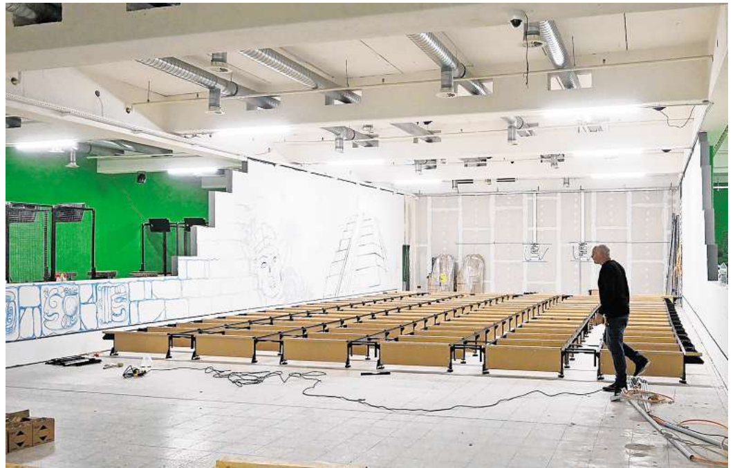
Im ehemaligen Edeka-Center am Friedrich-Ebert-Platz in Peine entsteht in der oberen Etage der Indoor-Freizeitpark „Jungle Adventures“. Derzeit wird am Grundgerüst für die sechs Bowlingbahnen gearbeitet.

Im Peiner Indoor-Park geplant sind auch Spielangebote des finnischen Unternehmens Valo Motion. Dabei wird aktive Bewegung – etwa Trampolinspringen und Klettern – mit Videospielen kombiniert. Die Bewegungen des Spielers werden auf eine Leinwand übertragen. Und auch ein Pixel-Raum, bei dem LED-Kacheln beleuchtet werden, wird auf der Spielfläche im ehemaligen E-Center angeboten. Über Fußsensoren müssen die Kacheln quasi „eingesammelt“ werden. Diese Attraktionen sind bereits in Peine ein-