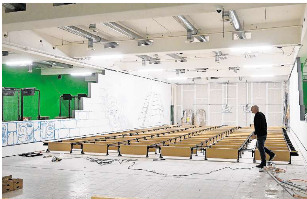
Im ehemaligen Edeka-Center am Friedrich-Ebert-Platz in Peine entsteht in der oberen Etage der Indoor-Freizeitpark „Jungle Adventures“. Derzeit wird am Grundgerüst für die sechs Bowlingbahnen gearbeitet.

Im Peiner Indoor-Park geplant sind auch Spielangebote des finnischen Unternehmens Valo Motion. Dabei wird aktive Bewegung – etwa Trampolinspringen und Klettern – mit Videospielen kombiniert. Die Bewegungen des Spielers werden auf eine Leinwand übertragen. Und auch ein Pixel-Raum, bei dem LED-Kacheln beleuchtet werden, wird auf der Spielfläche im ehemaligen E-Center angeboten. Über Fußsensoren müssen die Kacheln quasi „eingesammelt“ werden. Diese Attraktionen sind bereits in Peine ein-