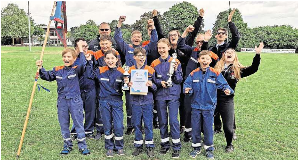
Jubel bei den Siegern des Feuerwehr-Wettbewerbs.