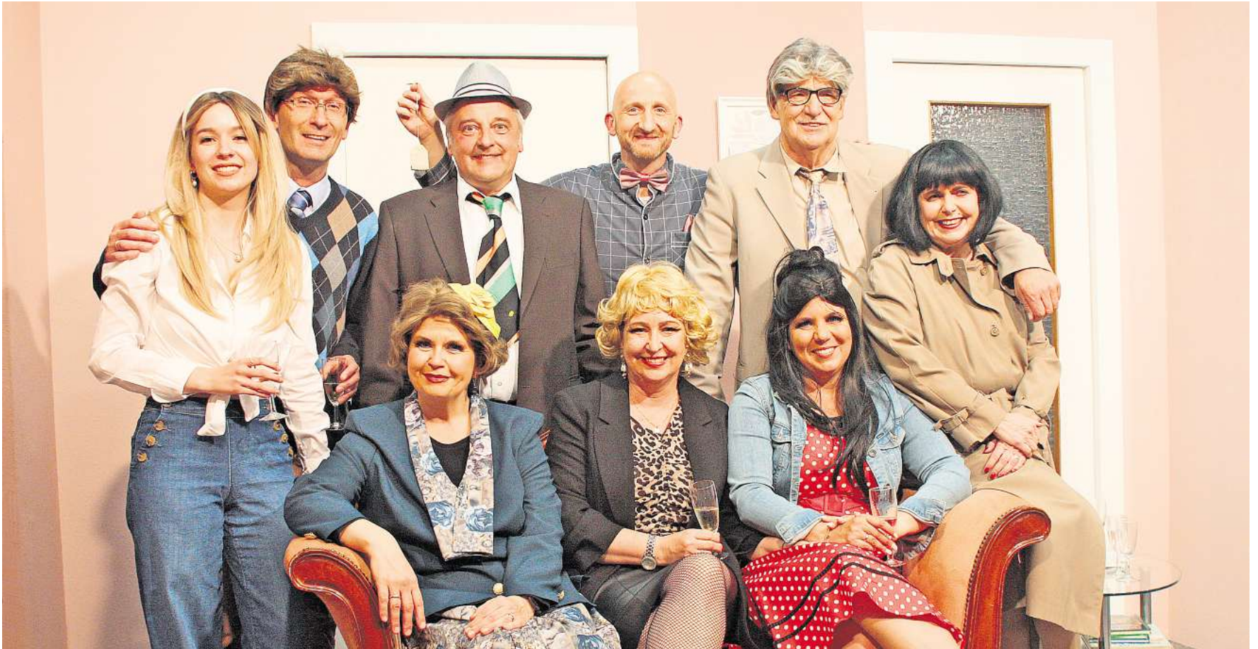
Die Darsteller der Komödie „Wie wär's denn, Mrs. Markham“ aus Vöhrum.