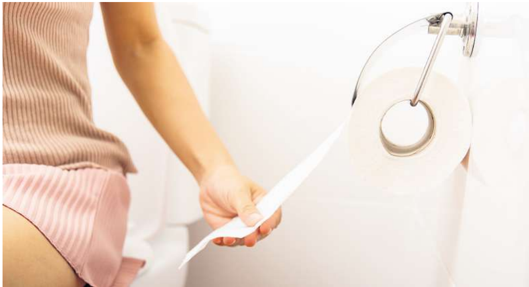
Ins Klo oder in den Mülleimer - das ist auf Reisen oft die Frage.

Deshalb ist es kein Wunder, dass du in Griechenland sowohl