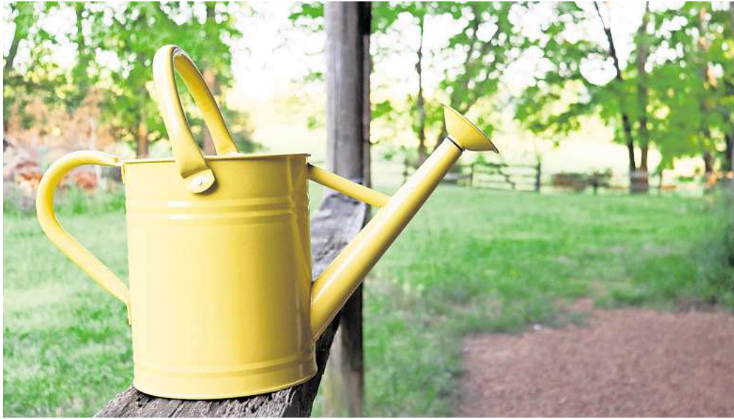
Der Klimawandel macht den Stadtbäumen zu schaffen, deshalb gibt es in vielen Städten Deutschlands Freiwillige, die Straßenbäume gießen.