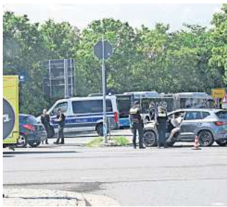
Stark beschädigt: Der Cupra musste von einem Abschleppdienst abtransportiert werden.

Die Frau wurde dabei schwer verletzt, ein Rettungswagen transportierte sie ins Krankenhaus. Die Frau habe sichtlich unter Schock gestanden, habe allerdings selbstständig zum Ret-