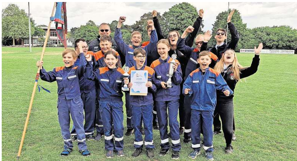
Jubel bei den Siegern des Feuerwehr-Wettbewerbs.