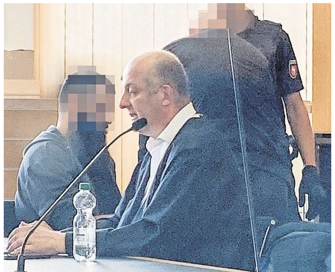
Schweigend und äußerlich ungerührt nahm der Angeklagte das Urteil zur Kenntnis.