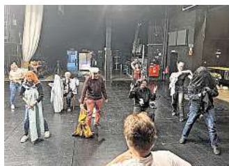
Gemeinsam mit dem Kulturring haben Schüler der IGS ein Theaterstück erarbeitet.

Inspiziert vom berühmten Kinderbuch „Der Struwwelpeter“ von Heinrich Hoffmann, das mit drastischen Erziehungsmethoden schockiert, präsentiert das Theaterstück eine Neuinterpretation. Im Zentrum steht ein