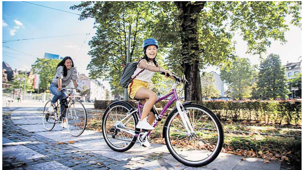
Das Peiner Stadtradeln beginnt wieder.

Am mobilen Kulturstandort des „wow!-Clubs“, Hinter der Schule 10, Bülten, gibt es am Samstag nicht nur Austausch und Infos über kulturelle Projekte im Peiner Land – wer mit dem Rad vorbeikommt, erhält auch eine kleine bunte Tüte zum Mitnehmen.