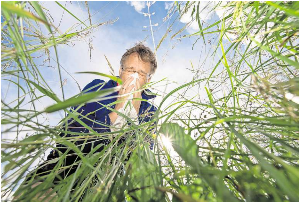
Heuschnupfen im Anflug

Für betroffene kann Heuschnupfen das tägliche Leben erheblich beeinträchtigen, vor allem bei starkem Pollenflug. Ge-