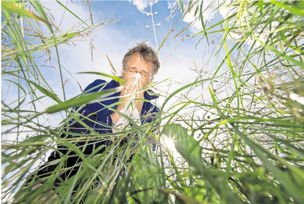
Heuschnupfen im Anflug

Für betroffene kann Heuschnupfen das tägliche Leben erheblich beeinträchtigen, vor allem bei starkem Pollenflug. Ge-