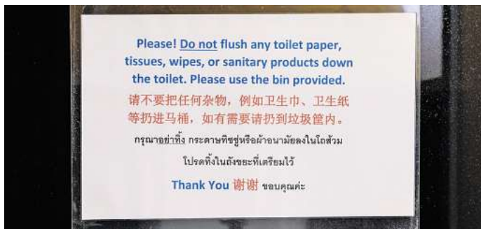
In Thailand findest du in jedem Hotel Hinweise zu Toilettenpapier.

Die wichtigste Regel für Reisende lautet daher: Augen auf bei Geschäften jeder Art! Meistens sind im Badezimmer Hinweise angebracht, wie das Papier entsorgt werden soll. Wer sie beachtet, schont nicht nur die empfindlichen Abwassersysteme, sondern erspart sich auch eventuelle peinliche Situationen. Im Zweifel gilt: Wenn im Urlaubsort ein Mülleimer neben der Toilette steht – benutz ihn.