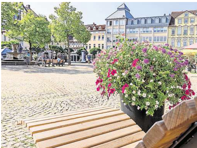
„Peine blüht auf“: Das Förderprojekt erhöht mit Blumeninseln die Aufenthaltsqualität in der Peiner Innenstadt.

Die Idee hinter „Peine blüht auf“ wird durch das Bundesprogramm „Zukunftsfähige Innenstädte und Zentren“ zu 90 Prozent gefördert. Eine Investition, die im wahrsten Sinne des Wortes aufblüht. Die Pflanzgefäße bestehen aus recycelbarem Material, sind mit Wasser beschwert und pflegeleicht. So bleibe Peines Innenstadt bis Mitte Oktober in floraler Hochform, nachhaltig, naturnah und mit einem klaren Bekenntnis zu mehr Stadtgrün.