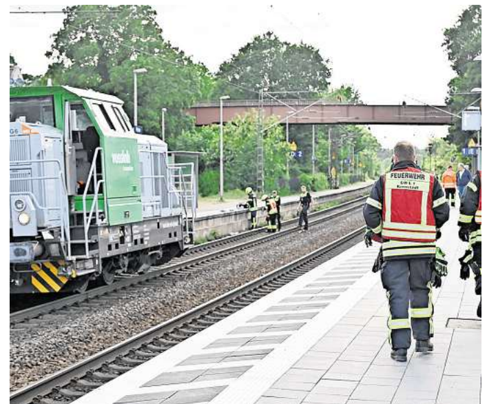
Der Unfallort: Auf den Gleisen am Peiner Bahnhof mussten Retungskräfte einen Schwerverletzten bergen.