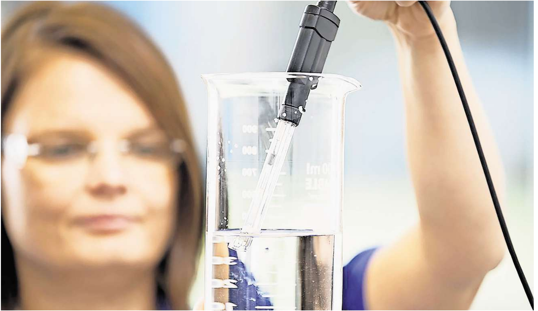
Die Wasserqualität wird regelmäßig in Peine überprüft.