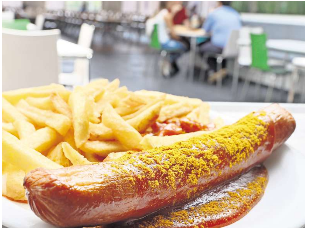
Currywurst mit Pommes ist nach wie vor als schnelle Mahlzeit beliebt.

Direkt zur Umfrage: Einfach den QR-Code mit dem Handy scannen.