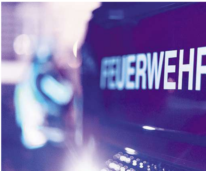
Die Feuerwehr musste nicht eingreifen.

„Als unser BvD die Lage erkundete, war schnell klar: Alles unter Kontrolle, hier sind keine Maßnahmen für uns nötig“, berichtet Feuerwehrsprecher