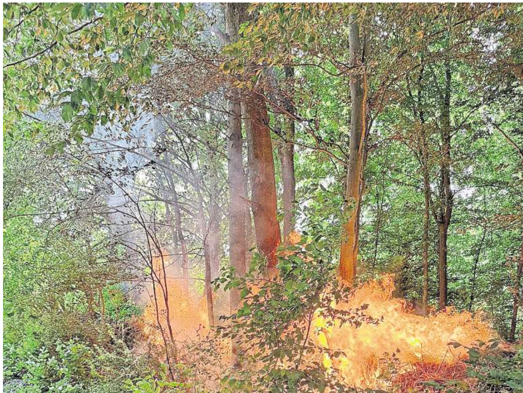
In der Nähe des Auebades in Wendeburg gab es am Mittwoch einen Waldbrand.

„Aufgrund der Gesamtumstände ist nicht auszuschließen, dass Brandstiftung vorliegt“, sagt der Peiner Polizeisprecher Malte Jansen. Deshalb bittet er mögliche Zeugen darum, sich unter der Telefonnummer (0 51 76) 97 64 80 bei der Polizei in Edemissen zu melden.