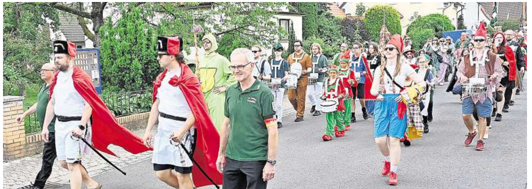
Der große Festumzug bestimmt am Sonntag wieder das Straßenbild.

Ausgelassene Stimmung im idyllischen Ortspark