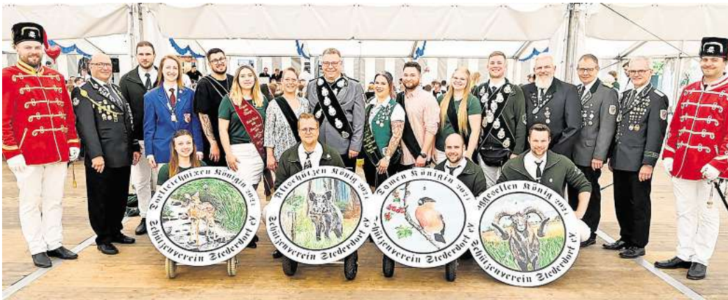
Das Königshaus 2024 freut sich auf das bevorstehende Fest.

Wer gewinnt die neuen Königsscheiben 2025 ?