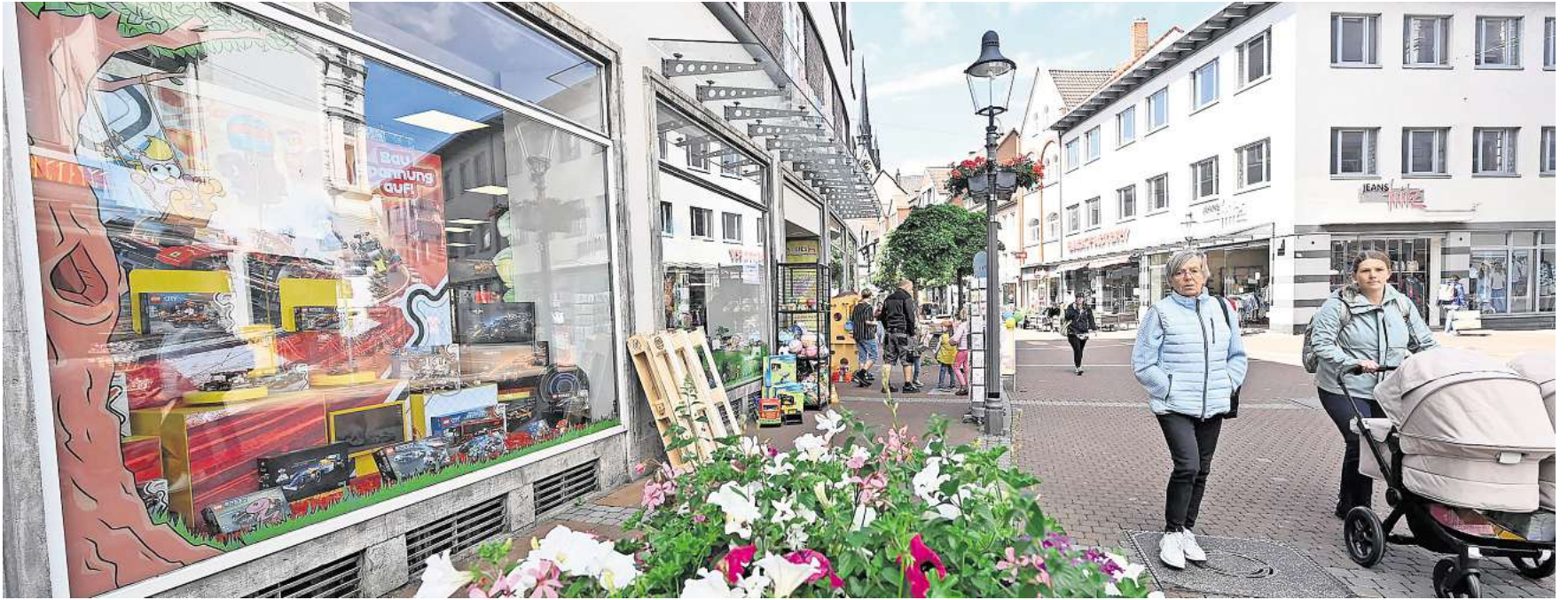
Die Peiner Innenstadt soll weiter „aufblühen“.