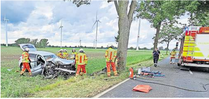
Bei dem schweren Unfall bei Lehrte-Sievershausen wurden ein 76-Jähriger und sein 13-Jähriger Enkel schwer verletzt und mussten aus dem Unfallfahrzeug befreit werden.

Ersthelfer waren schnell zur Stelle, leisteten Erste Hilfe und setzten einen Notruf ab. Die Feuerwehr Sievershausen und Hämelerwald rückte mit insgesamt 44 Einsatzkräften aus. Die beiden Insassen, die durch den Aufprall