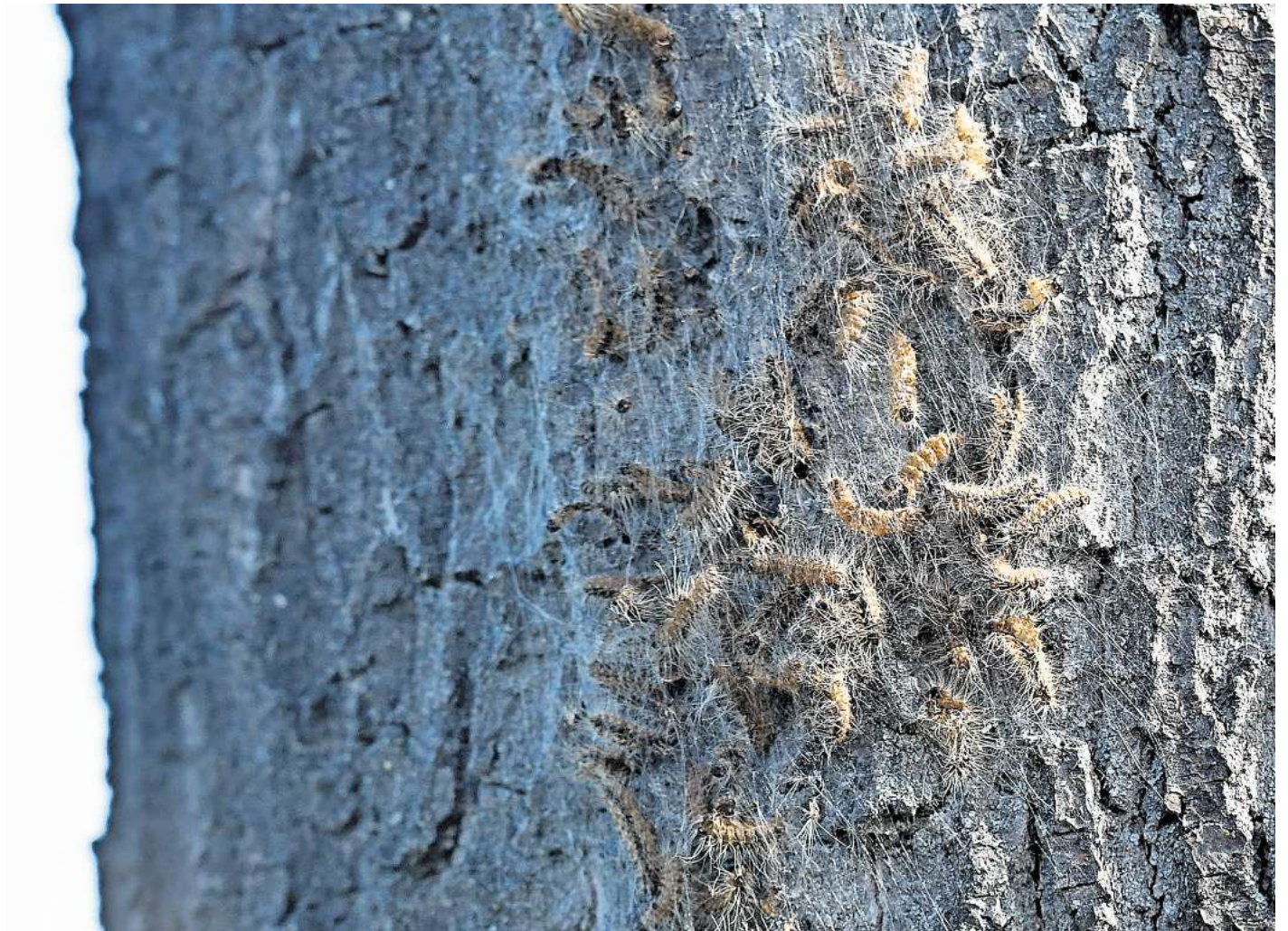
Die Raupen des Eichenprozessionsspanners: Gut sind die für Menschen gefährlichen Brennhaare des Insekts zu erkennen.