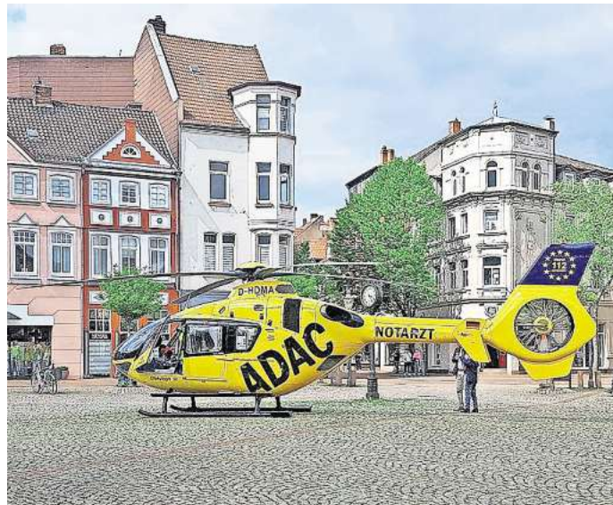
Im vergangenen Jahr 2024 wurde Rettungshubschrauber Christoph seltener nach Peine alarmiert als noch im Vorjahr 2023.

Eine gute Nachricht gibt es dennoch: Die Leitstelle musste 2024 mit insgesamt 333 Einsätzen etwas seltener den Hubschrauber anfordern als im Vorjahr. Mit dabei waren der Christoph 30 aus Wolfenbüttel in Peine, der Christoph 19 aus Uelzen, der