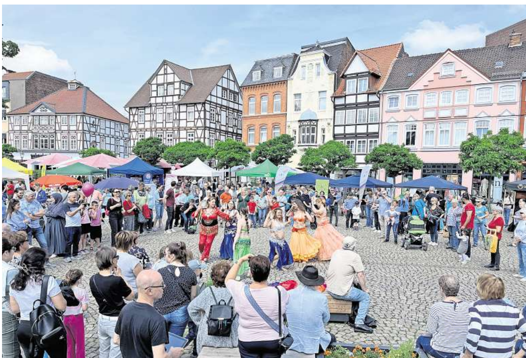
Auf dem Peiner Marktplatz findet am Samstag, 7. Juni, die elfte Auflage des Festes der Kulturen statt.

Das Sicherheitskonzept als solches werde zwischen Veranstalter und Genehmigungsbehörde abgestimmt. Polizeisprecher