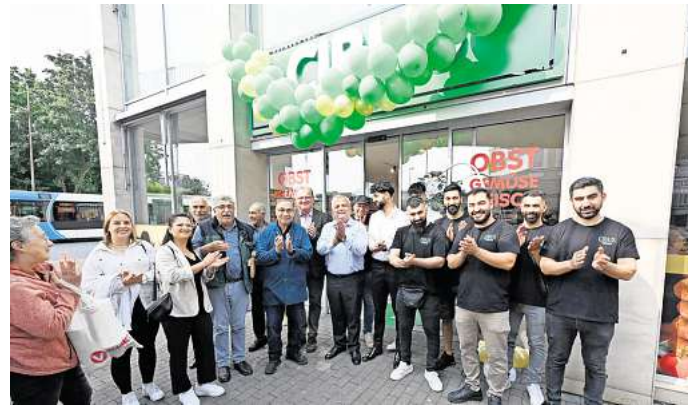
Das Team des neuen Marktes „Cibus“ freut sich darauf, dass es endlich los gehen kann.