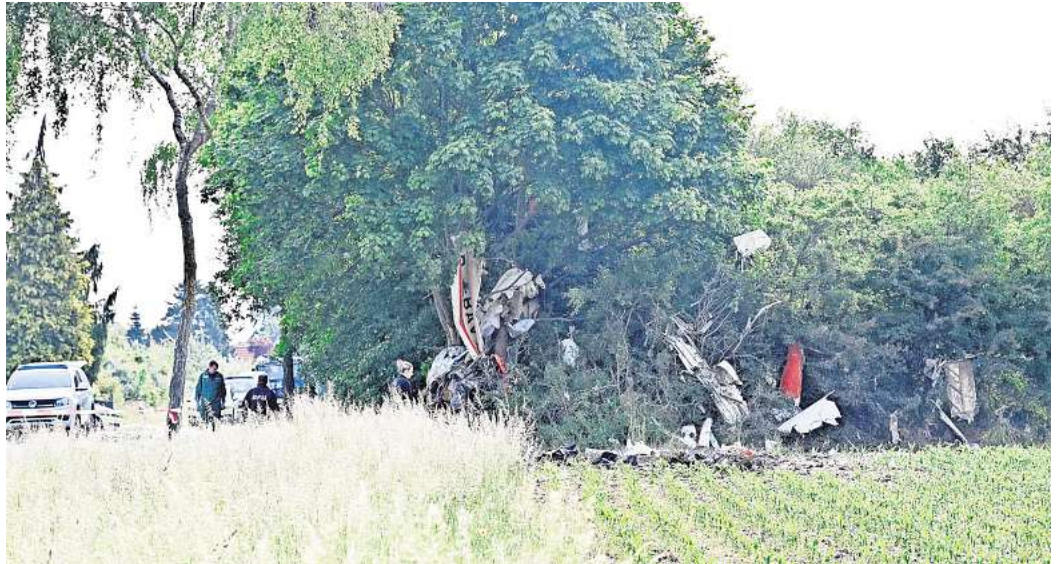
Ermittlungen an der Unfallstelle: Die Bundesstelle für Flugunfall-Untersuchung und die Polizei arbeiteten am Montag an der Absturzstelle zwischen Edemissen und Oedesse.

Hobby-Piloten vermuten Zusammenhang mit Gewitter