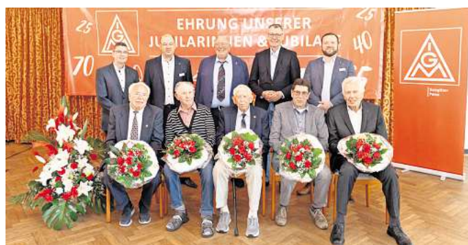
Jubilare der IG Metall Salzgitter-Peine 2025