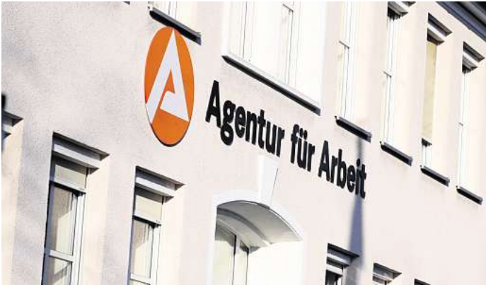
Bei der Arbeitsagentur in Peine waren im Mai 4471 Menschen arbeitslos gemeldet.