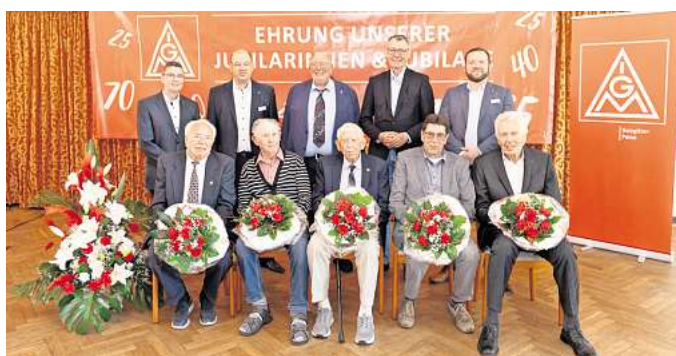
Jubilare der IG Metall Salzgitter-Peine 2025