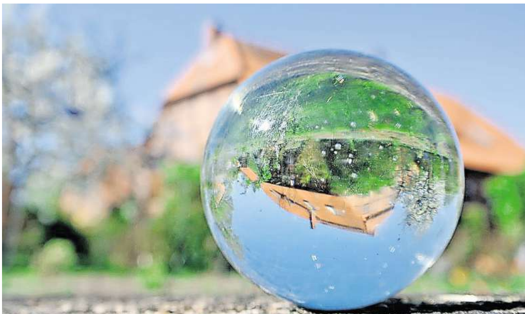
Der Kunsthof Mehrum ist an beiden Pfingsttagen geöffnet.