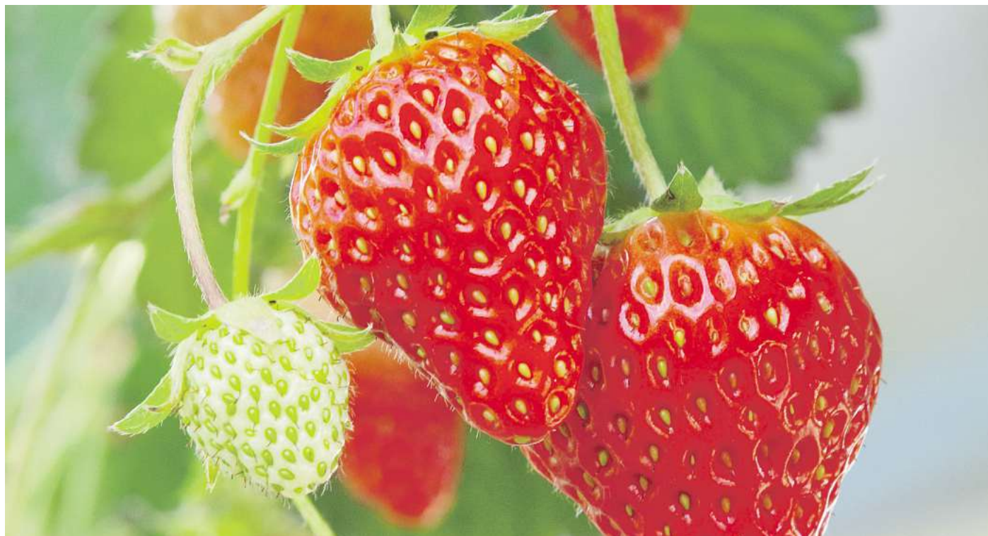
Deutsche Erdbeeren: Lecker, gesund und ab sofort zu haben.

Heimische Erdbeeren sind besser für Klima und Umwelt – und schmecken viel besser