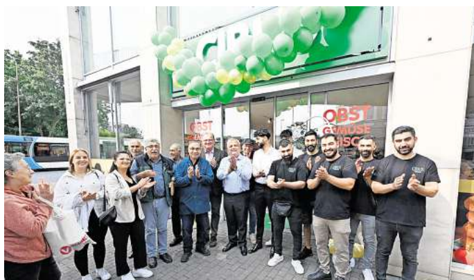
Das Team des neuen Marktes „Cibus“ freut sich darauf, dass es endlich los gehen kann.