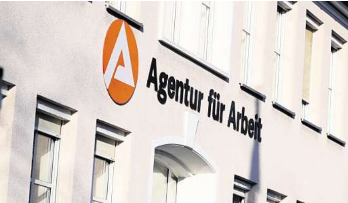
Bei der Arbeitsagentur in Peine waren im Mai 4471 Menschen arbeitslos gemeldet.

Trotz des anhaltenden Fachkräftebedarfs würden sich viele Unternehmen bei Neueinstellungen zurückhalten. „Arbeitgeber zögern, offene Stellen zu besetzen, oder streichen geplante Einstellungen ganz“, so Beger. Der Fokus liege auf Stabilisierung statt Expansion – eine Entwicklung, die wohl anhält, bis sich die wirtschaftliche Lage nachhaltig bessert. Im Landkreis Peine waren 4.471 Menschen arbeitslos gemeldet. Das sind 90 Personen (zwei Prozent) weniger als im April, aber 178 Personen (vier Prozent)