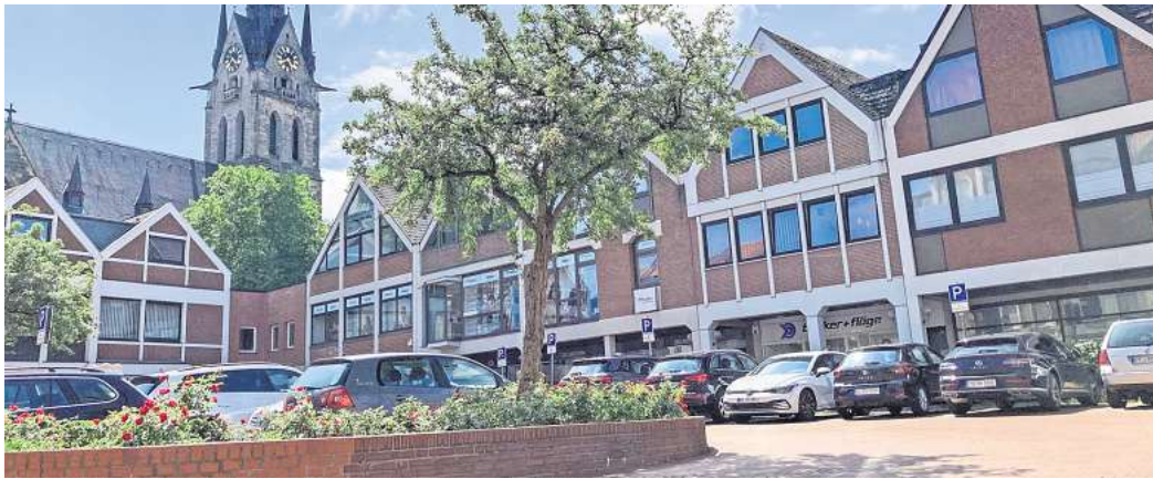
Bereits Ende 2023 wurde nach mehr als drei Jahren Streit der Umbau am Echternplatz in Peine beschlossen.

Nach mehreren Skizzen und hitzigen Debatten in Ausschüssen und Bürgerrunden wurde Ende 2023 eine überarbeitete Planung beschlossen: Statt 29 Parkplätzen wird es künftig nur noch 12 geben. Hinzu kommen 18 Fahrradbügel für 36 Räder, neue Bäume, Bü-