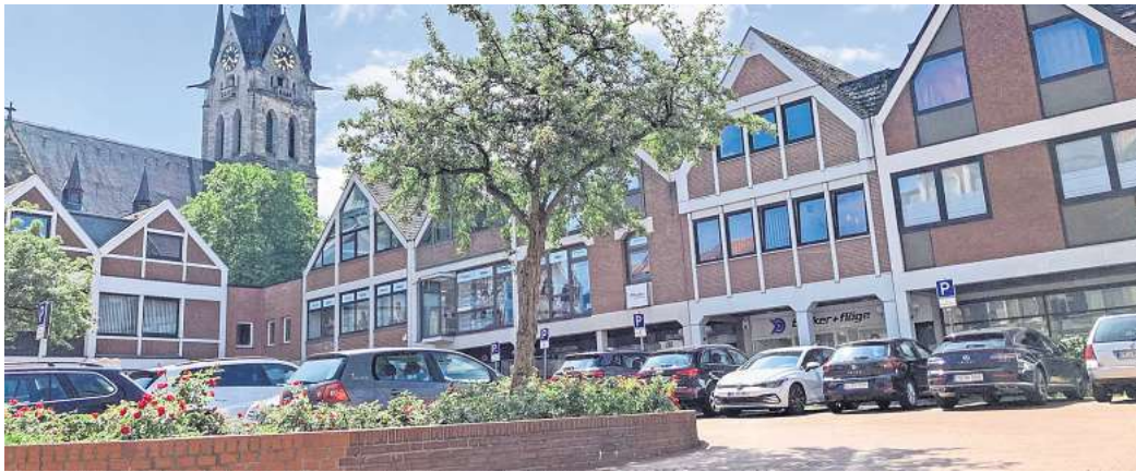
Bereits Ende 2023 wurde nach mehr als drei Jahren Streit der Umbau am Echternplatz in Peine beschlossen.

Nach mehreren Skizzen und hitzigen Debatten in Ausschüssen und Bürgerrunden wurde Ende 2023 eine überarbeitete Planung beschlossen: Statt 29 Parkplätzen wird es künftig nur noch 12 geben. Hinzu kommen 18 Fahrradbügel für 36 Räder, neue Bäume, Bü-