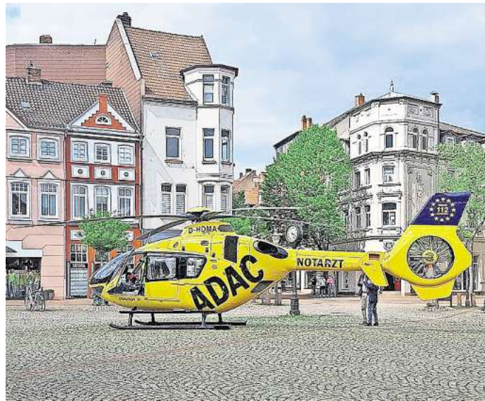
Im vergangenen Jahr 2024 wurde Rettungshubschrauber Christoph seltener nach Peine alarmiert als noch im Vorjahr 2023.

Eine gute Nachricht gibt es dennoch: Die Leitstelle musste 2024 mit insgesamt 333 Einsätzen etwas seltener den Hubschrauber anfordern als im Vorjahr. Mit dabei waren der Christoph 30 aus Wolfenbüttel in Peine, der Christoph 19 aus Uelzen, der