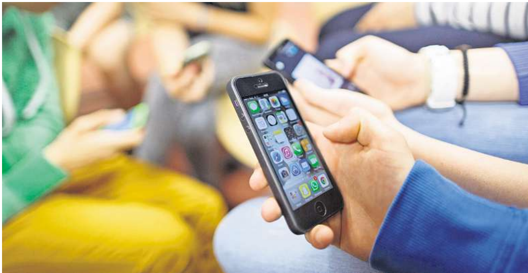
Zusammen im Raum - doch jeder für sich.

Viele Menschen sind heute so an ihr Smartphone gewöhnt, dass der Gedanke an einen bewussten Verzicht zunächst abschreckend wirkt. Studien zeigen jedoch, dass ein bewusster