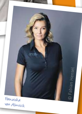
Franziska van Almsick