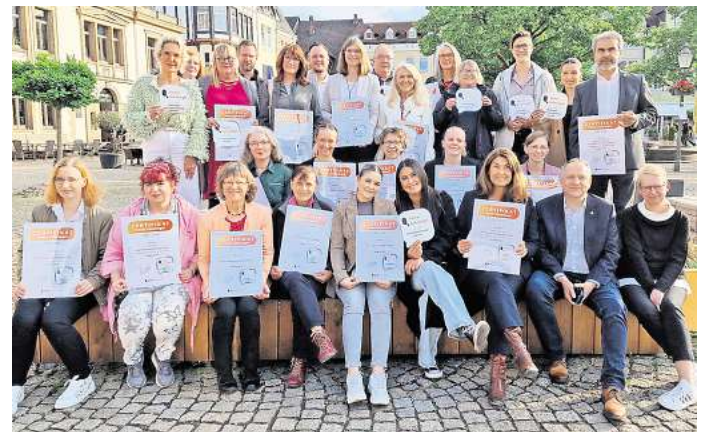
Mehr als 50 Peiner Geschäftsleute wurden für ihren besonderen Kundenservice ausgezeichnet.

Einzelhändler und Dienstleister freuen sich über die Auszeich-