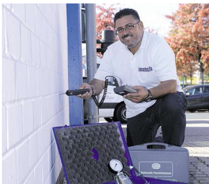
Eine kostenlosen Schadensanalyse und ausführliche Beratung ist für die innotech GmbH fester Bestandteil des Leistungsversprechens.

Starkregenereignisse haben im Zuge des Klimawandels rasant zugenommen. Auf diese Bedrohung haben mittlerweile auch die Region Hannover sowie die Regionskommunen reagiert und informieren im Internet mittels Starkregenhinweiskarten sowie weiteren Informations- und Beratungsangeboten über die wachsende Gefährdung des Immobilienbestands. Große Niederschlagsmengen, die in kurzer Zeit abregnen, können von den Böden nicht aufgenommen werden, zumal Starkregenereignisse immer öfter von längeren Trockenperioden begleitet werden, in denen die Böden aushärten. In der Folge staut sich Niederschlagswasser auf und dringt bei unzureichend geschützten Immobilien durch das Mauerwerk ein. Die Konsequenz: gesundheitsgefährdende Schimmelbildung oder Salzausblühungen, die der Baustoffe schaden. Hier ist rasches Handeln gefragt. Besonders ältere Immobilien, die vor den 70er Jahren errichtet wurden, verfügen häufig nicht über eine ausreichende Bauwerksabdichtung, sodass Feuchtigkeit von außen durch die Bodenplatte aufsteigen oder seitlich in die Kellerwände eindringen kann. Darüber hinaus können feuchte Kellerräume nicht mehr uneingeschränkt genutzt werden, im Ergebnis verliert die Immobilie wertvolle Nutz- oder Wohnfläche und schließlich auch an Wert. Eine Sanierung feuchter