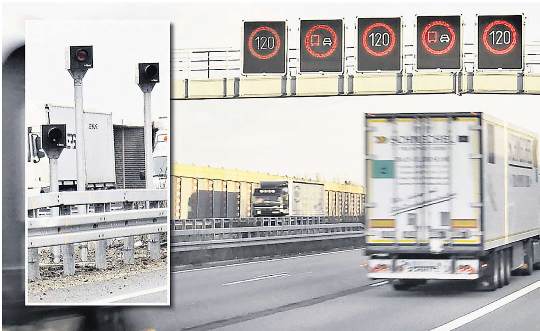
Elektronische Schilderbrücke bei Peine: Die Anlagen werden vollautomatisch durch einen hochkomplizierten Algorithmus gesteuert. Kleines Bild: Die neuen Blitzer bei Zweidorfer Holz.