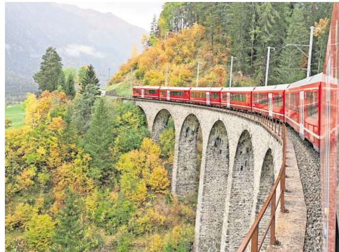
In der Schweiz ist man bei der Infrastruktur am Ball geblieben.

Kürzere Teilstrecken, mehr Umstiege, insgesamt aber weniger Verspätungen und eine pünktliche Ankunft sind das Ziel. Doch die Umsetzung zieht sich, viele fürchten gar bis 2070. Derzeit ist es jedenfalls weiterhin so, dass Züge quer durch Deutschland sehr lange Strecken fahren. Dabei schieben sie Verspätungen schlimmstenfalls über Stunden vor sich her, blockieren Bahnsteige und bremsen andere Züge aus. „Verspätete Züge sind nicht zu retten. Man muss sie aus dem Fahrplan nehmen“, sagt der Experte. Punkt.