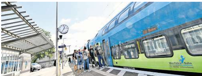
Mit Halbstundentakt zum Erfolg: Die RE60- und RE70-Züge der Westfalenbahn haben seit Umstellung 13 Prozent mehr Fahrgäste bekommen.

Auch der Enno-Regionalexpress RE30 von Wolfsburg über Gifhorn nach Hannover hat Federn gelassen. 11.700 sind noch 2019 werktags mitgefahren, 2023 waren es 9.800, ein Minus von 16 Prozent. Einen Grund sieht der Regionalverband in der Einführung des Homeoffices während und nach der Corona-Pandemie für Arbeitnehmer vor allem bei