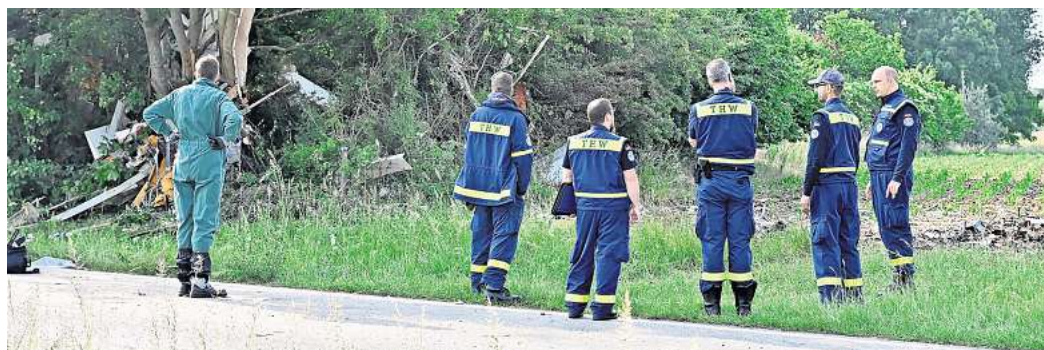
Spezialisten der Bundesstelle für Flugunfalluntersuchung ermittelten am Unglücksort. Direkt hinter den Büschen und Bäumen liegt ein Edemisser Wohngebiet. THW-Kräfte borgen das Wrack des abgestürzten Kleinflugzeugs.