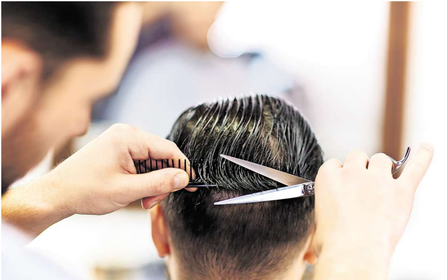
Ein Friseur schneidet einem Kunden die Haare.

Einfach ignorieren können sie die Kritikpunkte nicht, wenn sie ihren Betrieb fortführen wollen: In der Anhörung wurden sie darüber belehrt, dass ein Nicht-Mitwirken zu einer kostenpflichtigen Löschung der