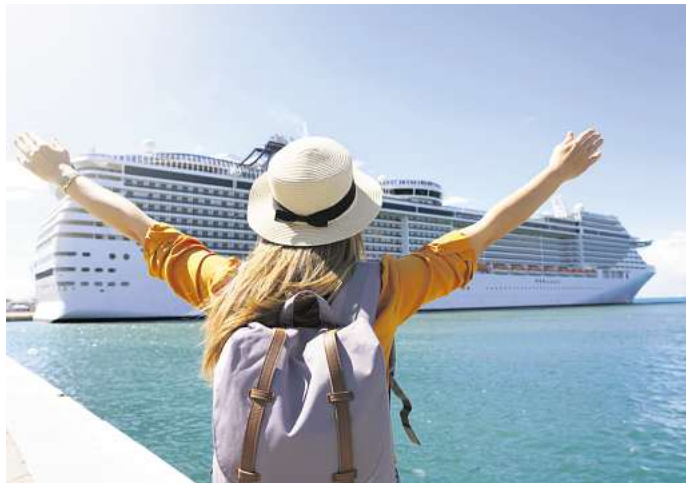
Wenn das Schiff ohne einen weiterfährt, ist die Kreuzfahrt erst mal beendet.

Auf einer Kreuzfahrt mit Royal Caribbean ist eine Frau vor einigen Jahren über das Geländer ihres Balkons geklettert, um dort ein Foto von sich zu machen. Die Frau wurde von anderen Mitreisenden gemeldet und musste im nächsten Hafen in Falmouth auf Jamaika das Kreuzfahrtschiff verlassen. Generell ist es auf Kreuzfahrtschiffen strikt verboten, auf Balkongeländern zu sitzen, darauf zu klettern oder sich