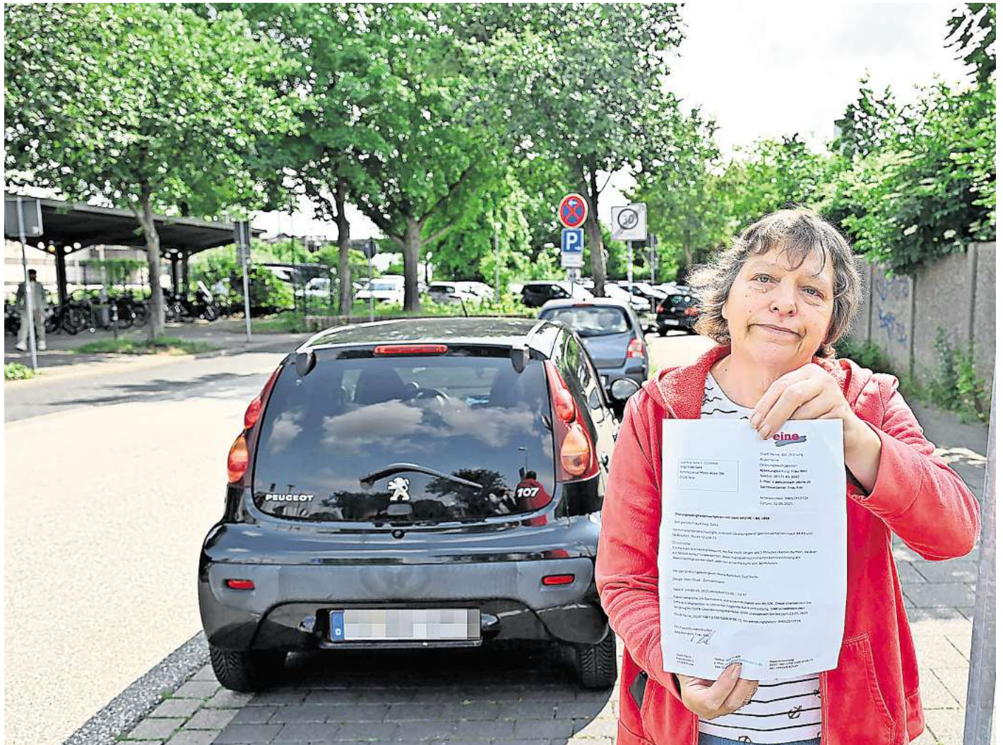
An dieser Stelle auf der Südseite des Peiner Bahnhofs soll Birgit Kniep-Salla laut dem Fake-Schreiben falsch geparkt haben.