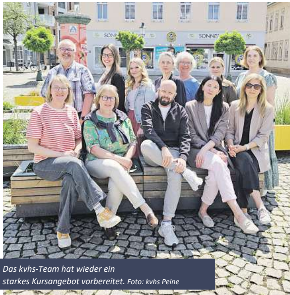
Das kvhs-Team hat wieder ein starkes Kursangebot vorbereitet.

„Mit unseren Kursen können sich Kinder und Jugendliche auf dem Weg zum Erwachsenwerden ausprobieren.“ erläutert Knut Arnold von der jungen vhs. Beim Nachmittag