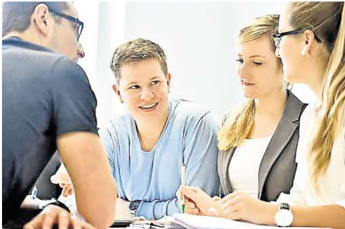
Haben junge Menschen eine andere Einstellung zum Thema Arbeit als ältere Arbeitnehmer?

Die Ergebnisse verdeutlichen, dass die junge Generation eine Arbeitsmoral vertritt, die von