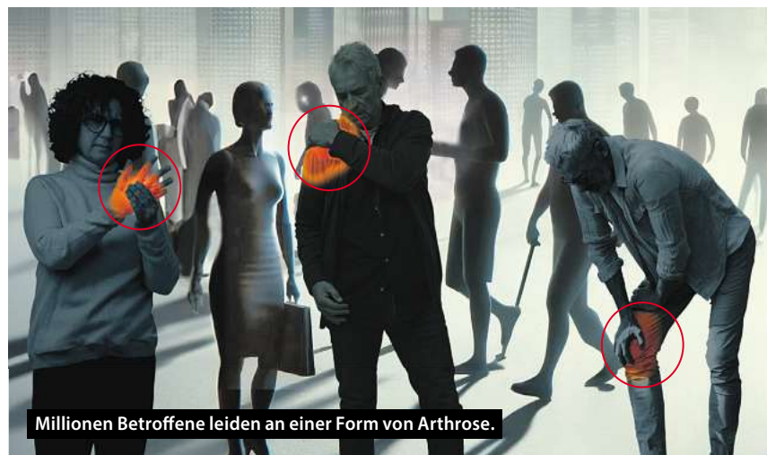
Millionen Betroffene leiden an einer Form von Arthrose.

Bei der Hüftarthrose spüren viele Betroffene einen Anlaufschmerz.