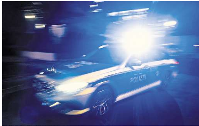
Die gefährliche Verfolgungsjagd am Montagmorgen geschah miten im Berufsverkehr.

Was folgte, war erneut eine waghalsige Fahrt mit einem Tempo von weit mehr als 100 Stundenkilometern durch Peine. Die Frau missachtete rote Ampeln, überholte riskant und rücksichtslos. Mehrfach kam es beinahe zu Kollisionen mit anderen Verkehrsteilnehmern.