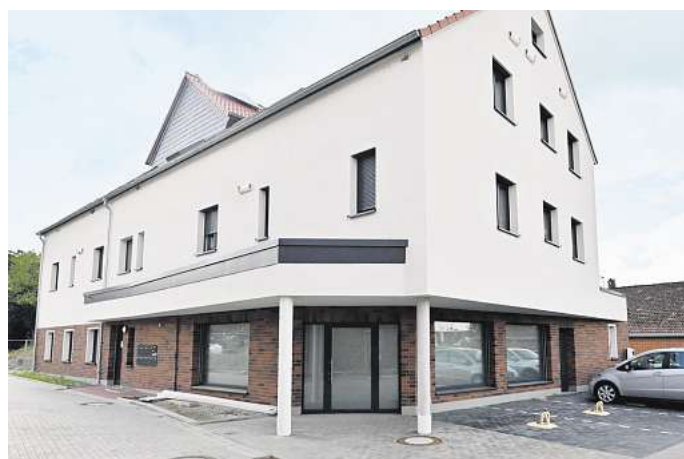
Der Neubau im Wohnquartier „Am Pfarrgarten“ in Edemissen. Die Wohnungen sind allesamt vermietet, doch die Gewerbefläche im Erdgeschoss kann noch angemietet werden.

Die Gewerbefläche ist bezugsfertig, aber die Schaufenster sind derzeit noch mit grauem Sichtschutz abgehängt. Das Filetstück wird derzeit vom Peiner Immobilien-Makler