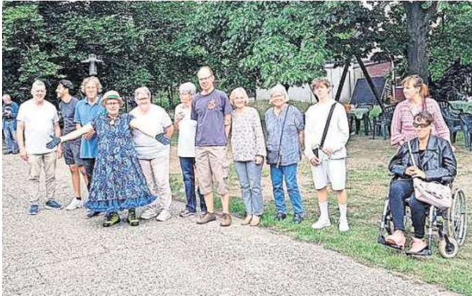
Sorgte für eine gelungene Feier: Das Organisationsteam von INCA und Familien für Familien hatte zum großen Sommerfest geladen.

10 Jahre INCA im evangelischen Kirchenkreis Peine