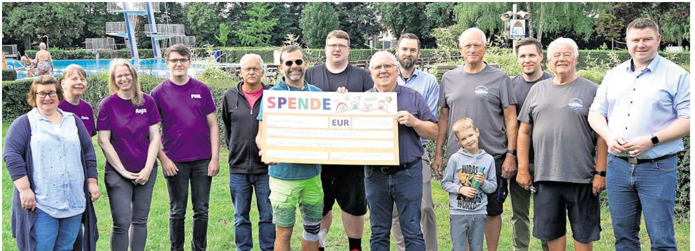
Spendenübergabe: Der diesjährige Erlös des 24-Stunden-Schwimmens kommt der Hospizbewegung Peine zugute.

Der symbolische Scheck wurde von Bürgermeister Nils Neuhäuser genannt Holtbrügge