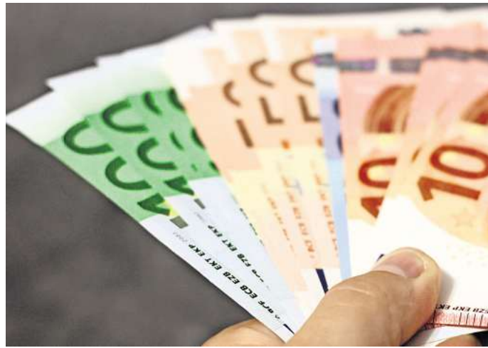
Im Landkreis Peine ist das mittlere Einkommen im vergangenen Jahr gestiegen.

Blicke man auf die unterschiedlichen Wirtschaftszweige zeigt sich: Die Einkommen variieren