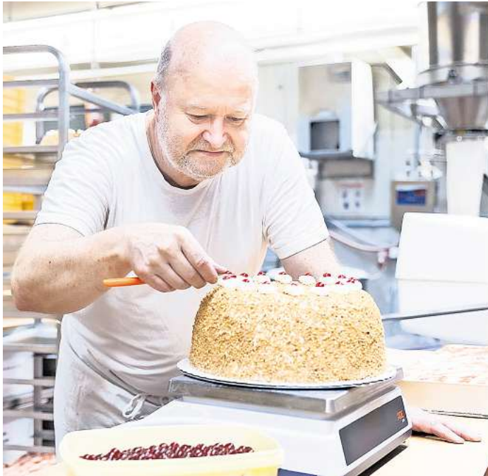
Rund 100 Mitarbeiterinnen und Mitarbeiter können aufatmen: Das Insolvenzverfahren in Eigenregie bei der Peiner Traditionsbäckerei Seidel konnte erfolgreich abgeschlossen werden.