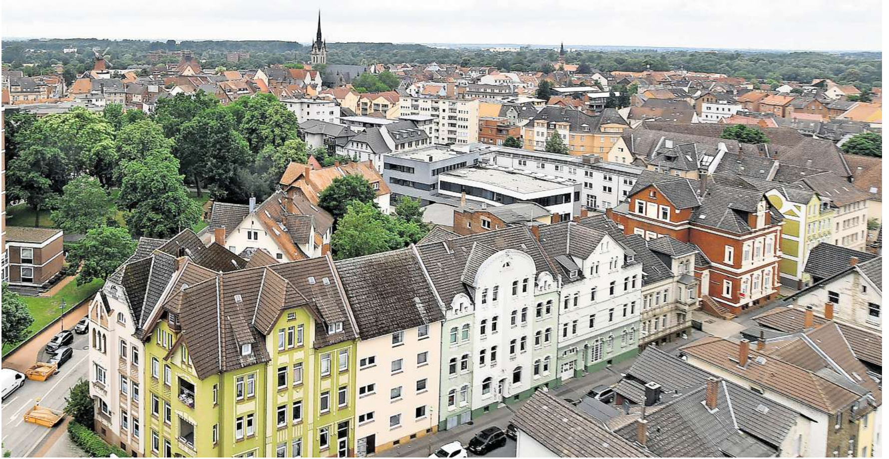
Eine neue Studie zeigt: In Peine ist Wohneigentum zwar günstiger als in vielen deutschen Städten, aber nicht automatisch leichter zu bekommen.