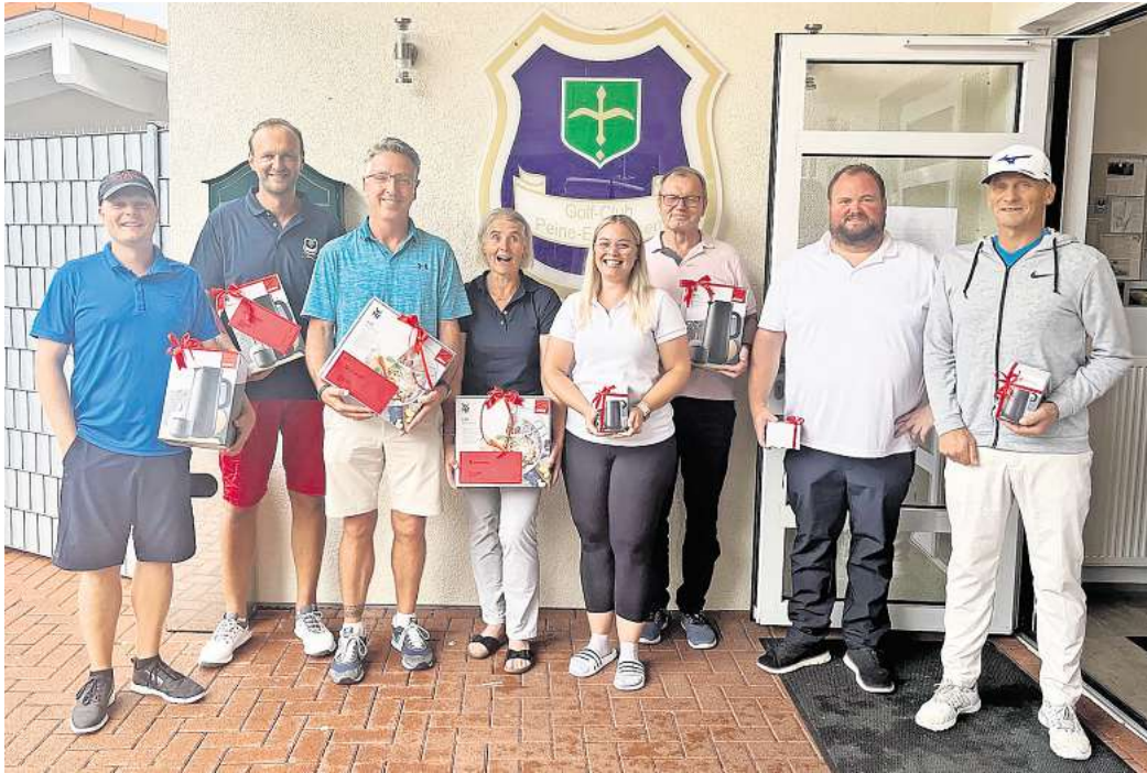
Benefiz-Golfturnier des Golfclubs Peine-Edemissen zugunsten der Deutschen Kinderkrebshilfe: Das sind die siegreichen Golferinnen und Golfer.

Dank der Teilnahme von 58 Spielerinnen und Spielern sowie großzügiger Spenden wurde im Golf-Club Peine-Edemissen eine beeindruckende Summe von 1.275 Euro für die Deutsche Kinderkrebshilfe gesammelt. Diese Unterstützung trage dazu bei, dass die gemeinnützige Organisation auf vielen Gebieten der Krebsbekämpfung wichtige Impulse geben, bundesweit den Aufbau von Versorgungsstruktu-