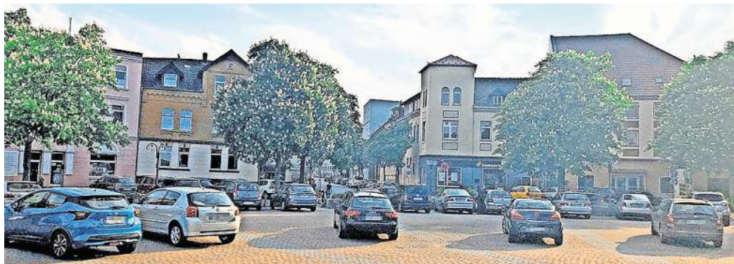
Das Hagenviertel, in dessen Mitte der Hagenmarkt liegt, bekommt Fördergeld vom Land. Rund 580.000 Euro sollen in die Quartiersentwicklung fließen.