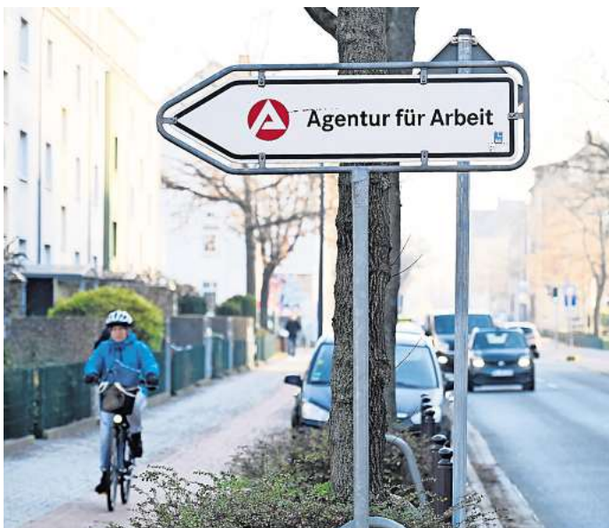
Die Agentur für Arbeit hat die Peiner Zahlen für Juli gemeldet.

Die Unternehmen suchen übrigens weiterhin Mitarbeitende: 2.435 freie Stellen sind derzeit alleine im Bestand der Arbeitsagentur Hildesheim-Peine.