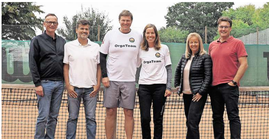
Das Orga-Team der Elli Oil Open sorgt für einen reibungslosen Ablauf.