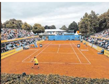
BRAWO OPEN: ATP-Challenger-Turnier.