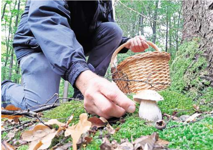
Pilze sammeln kann ein tolles Hobby sein, wenn sich an ein paar Regeln gehalten wird.

Wir möchten Ihre Meinung wissen: Wie stehen Sie zum Pilzsammeln? Ist es etwas für Sie – sammeln Sie Ihre Pilze selbst oder kaufen Sie sie lieber auf dem Markt oder im Supermarkt? Oder mögen Sie Pilze vielleicht gar nicht? Machen Sie mit bei unserer Umfrage. Scannen Sie dazu den QR-Code. Mit ein bisschen Glück gewinnen