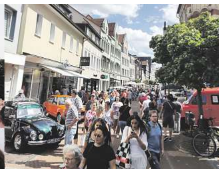
BRAWO MOBILITY SPRING: Peiner Innenstadt.

Für die BRAWO GROUP, die Unternehmensgruppe der Volksbank BRAWO, ist es eine Selbstverständlichkeit, Verantwortung für die Region zu übernehmen. Daher gehören Highlights, die die Attraktivität der Region und damit auch des Wirtschaftsstandorts stärken, dazu. Das umfasst Events sowie die Förderung von Vorhaben im Bereich Kultur und Sport. Es sind Teile im Rahmen