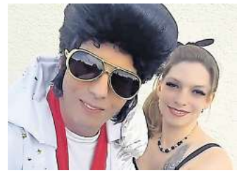
Elvis-Show beim Herbstmarkt: MEIKI & BELLA treten am Sonntag auf.

Alle weiteren Informationen zum Programm sowie aktuelle Hinweise gibt es online unter www.hgv-lengeede.info sowie auf den Social-Media-Kanälen des HGV bei Facebook und Instagram.