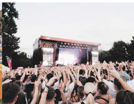
BRAWO BÜHNE: Braunschweiger Raffteichbad.