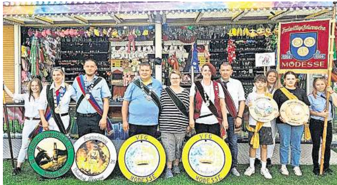
Königshaus von Mödesse: Nach einem gelungenen Volksfest stehen alle neuen Majestäten fest.

Am Volksfest-Samstag herrschte beste Stimmung: Die Junggesellen trugen ihre Rede mit viel Hu-