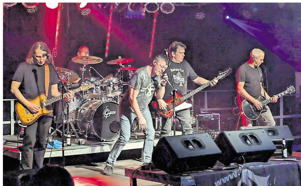
Auftakt für den Herbstmarkt: Die Band Triple F spielt am Freitag auf dem Festplatz.