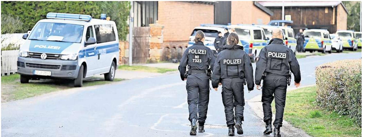
Die Polizei durchsuchte im März bei einem Großeinsatz in Rietze auch den Hof des Angeklagten.