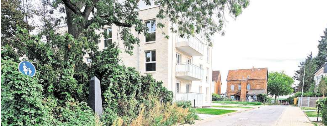
Die Fahrbahn hat ganz schön gelitten: Im Nachtigallenweg in der Peiner Südstadt soll die Straße erneuert werden.

Die Pläne waren jetzt Thema im städtischen Planungsausschuss. Auch im Zuge der Bauarbeiten an den Häusern und der Arbeiten für Leitungen für Internet oder Strom hat die Straße gelitten. „Aufgrund des mangelhaften Zustandes der Fahrbahn, der Bord-, Gossen- und der Neben-