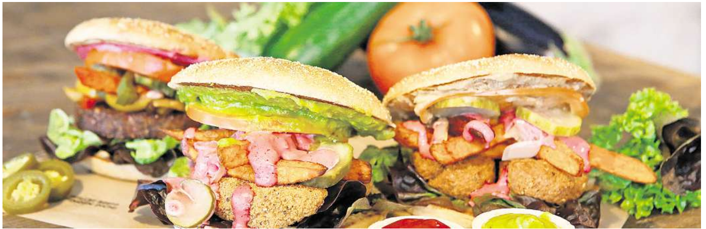
Burger mit veganem Patty – eine beliebte Alternative.

Laut aktuellen Marktforschungen hat der Umsatz mit Fleischalternativen in Deutsch-