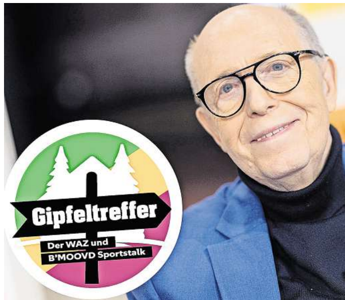
Klartext: Reiner Calmund ist einer der Gäste bei der Premiere des "Gipfeltreffer"-Talks am 16. September.

Nach der Aufzeichnung wird es außerdem noch die Möglichkeit geben, gemeinsam den Champions-League-Hit zwi-