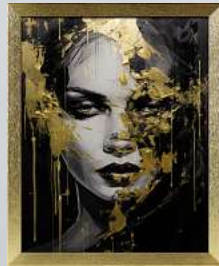
GERAHMTES BILD, Maße ca. 50x70 cm. 0378 0377/0378 00