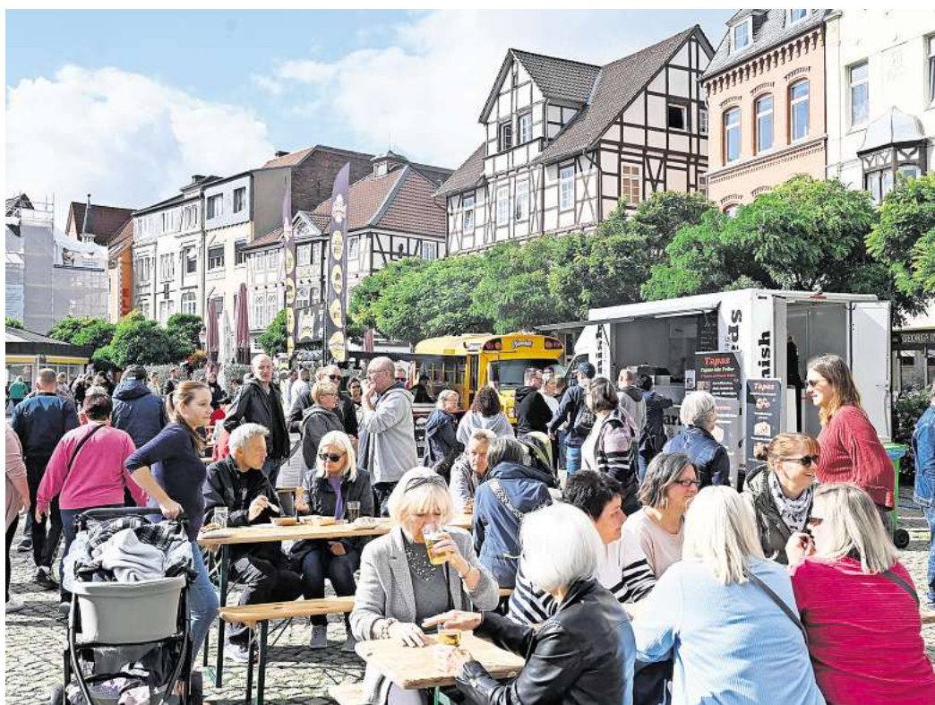
Auch auf dem historischen Marktplatz bauen die Anbieter wieder ihre Foodtrucks auf. Im Vorjahr war das Festival in Peine gut besucht.