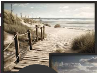
GERAHMTE BILDER, Maße ca. 31x41 cm, 0378 0507 00/ 0508 00/ 0512 00

SOFORT VERFÜGBAR 899.99 1759.-* DAUERTIEFPREIS