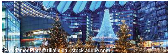
Potsdamer Platz

Weihnachtsmärkte rund um Berlin mit der MS Princess D-PRBEBE Berlin - Potsdam - Brandenburg - Berlin 5 Tage ✓ Fahrt im Luxusreisebus ✓ Flusskreuzfahrt laut Reiseverlauf ✓ Kofferservice an/von Bord ✓ 4 x Übernachtung in der gebuchten Kabine ✓ All-Inclusive-Verpflegung an Bord: 4 x Frühstück, 3 x 4-Gang-Mittagessen, 4 x Nachmittagskaffee/-tee, 4 x 4-Gang-Abendessen, 1 x 5-Gang-Kapitänsdinner ✓ Getränkepaket: Hauswein, Bier vom Fass, alkoholfreies Bier, Softdrinks, Säfte, Kaffee/Tee u. Mineralwasser (10:00 Uhr - 22:00 Uhr) ✓ 1 x Willkommens-Sekt und 1 x Abschiedsgetränk im Rahmen des Kapitänsdinners ✓ Stadtrundfahrt Berlin ✓ Besuch der Weihnachtsmärkte in Potsdam, Brandenburg und am Schloss Charlottenburg in Berlin ✓ Bordmusiker ✓ durchgehende Reisebegleitung ✓ alle Schiffsgebühren