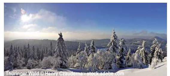
Thüringer Wald

Jahreswechsel im Thüringer Wald 4 Tage ✓ Fahrt im Luxusreisebus ✓ 3 x Ü/F im ***Achat Hotel Suhl im DZ ✓ Begrüßungsdrink im Hotel ✓ 1 x Katerfrühstück (i. R. d. HP) ✓ 2 x Abendessen als 3-Gang-Menü oder Buffet ✓ Silvesterfeier mit 5-Gang-Menü, Musik, Mitternachtsnack ✓ Stadtführung Erfurt ✓ Ausflug Oberhof und Meinungen mit Reiseleitung ✓ Ausflug Suhl und Rennsteig mit Reiseleitung ✓ durchgehende Reisebegleitung