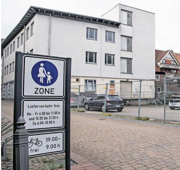
Blick von der Querstraße: In diesem Gebäude werden Wohnungen für Azubis entstehen. Der hässliche Hinterhof soll später auch weg.

Das Haus an der Fußgängerzone wird aber noch eine entscheidende bauliche Veränderung erfahren: Eine Etage wird in Holzbauweise aufgestockt. Zwei weitere Wohnungen mit je 80 bis 90 Quadratmetern und Dachterrasse werden so zusätz-