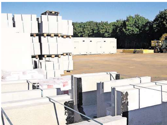
Betonquader und Container: Das Materiallager am Bahnhof Woltwiesche war Anfang August aufgebaut worden, kurze Zeit später wurden jedoch alle Baumaterialien wieder abtransportiert.

Wann nun tatsächlich mit dem Umbau des nördlichen Bahnsteigs begonnen werden kann, ist offen. Sobald das fehlende Material beschafft werden könne, werde die Öffentlichkeit über den Baubeginn informiert, heißt es von Seiten der Bahn.