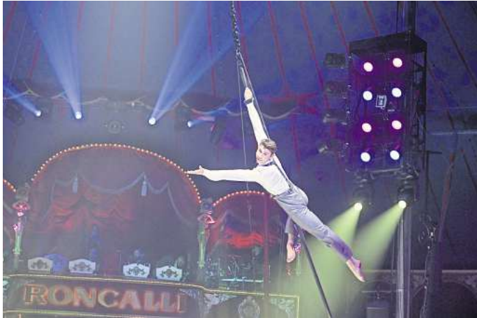
Roncalli - die Premiere von ArtisArt in Hannover.

Das Circus-Theater präsentiert seinen Gästen die wohl magischste Hommage an die Kunstwelt, die ein Circus je geboten hat. In dem – laut Andy Warhol – „wundervollsten Circus der Welt“ verneigen sich die Roncalli-Künstler vor Größen wie Frida