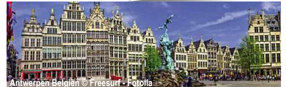
Antwerpen Belgien

Silvesterkreuzfahrt durch Holland & Belgien mit der MS Dutch Grace NL-SDGR Nijmegen - Wijk bij Duurstede - Schoonhoven - Kinderdijk - Dordrecht - Antwerpen - Maastricht - Arnhem 7 Tage ✓ Anreise nach Nijmegen u. Rückreise ab Arnhem im Luxusreisebus ✓ Flusskreuzfahrt lt. Reiseverlauf ✓ 6 x Übernachtung in der gebuchten Kabine ✓ volle Verpflegung an Bord: (beginnend mit dem Abendessen am 1. Tag u. endend mit dem Frühstück am 7. Tag), reichhaltiges Frühstücksbuffet, Mittagessen als 3-Gang-Menü, Kaffee/Tee mit Kuchen am Nachmittag, 4-Gang-Abendessen sowie Mitternachtsnack ✓ Begrüßungs-/Abschiedscocktail ✓ Kofferservice ✓ Kapitänsdinner (5-Gang-Menü) ✓ Silvesterfeier an Bord mit 1 Glas Sekt und Oliebollen um Mitternacht sowie Musik & Tanz ✓ tägliche Live-Musik ✓ in- u. ausländische Gebühren und Steuern ✓ deutschsprachige Reiseleitung an Bord ✓ Ausflugspaket zubuchbar (158,- €)