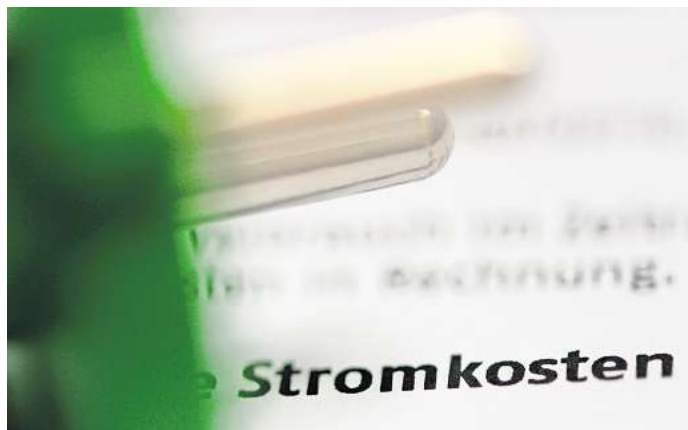
In Deutschland waren im vergangenen Jahr 4,2 Millionen Menschen bei der Zahlung ihrer Strom- und Gasrechnung in Verzug.