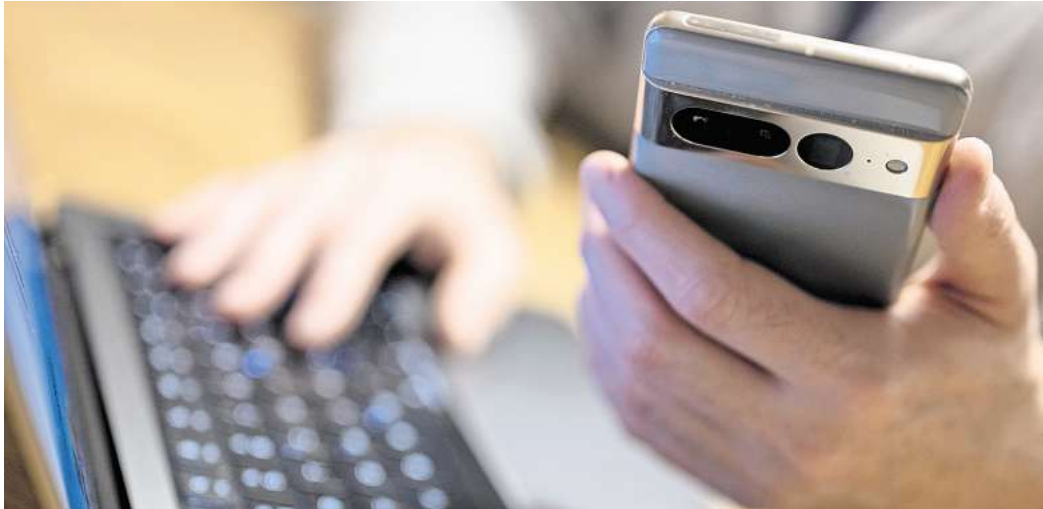
Eine 49-Jährige aus Peine ist im Internet auf Betrüger hereingefallen. Das kommt die Frau nun teuer zu stehen.

Klare Sache: Die Peinerin ist auf Online-Betrüger hereingefallen. Diese dürften mit dem Geld über alle Berge sein, doch zurückerstattet werden muss der gesamte Betrag trotzdem. Und das bleibt jetzt an der 49-Jährigen hängen. „Meine Mandantin ist selbst zum Opfer geworden“, sagte der Rechtsanwalt. Der Peinerin wurde zunächst ein Strafbefehl