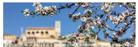
Mandelblüte auf Mallorca

Zur Mandelblüte nach Mallorca 8 Tage ✓ Transfer bis/ab Flughafen Hannover ✓ Flug mit TUIfly Hannover - Palma de Mallorca - Hannover inkl. Flughafensteuern und Sicherheitsgebühren ✓ Transfer Flughafen - Hotel - Flughafen ✓ 7 x Ü/HP im ****Hotel THB El Cid Class direkt am Strand von Can Pastilla im DZ ✓ Informationsveranstaltung inkl. Willkommenscocktail am Anreisetag ✓ Mandelblütenfahrt mit Reiseleitung ✓ deutschsprachige Reisebetreuung während des gesamten Aufenthaltes ✓ durchgehende Reisebegleitung ab/bis Deutschland ✓ Ausflüge Inselrundfahrt; Sineu & Formentor; Drachenhöhlen inkl. Eintritt; Bergdörfer & Olivenöl inkl. Vesper; Stadtführung Palma zubuchbar