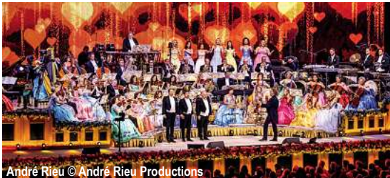
André Rieu

André Rieu - Vorweihnachtlicher Walzerzauber auf der MS Olympia D-MSOLAR Maastricht - André Rieu Konzert - Lüttich - Namur - Dinant 5 Tage ✓ Anreise nach Maastricht und Rückreise ab Dinant im Luxusreisebus ✓ 4 x Übernachtung an Bord ✓ 4 x Frühstücksbuffet an Bord ✓ 3 x Mittagessen als 3-Gang-Menü ✓ 3 x 4-Gang-Abendessen ✓ 1 x Kapitänsdinner (als 5-Gang-Menü) ✓ Kaffee/Tee mit Kuchen und Biskuit ✓ Begrüßungsgetränk ✓ Tägliche Live-Musik ✓ Besuch des Konzerts von Andre Rieu am 14.12.2025 in Maastricht in der Kategorie 1 ✓ Kofferservice ✓ Steuern und Gebühren ✓ Deutschsprachige Reiseleitung an Bord ✓ Ausflugspaket zubuchbar (69,- €)