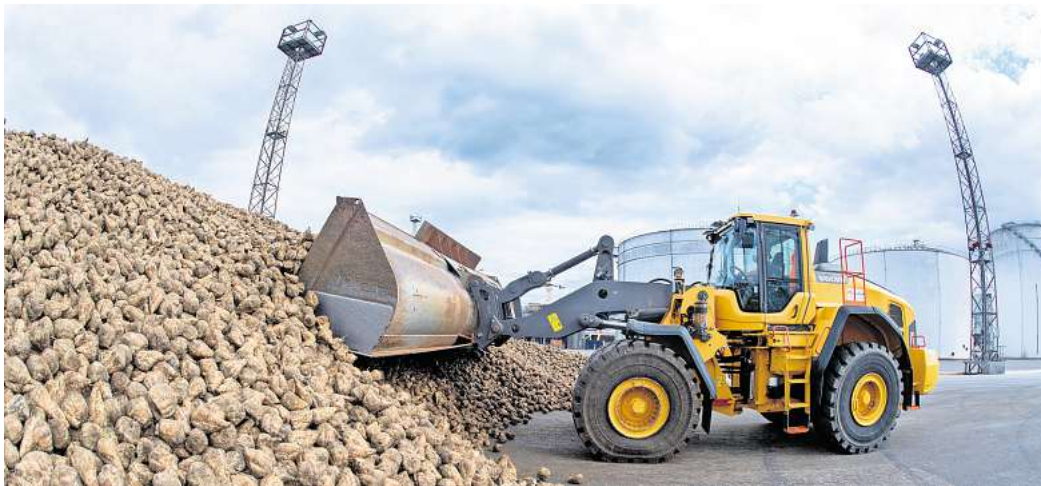
Nordzucker ist auch im Werk Clauen in die diesjährige Zuckerrüben-Kampagne gestartet. Wird es wieder ein Rekordjahr für die Zuckerfabrik in der Gemeinde Hohenhameln?

Für die aktuelle Kampagne setzt die Fabrik auf modernisierte Technik. Ein neuer Dekanteur trennt nun effizient Feststoffe und Flüssigkeiten. Künftig anvisiert sind unter anderem Investitionen in eine neue Verdampfer-