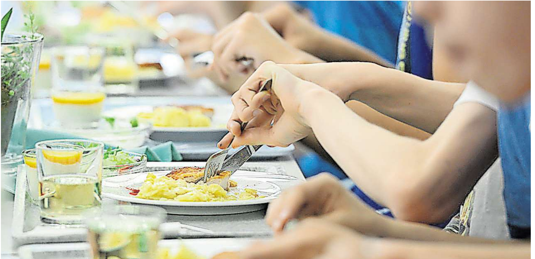
Schüler essen in der Mensa einer Schule ihr Mittag. Das kann sich nicht jede Familie leisten.