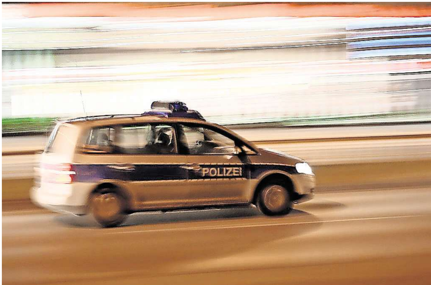
Wegen Ruhestörung sind die Beamten nach Peine ausgerückt. Vor Ort eskalierte die Lage dann. (Symbolbild)

Weitere Mitglieder aus der Gruppe sollen sich dann mit dem 26-Jährigen solidarisiert haben und seien gegenüber den Beamten immer aggressiver geworden. Die Polizisten sahen sich nach eigenen Angaben gezwungen, mit härteren Maßnahmen zu drohen. Schließlich sollen die Beamten die Gruppe aus dem Hausflur