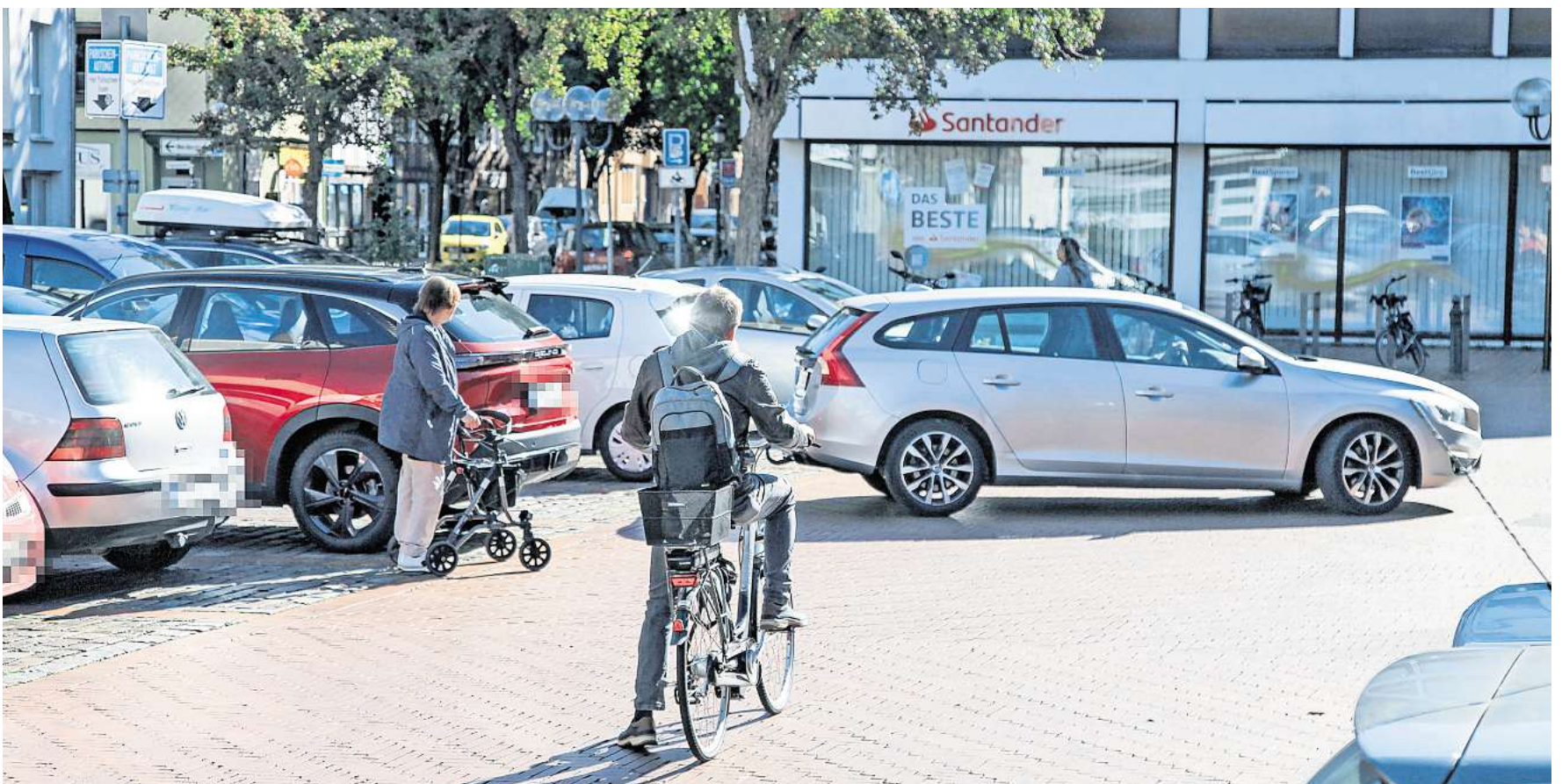
Im Zentrum der Überlegungen stehen die Parkmöglichkeiten am Echernplatz in Peine.

Was sagen Sie zu den Parkgebühren in Peine? Gerechtere oder zu hoch? Schreiben Sie bitte einen Leserbrief (etwa 1.500 Zeichen) an redaktion@paz-online.de .