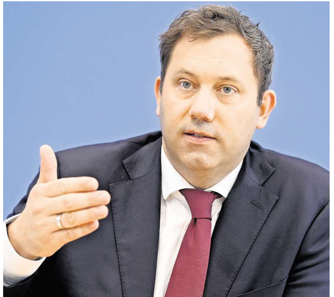
Steht in der Kritik: Der Vizekanzler und SPD-Parteivorsitzende Lars Klingbeil.

Aus dem Schriftwechsel der beiden wird deutlich: Es geht um mehr als nur einzelne politische Maßnahmen. So hatte SPD-Mit-