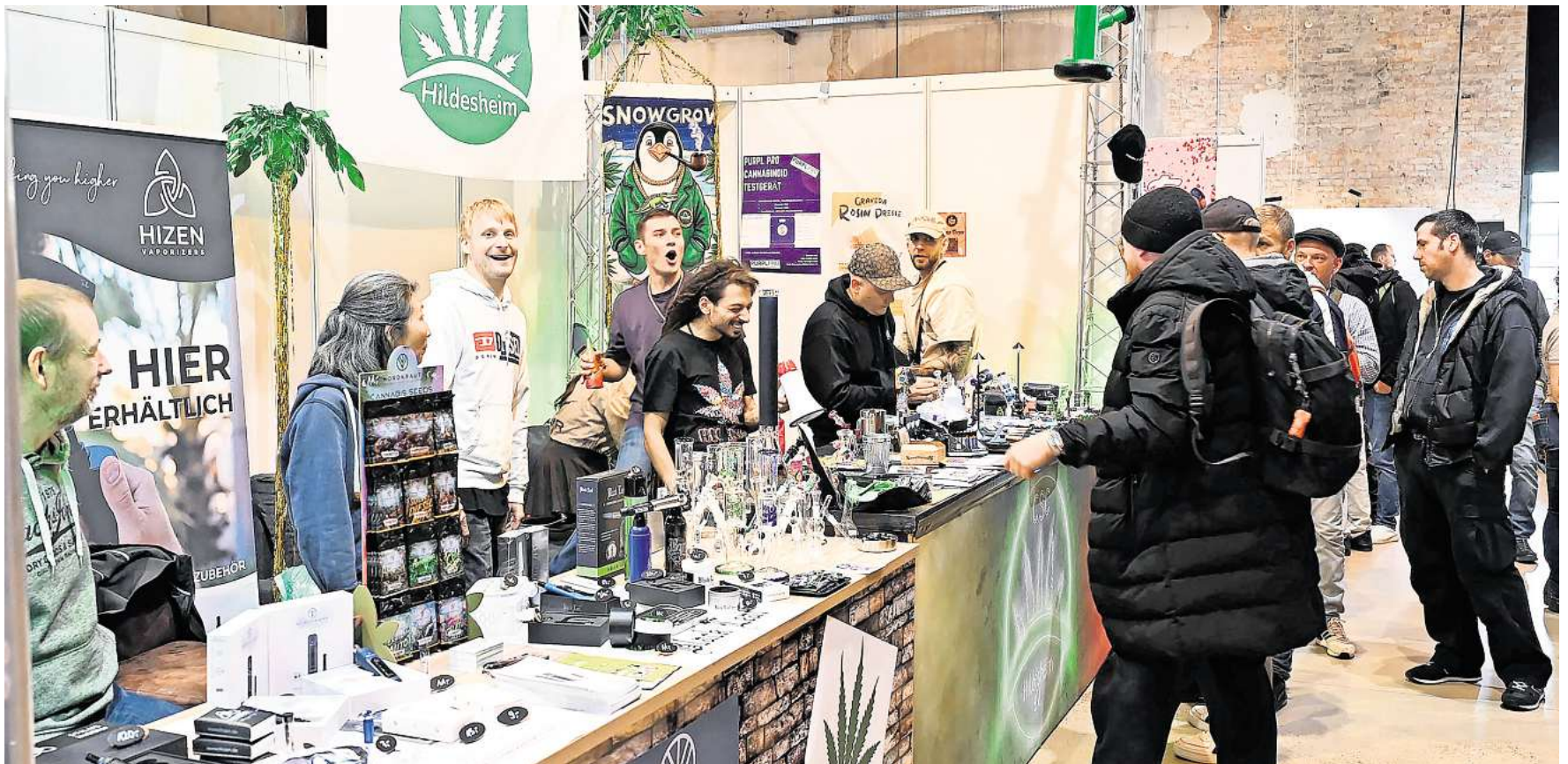
Rund 80 Aussteller sind bei der dritten Auflage von "Cannafriends" in der Gebläsehalle dabei.

Dritte Auflage von „Cannafriends“ in Groß Ilsede - 80 Aussteller aus aller Welt präsentieren Produkte