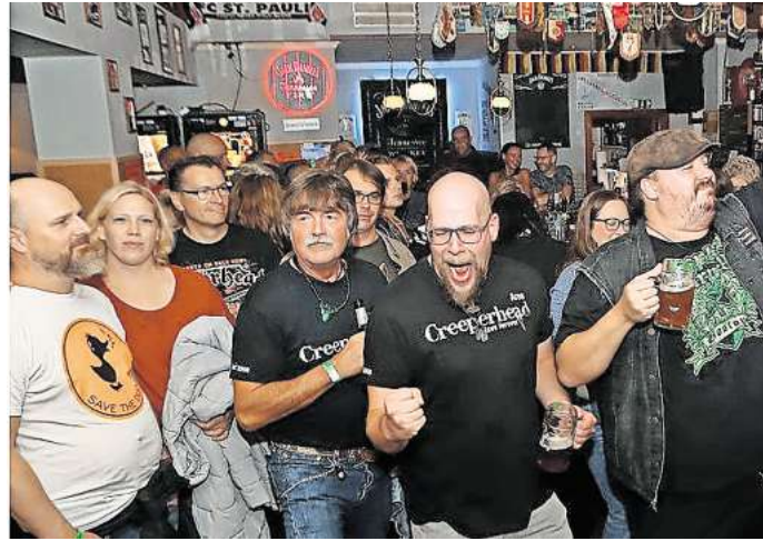
Honky Tonk in Gifhorn: Das Festival mit Livemusik in mehreren Kneipen wird es wohl künftig in der Mühlenstadt nicht mehr geben. Und auch für Wolfsburg und Peine kam jetzt die Absage für 2026.

Auch in Gifhorn haben die Gastronomen laut Brähler bei dem Konzept nicht mehr mitgespielt: „In Gifhorn gab es zum Schluss Gastronomen, die parallel lieber eine eigene Party veranstaltet haben. Sehr schade, da die Stadt Gifhorn uns immer sehr gut unterstützt hat.“ Darum wollte er Anfang des Jahres, als die Veranstaltung für 2025 abgesagt worden war, die Hoffnung noch nicht aufgegeben. Jedoch habe sich kein geeignetes Konzept finden lassen, um das Festival mit seiner rund 20-jährigen Geschichte in Gifhorn wieder aufleben zu lassen. Wie auch in Peine nahm in der Vergangenheit zuerst rund ein Dutzend Gaststätten an der Veranstaltung teil - in der wohl letzten Auflage