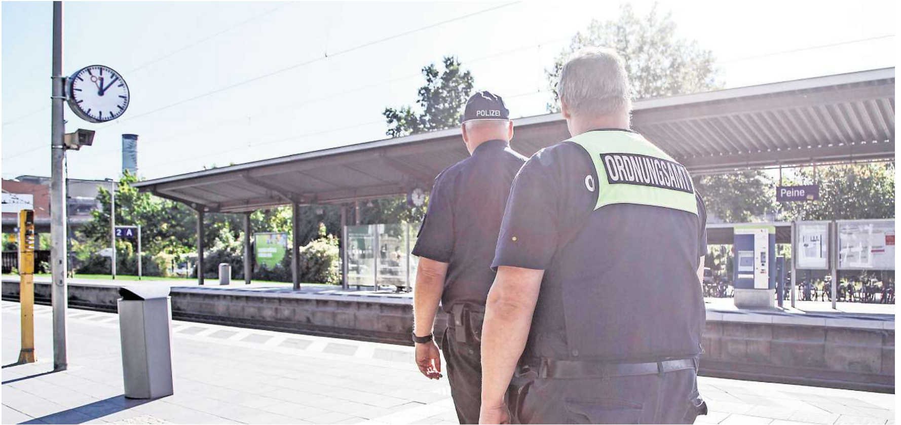
Polizei und Ordnungsamt sind für die Sicherheit am Peiner Bahnhof zuständig.