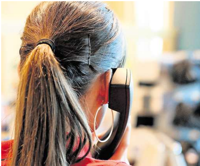
Auch nach Feierabend noch erreichbar – Für viele Beschäftigte endet der Arbeitstag nicht mit dem Verlassen des Büros.

In Australien gibt seit letztem Jahr ein Gesetz, dass Millionen