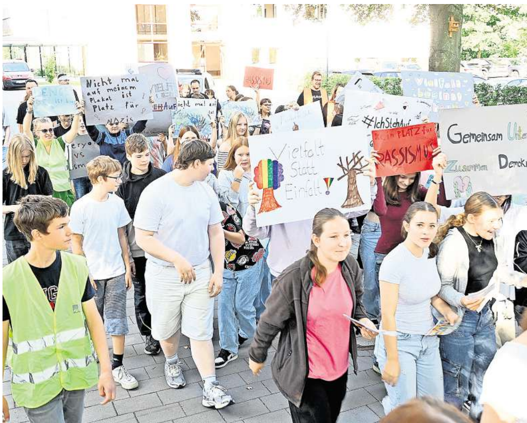
Die Lengeder IGS-Schüler demonstrieren für Demokratie und gegen Rassismus.

Auch weiterhin wollen sich die Schüler der IGS Lengede für Demokratie in der Öffentlichkeit einsetzen. „Wenn alles klappt, wie geplant, darf sich Lengede zukünftig auf regelmäßige Demonstrationen von Schülern der IGS freuen. Die Schüler werden für demokratische Grundwerte und Toleranz auf die Straße gehen, um sich dafür starkzumachen, dass ihre Zukunft und unsere Gesellschaft eine demokratische bleibt“, kündigt die Schule an.