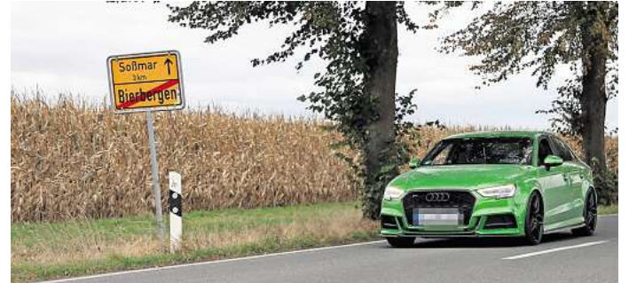
Der Ortseingang von Bierbergen in Richtung Soßmar. Zufällig fährt gerade ein ähnliches Auto wie das Fluchtfahrzeug vorbei. Der Unfallverursacher konnte jedoch noch immer nicht ermittelt werden.

Während die Diskussion um Sicherheit und Verantwortung weitergeht, bleibt der entscheidende Punkt aber ungelöst: Wer saß am Steuer des neongrünen Audis? Und warum konnte der Fahrer oder die Fahrerin bis heute nicht ermittelt werden?