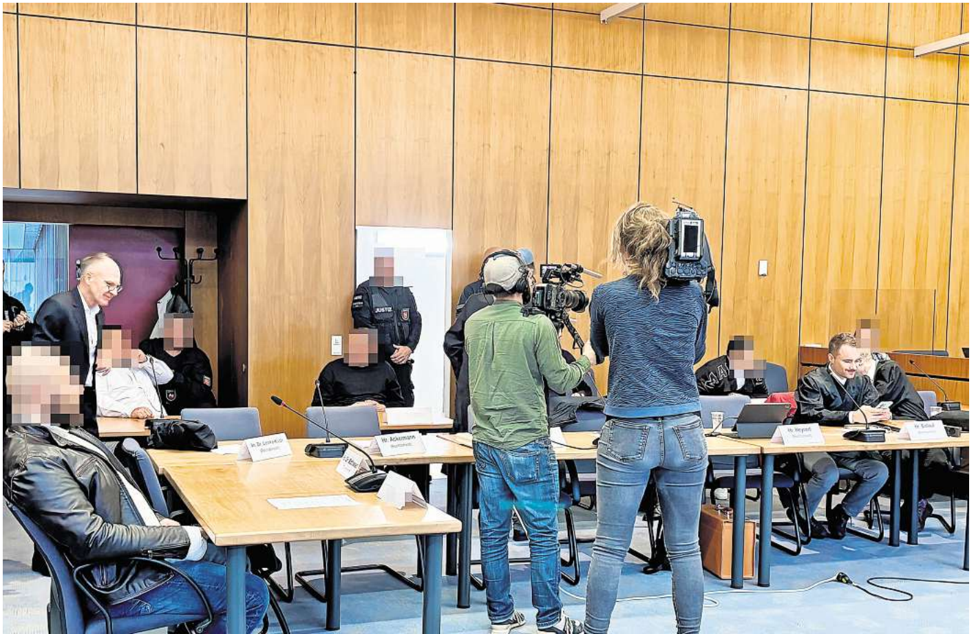
Die Angeklagten im Brandanschlags Prozess vor dem Landgericht Hildesheim warten auf das Urteil. Der Prozess stieß bei verschiedenen Medien auf Interesse.

Als der Bauunternehmer zu seinen Schlussworten ansetzte, verließen Mitglieder der Opferfamilie demonstrativ den Gerichtssaal. Niemals habe er einen Mord oder Brandanschlag in Auftrag gegeben, beteuert er. Das Geschehen bedauere er. Die 16 Monate Untersuchungshaft hätten ihm