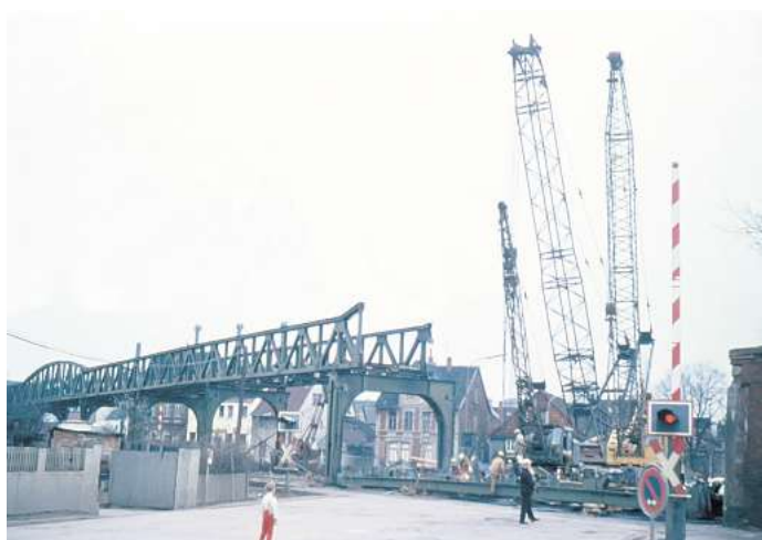
Kalender: Eine Ansicht aus der Wiesenstraße an der Ecke zur Ilse-der Straße.

Das Titelblatt zeigt einen Blick in die Hagenstraße des Jahres 1965.