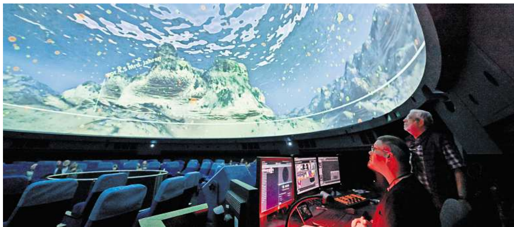
Auch das Planetarium in Wolfsburg hat während der Herbstferien geöffnet.

• Im Kreismuseum Peine wartet eine echte Überraschung: Im Museum sind nämlich zehn besondere Schätze verborgen, die darauf warten, mithilfe von Karten und Rätseln entdeckt zu werden. Diese Schätze mögen nicht aus Gold und Silber bestehen, aber sie sind dennoch