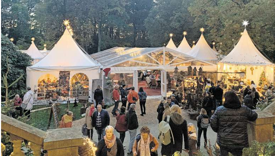
„Winterträume“ auf Schloss Eldingen: hallo Wochenende verlost Freikarten für das Festival.

Eldingen. Bereits zum 14. Mal findet auch in diesem Jahr wieder das Winterfestival „Winterträume“ auf Schloss Eldingen statt. Vom 30. Oktober bis zum 2. November wird das imposante historische Herrenhaus mitsamt seiner romantischen Parkanlage für den Publikumsverkehr geöffnet, damit hier wieder internationale Aussteller anspruchsvoller Wohnkultur, Kunst und Design, Antiquitäten, Schmuck, Landhausmoden und die schönsten Winterdekorationen aus aller Welt präsentiert werden können.