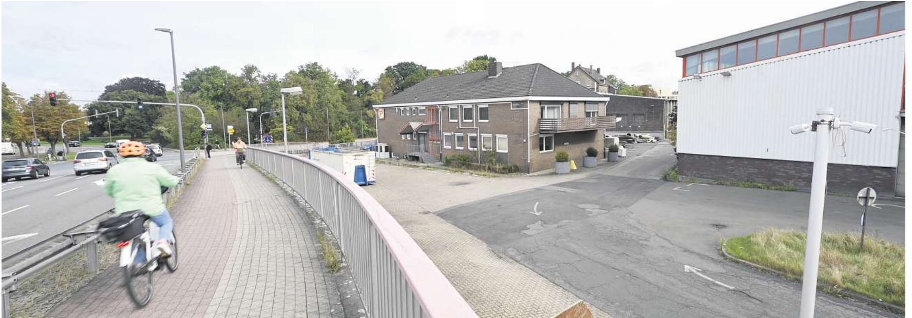
Blick auf das Peiner PUT-Gelände von der Nord-Süd-Brücke aus.