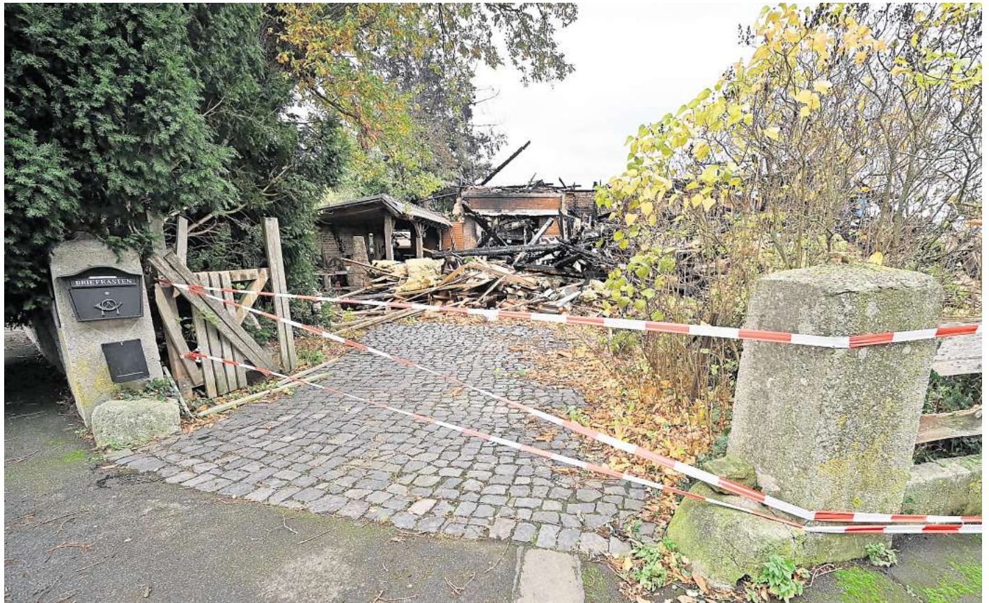
Nach dem verheerenden Feuer in Blumenhagen blieb vom Fachwerkhaus nur noch ein verkohlter Haufen Holz übrig.