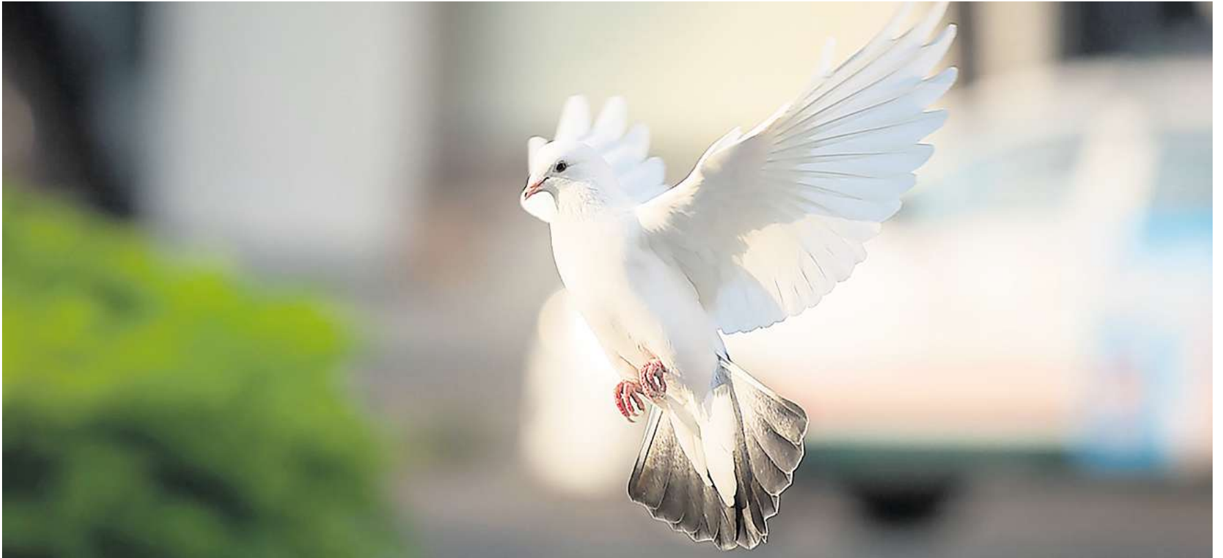
Weißer Tauben bei Hochzeiten fliegen zu lassen, ist beliebt. Tierschützer kritisieren diesen Brauch, der einem Todesurteil gleichkommt.