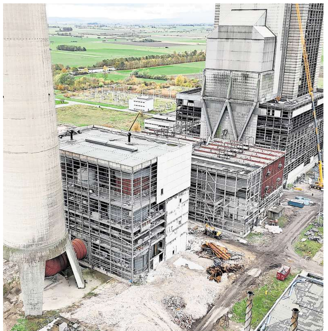
Der Rückbau des Kraftwerks Mehrum geht weiter: Nachdem fast alle asbesthaltigen Fassadenplatten entfernt wurden, sind Stahlgerippe zu sehen.