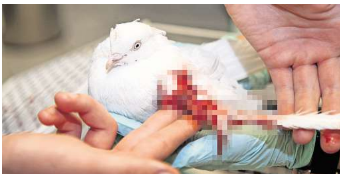
Zertrümmerter Flügel und viel Blut: In der Kleintierpraxis Schmidt wird versucht, dem Tier zu helfen. Am Ende muss es wohl eingeschläfert werden. Das Tier ist laut Taubenzüchter keine Brieftaubenart. Die Kritik an unseriösen Geschäften und Tierquälerei trifft hier voll zu.

Wie sehen Sie das? Ist das Aufsteigenlassen weißer Tauben noch zeitgemäß oder ein überholtes Ritual auf Kosten der Tiere? Schreiben Sie uns Ihre Meinung (etwa 1.500 Zeichen) an redaktion@paz-online.de und bringen Sie sich in die Diskussion ein.