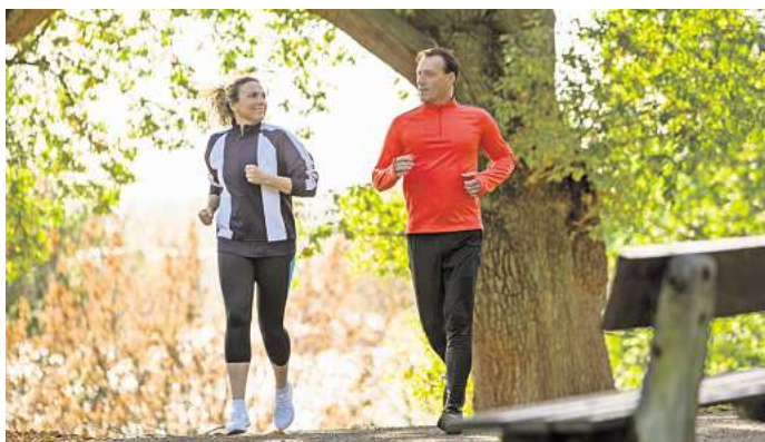
Für die Gesundheit: Eine Frau und ein Mann joggen in einem Park.