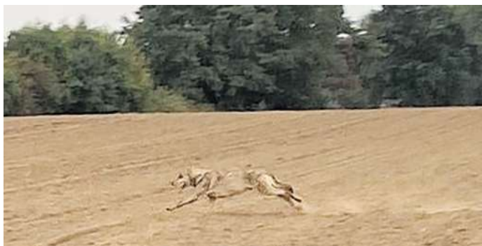
Diese Aufnahme machte eine Spaziergängerin bei Abbensen: Darauf jagt ein Wolf im hohen Galopp über ein Feld.