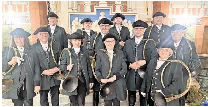
Pflegt die Tradition: Das Parforcehorncorps „Die Jagdfanfane“ begleitet die Hubertusmesse der Jägerschaft Peine.

Der Altarbereich wird besonders dekoriert – organisiert von