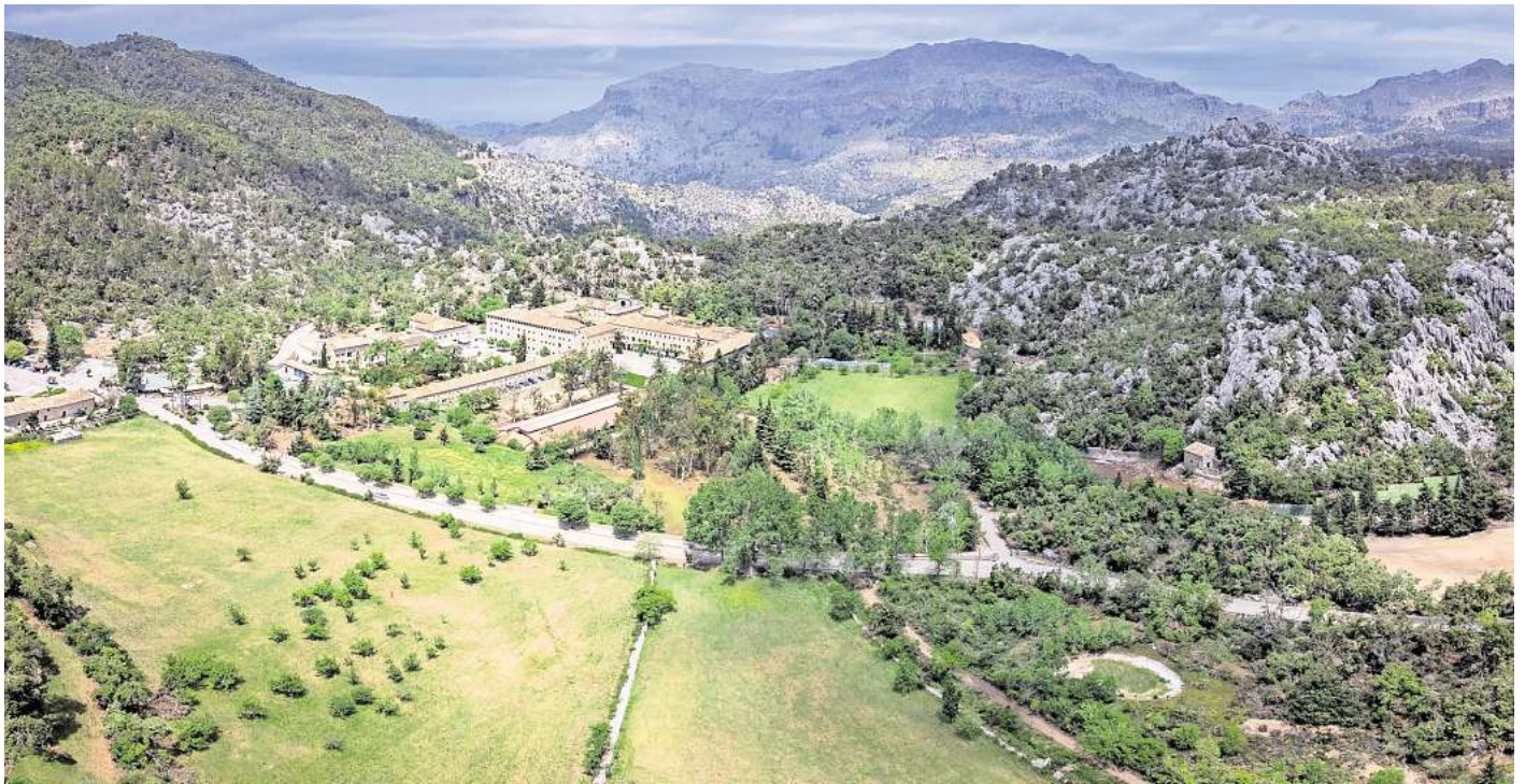
Am Heiligtum von Lluc soll der neue Jakobsweg auf Mallorca beginnen.