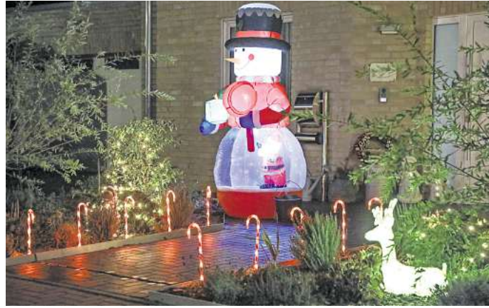
Weihnachtliche Stimmung – Die Dekoration sorgt für Vorfreude auf die Festtage.

Wer in den eigenen vier Wänden dekoriert, darf dies aber nach eigenem Ermessen tun. Das gilt sowohl für das Aufstellen eines Weihnachtsbaumes als auch für Lichterketten oder