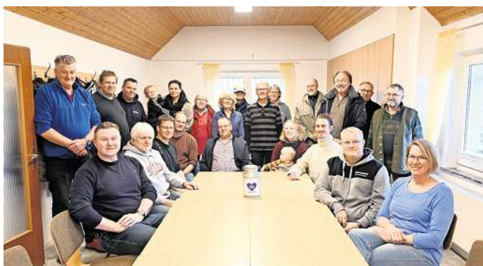
Wegen des schlechten Wetters fand der Sternmarsch nicht statt. Die Teilnehmenden blieben im Trockenen.