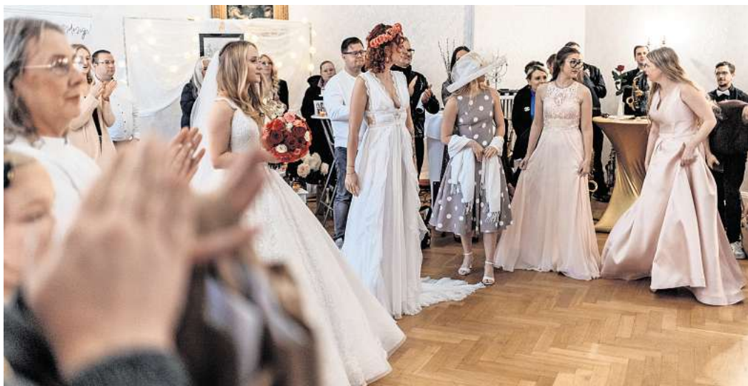
Die Messe bietet jede Menge Inspiration.