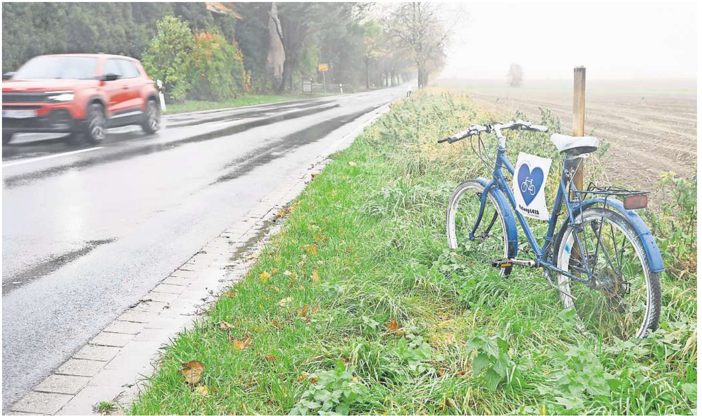
Zwischen Adenstedt und Solschen kommt es aufgrund des fehlenden Radweges immer wieder zu gefährlichen Situationen für Fahrradfahrer. Mehrere abgestellte Räder am Straßenrand sollen darauf hinweisen.

Für die Gemeinde Ilsede sei der Radweg an der L413 ein wichtiges Projekt, das sie unterstütze, so Neuhäuser. Denn „Adenstedt und Solschen haben traditionell immer eine sehr enge Verbindung“, sowohl familiär als auch im Sport- und Vereinsbereich. Es herrsche